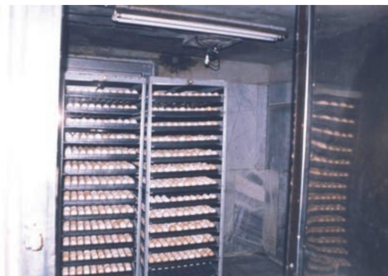
تصویر ۲-۳- تخم‌مرغ‌ها در اتاق دود

مقادیر فرمالین و پرمنگنات پتاسیم ذکر شده در جدول برای ۲/۸ متر مکعب فضاست.