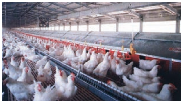
تصویر ۳-۷- لانه‌ی تخم‌گذاری اتوماتیک