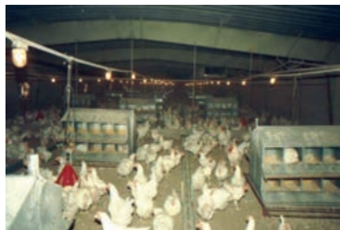
تصویر ۸-۳- استفاده از لانه‌ی مرغداری به تعداد کافی

این افراد برای ورود باید لباس خود را تعویض کنند و پس از گرفتن دوش و پوشیدن لباس کار، با چکمه‌های خود از داخل ماده‌ی ضدعفونی‌کننده عبور نمایند. کارکنان واحد جوجه‌کشی نباید در مرغداری‌ها شاغل باشند و یا در خانه‌ی خود از پرندنگهداری کنند. هم‌چنین برای رعایت بهداشت فردی باید به‌طور منظم به پزشک مراجعه کنند.