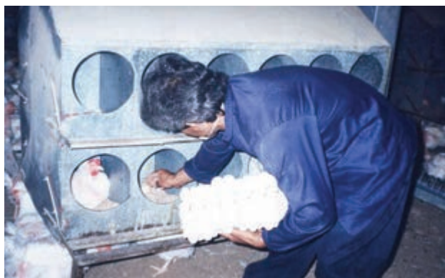
تصویر ۳-۶- جمع‌آوری دستی تخم مرغ