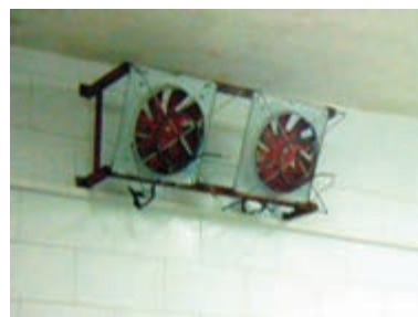
تصویر ۳-۵- ایجاد جریان هوا در اتاق دود