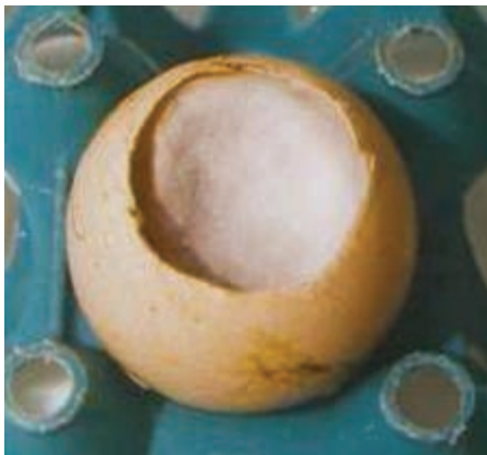
تصویر ۱-۳- آلودگی قارچی

بیماری‌ها و تلفات در چند روز اول، بعد از خروج جوجه از تخم مرغ، نیز اغلب با فساد باکتریایی ارتباط دارند. هم‌چنین فساد باکتریایی سبب کاهش میزان جوجه درآوری است. بنابراین، تخم مرغ‌های جوجه‌کشی که به شدت به میکرب‌ها آلوده‌اند، مشکلات زیادی در واحدهای جوجه‌کشی ایجاد می‌نمایند. از این رو لازم است در ابتدای ورود تخم مرغ‌ها به واحد جوجه‌کشی به اتاق‌های گاز انتقال یابند و ضدعفونی شوند.