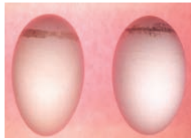
تصویر ۳-۴- تأثیر پرمنگنات زیاد بر روی تخم مرغ

برخی آلودگی‌های میکروبی مربوط به قبل از ورود تخم مرغ به جوجه کشی است و مقابله با آن‌ها در جوجه کشی غیرممکن است. یکی از خطرناک‌ترین این آلودگی‌ها باکتری سالمونلاست. این باکتری می‌تواند در پوسته‌ی تخم مرغ نفوذ کند و در مراحل جوجه کشی با وجود ضدعفونی‌شدن باقی بماند و بیماری را در جوجه‌های تولیدشده ایجاد کند. به این لحاظ رعایت بهداشت تخم مرغ در گله‌ی مادر اهمیت زیادی دارد. تلاش کنید فاصله‌ی تخم‌گذاری تا جمع‌آوری تخم مرغ‌ها طولانی نشود. در سیستم‌های دستی، جمع‌آوری روزانه‌ی تخم مرغ‌ها را ۳ تا ۵ بار در فصل سرد و ۶ تا ۷ بار در فصل گرم اجرا کنید و یا از سیستم‌های جمع‌آوری اتوماتیک تخم مرغ استفاده کنید.