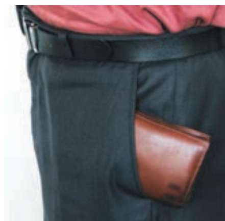
شکل ۱-۷- مراقبت از کیف خود

▲ هنگام خرید قطعات، قیمت‌ها را از چند محل سؤال کنید تا بتوانید قطعات را با بهترین کیفیت و مناسب‌ترین قیمت خریداری نمایید، در ضمن همواره در کلیه‌ی شرایط مراقب کیف پول خود باشید (شکل ۱-۷).