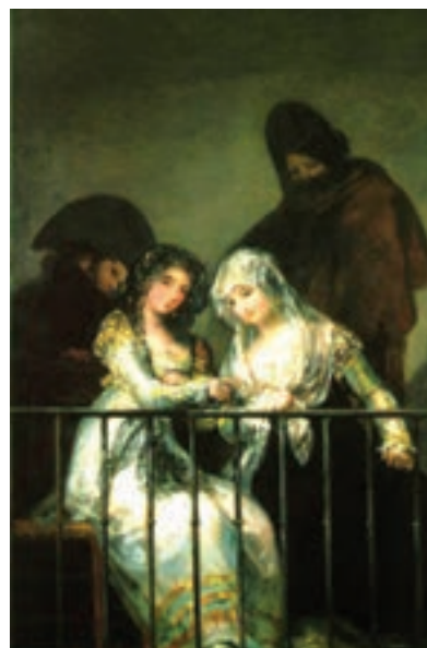
تصویر ۱۲- زنان در بالکن، اثر فرانسیسکو گویا، ۱۸۱۵-۱۸۱۰ میلادی، رنگ و روغن روی بوم، موزه هنر متروپولیتن، نیویورک

دومیه ۲ نیز با تکنیک چاپ سنگی مقدار زیادی کاریکاتورهای اجتماعی و سیاسی برای چاپ در مجلات و روزنامه‌ها ساخت (تصویر ۱۳). میله ۳ (میله) نقاشی است که تمایلات هر دو مکتب واقع‌گرایی و رمانتیک را در آثارش می‌توان دید (تصویر ۱۴).