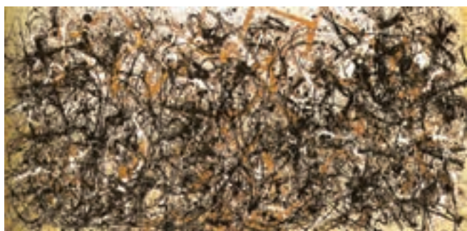
تصویر ۱۳- اکسپرسیونیسم انتزاعی، اثر جکسون پولاک، ۱۹۵۰ میلادی، رنگ و روغن و رنگ لعابی روی بوم بدون آستر، موزه هنر مدرن، نیویورک

نوعی نقاشی عاری از تصویر و فاقد شکل‌های بنیادی (مانند اشکال هندسی) و روشی خودانگیخته و پویا و قلمزنی آزاد به‌شمار می‌رود. نقاشی‌های پولاک ۲ بیان‌گر این شیوه است. نقاشی‌های او بازتابی از شرایط کلی زندگی بی‌قرار انسان غربی پس از تجربه دو جنگ جهانی است (تصویر ۱۳). از نظر او و همه هنرمندان اکسپرسیونیست انتزاع‌گرا، اثر هنری نتیجه عمل مهارنشده هنرمند است و هیچ مضمونی را بیان نمی‌کند. اکسپرسیونیسم انتزاعی نخستین جنبش هنری مهم در سال‌های بعد از جنگ جهانی دوم و اصیل‌ترین و متمایزترین دستاورد تاریخ هنر آمریکا دانسته شده است.