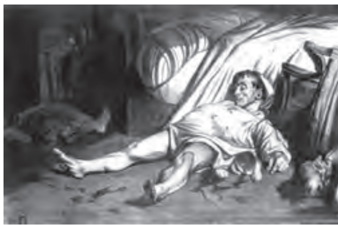
تصویر ۱۳- خیابان ترانسنون، اثر اونوره دومیه، ۱۸۳۴، گراور، ۴۵×۳۰ سانتی متر، موزه هنری فیلادلفیا