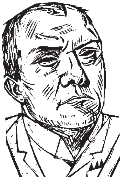
تصویر ۱۲- تک‌چهره خود هنرمند (باسمه)، اثر ماکس بکمان، نئورئالیسم دهه ۱۹۲۰

درآلمان پس از جنگ اول جهانی، آشفته‌گی اجتماعی و سیاسی به اوج می‌رسد. نسل جنگ سعی می‌کند با تیزبینی بر تباهی اخلاقی و بینوایی اجتماعی انگشت بگذارد. چنین بینشی فقط می‌تواند با نوعی واقعگرایی تند و گزنده بیان شود. پس هنر به سلاح حمله و دفاع و وسیله‌ای برای نقد و تبلیغ بدل می‌شود. به این ترتیب شکل‌های مختلف واقع‌نمایی به‌عنوان واکنشی منفی در برابر انتزاع شکل می‌گیرد. «بکمان» ۳ مفهومی نوین از واقعگرایی را مطرح کرد. او سبک‌های مختلفی را در زندگی تجربه نمود. برای بکمان هیچ چیز مهمتر از بازنمایی و محتوا نبود. پرده‌های او در نقطه مقابل هنر تزئینی یا «نقاشی برای نقاشی» قرار دارند. در آثار او انسان، موقعیت او و حالات ذهنی‌اش با واقعیت تمام در برابر تماشاگر ظاهر شده‌اند (تصویر ۱۲).