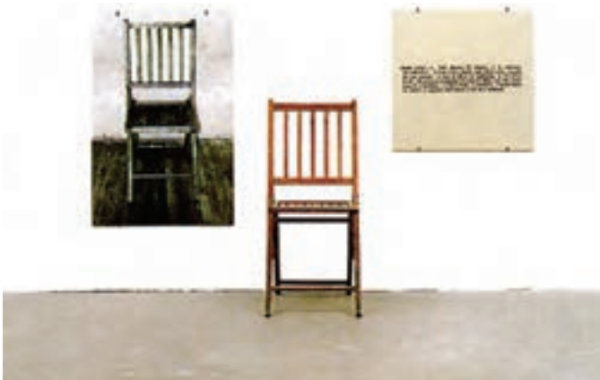
تصویر ۱۵- هنر مفهومی، یک و سه صندلی اثر جوزف کازوت، ۱۹۶۵

شکل‌های جدید هنر: از سوی دیگر محیط ۲ ، چیدمان ۳ و اجرای نمایشی ۴ و تمام جاذبه‌های هنری مستتر در این سه عنصر توجه هنرمندان را به خود جلب کرد. امروزه فعالیت‌های نمایش گونه و ژست‌های اجتماعی، رخداد هنری تلقی می‌شوند. هنر جدید در اشکال هنرچیدمان، هنر ویدئو، هنر عکس و هنر محیطی ظاهر شده است (تصویر ۱۷).