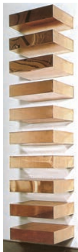
تصویر ۱۴- بدون عنوان، اثر دانالد جاد (Judd)، ۱۹۶۵، فلز، مینیمال گالری لئوکاستلی، نیویورک، آمریکا

این جنبش در دهه ۱۹۶۰ در شهر نیویورک شکل یافت و نامش را از فرهنگ مردم گرفت. علایق هنرمندان پاپ به فرهنگ جمعی، آنان را بیشتر به خلق تابلوهای پرزرق و برق با مفاهیم سیاسی، اجتماعی و حتی اخلاقی رهنمون ساخت. فیلم‌ها و آگهی‌های تبلیغاتی، داستان‌های شبه علمی، موسیقی پاپ، حروف و علائم متداول، اشیای روزمره و کالاهای مصرفی، ابزار و موضوع این هنر جدید شدند. لیختن اشتاین ۴ از هنرمندان این شیوه است.