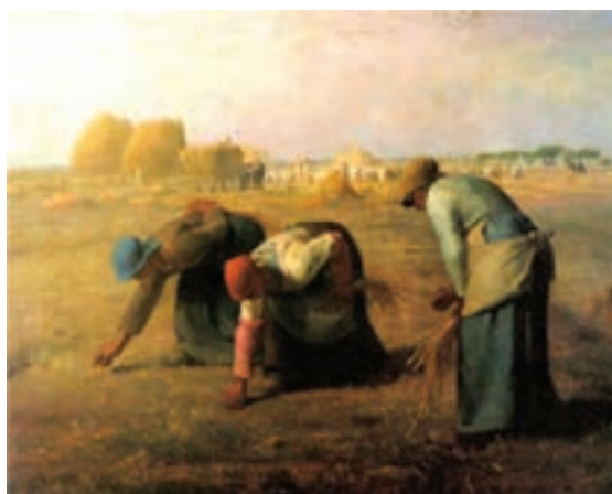
تصویر ۱۴- خوشه چینان، اثر ژان فرانسوا میله، ۱۸۵۷ میلادی، رنگ و روغن روی بوم، موزه اورس، پاریس