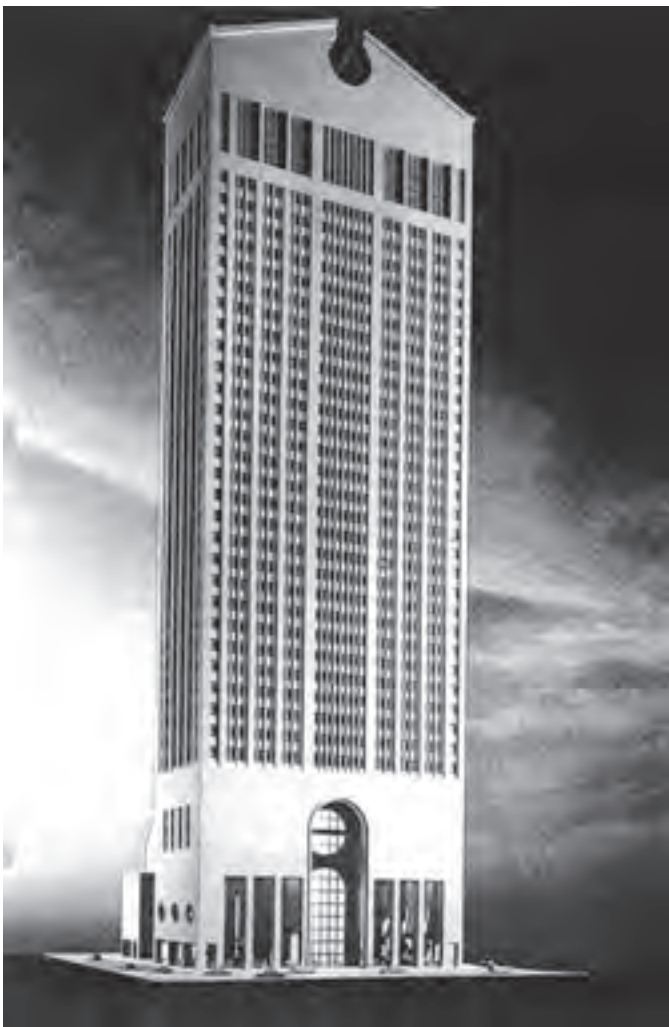
تصویر ۱۶- معماری پست مدرن، ساختمان سونی، اثر فیلیپ جانسون ۱۹۸۳، نیویورک (یادآور کمد قدیمی)