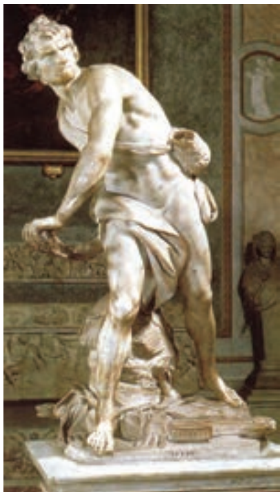
تصویر ۶- داوود در حال پرتاب سنگ به سمت جالوت، اثر برنینی، سنگ مرمر، سال ۱۶۲۳ میلادی، روم (مقایسه کنید با داوود میکلا آنژ)

تندیس‌سازی باروک نیز همانند نقاشی بسیار زنده، پرشور و چشمگیر است و بیان‌گر تلاش هنرمند در ارائه احساسات عمیق انسان است و تلاش دارد واکنش تماشاگر را برانگیزد (تصویر ۵). تندیس داوود در حال پرتاب سنگ به جالوت اثر برنینی سرشار از بیان احساس، تحرک و پویایی است (تصویر ۶).