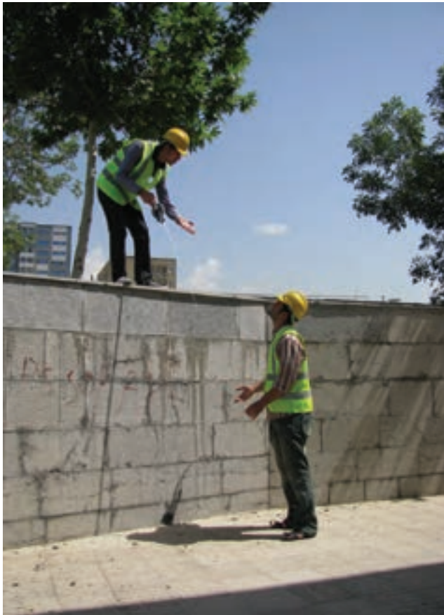
شکل ۹-۲. اختلاف ارتفاع چه قدر است؟

منظور از ارتفاع، اختلاف ارتفاع بالا تا پایین عارضه است. مثلاً بالا تا پایین پله