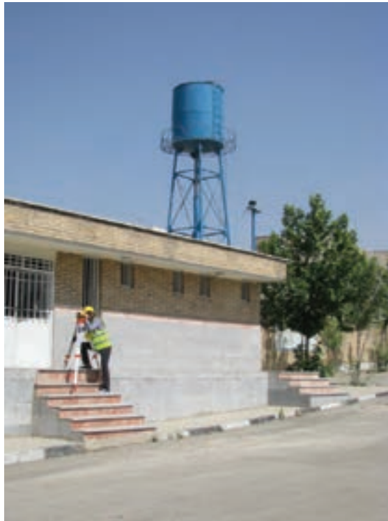
شکل ۹ - ۱ . اختلاف ارتفاع چه قدر است؟