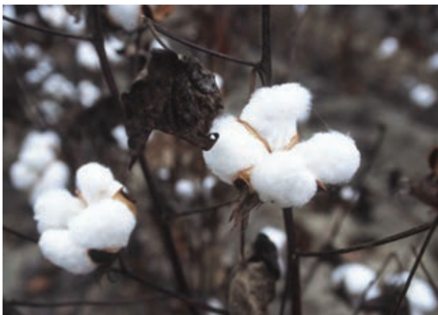
شکل ۱-۶- گیاه پنبه