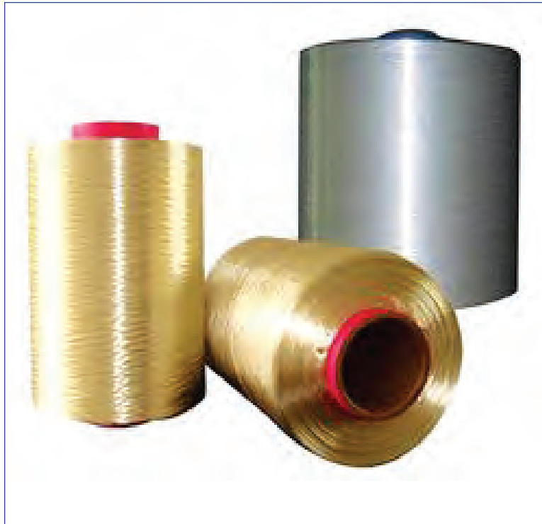
شکل ۹-۶- نمونه‌ای از الیاف نایلون

پرمصرف‌ترین انواع نایلون در صنایع با نام‌های نایلون ۶ و نایلون ۶۶ شناخته می‌شوند. ماده اصلی نایلون ۶ کاپرولاکتام است و از ترکیبات نفتی به دست می‌آید. در حالی که نایلون ۶۶ که همان نایلون معمولی است از ترکیب هگزامتیلن دی‌آمین و اسید آدیپیک به دست می‌آید. تفاوت عمده نایلون ۶ از نایلون ۶۶ پایین‌تر بودن نقطه ذوب آن است.