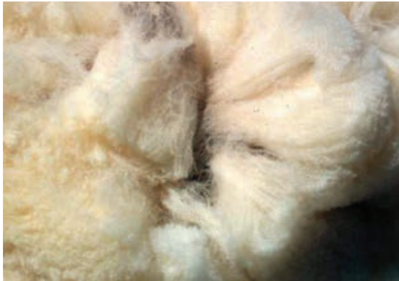
شکل ۵-۶- الیاف پشم خام

کمی پشم گلوله شده یا پارچه پشمی خالص یا نخ پشمی را به وسیله پنس به شعله چراغ آزمایشگاهی نزدیک کنید. در این صورت، پشم می‌سوزد و از شعله دور می‌شود. پشم در هنگام سوختن بوی گوگرد سوخته می‌دهد و آن چه از آن باقی می‌ماند به سادگی خرد می‌شود و به یک پودر سیاه رنگ تبدیل می‌گردد.