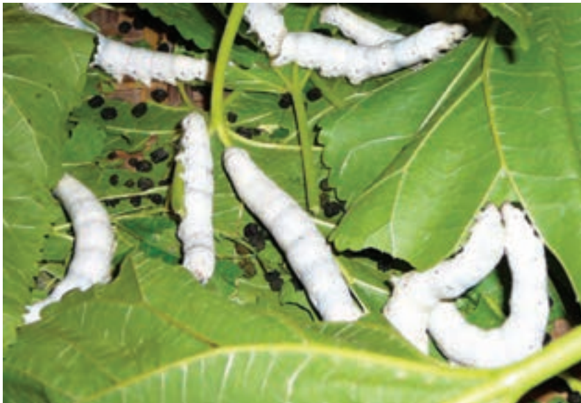
شکل ۶-۶- کرم ابریشم، منشأ تولید ابریشم

از دیاد طولی ابریشم به میزان ۲۵-۳۵ درصد است. حالت کشسانی و ارتجاعی آن بیشتر از الیاف پنبه و کمتر از الیاف پشم است. ابریشم تا ۳۵ درصد وزن خود را آب جذب می‌کند و مقاومت آن در برابر حرارت بیشتر از پشم است. ابریشم تا دمای ۱۴۰ درجه سلسیوس را تحمل می‌کند و در دمای ۱۷۵ درجه سلسیوس تجزیه می‌شود.