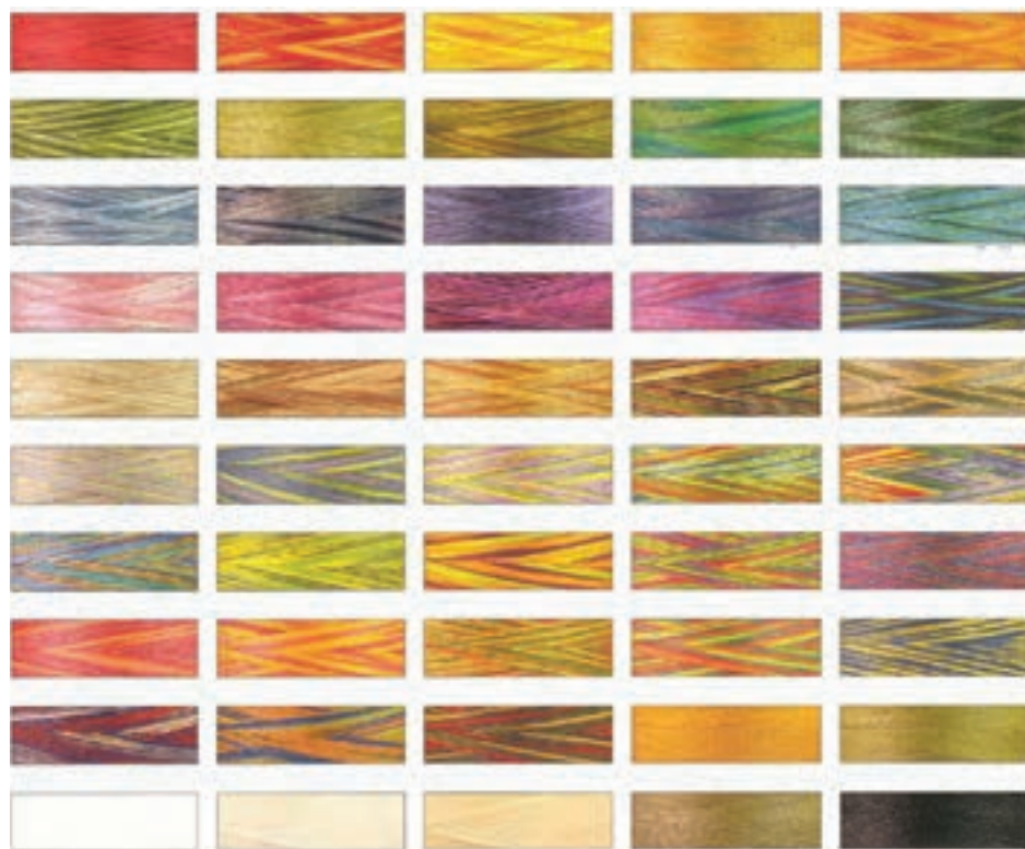
شکل ۳-۶- مجموعه رنگ آمیزی موسوم به «مصری» روی نخ مرسه ریزه که نشان دهنده قدرت جذب رنگ این نوع نخ می باشد.