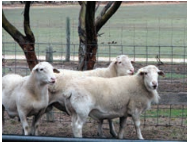
شکل ۴-۶- گوسفند مریнос، یکی از منابع تولید پشم سفید

قدرت جذب آب در پشم از سایر الیاف بیشتر است و در شرایط محیطی به راحتی آب خود را از دست می‌دهد، ولی در شرایط معمولی (آزمایشگاهی) ۱۶ تا ۱۸ درصد وزنی، رطوبت خود را حفظ می‌کند. پشم از مواد پروتئینی، آلومین، ماده شاخی کراتین (شبيه مو و استخوان) ساخته شده است. در ساختمان پشم به مقادیر متفاوتی گوگرد وجود دارد که باعث بهبود استحکام و شکل ظاهری پشم می‌شود. به همراه پشم مقادیری چربی و رطوبت نیز وجود دارد.