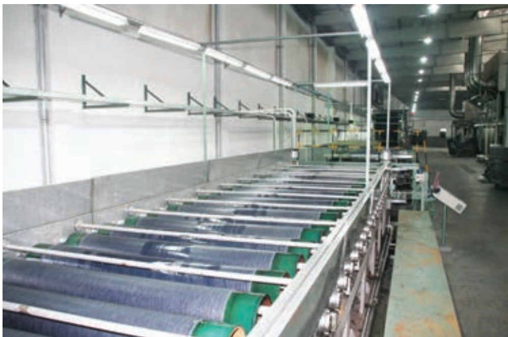
شکل ۲-۶- کارخانه تولید نخ مرسه ریزه