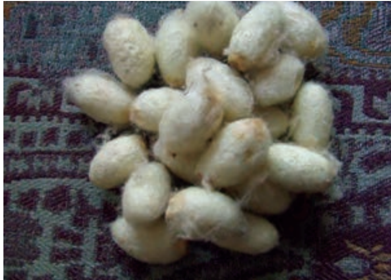
شکل ۸-۶- پيله گرم ابريشم

دو گرم ابریشم خالص را در لوله آزمایش قرار دهید و با قطره چکان سولفوریک اسید غلیظ بر روی آن بریزید. ابریشم در سولفوریک اسید حل می‌شود، آزمایش را با هیدروکلریک اسید غلیظ و با کمک شعله چراغ تکرار کنید، ابریشم حل خواهد شد، آزمایش را برای بار سوم با استیک اسید غلیظ و گرم انجام دهید، ابریشم حل نخواهد شد.