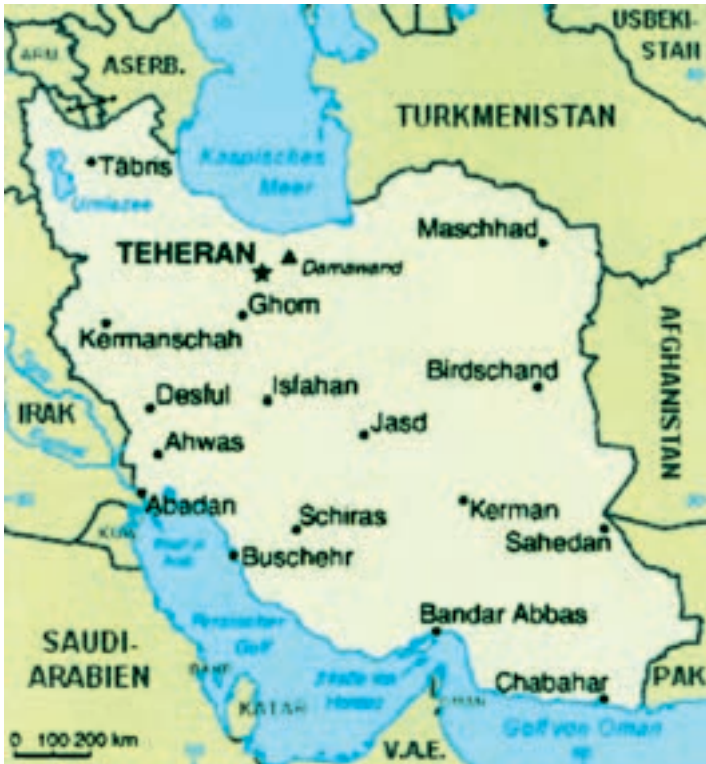
Die islamische Republik, Iran