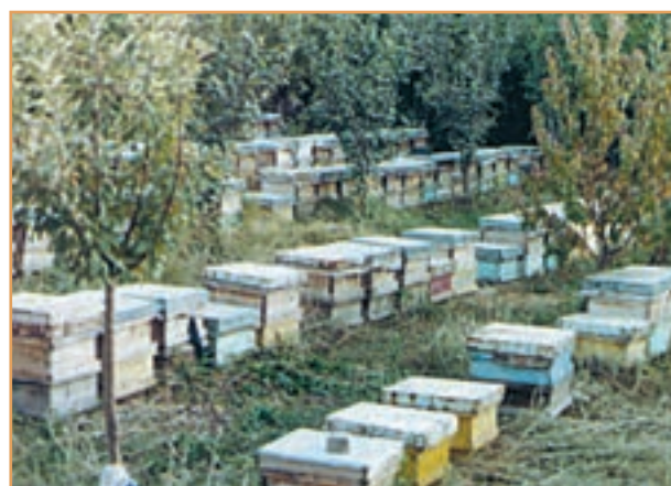
شکل ۴۵-۲- زنبورداری - استان زنجان

منابع درآمد روستاییان در برخی از تعاریف در مورد روستا، آمده است: روستا محلی است که فعالیت اغلب ساکنان آن وابسته به زمین باشد، مانند کشت و زرع، اکثر روستاییان ما به کشاورزی اشتغال دارند. معمولاً روستاییان علاوه بر کار زراعت و باغداری تعدادی دام نیز پرورش می‌دهند، و از فراورده‌های آن استفاده می‌کنند. برخی روستاییان چنانچه شرایط محیطی فراهم باشد به پرورش زنبور عسل نیز می‌پردازند.