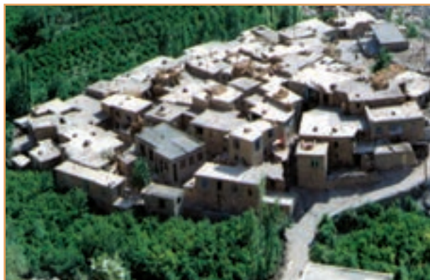
شکل ۳۷-۲- روستای متمرکز

روستاهایی که در امتداد یک رود شکل گرفته‌اند به روستاهای طولی معروف‌اند. در مناطق کوهستانی کشور ممکن