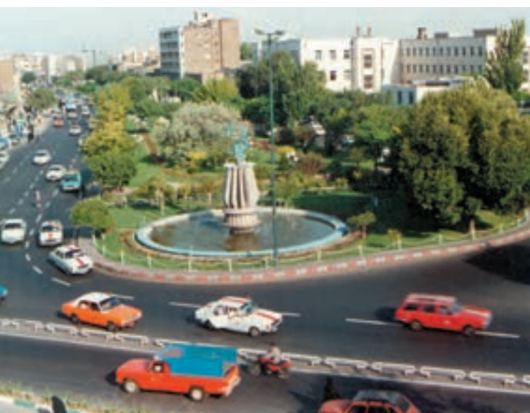
شکل ۵۲-۲- میدان شهدای تبریز در منطقه کوهستانی

کنار رودهای پرآب تأسیس شده و توسعه یافته اند؛ مانند اصفهان. ۲- ناهمواری : ویژگی های طبیعی از جمله ناهمواری و ارتفاع از عوامل مهم در استقرار و توسعه شهرهای ایران بوده اند. به جدول ۵۱-۲ توجه کنید.