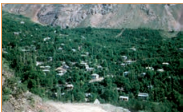
شکل ۳۹-۲- شکل‌گیری روستاهای طولی در امتداد رودخانه