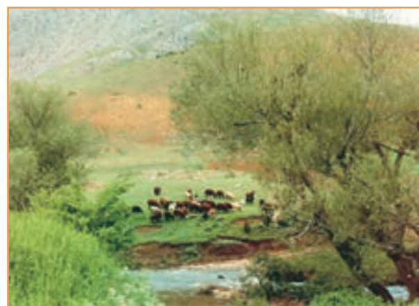
شکل ۴۴-۲- دامداری

صنایع دستی از دیگر فعالیت‌های اقتصادی روستاییان کشور ماست. فعالیت دامپروری زمینه صنعت قالی بافی را ایجاد می‌کند. روستاییان نواحی شمالی کشور با بهره‌گیری از چوب گیاهان و درختان به ساخت وسایل گوناگون حصیری و چوبی