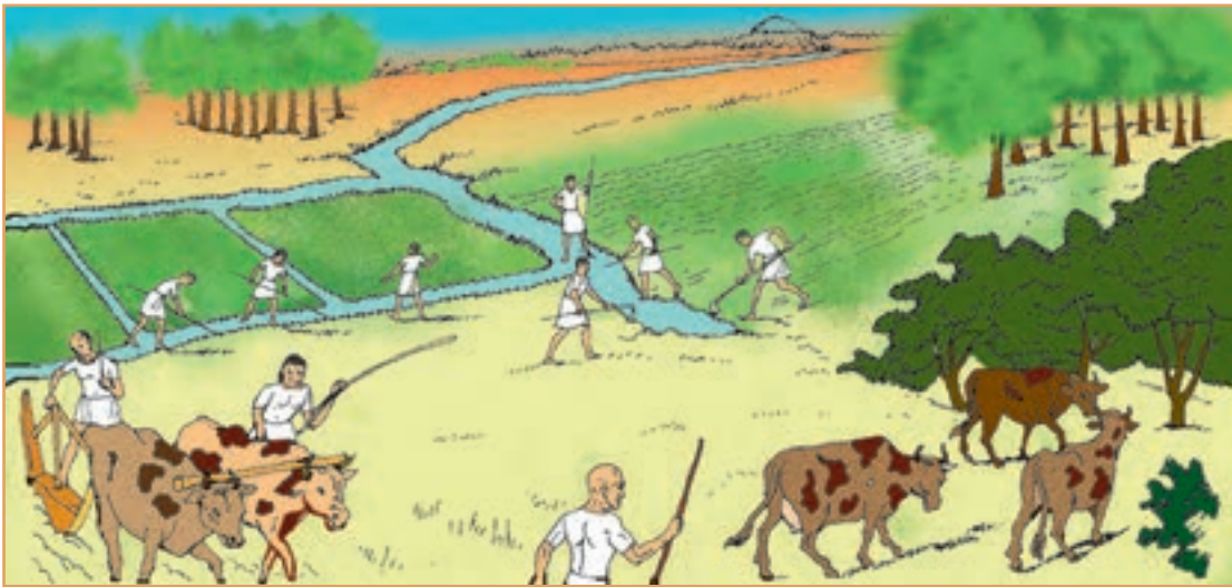
شکل ۳۱-۲- آریایی‌ها پس از ورود به ایران همچون سایر ایرانیان در فلات ایران اغلب به کشت و زرع مشغول شدند.

فلات ایران حدود سه هزار سال پیش مورد توجه اقوام کوچ‌نشین آریایی قرار گرفت. آریایی‌ها دامپرورانی بودند که از آسیای مرکزی و جنوب سبیری حرکت کردند و به تدریج در بخش‌هایی از فلات ایران ساکن شدند. گروهی از آنان در نواحی مرکزی و گروهی در دره‌ها و دشت‌های رشته کوه زاگرس ساکن شدند. اغلب آریایی‌ها