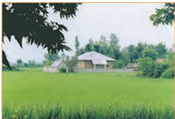
شکل ۳۸-۲- روستای پراکنده - گیلان