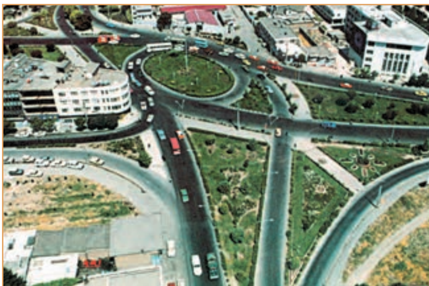
شکل ۵۰-۲- گسترش شهر کرمانشاه به سبب موقعیت ارتباطی