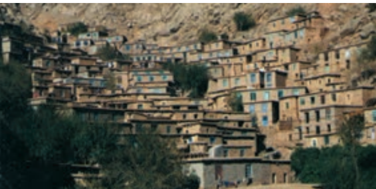
شکل ۴۰-۲- روستای پلکانی هجیج در منطقه پاوه کرمانشاه

است خانه‌های روستایی بر دامنه یک کوه استقرار یافته باشد، معمولاً در دامنه‌های رو به آفتاب ساختمان‌ها به صورت پلکانی در بالا دست ساختمان‌های دیگر قرار می‌گیرد. این گونه روستاها، به روستاهای پلکانی معروف‌اند.