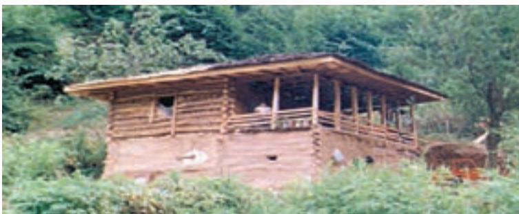
شکل ۴۲-۲- سقف خانه‌ها در مناطق جنگلی - گیلان

امروزه به علت گسترش امکانات و مصالح شهری به نواحی روستایی، مصالح مورد استفاده در ساختمان‌های روستایی تغییر کرده است، و مصالح بهتر با استحکام بیشتر مانند آجر، سیمان و آهن به کار گرفته می‌شود.