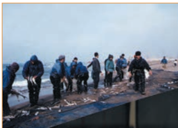
شکل ۴۷-۲- صید ماهی در کنار دریا