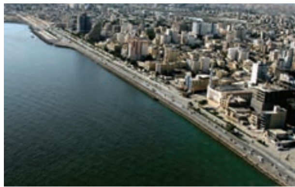
شکل ۵۴ - ۲ - بندرعباس، شهری در منطقه گرم و خشک

در دو - سه دهه اخیر رشد شهرها در کشور ما سرعت گرفته است. از یک سو بر تعداد جمعیت شهرها افزوده می شود و از سوی دیگر با تبدیل نقاط روستایی به شهر و تأسیس شهرداری، تعداد نقاط شهری افزایش می یابد. پیدایش بافت جدید و حومه ای در اطراف شهرها و پیدایش شهرک ها مشکلاتی را برای مسئولان شهری به وجود آورده است. به همین دلیل سازمان ها و وزارتخانه های مسئول برای کنترل رشد شهرها، برنامه های توسعه شهری را تدوین نموده اند. در این برنامه و طرح ها، از عکس های ماهواره ای و نقشه های کاربری زمین* استفاده می شود.