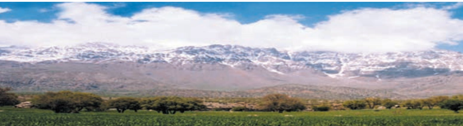
شکل ۳۲-۲- مراتع سرسبز ارتفاعات زاگرس و دشت‌های مجاور آن