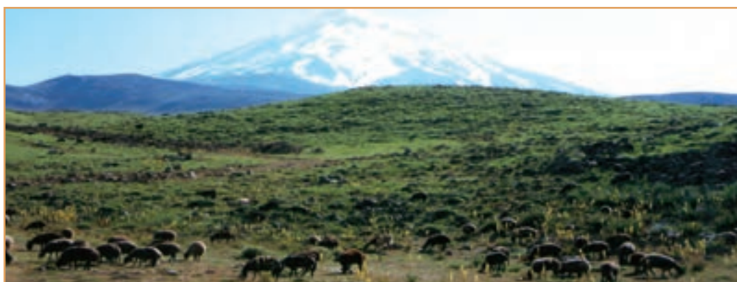
شکل ۳۳-۲- مراتع بیلاقی دامنه‌های جنوبی البرز