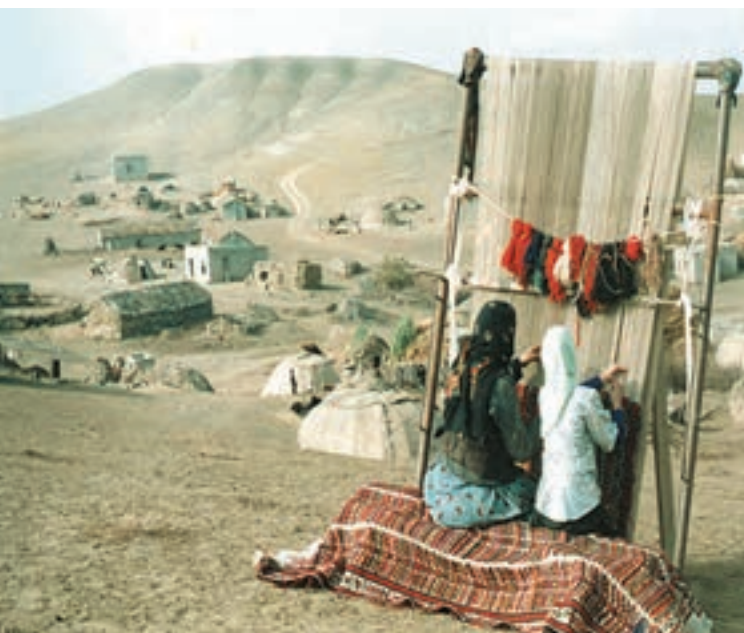
شکل ۳۶-۲- همکاری زنان در زندگی عشایری

گفتنی است، زنان عشایر در ایران، همدوش با مردان در امور دامداری، تهیه شیر و مشتقات لبنی و صنایع دستی مشارکت دارند. امروزه به دلیل سختی این نوع زندگی و تحولات اجتماعی، تعداد کوچ‌نشینان روبه کاهش است و عشایر به شیوه زندگی یکجانشینی تمایل پیدا کرده‌اند.