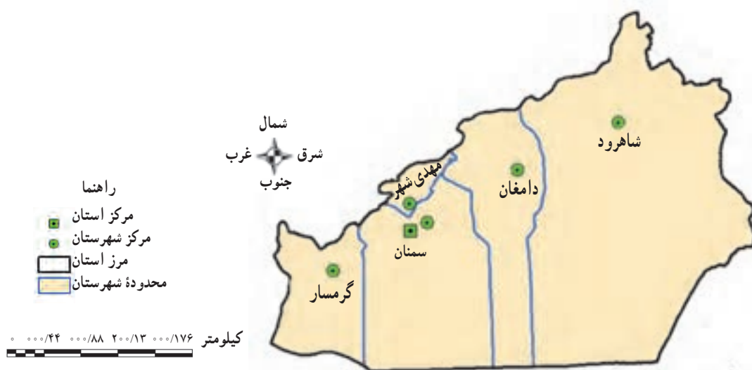
شکل ۵۷ - ۲ - استان سمنان به تفکیک شهرستان