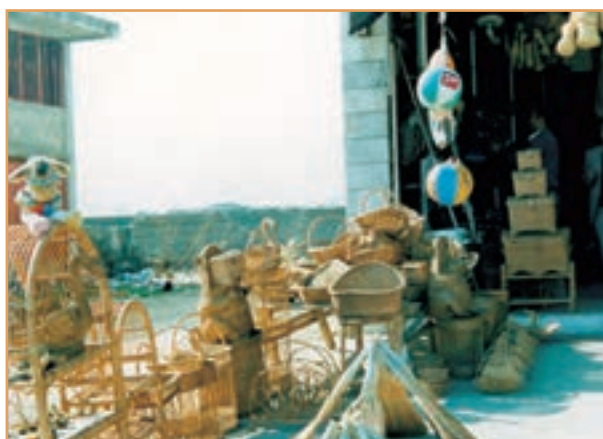
شکل ۴۶-۲- نمونه‌ای از صنایع دستی روستاییان - گیلان