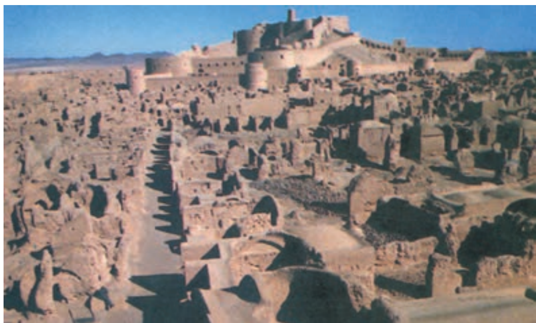
شکل ۴۹-۲- ارگ بم - قبل از زلزله سال ۱۳۸۲