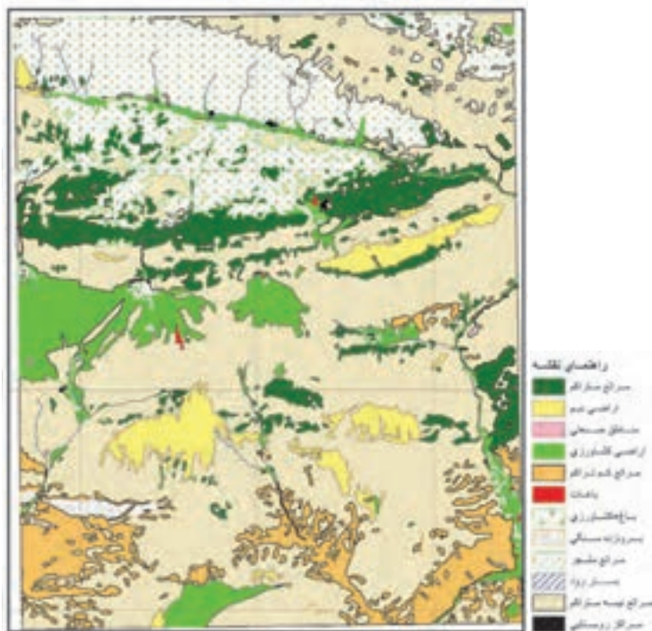
شکل ۵۵-۲- نقشه کاربری اراضی بخشی از منطقه فیروزکوه - دماوند

تاکنون با پراکندگی سکونتگاه‌های شهری و روستایی در ایران آشنا شدید. در سال ۱۳۸۹ حدود ۱۱۲۷ نقطه شهری و ۹۶۴ بخش و ۲۴۷۵ دهستان در ایران وجود دارد. برای اداره هرچه بهتر این سکونتگاه‌ها نیاز به تقسیمات سیاسی و اداری است. نخستین تقسیمات سیاسی استانی در سال ۱۳۱۶ شمسی انجام شد. به نقشه ۵۶-۲ توجه کنید. کشور ایران ۳۱ استان دارد.