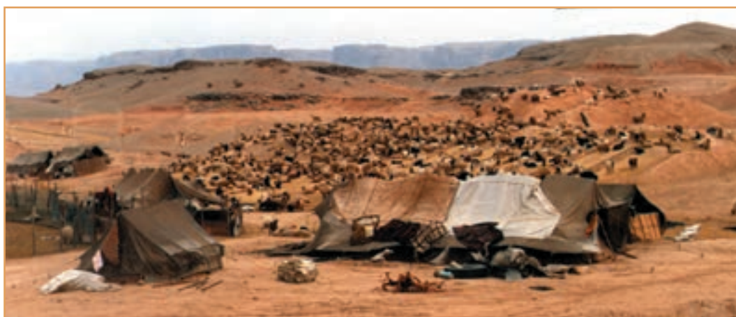
شکل ۳۴-۲- قشلاق‌های اطراف اندیمشک در جلگه خوزستان

سه ایل پرجمعیت کشور ما ایل بختیاری، قشقایی و ایل سون (شاهسون) است. ایلات بختیاری بیلاق خود را در اطراف شهرکرد (زاگرس)