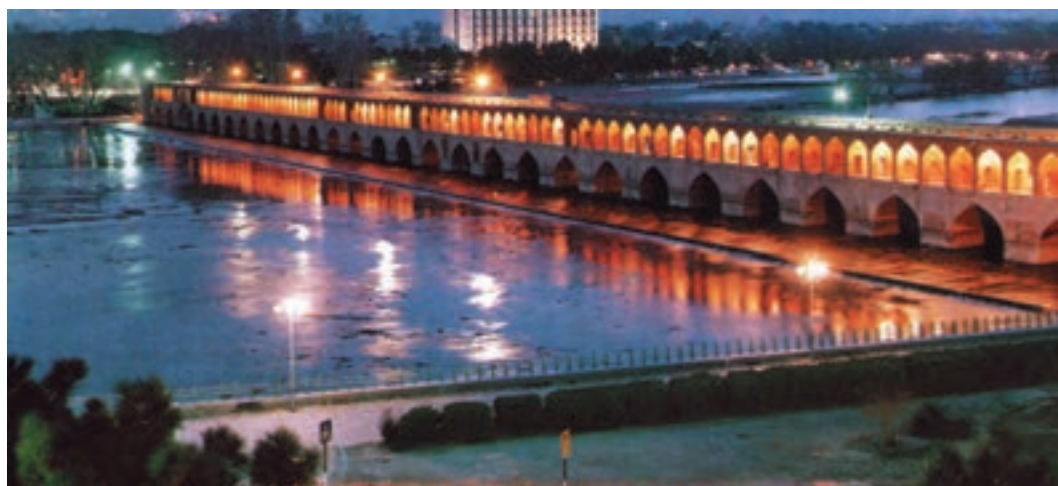
شکل ۴۸-۲- جریان زاینده‌رود از میان شهر تاریخی اصفهان

۱- آب: هسته اولیه بسیاری از شهرهای ایران در جایی بوده که به آب دسترسی داشته‌اند. در نواحی مرکزی و شرقی ایران، تعداد جوامع شهری محدود است. برخی از شهرهای این نواحی