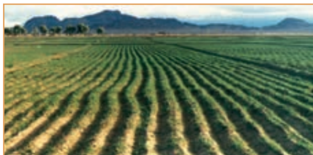
شکل ۴۳-۲- کشت و زرع

می‌پردازند. در روستاهای مناطق نیمه خشک که خاک فراوان است ساخت ظروف و اشیای سفالی رواج دارد. روستاییان سواحل شمالی و جنوبی کشور به صید ماهی هم اشتغال دارند. این شغل در سواحل جنوبی کشور که کشاورزی و دامپروری کمتر امکان پذیر است، رواج بیشتری دارد.