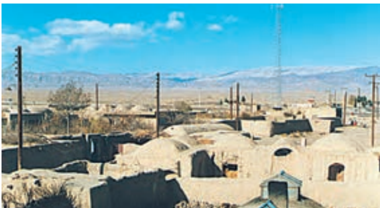
شکل ۴۱-۲- سقف خانه‌ها در مناطق گرم - سمنان

در مناطق گرم و خشک، روستاییان، سقف خانه‌های خود را گنبدی شکل می‌سازند؛ زیرا در این حالت معمولاً روزها به نیمی از سقف خانه آفتاب مستقیم نمی‌تابد و این امر در خنک نگه داشتن داخل خانه‌ها مؤثر است و از شدت گرمای تابش آفتاب می‌کاهد. در مورد سقف خانه‌های مناطق جنگلی که در تصویر زیر آمده است چه می‌دانید؟ توضیح دهید.