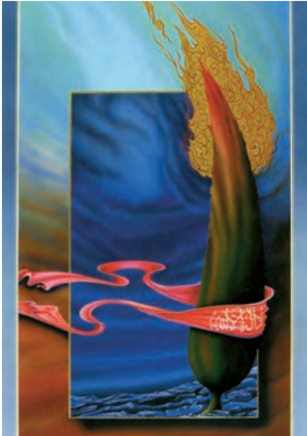
عروج، اثر سعید قادری