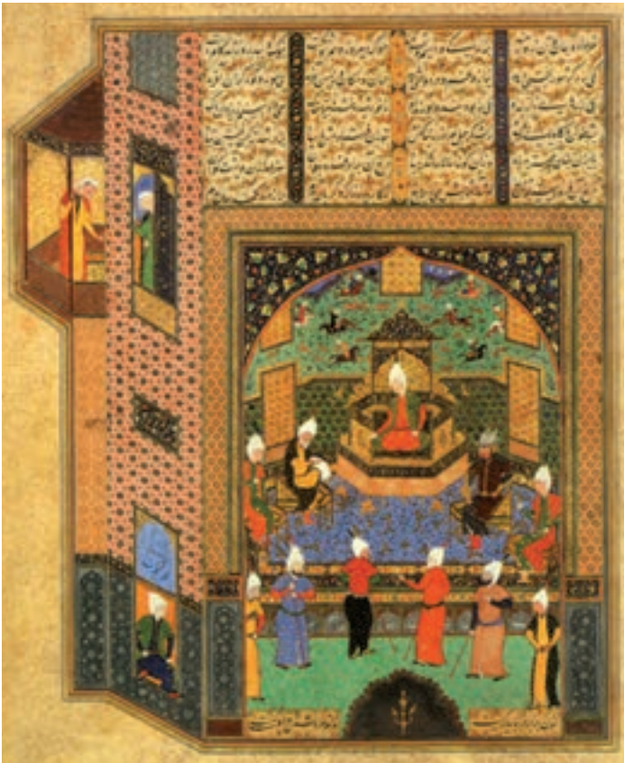
مجلس بحث فقها، اثر کمال الدین بهزاد ۸۹۴ هجری قاهره، کتابخانه سلطنتی مهر