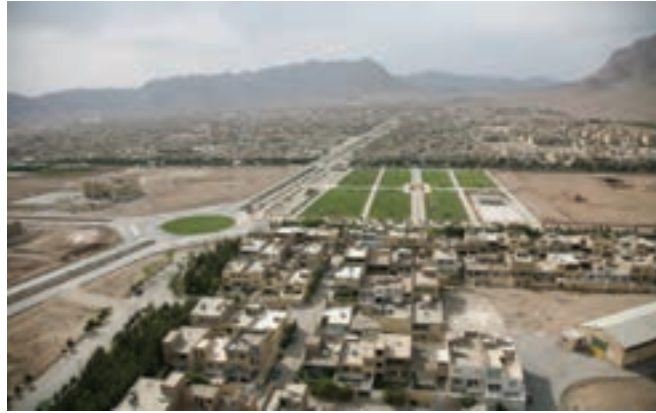
شکل ۱۱-۲- بافت جدید شهری (منظره خمینی شهر)