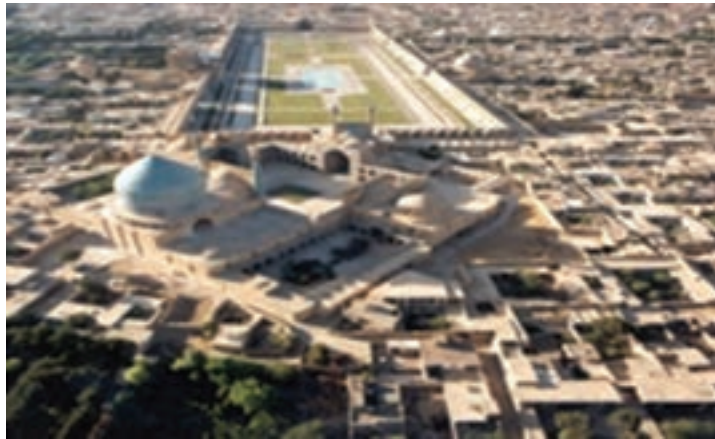
شکل ۲-۳- میدان امام (نقش جهان) - وضعیت کنونی