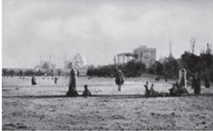
شکل ۲-۲- میدان امام (نقش جهان) در ۱۵۰ سال قبل