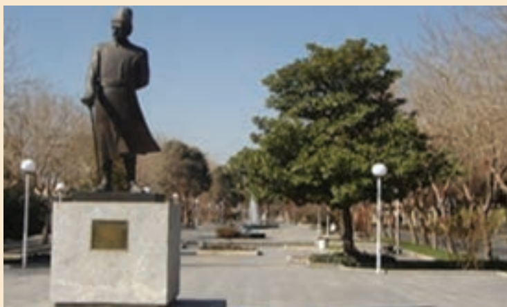
شکل ۲-۷- تندیس استاد علی اکبر اصفهانی یکی از سازندگان شهر اصفهان در زمان صفویه

شکل‌گیری اصفهان جدید: اصفهان در زمان شاه عباس اول به پایتختی ایران انتخاب شد و در معماری آن آمیزه‌ای از باغات متعدد، مادی‌های فراوان، پل‌های چند منظوره، کاخ‌ها، مساجد بزرگ و زیبا، مدارس، بازار، خیابان‌های وسیع و ... و بارعایت اصول مکان‌گزینی بهینه، زیباشناختی، پایداری شهر، حفظ مسائل زیست محیطی و حفظ بافت قدیم در کنار بافت جدید شکل گرفته است. بزرگانی چون شیخ بهایی و استاد علی اکبر اصفهانی که خود برنامه‌ریز، فیلسوف، عارف، معمار و شهرساز بوده‌اند، در طراحی و ساخت چنین فضاهایی نقش اصلی را به عهده داشته‌اند.