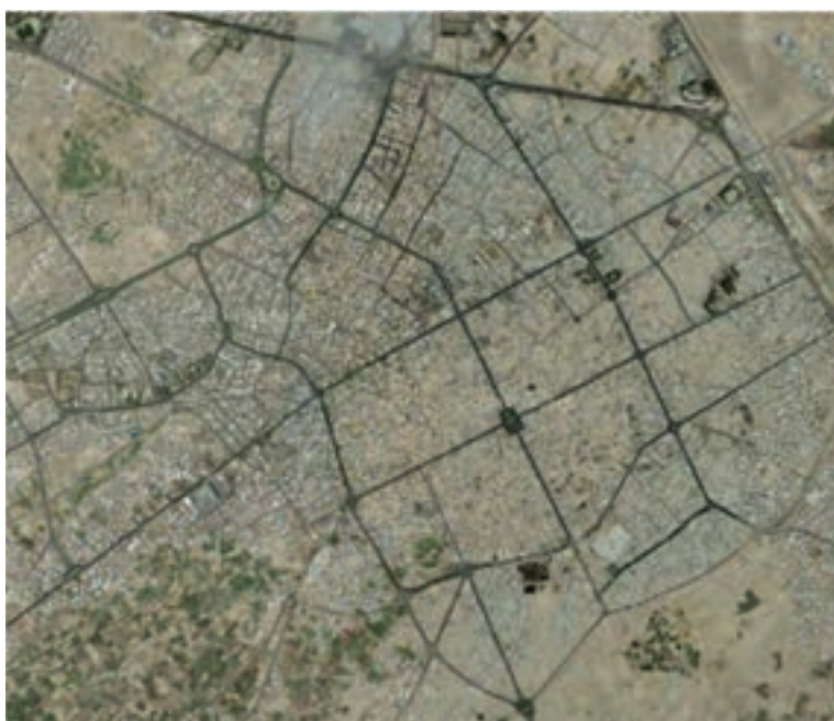
شکل ۱۰-۲- بافت شطرنجی شهر کاشان

در صد سال اخیر، همزمان با ورود وسایل نقلیه موتوری، ایجاد خیابان‌های متقاطع و شطرنجی، افزایش جمعیت و رشد شهرنشینی، مصرف‌گرایی، ورود الگوهای شهرسازی غیربومی، سیمای شهرهای اصفهان دگرگون شد و در اغلب آن‌ها بافت غیربومی در کنار بافت اصیل و سنتی حالتی دوگانه را به وجود آورد. در این شهرها، منطقه‌بندی جدید موجب کمرنگ‌شدن نقش محله‌ها شد.