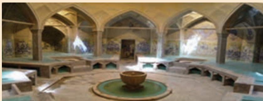
شکل ۲-۸- سربینة حمام علیقلی آقا، هر بخش متعلق به طبقه اجتماعی خاصی بوده است.