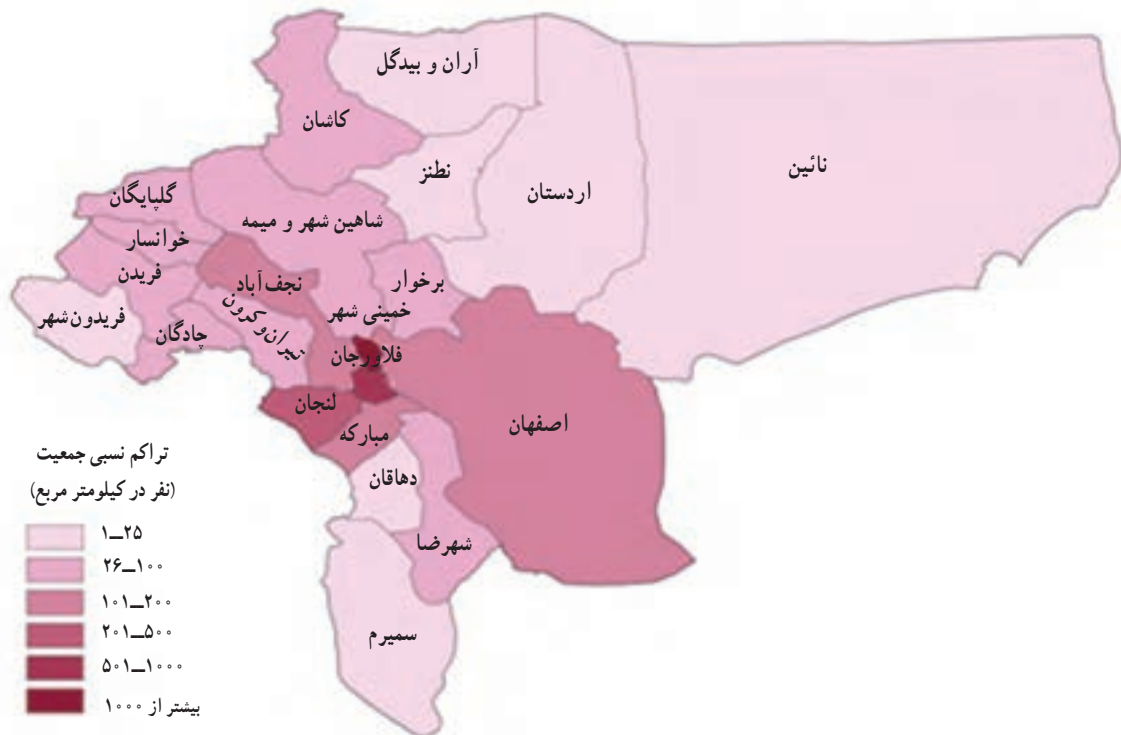
شکل ۲۲-۲. نقشه تراکم نسبی جمعیت شهرستان‌های استان (سال ۱۳۸۵)

جمعیت استان اصفهان طبق آخرین سرشماری رسمی در سال ۱۳۹۰ برابر با ۴/۸۷۹/۲۵۶ نفر بوده که ۸۳/۵ درصد آن در نقاط شهری و بقیه در نقاط روستایی و عشایری سکونت داشته‌اند. در این سال شهرستان‌های اصفهان، کاشان، خمینی شهر و نجف‌آباد به ترتیب پرجمعیت‌ترین و شهرستان‌های خوانسار و چادگان به ترتیب کم‌جمعیت‌ترین شهرستان‌های استان بوده‌اند.