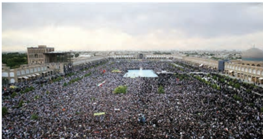
شکل ۲۴-۲- انبوهی جمعیت در میدان امام (نقش جهان) اصفهان