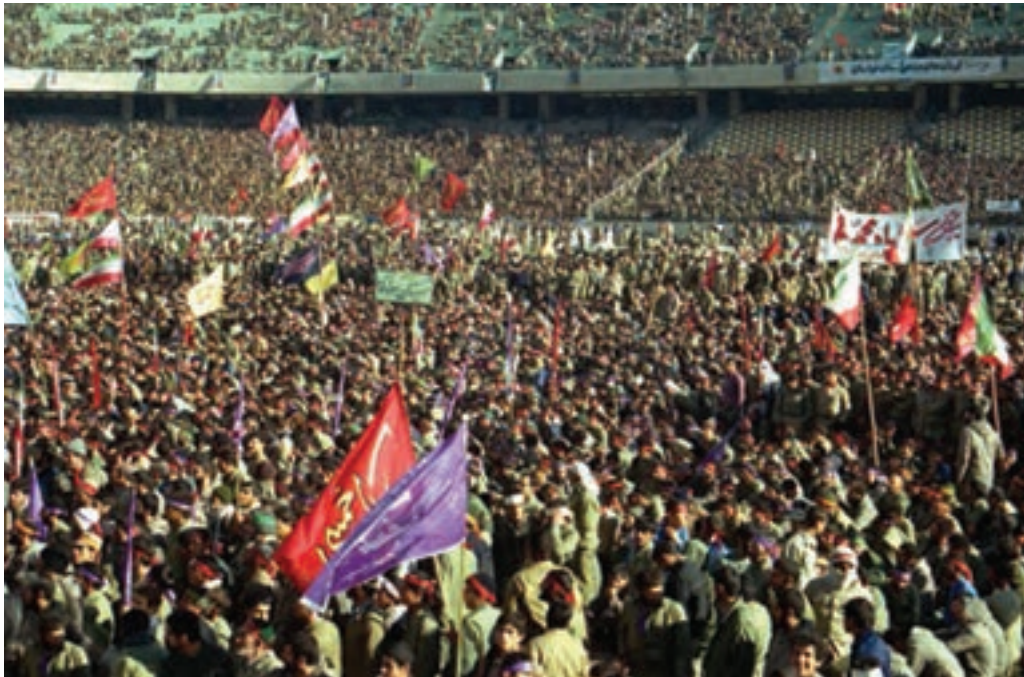
شکل ۷-۴. اعزام سراسری یکصد هزار نفری سپاه حضرت محمد (ص) از شهر تهران

شهر تهران به دلیل مرکزیت سیاسی، نقش بسیار ارزشمندی در دفاع از کیان اسلامی در دوران هشت سال دفاع مقدس بر عهده داشت. استان تهران اگرچه از نظر جغرافیایی دور از مرزها به سر می‌برد، ولی به واسطه پایتخت بودن و پشتیبانی خطوط جبهه، تقریباً مانند شهرهای مرزی مورد حملات هوایی قرار می‌گرفت. تهران به دلیل برخورداری از استعدادهایی در زمینه جذب و انتقال نیرو نسبت به سایر شهرها موقعیت ویژه‌ای داشت، به همین جهت، از اولین شهرهایی بود که در آغاز جنگ تحمیلی مورد حمله قرار گرفت. وجود پادگان‌های متعدد و فرودگاه‌های نظامی، خود استعداد بالقوه‌ای برای جذب نیروهایی شده بود که در بدو پیروزی انقلاب به دامن مردم پناه آورده بودند و پس از آغاز جنگ، عمده آن‌ها به پادگان‌ها برگشتند و به دفاع از سرزمین مقدس خود پرداختند. استان تهران با برخورداری از جمعیت کثیری نسبت به سایر استان‌ها و دارا بودن پادگان‌ها و مراکز دفاعی متعدد، به طور طبیعی نقش بسیار خطیری در دفاع از میهن اسلامی بر عهده داشت. با آغاز جنگ تحمیلی علیه جمهوری نوپای اسلامی، حضور داوطلبانه و فعال نیروهای مردمی، بسیاری از مشکلات را حل کرد. علاوه بر آن، حضور ارزشمند نیروهای مردمی در قالب نیروهای داوطلب، از پایگاه‌های بسیج ادارات و مساجد نیز شکوه دیگری از این عظمت را نشان داد که اوج آن را در اعزام سراسری یکصد هزار نفری سپاه حضرت محمد (ص) شاهد بودیم.