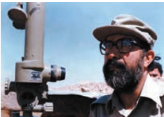
شکل ۱۱-۴- شهید دکتر مصطفی چمران

شخصیت‌های برجسته‌ی زیادی را می‌توان از تهران نام برد که سنگرهای خود را در مجلس شورای اسلامی، مدرسه و... ترک کردند و به جبهه‌ها شتافتند و به درجه رفیع شهادت نائل آمدند؛ از آن جمله می‌توان شهید مصطفی چمران را نام برد. همچنین از میان سرداران سپاه و ارتش نیز افراد برجسته‌ای بودند که با وجود مسئولیت‌های کلان کشوری، سنگرها را بر صندلی‌ها ترجیح دادند و همچون سایر رزمندگان به خطوط مقدم جبهه رفتند؛ از جمله تیمسار ولی‌ا... فلاهی، شهید ستاری، شهید حسن باقری، شهید کلاهدوز و شهید سید مرتضی آوینی (شهید اهل قلم) روایتگر «روایت فتح».