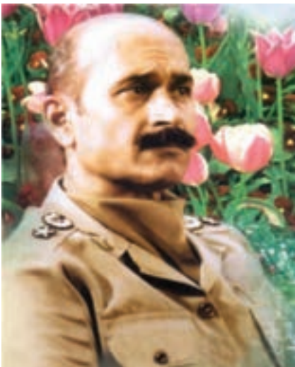
شکل ۱۰-۴- شهید فلاهی

از دیگر کمک‌های مردمی به رزمندگان علاوه بر اهدای کالا، می‌توان به اهدای خون نیز اشاره کرد. مردم هر وقت احساس می‌کردند به خون آن‌ها نیاز است، دریغ نمی‌کردند. همچنین، آنان با شرکت فعال در راهپیمایی‌ها به مناسبت‌های مختلف، به رغم بمب‌گذاری‌ها و حملات هوایی دشمن، موجب تقویت روحیه رزمندگان می‌شدند و دشمنان را مأیوس می‌کردند.