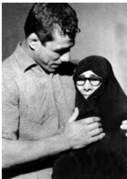
شکل ۱۵-۴- جهان پهلوان تختی

از روحانیان ممتاز می‌توان از مرحوم آیت‌الله طالقانی یاد کرد. او شکنجه‌های بسیاری در زندان طاغوت کشید و از یاران امام خمینی (ره) و اولین امام جمعه تهران پس از انقلاب بود. آیت‌الله طالقانی شاگردان بسیاری برای مبارزه با رژیم ستم‌شاهی تربیت کرد که شهید چمران یکی از کسانی بود که در مجالس درس ایشان شرکت می‌کرد.