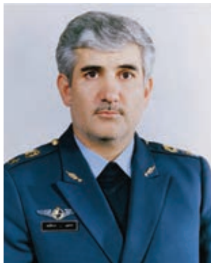
شکل ۹-۴- شهید ستاری