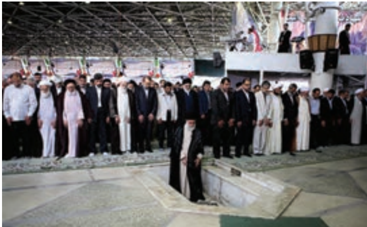
شکل ۱۶-۴- نماز جمعه تهران به امامت مقام معظم رهبری

مردم تهران نه تنها در صحنه دفاع حضور فعال داشتند بلکه با تشکیل ستاد معین بازسازی، همچنان حضور خود را در صحنه حفظ کردند و در زمینه آبادسازی مناطق آزاد شده به خصوص خرمشهر، به تلاش های خود ادامه دادند.