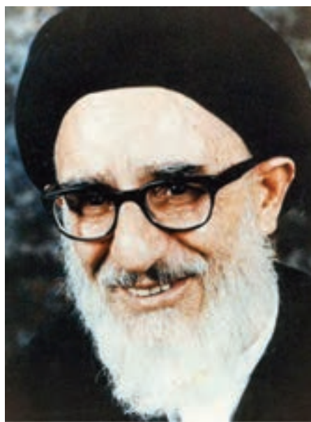
شکل ۱۴-۴- مرحوم آیت‌الله طالقانی