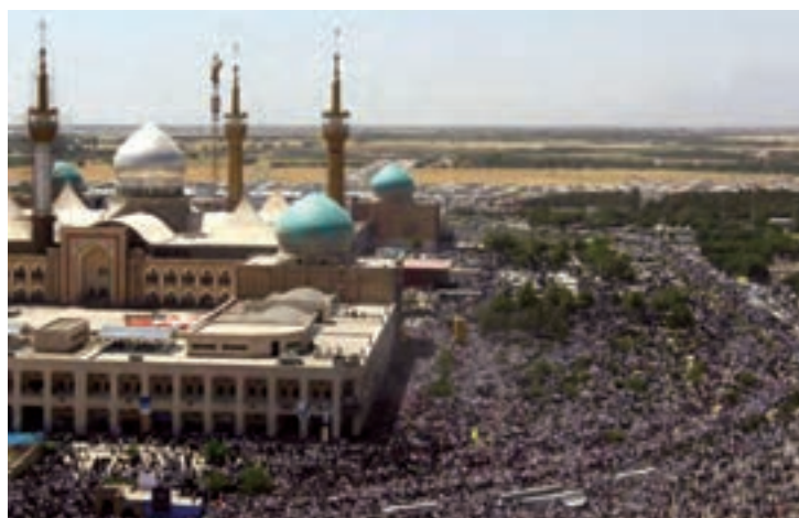
شکل ۱۷-۴- حرم مطهر امام خمینی (ره)

اکنون نیز جای آن دارد که با پاس داشتن خون شهدای گرانقدر، حفظ دستاوردهای رشادت های آن عزیزان و ادامه راه آن ها، رضایت خداوند بزرگ را نیز فراهم آوریم.