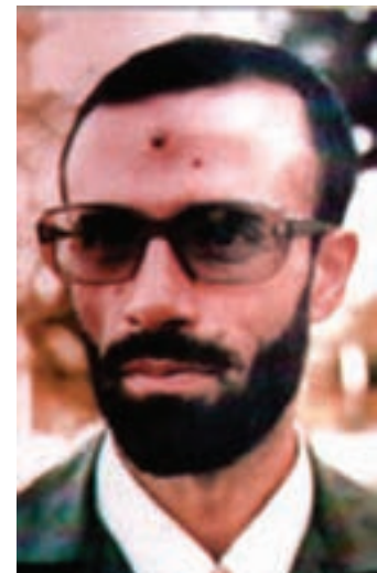
شکل ۸-۴- شهید کلاهدوز

شخصیت‌های برجسته‌ی زیادی را می‌توان از تهران نام برد که سنگرهای خود را در مجلس شورای اسلامی، مدرسه و... ترک کردند و به جبهه‌ها شتافتند و به درجه رفیع شهادت نائل آمدند؛ از آن جمله می‌توان شهید مصطفی چمران را نام برد. همچنین از میان سرداران سپاه و ارتش نیز افراد برجسته‌ای بودند که با وجود مسئولیت‌های کلان کشوری، سنگرها را بر صندلی‌ها ترجیح دادند و همچون سایر رزمندگان به خطوط مقدم جبهه رفتند؛ از جمله تیمسار ولی‌ا... فلاهی، شهید ستاری، شهید حسن باقری، شهید کلاهدوز و شهید سید مرتضی آوینی (شهید اهل قلم) روایتگر «روایت فتح».