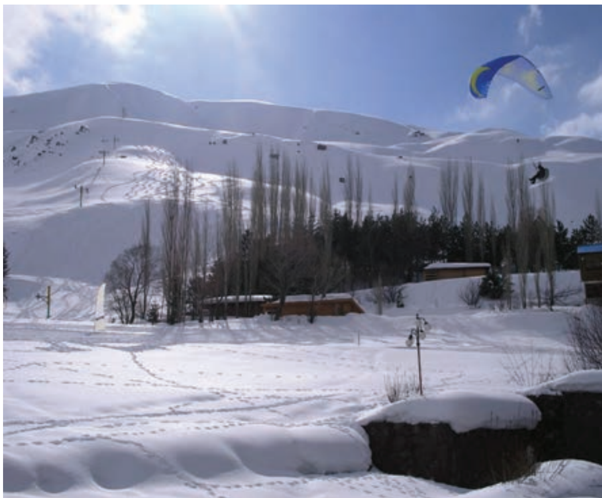
شکل ۱۲-۵- پیست اسکی دیزین

پیست اسکی دیزین، توچال و آبعلی بزرگ‌ترین پیست‌های اسکی ایران در دامنه کوه‌های سر به فلک کشیده البرز پذیرای دوستداران ورزش‌های مفرح زمستانی هستند. غارها، چشمه‌ها، دریاچه‌ها و آبشارهای طبیعی از دیگر جاذبه‌های گردشگری این استان است، تنگه واشی یکی از این جاذبه‌هاست که در فصل تابستان زیباترین چشم‌اندازهای طبیعی را به نمایش می‌گذارد (جدول ۱-۵). غار رودافشان در ۶۲ کیلومتری جاده دماوند یکی از زیباترین غارهای استان تهران در نزدیکی روستای رودافشان واقع شده است.