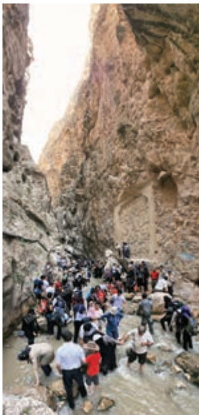
شکل ۹-۵- تنگه واشی

غرب و شرق استان تهران را رودخانه‌های خروشان در بر گرفته که با احداث سد بر روی آن‌ها دریاچه‌های بزرگ و زیبایی به وجود آمده است که مناسب انواع ورزش‌ها و تفریحات آبی هستند.