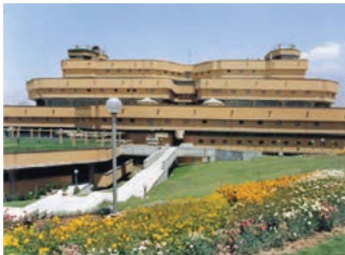
شکل ۵-۶- کتابخانه ملی