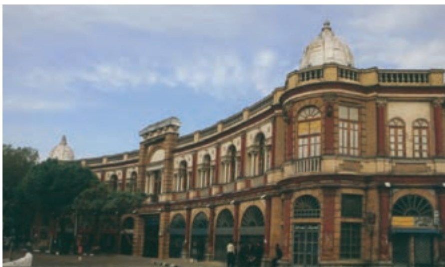
شکل ۱۶-۵- میدان حسن آباد