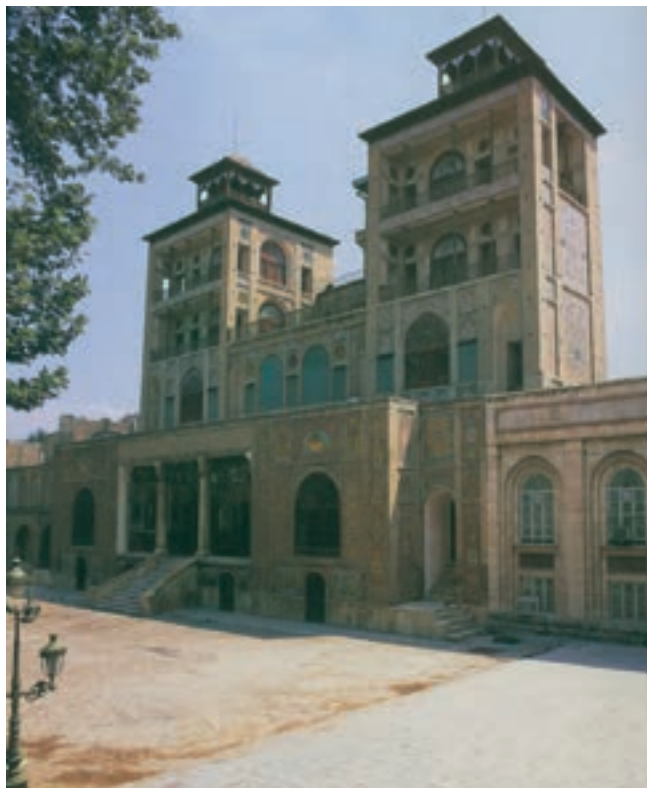
شکل ۱۵-۵- کاخ شمس العماره در مجموعه کاخ موزه گلستان

● اماکن تاریخی: تپه‌های باستانی، کاروانسراها، غارها و کتیبه‌های تاریخی، آب انبارها و حمام‌های قدیمی، بقعه‌ها، میادین و قلعه‌ها و برج‌های تاریخی از جمله جاذبه‌های دیگر استان تهران است (جدول ۲-۵).