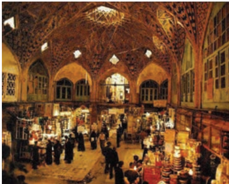
شکل ۱۷-۵- بازار بزرگ تهران

● بازارها: در تهران تعداد زیادی بازار، مراکز خرید و نمایشگاه‌های تجاری و هنری وجود دارد که در فصول مختلف سال موجب جذب گردشگران به این استان می‌شود. بازار سنتی تهران، بازار بین الحرمین، تیمچه امین اقدس و ...، از جمله بازارهای قدیمی تهران‌اند که علاوه بر حفظ اهمیت تجاری، از اهمیت تاریخی نیز برخوردارند.