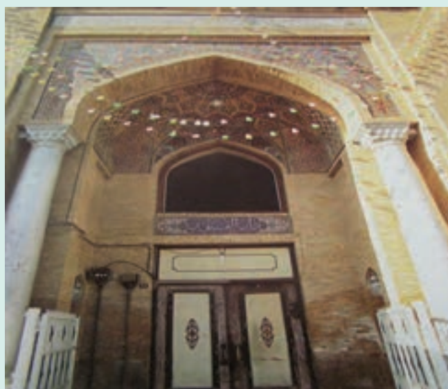
شکل ۵-۷- مدرسه دارالفنون

در مورد یکی از دانش آموختگان مشهور مدرسه دارالفنون گزارشی کوتاه تهیه کنید.