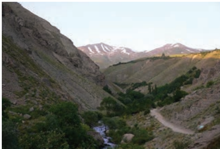
شکل ۱۳-۵- مسیر آبشار شکر آب