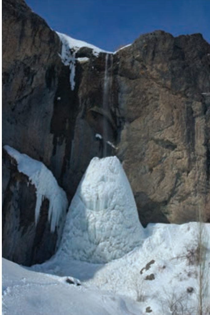
شکل ۱۹-۵- آبشار سنگان جاده امامزاده داوود