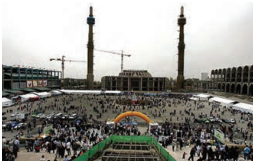
شکل ۱۸-۵- نمایشگاه بین المللی کتاب تهران - مصلی بزرگ امام خمینی (ره)

بر پایی نمایشگاه‌های متعدد و گوناگون در تمام طول سال، مانند نمایشگاه بین المللی کتاب تهران، نمایشگاه دائمی گل و گیاه و برگزاری جشنواره‌های فرهنگی - هنری نیز از دیگر جاذبه‌های استان تهران برای گردشگران است.