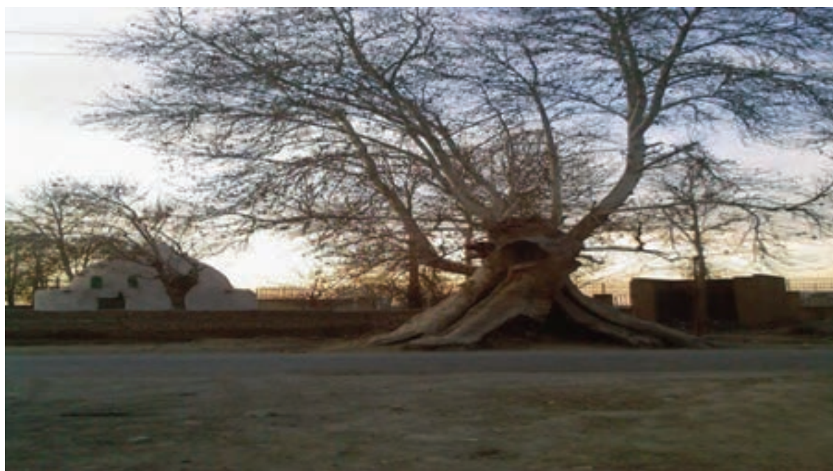
شکل ۱۱-۵- درختی کهن در ورامین