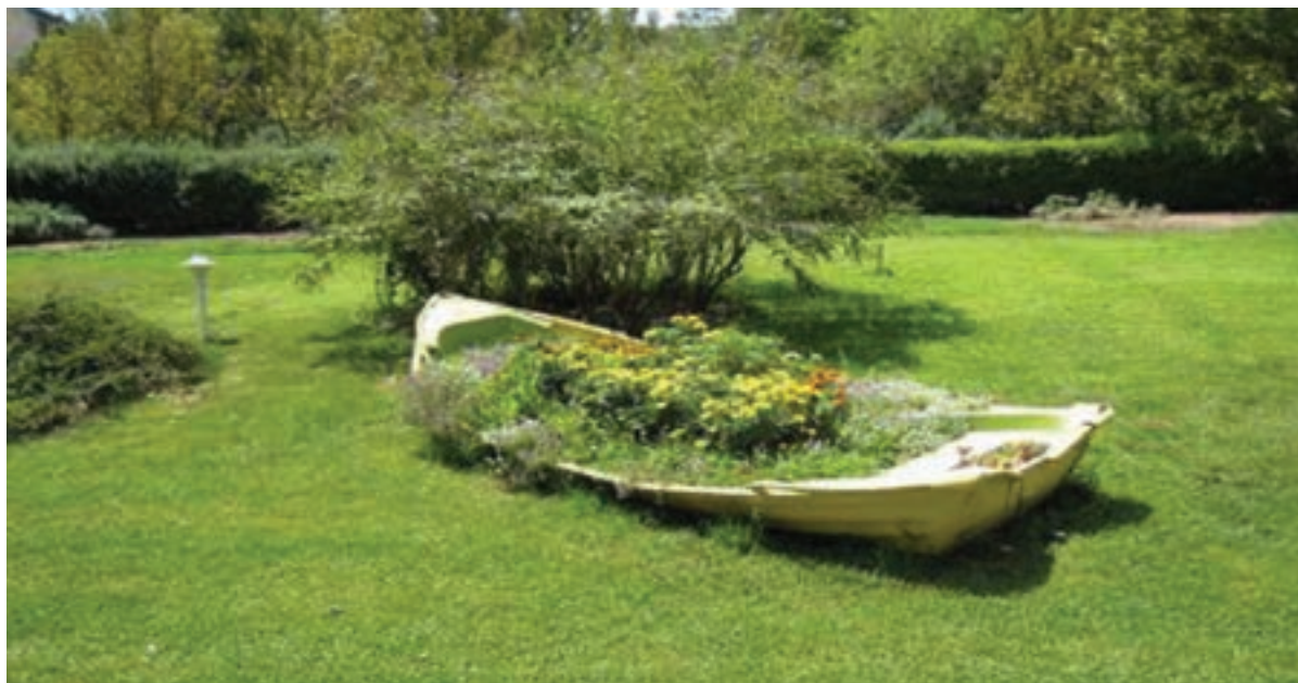
شکل ۱۰-۵- پارکی زیبا در تهران