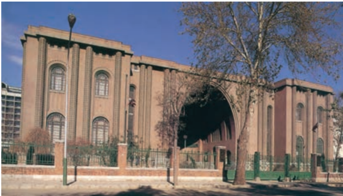
شکل ۸-۵- موزه ایران باستان

جاذبه‌های گردشگری در استان تهران به دو بخش تقسیم می‌شود :