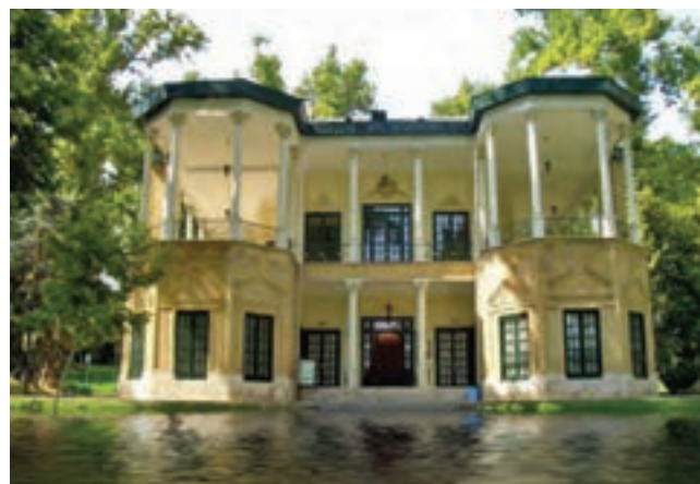
شکل ۱۴-۵- کوشک احمد شاه در مجموعه کاخ موزه نیاوران