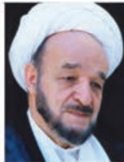
علامه محمد تقی جعفری