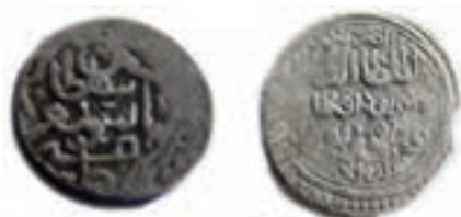
شکل ۱۶-۴- سکه‌های متعلق به دوران آق قویونلوها

اوزون حسن بنیان گذار دولت آق قویونلوها بود. او تبریز را پایتخت خود قرار داد و قلمرو خود را تا بغداد و هرات توسعه داد. بعد از مرگ او فرزندش سلطان یعقوب به سلطنت رسید اما او در جوانی از دنیا رفت و با مرگ یعقوب دولت آق قویونلوها در آذربایجان فروپاشید. مدرسه دینی «نصریه» و مسجد «حسن پادشاه» واقع در خیابان دارایی جدید تبریز از آثار آنها است.