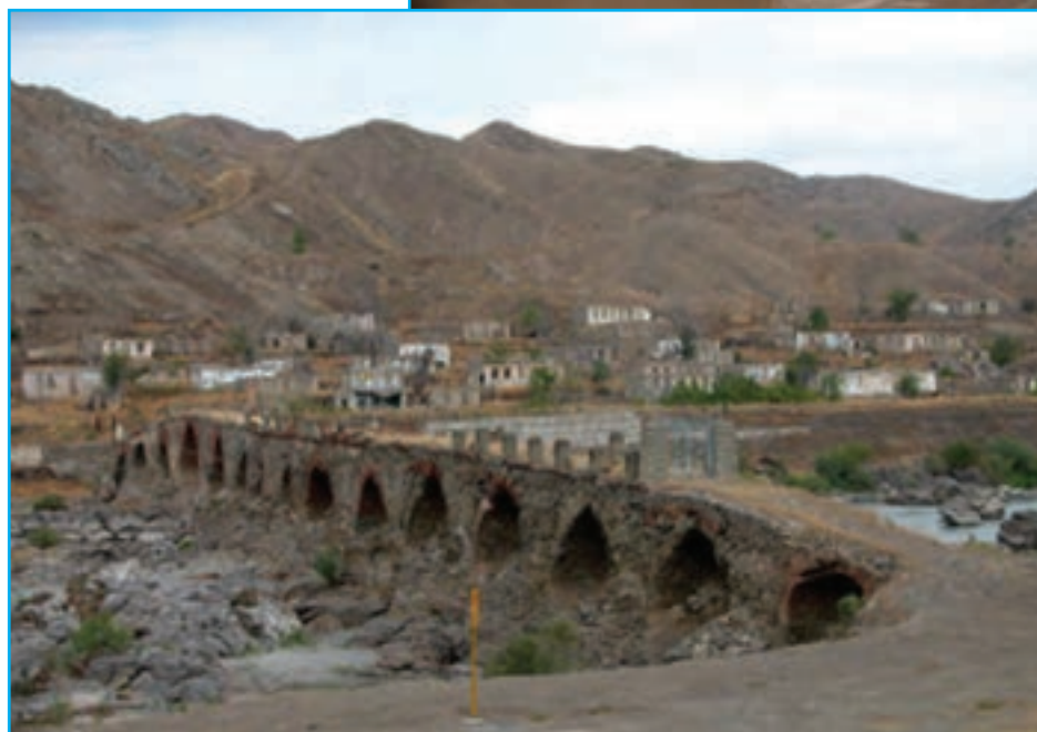
شکل ۸-۴- پل بزرگ خدا آفرین - اثری متعلق به دوران معاصر