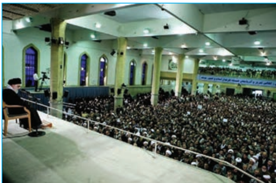
شکل ۲۳-۴ دیدار جمعی از مردم استان با رهبر معظم انقلاب اسلامی در سالروز ۲۹ بهمن، قیام مردم تبریز

مردم آذربایجان شرقی، بارها مخالفت خود را با برنامه‌های ضداسلامی دولت پهلوی‌ها چه در موضوع تغییر لباس و کشف حجاب و چه در اجرای برنامه «اصلاحات ارضی» ابراز نمودند و از حریم اسلام و روحانیت دفاع کردند. اعتراض آنها در قیام پانزده خرداد ۱۳۴۲ ه.ش به رهبری امام خمینی (ره) بعد از انقلاب مشروطه و نهضت ملی شدن نفت، قدرت ایمان و عزم ملی مردم آذربایجان را به نمایش گذاشت. قیام توفنده مردم تبریز در ۲۹ بهمن سال ۱۳۵۶ ه.ش که به مناسبت گرامیداشت چهلمین روز شهادت شهدای ۱۹ دی ماه ۵۶ شهر قم اتفاق افتاد، لزره بر بنیاد دولت پهلوی انداخت و این اعتراض بذر انقلاب را در سراسر کشور پاشید.