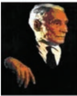
جبار باغچه بان