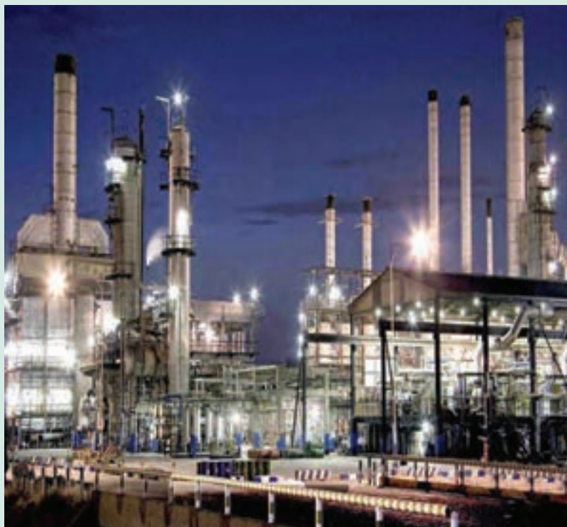
شکل ۵-۶- نیروگاه برق در تهران

صداوسیما: ارتباطات رسانه‌ای و وسایل ارتباط جمعی به‌عنوان یکی از ابزارهای نیرومند در جهت فرهنگ‌سازی، نقش مؤثری را در توسعه اجتماعی، اقتصادی و فرهنگی جامعه به‌عهده دارد. براساس آمار و اطلاعات موجود در طی سال‌های ۱۳۷۵ تا ۱۳۸۵، تعداد ایستگاه‌های رادیویی موج متوسط، تلویزیون و اف. ام از ۱۵۴ ایستگاه به ۳۵۵ ایستگاه (۲/۳ برابر) و هم‌چنین، تعداد مجموع فرستنده‌های اصلی از ۲۷۷ به ۱۰۱۵ فرستنده افزایش یافته است.