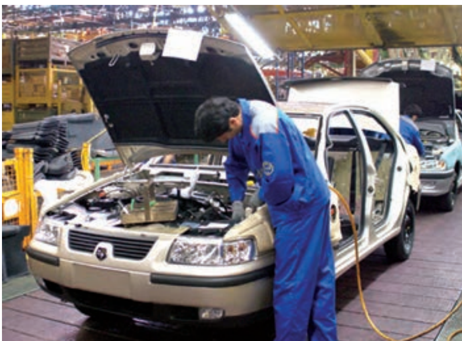
شکل ۲۶-۵- تولید اتومبیل در کارخانه ایران خودرو