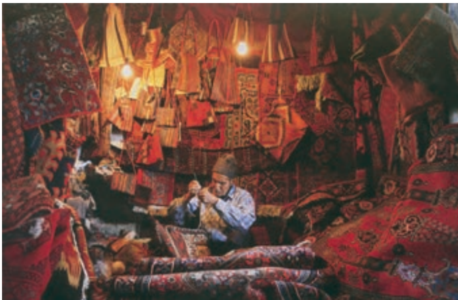
شکل ۲۷-۵- نمونه‌ای از بازار صنایع دستی تهران

۳- صنایع دستی عشایری: قدیمی‌ترین نوع صنایع دستی استان است که تولید آن عموماً به‌طور خانگی و فصلی انجام می‌پذیرد. این نوع از صنایع دستی، با توجه به ترکیب قومی منطقه، در میان صنایع دستی استان جایگاهی ویژه دارد و هم‌اکنون یکی از نقاط برجسته و مثبت صنایع دستی استان محسوب می‌شود. دست‌اندرکاران این بخش از دست‌ساخته‌های ایرانی که بافت انواع قالی و قالیچه، جاجیم و گلیم، چننه ۱ ، رویه پستی، جوال ۲ ، خورجین ۳ و نیز رنگرزی و ریسندگی پشم را در انحصار خود دارند، گروهی از عشایر لر، قشقایی، شاهسون و... هستند که در دهه‌های اخیر از زادگاه خود به تهران، ری، ورامین و کرج مهاجرت کرده‌اند.