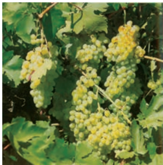
شکل ۶-۶- محصولات کشاورزی استان

دامداری: تولید محصولات دامی استان طی سال‌های ۱۳۵۸ تا ۱۳۸۷ از بیست و یک هزار تن به یک میلیون و دویست هزار تن بالغ گردید.