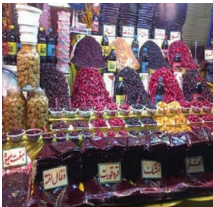
شکل ۲۸-۵- فروشگاه‌های در منطقه دربند