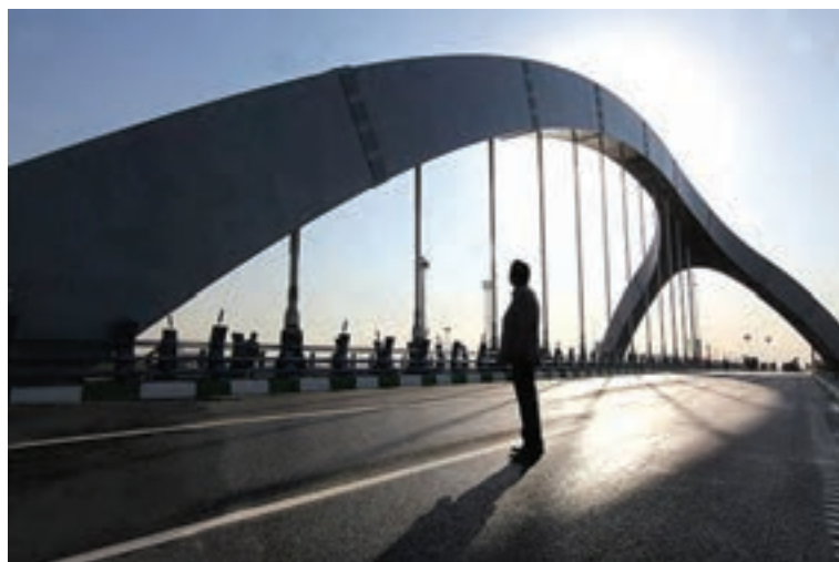
شکل ۳-۶- پل جوادیه

آغاز به کار متروی تهران در سال ۱۳۷۸ نقطه عطفی در توسعه شبکه ریلی استان محسوب می شود که روزانه هزاران مسافر را جابه جا می کند.