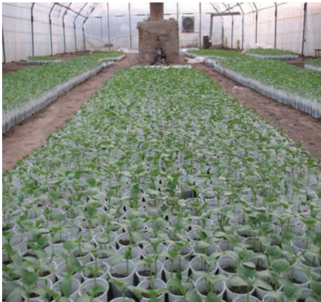
شکل ۲۳-۵- کشت گلخانه‌ای

محصولات عمده این بخش را گندم، جو، یونجه، ذرت علوفه‌ای، گوجه فرنگی، خیار، سبزی‌ها، سیب‌زمینی، نباتات علوفه‌ای، انگور، چغندر قند و پنبه تشکیل می‌دهد. از نواحی مهم آن می‌توان به دشت شهریار و ورامین اشاره کرد.