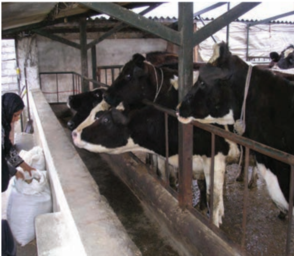
شکل ۲۴-۵- مرکز دامداری صنعتی

اشکال عمده دامداری در این استان شامل گاوداری‌های صنعتی بزرگ، پرورش طیور، مرغ داری‌ها، پرورش زنبورعسل و پرورش ماهی است.