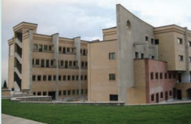
شکل ۶-۷- دانشگاه آزاد اسلامی واحد تهران

اماکن مذهبی در استان تهران براساس آمار سال ۱۳۸۶، به تعداد ۳۹۹ مکان متبرکه بوده است. در این استان، ۳۵۶۵ مسجد و ۶۰۱ حسینیه برای انجام فرایض دینی و مذهبی وجود دارد. همچنین، تعداد ۱۹ مکان مذهبی مربوط به اقلیت‌های مذهبی در شهر تهران وجود دارد.