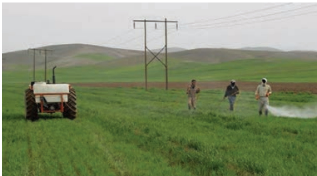
شکل ۲۲-۵- فعالیت‌های کشاورزی در اطراف شهر ری

۲- دشت‌ها و کوهپایه‌های جنوبی البرز؛ شامل ورامین، ری، شهریار و رباط کریم است. این بخش برای کشاورزی مساعد است؛ زیرا از منابع آب‌های سطحی و زیرزمینی برخوردار است اما زمین‌هایی که در نزدیکی شوره‌زارها واقع شده‌اند، برای کار کشاورزی مناسب نیستند.