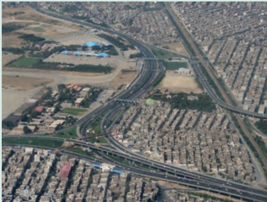
شکل ۱-۶- راه‌های ارتباطی شهر تهران

راه‌های ارتباطی یکی از عوامل توسعه صنعتی در استان تهران محسوب می‌شود. بعد از انقلاب اسلامی، توجه زیادی به احداث راه‌های استان صورت گرفته است؛ به طوری که در سال ۱۳۶۰ طول شبکه راه‌های استان (آزادراه، بزرگراه، راه‌های اصلی و فرعی و راه‌های روستایی) معادل ۲۴۱۷ کیلومتر بوده در حالی که تا پایان سال ۱۳۸۷ به ۴۹۸۳ کیلومتر رسیده است که نشان دهنده رشد بسیار بالای آن است.