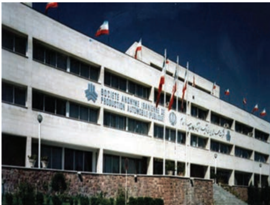
شکل ۲۵-۵- شرکت خودروسازی سایپا