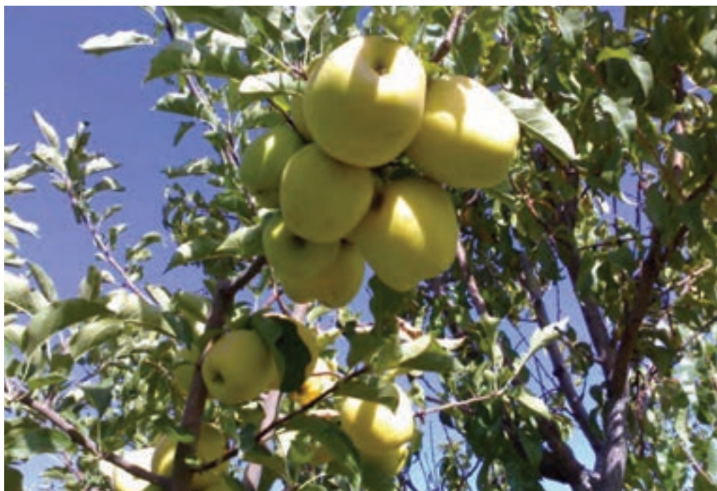
شکل ۲۱-۵- باغ سیب در شهرستان دماوند

۲- دشت‌ها و کوهپایه‌های جنوبی البرز؛ شامل ورامین، ری، شهریار و رباط کریم است. این بخش برای کشاورزی مساعد است؛ زیرا از منابع آب‌های سطحی و زیرزمینی برخوردار است اما زمین‌هایی که در نزدیکی شوره‌زارها واقع شده‌اند، برای کار کشاورزی مناسب نیستند.