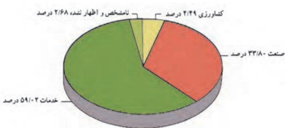
شکل ۲۰-۵. نمودار درصد شاغلان در بخش‌های مختلف اقتصادی استان

استان تهران یکی از قطب‌های اقتصادی کشور است. تجمع کانون‌های اقتصادی در این استان و موقعیت سیاسی و اداری و نیز مرکزیت آن باعث شده است که بخش عمده امکانات در محدوده آن متمرکز شود. نمودار زیر، شاغلان را در سه بخش کشاورزی، صنعت و خدمات در استان تهران نمایش می‌دهد.