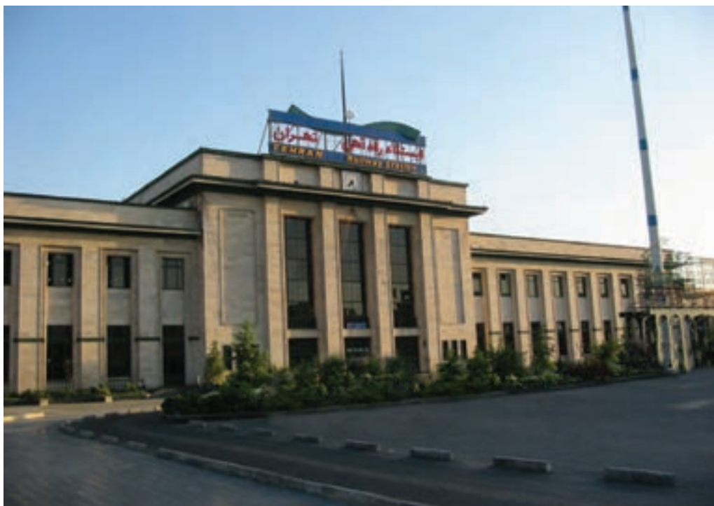
شکل ۲-۶- ایستگاه راه آهن تهران

آغاز به کار متروی تهران در سال ۱۳۷۸ نقطه عطفی در توسعه شبکه ریلی استان محسوب می شود که روزانه هزاران مسافر را جابه جا می کند.