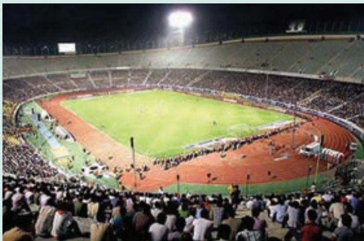
شکل ۶-۸- استادیوم آزادی تهران

استان تهران طی سی سال گذشته به خصوص از دهه ۱۳۷۰، شاهد رونق فعالیت‌های ورزشی بوده است. تعداد فضاهای ورزشی روباز و سرپوشیده استان از ۲۷۶ مورد در سال ۱۳۶۸ به ۲۷۶۸ مورد در سال ۱۳۸۷ رسیده است، اما به علت افزایش جمعیت، رشد سرانه فضای ورزشی برای هر نفر ۲۳٪ در سال ۱۳۸۷ بوده است.