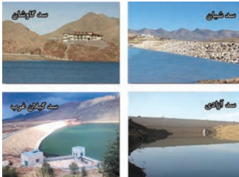
شکل ۳-۶- نمایی از برخی از سدهای استان کرمانشاه