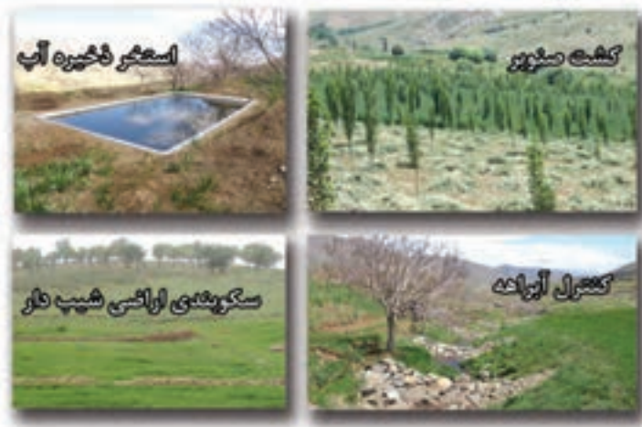
شکل ۵-۶- مهم ترین دستاوردهای بخش منابع طبیعی