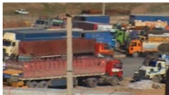
شکل ۱-۶- بازارچه مرزی پرویزخان

در دهه اول پس از انقلاب اسلامی، سرعت توسعه در بخش‌های زیربنایی و عمرانی استان کرمانشاه مانند دیگر استان‌های واقع در غرب کشورمان، به دلیل موقعیت مرزی و تأثیر مستقیم از جنگ تحمیلی، روند کندی داشت. اما در دهه‌های بعدی روند حرکت سرعت بیشتری یافته است. نمود این تحولات در استان را می‌توان در بخش‌های مختلف اقتصادی و زیربنایی مشاهده کرد. در این درس به‌طور گذرا مهم‌ترین این دستاوردها در بخش‌های مختلف بررسی می‌شود: