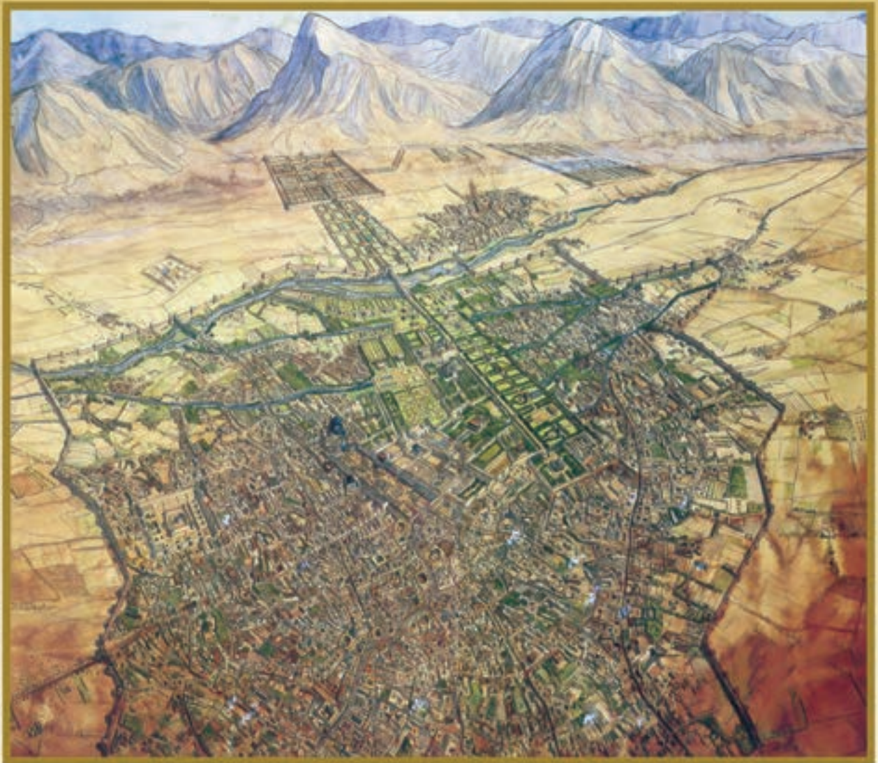
شهر اصفهان - صفویه