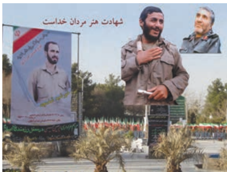
شکل ۱۶-۶- تصویر برخی از سرداران شهید استان اصفهان

مردم استان در سال‌های دفاع مقدس ضمن حضور فعال و مؤثر در بسیاری از عملیات‌ها (فرماندهی لشکر امام حسین، تیپ نجف اشرف، تیپ کربلا) در پشتیبانی از جبهه‌ها و رزمندگان اسلام (در قالب کاروان‌های وحدت و شهید بهشتی) نقش تعیین‌کننده داشته‌اند. امام درباره مردم این استان می‌فرماید: در کجای دنیا می‌توانید جایی را مانند اصفهان پیدا کنید. تقدیم ۲۳ هزار شهید و ۴۱ هزار جانباز و ۳۴۶۰ آزاده سرافراز بخشی از ایثارگری‌ها و افتخارات مردم این استان محسوب می‌شود. وجود سرداران افتخارآفرین و حماسه‌ساز همانند شهید حاج حسین خرازی (فرمانده لشکر امام حسین «ع»)، شهید ابراهیم همت (فرمانده لشکر محمد رسول‌الله تهران)، شهید مصطفی ردانی‌پور، شهید عبدالله میثمی، شهید آقابابایی، شهید احمد کاظمی و بزرگان دیگری در عرصه دفاع مقدس همگی نشان از حضور افتخارآمیز مردم استان در میدان‌های تعیین سرنوشت ملت ایران دارد.