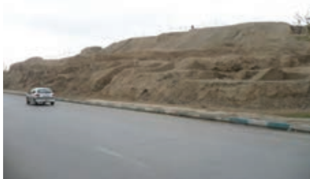
شکل ۴-۶- تپه اشرف باقی مانده بنای کهن سارویه (نزدیک پل شهرستان اصفهان)

از اصفهان پیش از اسلام؛ یعنی زمان هخامنشیان، اشکانیان و ساسانیان اطلاعات زیادی در دست نیست و آثار چندانی برجای نمانده است ولی آنچه مسلم است، از آنجا که استان اصفهان از لحاظ جغرافیایی در مرکز ایران واقع شده است، وجود دشت‌های وسیع و حاصل خیز و در برخی از مناطق، منابع آب فراوان - مانند زاینده رود - جاذبه‌هایی در آن ایجاد کرده است؛ از این رو، تمامی حاکمان در طول تاریخ نسبت به آن توجه ویژه داشته‌اند و تلاش همه‌جانبه آنها این بوده است که تسلط خود را بر این منطقه حفظ کنند. در دوران اساطیری، وجود داستان‌هایی مانند ماجرای کاوه آهنگر همان چهره‌آزاده که علیه ستم ضحاک قیام کرد و به کمک فریدون ملت ایران را از بند اسارت آزاد کرد و هم اکنون نیز در منطقه فریدن در روستایی به نام مشهد کاوه، آرامگاهی منسوب به این قهرمان ملی دیده می‌شود، نشان از مرکزیت قدرت سیاسی در این قسمت کشور دارد. وجود دژی بسیار بزرگ همانند اهرام مصر به نام کهندژ سارویه در حاشیه اصفهان امروزی که آثار آن تا هزار سال قبل هنوز برجای بوده و امروزه بخشی از آن در کنار پل شهرستان به نام تپه اشرف باقی مانده است و نیز بقایای آتشکده منسوب به عصر ساسانیان در ماریین اصفهان (کوه آتشگاه)، نمونه‌ای از آثار برجای مانده از پیش از اسلام است.