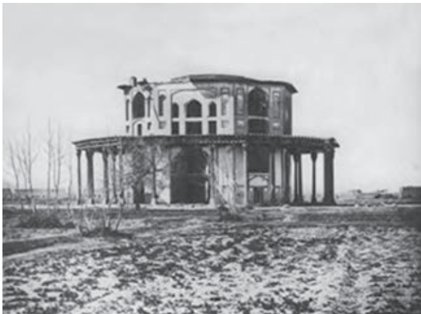
شکل ۱۱-۶- کاخ نمکدان که در زمان قاجاریه از بین رفته است.

به غیر از شهر اصفهان در سایر شهرها و حتی روستاهای استان نیز آثاری از دوره صفویه به چشم می خورد؛ مثلاً کاشان، خوانسار، نجف آباد (ایجاد شهر در زمان صفویه)، کوهپایه و نائین.