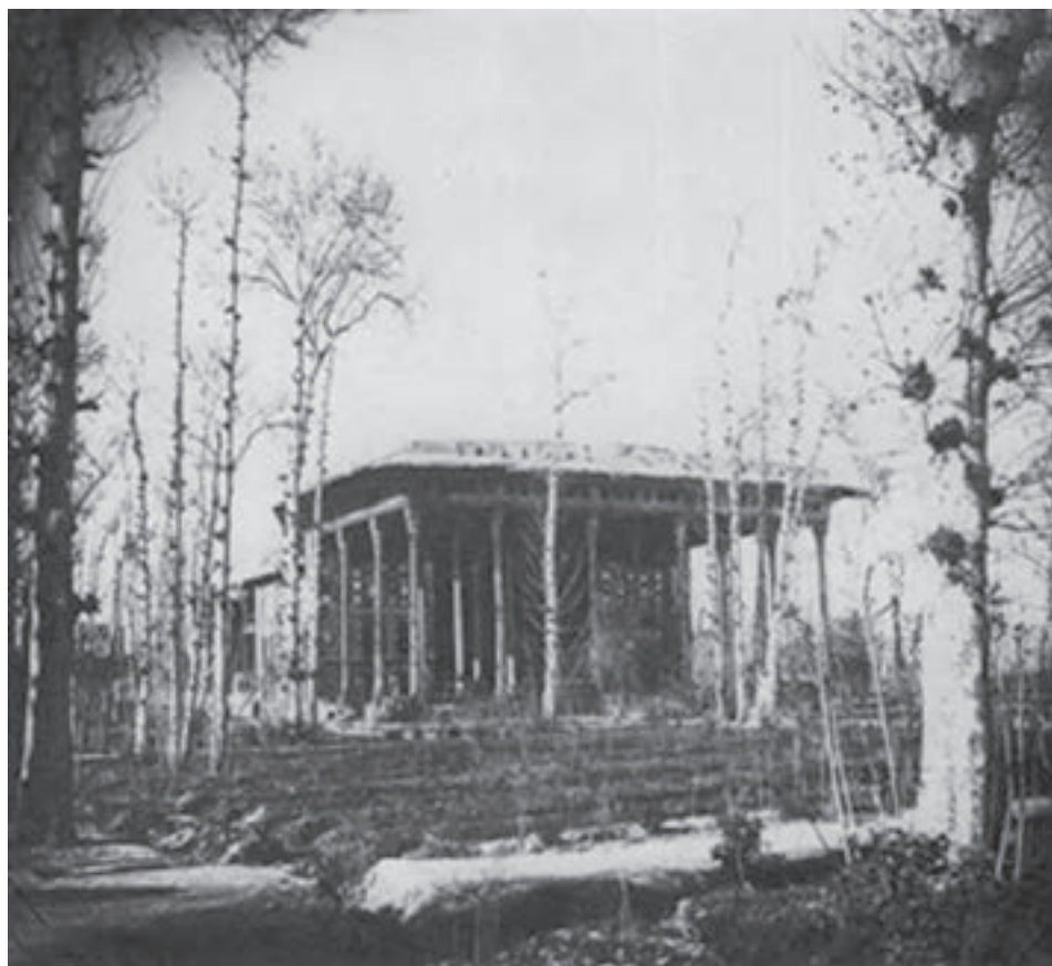
شکل ۱۲-۶- کاخ آینه‌خانه که در زمان قاجاریه از بین رفته است.