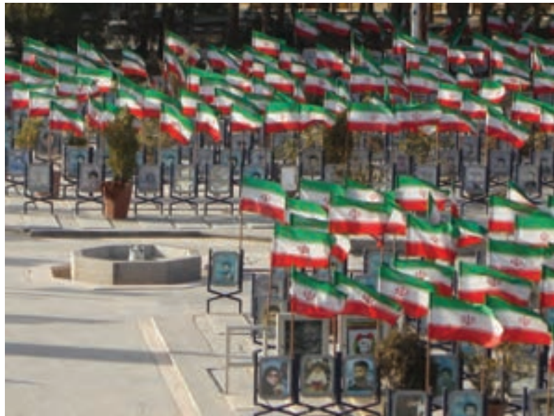
شکل ۱۷-۶- نمایی از گلستان شهدای اصفهان

مجموعهٔ چنین ارزش‌های کم‌نظیر تاریخی، فرهنگی و اجتماعی اصفهان باعث شد تا این شهر در سال ۱۳۸۵ از سوی سازمان کنفرانس اسلامی، به عنوان پایتخت فرهنگی جهان اسلام انتخاب شود. هم‌چنین در حال حاضر به عنوان پایتخت فرهنگ و تمدن ایران اسلامی نامگذاری شده است. جهت حفظ و گسترش این میراث ارزشمند چه باید کرد؟