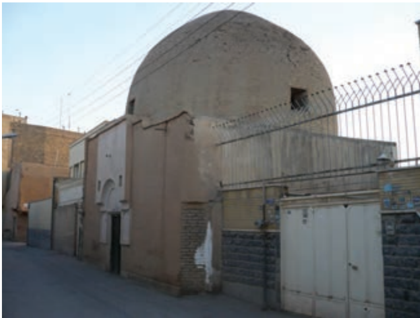
شکل ۱۳-۶- محل تدریس بوعلی سینا در اصفهان - خیابان ابن سینا

سلمان فارسی، یار صدیق پیامبر بزرگوار اسلام، از مردم این سامان بوده است و کاوه آهنگر، مبارز راه عدالت و آزادی، از مردم پرتیکان بود. در اوج درخشش تمدن اسلامی که ایرانیان از پیشگامان علوم و فنون اسلامی بودند، بسیاری از دانشمندان رشته‌های مختلف از این استان برخاسته یا زندگی علمی خود را در این سامان گذرانده‌اند. در قرن چهارم هجری قمری، شخصیت‌های برجسته‌ای چون حمزه اصفهانی، صاحب بن عباد، حافظ ابونعیم، ابن مسکویه، ابوالفرج اصفهانی، ابن سینا (گرچه در اصفهان متولد نشد ولی بیشتر آثار علمی او در این شهر شکل گرفت و شاگردان معروفی را در این شهر تربیت کرد) مدت زیادی به تألیف، پژوهش و تربیت شاگردان در این شهر پرداختند. از دوره سلجوقیان تا شروع دوره صفویه استان اصفهان علما و شعرای بسیاری را به خود دید که از آن جمله می‌توان به خواجه نظام‌الملک (مؤسس مدارس نظامیه)، راغب اصفهانی، عمادالدین کاتب، غیاث‌الدین جمشید کاشانی، جمال‌الدین عبدالرزاق و کمال‌الدین اسماعیل که هر کدام از مشاهیر عصر خود بوده‌اند، اشاره کرد.