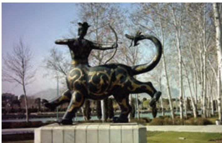
شکل ۳-۶- نماد شهر اصفهان. این تندیس نشانه چیست؟

از اصفهان پیش از اسلام؛ یعنی زمان هخامنشیان، اشکانیان و ساسانیان اطلاعات زیادی در دست نیست و آثار چندانی برجای نمانده است ولی آنچه مسلم است، از آنجا که استان اصفهان از لحاظ جغرافیایی در مرکز ایران واقع شده است، وجود دشت‌های وسیع و حاصل خیز و در برخی از مناطق، منابع آب فراوان - مانند زاینده رود - جاذبه‌هایی در آن ایجاد کرده است؛ از این رو، تمامی حاکمان در طول تاریخ نسبت به آن توجه ویژه داشته‌اند و تلاش همه‌جانبه آنها این بوده است که تسلط خود را بر این منطقه حفظ کنند. در دوران اساطیری، وجود داستان‌هایی مانند ماجرای کاوه آهنگر همان چهره‌آزاده که علیه ستم ضحاک قیام کرد و به کمک فریدون ملت ایران را از بند اسارت آزاد کرد و هم اکنون نیز در منطقه فریدن در روستایی به نام مشهد کاوه، آرامگاهی منسوب به این قهرمان ملی دیده می‌شود، نشان از مرکزیت قدرت سیاسی در این قسمت کشور دارد. وجود دژی بسیار بزرگ همانند اهرام مصر به نام کهندژ سارویه در حاشیه اصفهان امروزی که آثار آن تا هزار سال قبل هنوز برجای بوده و امروزه بخشی از آن در کنار پل شهرستان به نام تپه اشرف باقی مانده است و نیز بقایای آتشکده منسوب به عصر ساسانیان در ماریین اصفهان (کوه آتشگاه)، نمونه‌ای از آثار برجای مانده از پیش از اسلام است.