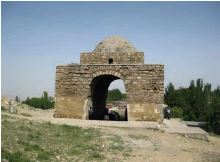
شکل ۵-۶- چهارطاقی نیاسر، مرکز انجام مراسم آیینی و اندازه‌گیری نجومی و تقویم‌نگاری در گذشته

در زمان فرمانروایی مادها، ایران دارای سه ایالت بزرگ بود که یکی از این ایالت‌ها بخش بزرگی از غرب استان اصفهان امروزی ایالتی به نام پارتاکن یا پارتیکان فریدن، فریدون‌شهر و چادگان امروزی به مرکزیت گابای (گی، جی) بود. اصفهان در زمان امپراتوری هخامنشیان به نام گابای یا گی شناخته می‌شده است. در عهد اشکانیان، حکومت ایران ملوک الطوائفی بود و بر هر یک از قسمت‌های مهم و وسیع آن، حکمرانی که لقب شاه داشت، فرمانروایی می‌کرد. در آن زمان، اصفهان یک ساتراپ (استان) به شمار می‌آمد. در دوره امپراتوری ساسانیان، آبادی‌های فراوانی در سطح استان اصفهان وجود داشته که آثاری از آنها باقی مانده است؛ مانند قلعه‌های متعدد ساسانی در آران و بیدگل (قلعه شرقی)، در سمیرم (تل نقاره و تل دهنه و گور دخمه طاقچه بت)، در فریدن (تپه خویگان)، در نائین (چهارطاقی شیرکوه، قلعه شیرکوه و چهارطاقی نخلک)، در نیاسر کاشان (چهارطاقی نیاسر)، در اصفهان (بنای آتشگاه و پل شهرستان) و بسیاری آثار دیگر. در این زمان، شهر اصفهان را سپاهان یا محلّ تجمع سپاه می‌نامیدند که واژه اصفهان از آن گرفته شده است. سپاهان محلّ سکونت و قلمرو خاندان‌های مهم حاکم و فرمانروایان و دژ مستحکمی برای ساسانیان بود.