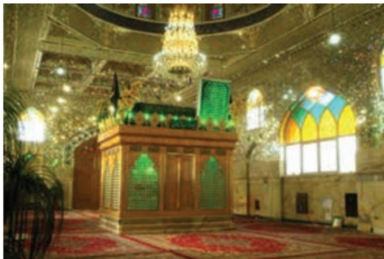
شکل ۶-۶- امامزاده اسحاق - خوراسگان

اسلام از سال ۲۳ هجری قمری وارد استان اصفهان شد. مردم این استان همانند دیگر ایرانیان از دین اسلام استقبال کردند. وجود بقاع سادات و امامزادگان در جای جای این استان، نشان از عشق و ارادت دیرینه این مردم نسبت به پیامبر بزرگوار اسلام و خانواده گران قدر آن حضرت دارد.