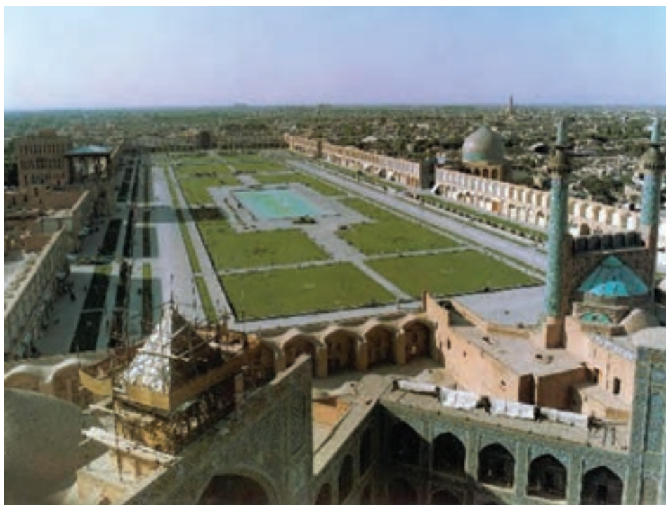
شکل ۹-۶- میدان امام (نقش جهان)

با مطالعه تاریخ صفویه درمی‌یابیم که شهر اصفهان پس از تأسیس این سلسله تا انتخاب آن به عنوان پایتخت، شهری آباد و پرجمعیت بوده است. شاه عباس اول صفوی در این اندیشه بود که پایتخت را از شمال غرب به مرکز ایران منتقل سازد تا از دشمن صفویان یعنی دولت عثمانی فاصله داشته باشد؛ از این رو، در سال ۱۰۰۰ هجری قمری، پایتخت را از قزوین به اصفهان منتقل کردند. تا سال ۱۱۳۵ هجری قمری، یعنی سال سقوط صفویه، اصفهان نه تنها در مرکز ایران بود بلکه تمام شرایط مورد نیاز برای یک پایتخت بزرگ را در خود داشت. به نظر شما، کدام شرایط برای پایتخت شدن اصفهان وجود داشت؟