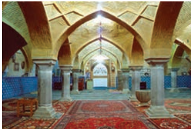
شکل ۷-۶- مسجد جامع شهرضا باقی مانده از زمان سلجوقیان

کوشش کردند. بناهای بسیاری ساخته شد که هنوز بسیاری از آنها پابرجاست. همچنین احداث چهارباغ ملکشاهی، آثار بسیار ارزشمند معماری و هنر اسلامی به ویژه در مسجد جامع اصفهان مانند گنبد نظام الملک و گنبد تاج الملک که به نظر باستان شناسان جهانی از آثار اعجاب انگیز محسوب می شوند، مسجد جامع اردستان، مسجد جامع زواره، مسجد جامع شهرضا، مسجد جامع گلپایگان نیز از جمله آثار ارزشمند معماری این دوره است.