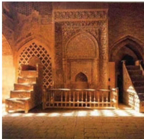
شکل ۸-۶- محراب الجایتو - جامع اصفهان

میدان عتیق (در محل فعلی میدان قیام اصفهان) نیز از میادین بزرگ عصر خود محسوب می شد که از آثار دوره سلجوقیان بود. این میدان به مرور زمان به دست فراموشی سپرده شده بود ولی به همت مسئولان شهر اصفهان در حال بازسازی است. ۳- دوره حکومت صفویه : اصفهان پایتخت دولت صفوی بود.