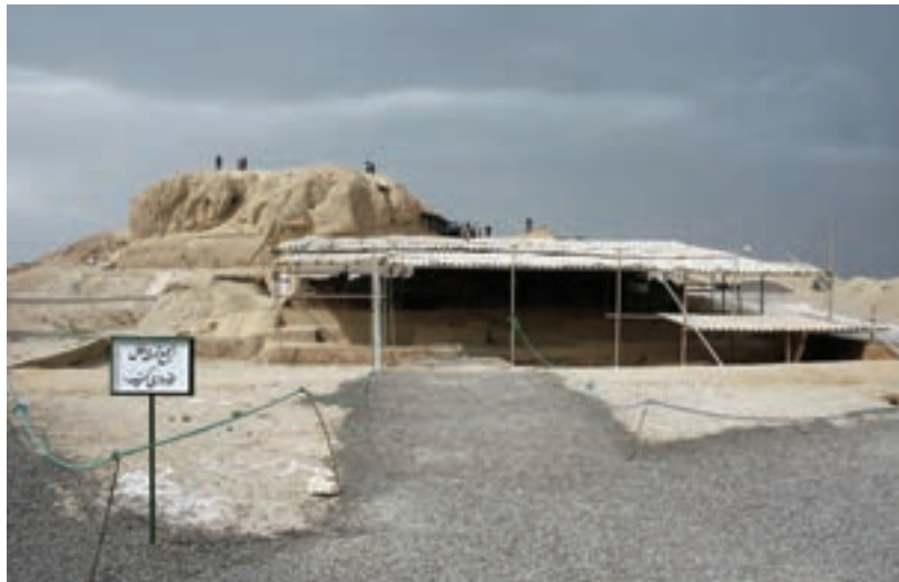
شکل ۲-۶- تپه‌های باستانی سیلک - کاشان

بیشتر این مکان‌ها مربوط به هزاره چهارم تا هزاره ششم قبل از میلاد است. برخی از مکان‌های باستانی استان عبارت‌اند از: تپه سیلک کاشان، محوطه باستانی اریسمان در شهرستان نطنز (هزاره چهارم ق.م)، تپه آشنا در چادگان (هزاره ششم ق.م)، تپه چغا حسن در گلپایگان (هزاره پنجم ق.م)، گورتان اصفهان (هزاره چهارم ق.م)، سبا در ورزنه (هزاره سوم ق.م)، تپه جوزک تیران و کرون (هزاره چهارم ق.م)، تل شاهی سمیرم (هزاره چهارم ق.م) و تپه‌های ننادگان فریدن (هزاره چهارم ق.م).