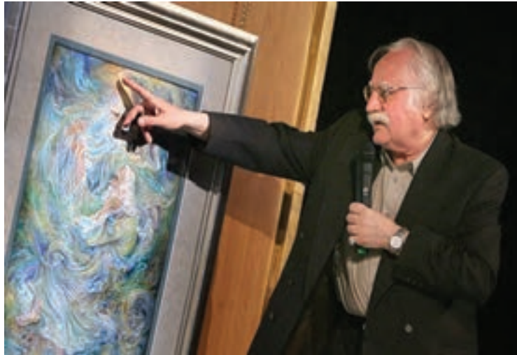
شکل ۱۵-۶- استاد محمود فرشچیان نقاش و طراح معروف معاصر