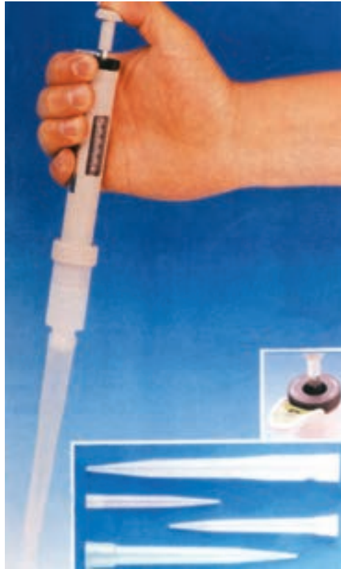
شکل ۱-۳- نمونه‌ای از میکروپیپت مخصوص نمونه برداری

عمیق که با وسایل دستی آب از آن می‌کشند نمونه برداری کنند. با رعایت نکات بهداشتی ریسمانی به گردن یک بطری بسته، پس از برداشتن در بطری آن را داخل چاه می‌کنند. وقتی که شیشه از آب پر شد آن را به کمک ریسمان بالا می‌کشند. پس از برداشت نمونه و بستن و مهر و موم کردن، ذکر مشخصات نمونه روی برجسب شیشه الزامی است و شیشه‌های حاوی نمونه را از آب پر نمی‌کنند بلکه \frac{3}{4} شیشه را از آب پر می‌کنند تا در موقع آزمایش بتوان آن را مخلوط کرد.