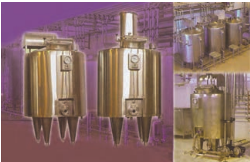
شکل ۱-۵- دستگاه پاستوریزاتور

۵- سرد کردن شیر تا دمای مایه‌زنی: دمای مناسب مایه‌زنی 42-45^{\circ}\text{C} است که این درجه یا با عبور دادن آب سرد از جدار دیگ دما و یا به وسیله‌ی عبور دادن شیر از سردکن‌های مخصوص تأمین می‌گردد در این مرحله باید به نکات زیر توجه نمود: الف- عمل هر چه زودتر انجام پذیرد، در غیر این صورت میکروارگانیسم‌هایی که نسبت به گرما مقاومت دارند (گرمادوست‌اند) ولی به علت دمای زیاد به حالت غیرفعال درآمده‌اند دوباره فعالیت خود را از سر گرفته، سبب بروز مشکلاتی می‌شوند.