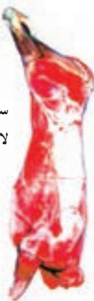
شکل ۱-۹- لاشه‌ی گوشت