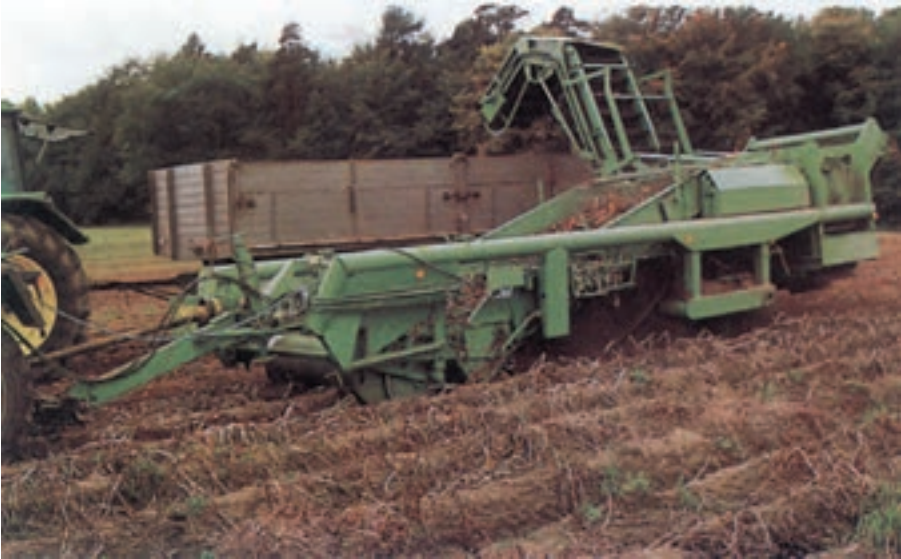
شکل ۷-۸ دستگاه برداشت سیب زمینی

کمباین سیب زمینی، دارای واحدهای عامل است که سیب زمینی‌ها را از خاک بالا آورده و آن‌ها بر روی نقاله غربالی لرزان منتقل می‌نماید تا خاکشان زدوده شود. سپس سیب زمینی‌ها درون تریلی یا مخزن کمباین ریخته می‌شود در روش نیمه مکانیزه سیب زمینی‌کنده شده توسط سیب زمینی‌کن به ردیف روی سطح زمین در مسیر حرکت تراکتور ریخته می‌شود تا با دست جمع‌آوری شوند (شکل ۷-۸).