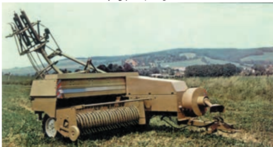
شکل ۵-۷ بسته بند