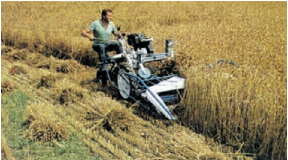
شکل ۷-۲ - دروگر دسته بند ۱