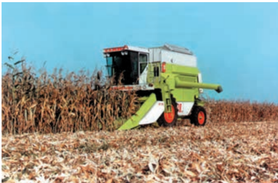
شکل ۶-۷ کمباین برداشت ذرت دانه‌ای

در صورتی که ذرت برای تولید دانه کشت شده باشد پس از خاتمه دوره رشد و نمو و زمانی که دانه‌ها سفت و رنگ برگ‌ها زرد شدند، میوه یا بلال ذرت را با ماشین بلال‌کن برداشت سپس با ماشین پوست‌گیر پوشش آن را جدا کرده آنگاه با ماشین دانه‌کن دانه‌ها را از چوب بلال جدا می‌کنند. در کمباین ذرت همه این اعمال یکجا صورت می‌گیرد. سپس دانه‌ها جهت رسیدن به رطوبت مطلوب در دستگاه‌های خشک‌کن قرار می‌گیرند.