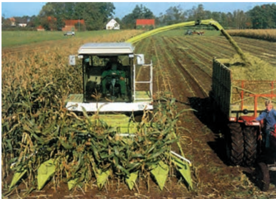
شکل ۷-۷ چابر ذرت علوفه‌ای