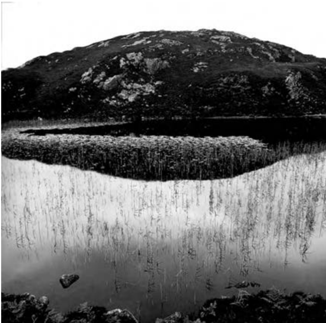
تصویر ۱۱- فن‌گادوین، ۱۹۸۴، انگلستان

عکاسی طبیعت : از آغاز اختراع عکاسی، همواره طبیعت برای هنرمندان منبع الهام و شگفتی بوده است. امروزه افراد بیش‌تری به عکس برداری از طبیعت علاقه نشان می‌دهند. آنها برای فراغت یا آرامش خاطر یا جست‌وجوی شخصی دست به این کار می‌زنند. عکاسی طبیعت از بزرگ‌ترین تا کوچک‌ترین موضوع‌های طبیعی را دربر می‌گیرد. عکاسی «نجومی» و «عکاسی میکروسکوپی» نیز شامل عکاسی طبیعت هستند. هم‌چنین می‌توان منظره‌های زیبایی مانند گل‌کاری باغ و فضای باغچه را عکاسی طبیعت در نظر گرفت (تصویر ۱۱).