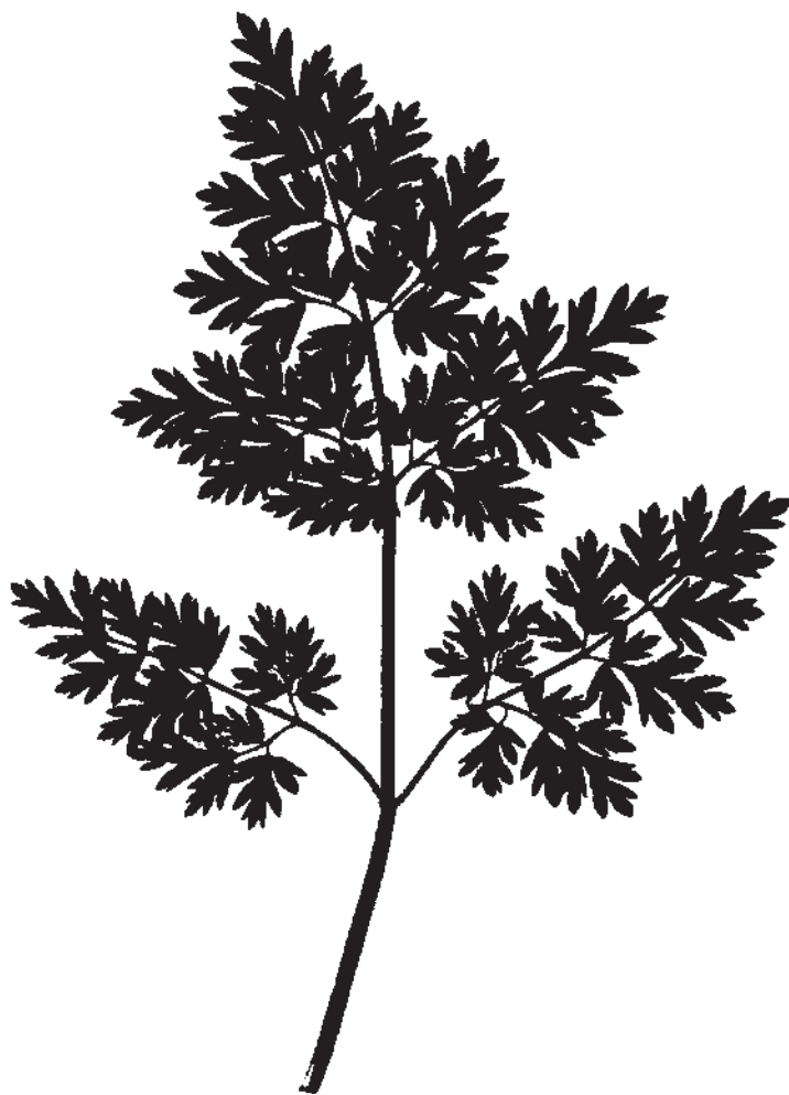
تصویر ۴- تالبوت، دهه ۱۸۴۰، انگلستان

ب) ایران: تاریخ دقیق ورود دوربین عکاسی به ایران مشخص نیست، اما زمان چندانی از اختراع عکاسی در فرانسه نگذشته بود که عکاسان خارجی روش «داگرتیپ» را در دوره قاجار به ایران وارد کردند. «ژول ریشارد» (ملقب به میرزارضاخان) نخستین کسی بود که در ایران به روش داگرتیپ عکس چاپ کرد. همگام با سایر تحولات عکاسی در اروپا در ایران نیز فن جدید، ابتدا از جانب عکاسان خارجی که به ایران سفر کرده بودند، سپس از طریق شاگردان ایرانی آنان به کار گرفته می‌شد. این روند آموزش، هم به شکل خصوصی، و هم در شکل مدون نظام تدریسی مدرسه دارالفنون صورت می‌گرفت. «فوکتی» ۲ که مهندس ایتالیایی بود روش «کلودیون تر» را بلافاصله پس از کشف آن در اروپا به تهران آورد. دیگر عکاسان خارجی نیز از تکامل حساسیت امولسیون و در نتیجه، کاهش زمان نوردهی، استفاده نموده و از همه جوانب زندگی ایرانیان در دوره قاجار عکس تهیه کردند. دو تن از این افراد عبارت‌اند از: «ارنست هولتز» ۳ و «آنتوان سوریوگین» ۴ . عکاسان ایرانی نیز در این زمان به فراگیری، سپس به عکاسی از محیط پیرامون خویش مشغول شدند که از میان آنها می‌توان به ناصرالدین شاه، میرزا ابراهیم خان عکاس‌باشی و میرزا عبدالله قاجار اشاره کرد.