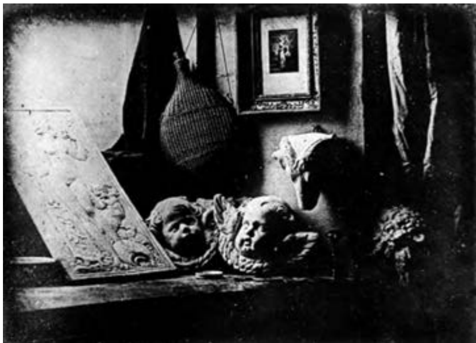
تصویر ۲- داگر، ۱۸۳۷، فرانسه

آرزوی دستیابی به عکاسی رنگی نیز از همان روزهای نخست قرن بیستم، ذهن مخترعان و عکاسان را برانگیخت. حرکت دنباله‌داری که از روش «اتوکروم» ساخته برادران «لومیر» در ۱۹۰۷ آغاز شده بود به نخستین تولیدات انبوه کارخانه «کداک» در دهه ۳۰ میلادی منجر شد. (تصاویر ۲، ۳ و ۴).