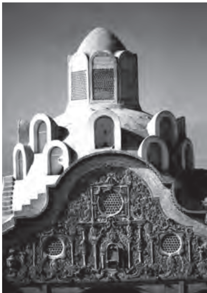
تصویر ۱- خانه بروجردی ها در کاشان

عکس ماحصل ترکیب نور (فیزیک) و ماده حساس به نور (شیمی) است. واژه «Photograph» به معنای «نورنگاری» است.