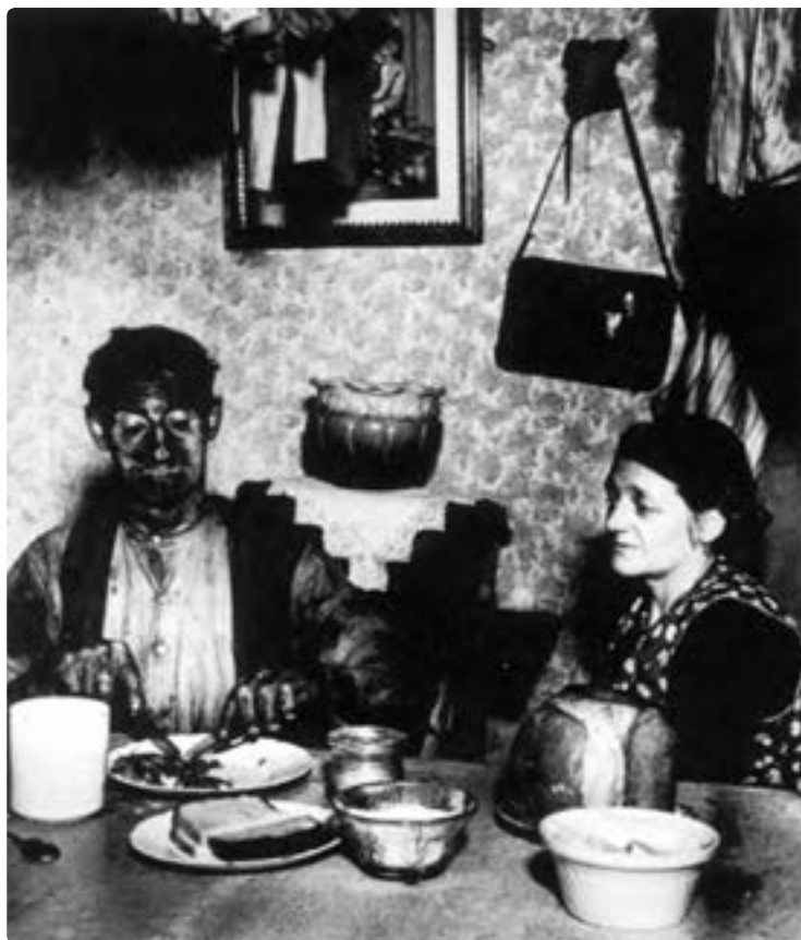
تصویر ۸ - بیل برانت، ۱۹۳۷، انگلستان

عکاسی صنعتی، تبلیغاتی: در این نوع از عکاسی، عکاس بنا به سفارش صاحب محصول از فرآورده‌ها و تولیدات کارگاه‌ها و کارخانه‌ها عکس می‌گیرد. هدف از چنین عکس‌هایی معرفی کالا به مشتریان در بهترین شکل ممکن است.