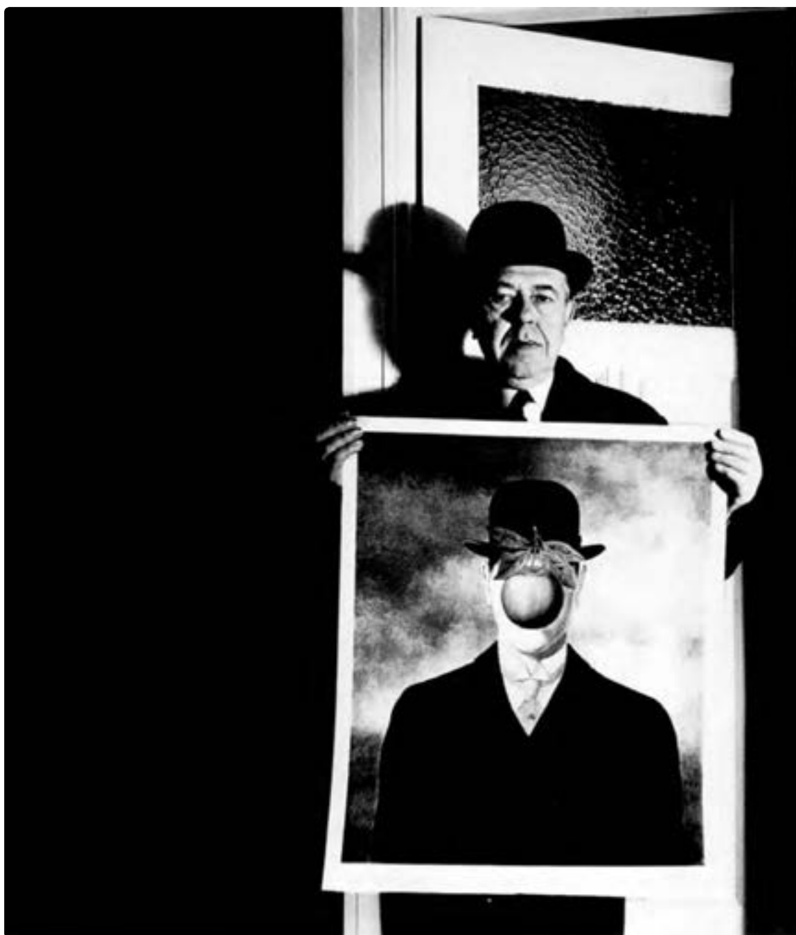
تصویر ۱۴- بیل برانت، ۱۹۶۶، انگلستان