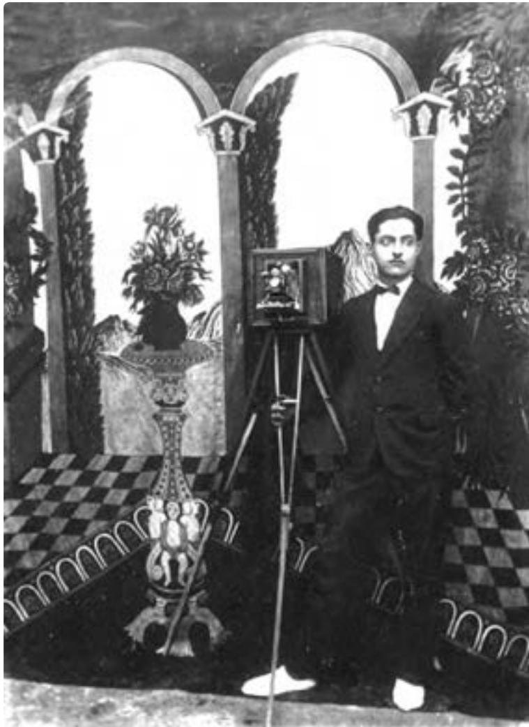
تصویر ۷- عکاس‌خانه فردوسی، شیراز، حدود ۱۳۲۵ شمسی