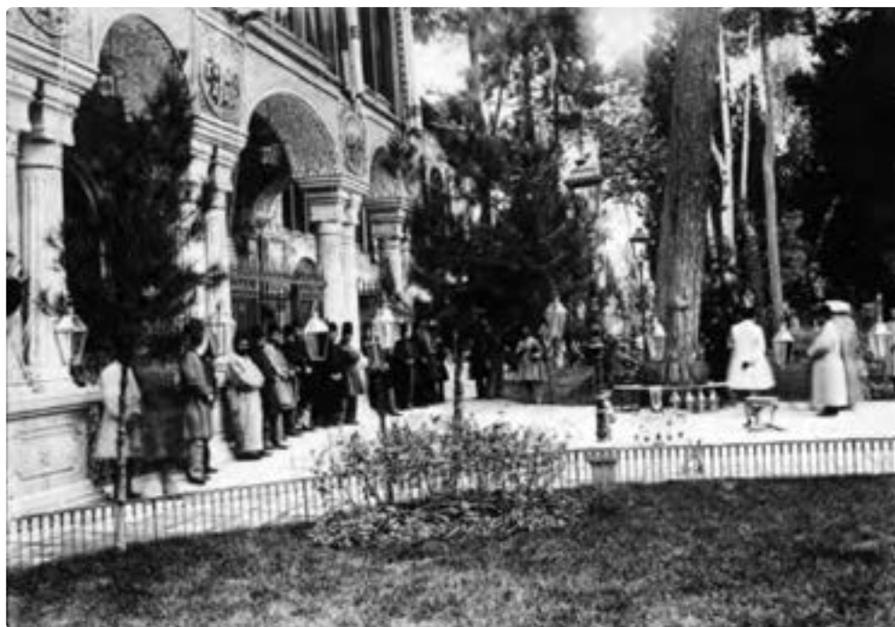
تصویر ۶ - تهران، دوره قاجار