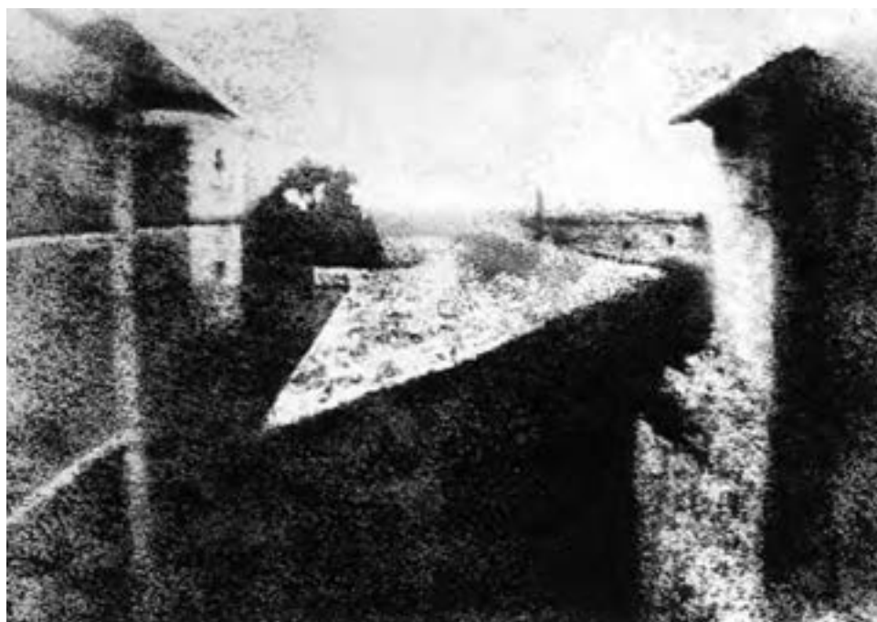
تصویر ۳- نیپس، ۱۸۲۶، فرانسه