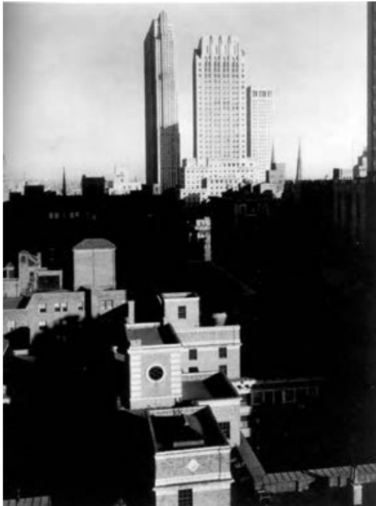
تصویر ۱۲- آلفرد استیگلitz، ۱۹۲۵، آمریکا

عکاسی عمومی: عکاسی عمومی، به آن نوع از عکس‌هایی اطلاق می‌شود که عموم مردم به منظور یادگاری و ثبت خاطرات از خود برجای می‌گذارند. انواع عکس‌های خانوادگی، عکس‌های مجالس، عکاسی در سفر، عکاسی لحظه‌ای و نظایر آن در شمار عکاسی عمومی هستند. باید گفت که این بخش از عکاسی دارای بیش‌ترین حجم مصرف مواد عکاسی و تولید عکس در دنیاست. این شاخه از عکاسی به‌طور همه‌گیر و شایع از اواخر قرن ۱۹ یعنی از زمانی آغاز گردید که دوربین‌های کوچک قابل حمل (Kodak) به بازار عرضه شد. با آمدن این دوربین‌های کوچک و ارزان، عموم مردم قادر شدند تا از زندگی خود عکس بگیرند. آنها برای چنین امری حتی به فراگیری مهارت‌های ظهور و چاپ نیز نیاز نداشتند. شعار تبلیغاتی کارخانه کداک در آن زمان این بود: «شما دکمه دوربین را فشار بدهید، ما بقیه کار را انجام می‌دهیم.»