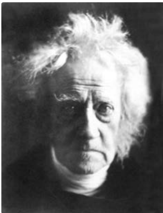
تصویر ۱۰ - مارگارت کامرون، ۱۸۶۷