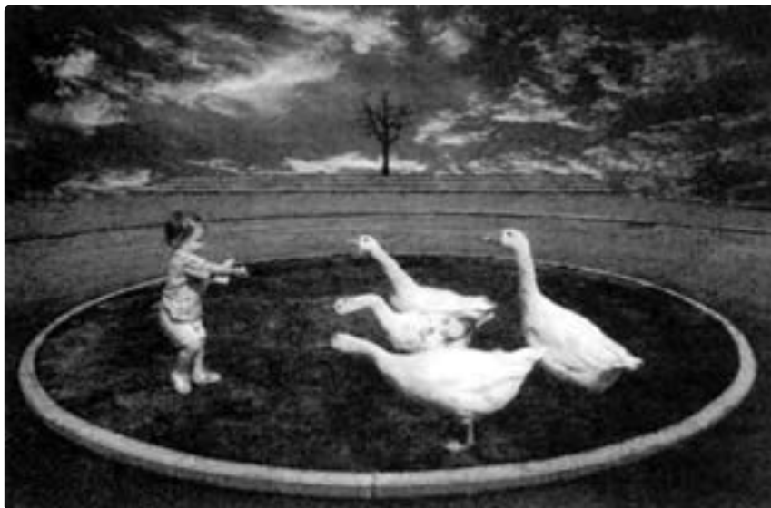
تصویر ۱۳- عکاسی عمومی

در این میان شاخص‌ترین عکاس، زنی هنرمند است، به نام «سالی مان» که در دو دههٔ آخر قرن بیستم از سه کودک خود در سنین کودکی و رشد و بلوغ در محیط خانواده عکاسی کرده است. وی بازتاب روحيات و عملکرد دنيای پيرامونش را در آينهٔ کودکان خود و در بستر خانواده‌اش جست و جو می‌کند (تصویر ۱۳).