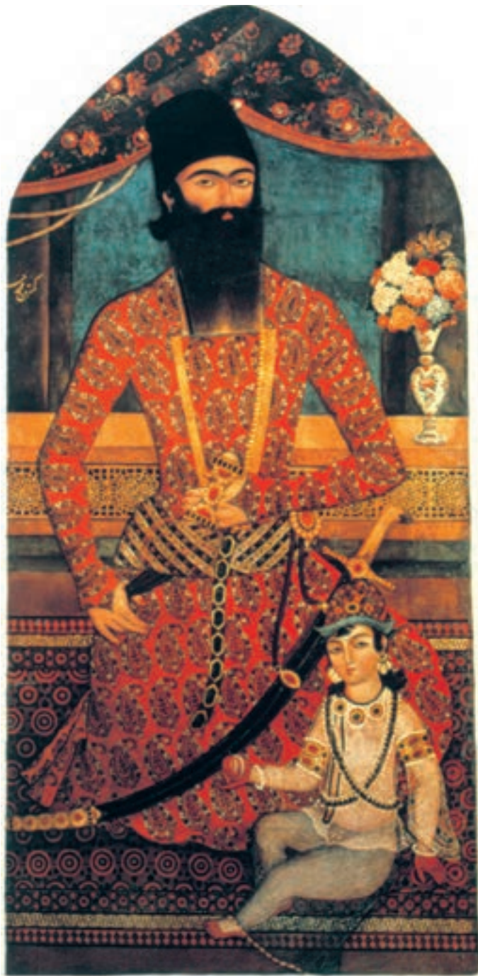
تصویر ۵۷-۲- شاهزاده‌ی قاجار، اثر محمد حسن افشار، رنگ روغن روی بوم، حدود ۱۲۴۰ هـ.ق