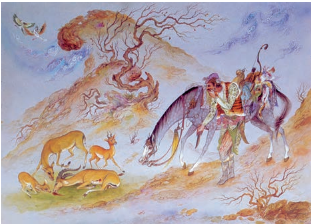
تصویر ۷۵-۲- شکار، اثر محمود فرشچیان، حدود ۱۳۴۰ ه.ش

د- نقاشی نوگرا (مدرن): نفوذ گسترده‌ی گرایش‌های نقاشی مدرن به داخل ایران، همزمان با جنگ جهانی دوم و به موازات رفتن رضاشاه از ایران و برقراری مختصر آزادی‌های اجتماعی و سیاسی، اتفاق افتاد. تشکیل دانشکده‌ی هنرهای زیبا، اعزام گسترده‌ی دانشجویان برای فراگیری هنر به اروپا و تدریس استادان اروپایی در مراکز هنری ایران و توسعه‌ی ارتباطات جهانی، عواملی بود که گروه‌های تحصیل کرده و نوجوی هنر را به سوی هنر مدرن اروپایی کشاند. البته این درحالی بود که حدود ۷۰ سال از پیدایش مکتب‌های مدرن در اروپا می‌گذشت.