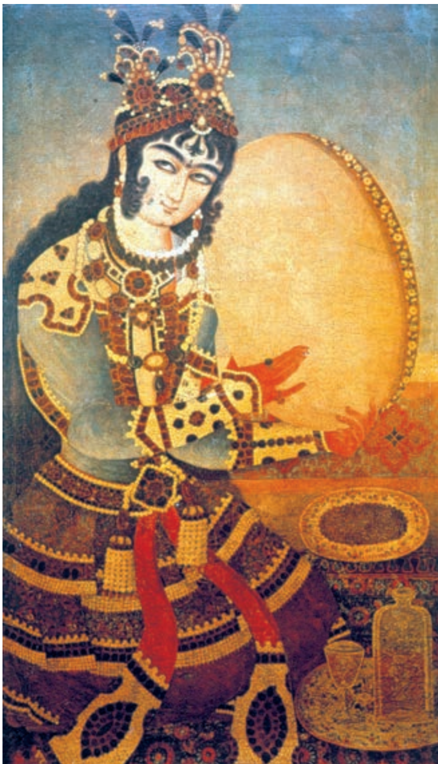
تصویر ۵۳-۲- نوازنده‌ی دف، اثر ابوالقاسم، رنگ روغن روی بوم، ۱۲۳۰ هـ.ق

موضوع اصلی نقاشی‌های عصر زند و قاجار انسان است ولی انسانی نمایشی که حالتی تصنعی دارد و به روشی تزینی تصویر می‌شود. در این تصاویر نقاش چندان در پی شبیه‌سازی نیست و بیش‌تر به شکوه و جلال ظاهری اهمیت می‌دهد. مردها غالباً افراد مهم جامعه، از جمله شاه و درباریان هستند ولی زن‌ها رامشگران و مطربان‌اند. اگرچه جایگاه اجتماعی زنان و مردان در نقاشی‌های زند و قاجار متفاوت است ولی هر دو در حالتی متظاهرانه و غرق در جواهرات، در کنار پنجره، پرده و یا زرده‌ای مشبک، در حالت روبه‌رو، که نگاهی باوقار و آرام به دور دست‌ها دارند، به تصویر درمی‌آیند. قراردادهای مشترکی در چهره و اندام آن‌ها رعایت می‌شود از جمله چشم‌های خماری، ابروان پیوسته، کمر باریک، دست‌های حنا بسته، و پوشاکی اشرافی که در آن روزگار متداول بود. در این نقاشی‌ها ترکیب‌بندی‌ها متقارن، ایستا و ساده است و اغلب کادرهای عمودی تصویر را یک یا دو پیکر در اندازه‌های بزرگ اشغال می‌کند. اندازه و شکل پرده‌های نقاشی بیش‌تر تابعی از شکل طاقچه‌ها یا فضایی است که تابلو در داخل آن نصب می‌گردد. ابزارها و لوازم موجود در