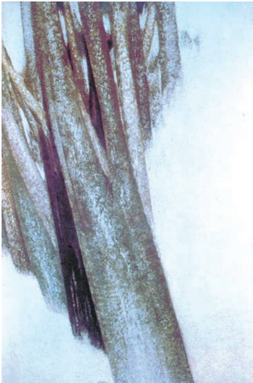
تصویر ۲-۷۶- درخت‌ها، اثر سهراب سپهری

نقش‌های چسباندنی (کولاژ) و یا از مواد و مصالحی متنوع شکل گرفته‌اند. از هنرمندان گرایش‌های مدرن در نقاشی ایران می‌توان به جلیل ضیاپور، جواد حمیدی، منصور قندریز، فرامرز پیلارام، حسین زنده‌رودی و سهراب سپهری و ... اشاره کرد (تصاویر ۲-۷۶ و ۲-۷۷).