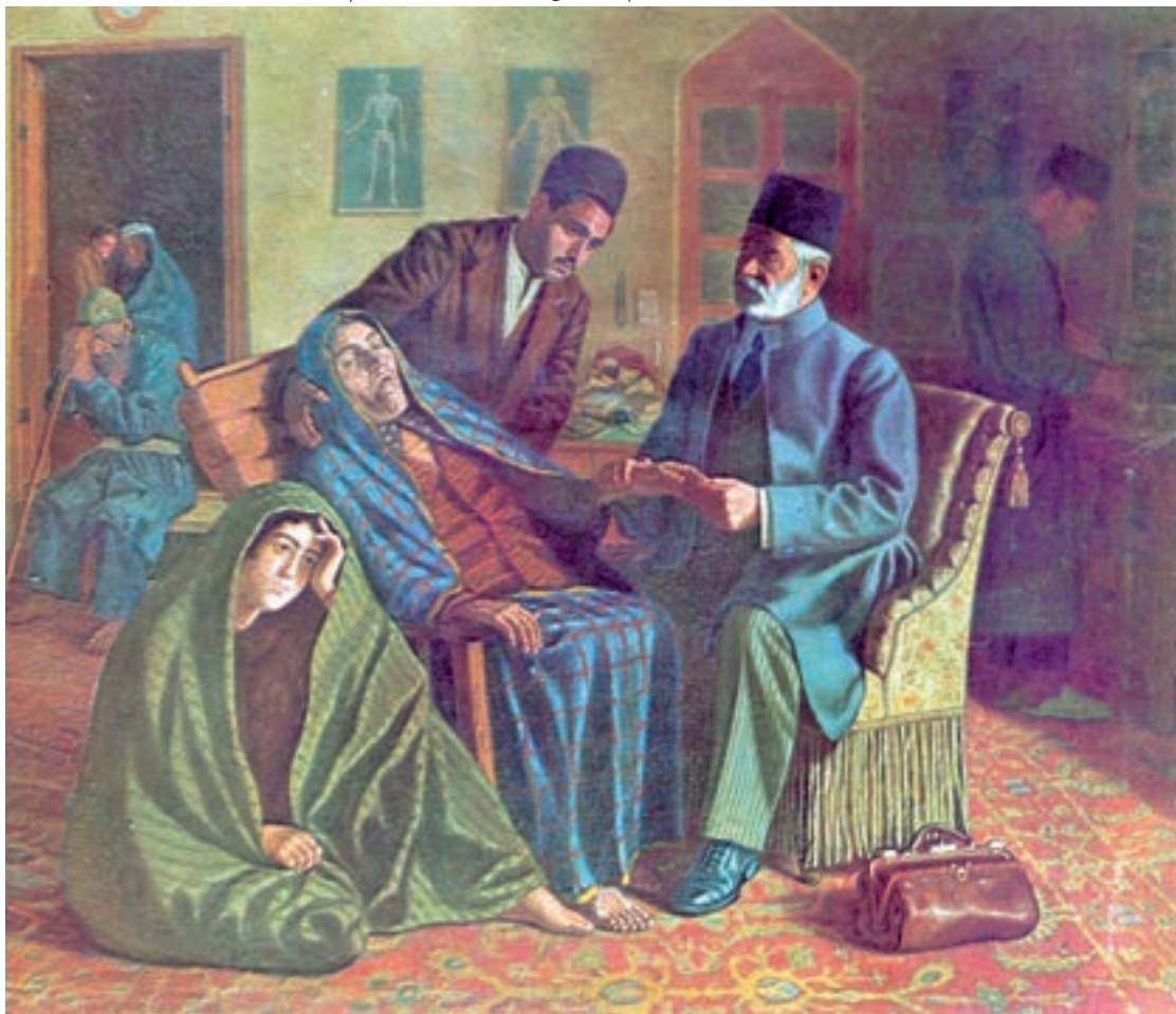
تصویر ۶۸-۲- طبیب و بیمار، اثر حسین شیخ، رنگ روغن روی بوم، ۱۳۱۵ ه.ش.