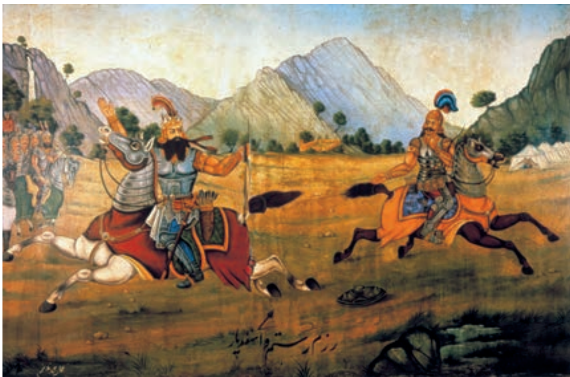
تصویر ۲-۷۰- جنگ رستم و اسفندیار، اثر محمد مدبّر، رنگ روغن روی بوم.

نقاشی قهوه‌خانه‌ای با نقاشانی هم‌چون حسین قولرآقاسی و محمد مدبّر در اوایل سده‌ی حاضر به اوج خود رسید و بر هنر معاصر تأثیر گذاشت. این نقاشان شاگردانی چون حسین همدانی، حسن اسماعیل‌زاده و عباس بلوکی‌فر را پرورش دادند. امروزه با رشد ارتباطات و رسانه‌هایی نظیر رادیو و تلویزیون، این‌گونه آثار روایی که با نقلی (و نمایش سنتی تعزیه) ارتباطی نزدیک داشت و دیگر کارکرد خود را از دست داده‌اند، از رونق افتاده است (تصاویر ۲-۷۰، ۲-۷۱ و ۲-۷۲).