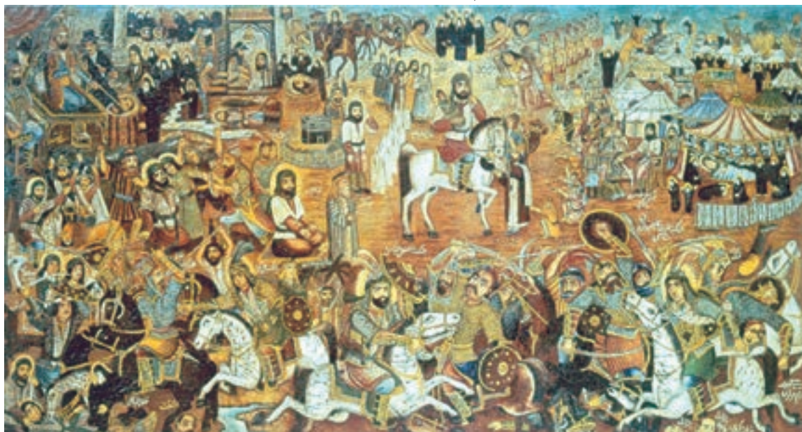
تصویر ۲-۷۱- مصیبت کربلا، اثر حسین قولر آقاسی، رنگ روغن روی بوم، حدود ۱۳۳۰ ه.ش.