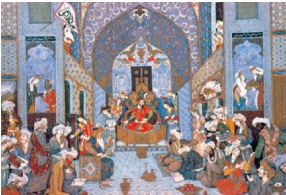
تصویر ۷۴-۲- فردوسی در بارگاه سلطان محمود غزنوی، اثر هادی تجویدی ۱۳۱۵ ه.ش.