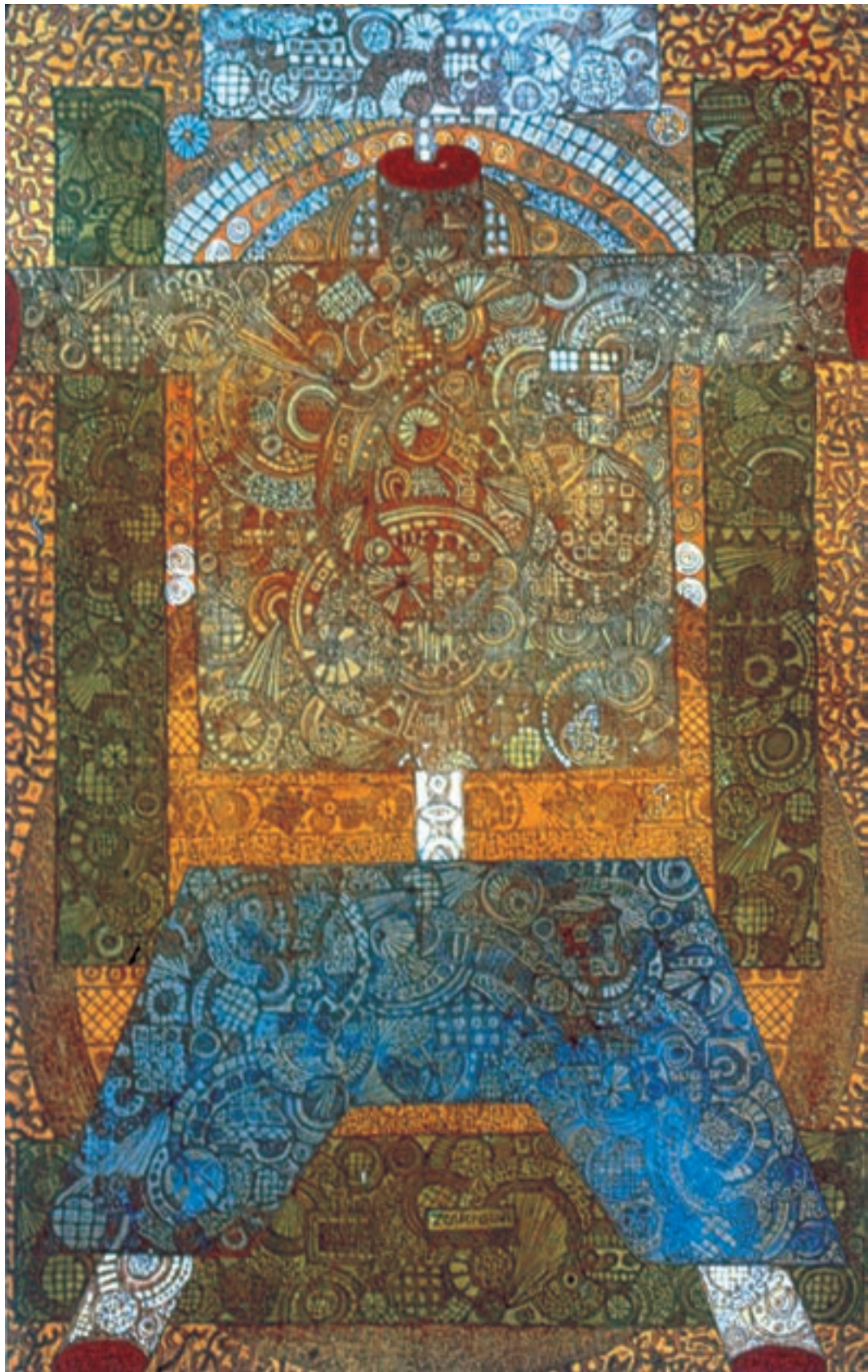
تصویر ۷۷-۲- بدون عنوان، اثر حسین زنده رودی