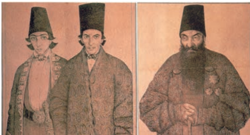
تصویر ۵۹-۲- طراحی از چهره برای چاپ در روزنامه، اثر صنیع الملک.