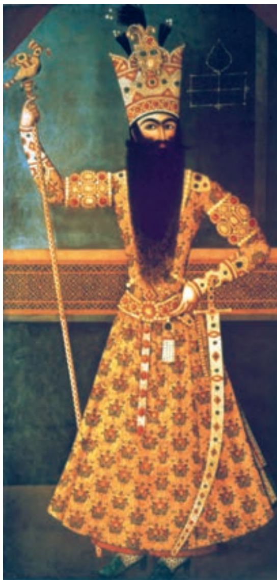
تصویر ۲-۵۵- فتحعلی شاه، اثر میرزا بابا، رنگ روغن روی بوم، ۱۲۱۳ هـ.ق

آویختن این قبیل تابلوها بر دیوار کاخ‌ها و تالارهای اشرافی نشانگر نوعی پیوند میان هنر نقاشی و معماری است در حالی که نگارگری پیوندی تنگاتنگ با ادبیات دارد.