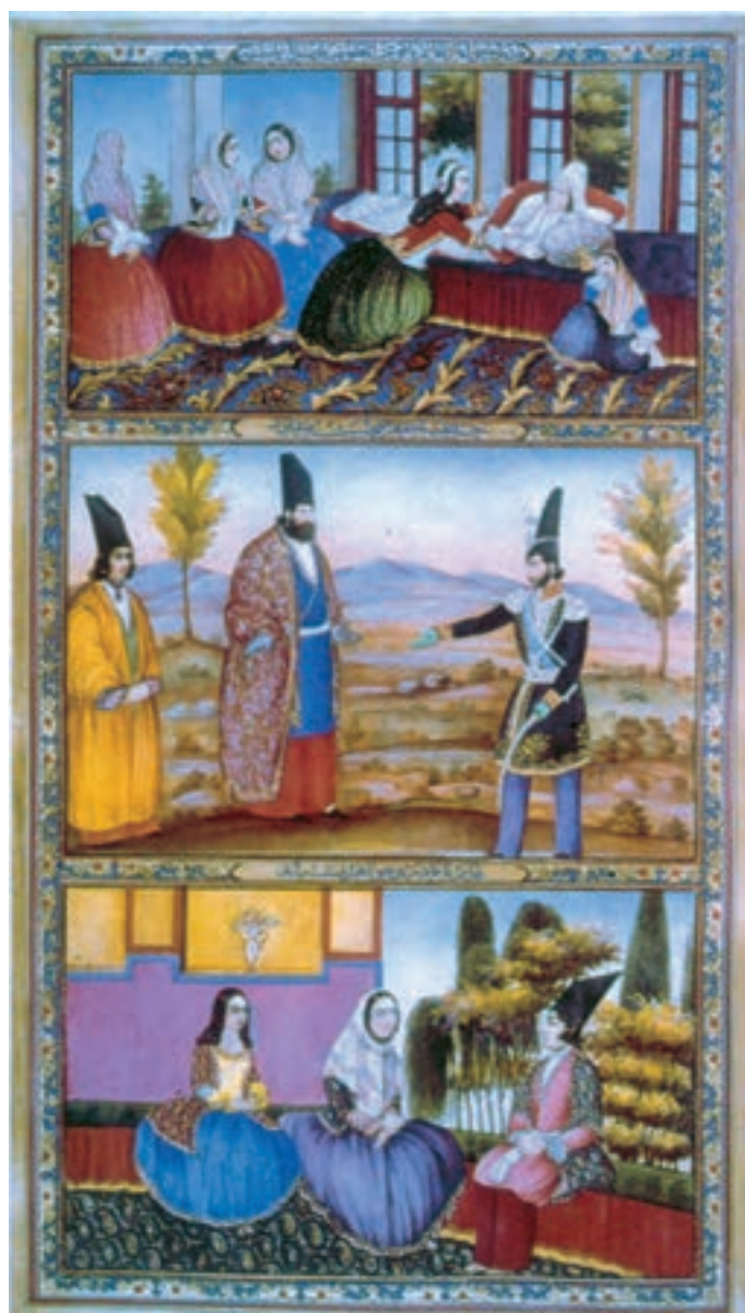
تصویر ۶۰-۲- برگگی از کتاب هزار و یک شب، اثر صنیع الملک، آب رنگ روی کاغذ ۱۲۷۵ هـ.ق.