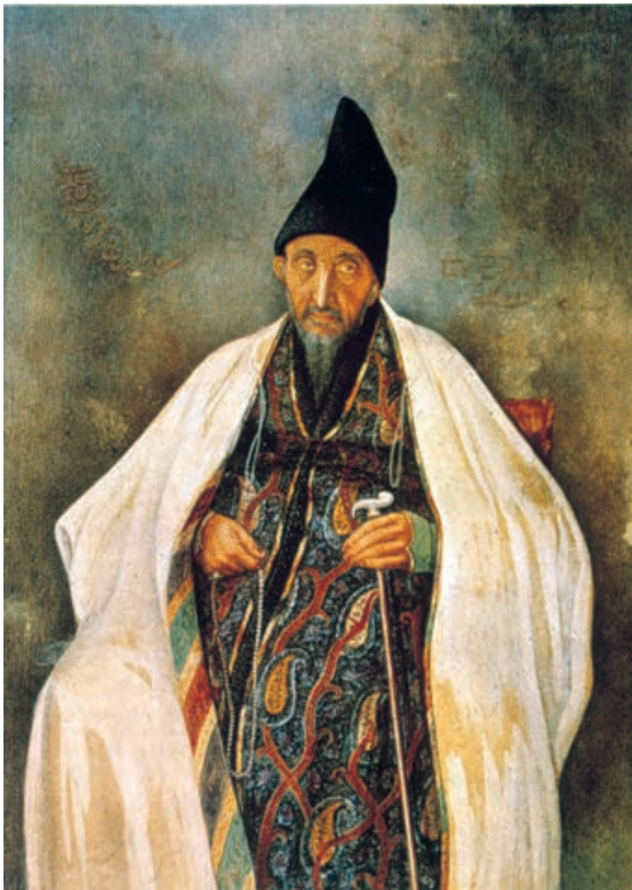
تصویر ۵۸-۲- چهره‌ی حاج‌میرزا آغاسی، اثر صنیع الملک، رنگ روغن روی بوم، حدود ۱۲۷۰ ه.ق

۱۳۱۳-۱۲۶۴ ه.ق) به ایران بازگشت و با لقب صنیع الملک به مقام نقاش‌باشی دربار منصوب شد. غفاری اگرچه اصول و قواعد علمی طبیعت‌نگاری را درک کرده بود ولی سنت‌های هنر ایرانی را نیز از نظر دور نمی‌داشت. برخی از اولین روزنامه‌های ایران، از جمله روزنامه‌ی دولت علیّه‌ی ایران، به همت وی و به دستور ناصرالدین‌شاه انتشار یافت، به همین مناسبت وی را می‌توان پدر هنر گرافیک ایران نامید. غفاری چهره‌پرداز توانایی بود و چهره‌ی رجال را برای چاپ در روزنامه‌ها طراحی می‌کرد. از طرفی دیگر، وی اولین مدرسه‌ی آموزش هنر نقاشی را باعنوان مجمع‌الصنایع در تهران راه‌اندازی کرد و در این مجموعه‌ی هنری شیوه‌های هنر واقع‌گرای نقاشی غربی را آموزش داد. هم‌چنین توسط ناصرالدین‌شاه مصورسازی کتاب هزارویک شب به او سپرده شد که توانست با کمک همکاران و شاگردانش بیش از هزار تصویر برای این کتاب ۶جلدی بسازد (تصاویر ۵۸- ۲، ۵۹- ۲ و ۶۰- ۲).