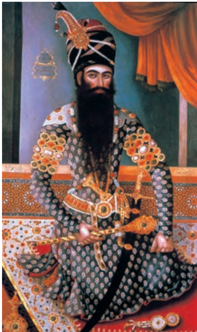
تصویر ۲-۵۴- فتحعلی شاه در لباس رسمی، اثر مهرعلی اصفهانی، رنگ روغن روی بوم، ۱۲۲۸ هـ.ق

در این پیکرنگاری‌ها ترکیب خوشایندی میان سنت‌های خاص نقاشی دو بعد نمای ایرانی و شیوه‌ی سه بعد نما و واقع‌پرداز اروپایی پدید می‌آید. نقاشانی هم‌چون آقاصادق و آقابقر این شیوه را در شیراز آغاز کردند ولی اوج انسجام ساختاری این آثار در نقاشی استادانی نظیر میرزا بابا و مهرعلی اصفهانی در عهد فتحعلی شاه قاجار دیده می‌شود. دستاوردهای تصویری این دو استاد به مدت پنجاه سال برای نقاشان نسل بعدی یعنی عبدالله‌خان، سیدمیرزا و ابوالقاسم سرمشقی مطمئن می‌شود (تصاویر ۲-۵۴، ۲-۵۵، ۲-۵۶ و ۲-۵۷).