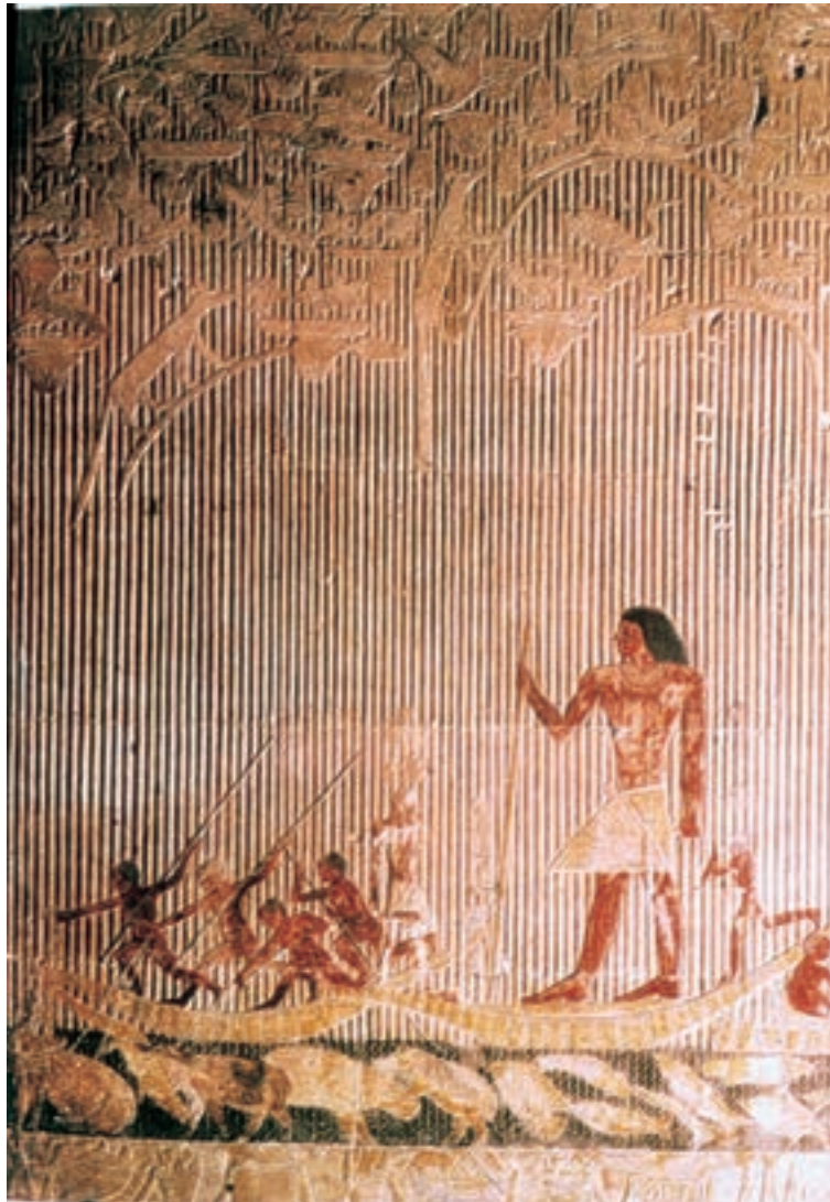
تصویر ۳-۴—نقش برجسته‌ی رنگ‌آمیزی شده، «تی» در حال شکار در مرداب، از مقبره‌ی تی، سقاره، حدود ۲۴۰۰ ق.م