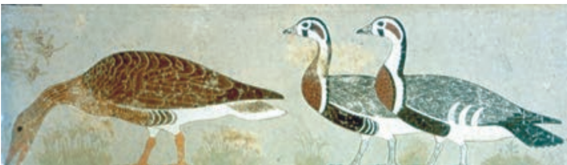
تصویر ۳-۷- غازهای مِدوم، بخشی از دیوار نگاره، بلندی حدود ۴۵ سانتی‌متر حدود ۲۶۰۰ ق. م.

با آن که در دیوار نگاره‌های مصری جنبه‌های قراردادی و خصلت‌های نمادین اهمیت دارد و این شیوه طی تقریباً سه هزار سال، کمابیش بدون تغییر اساسی، تکرار می‌شده‌اند ولی مهارت‌های فنی هنرمند گاه‌به‌گاه، در اجزای نسبتاً کم اهمیت، خود را نشان داده است، مثلاً در شکل حیوانات، و به‌خصوص پرندگان، که نزدیک به شکل طبیعی ترسیم می‌گردیده‌اند. (تصویر ۳-۷)