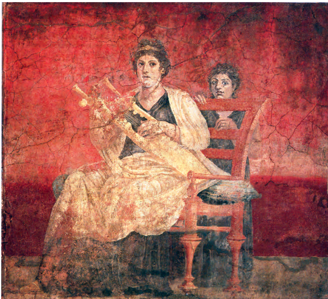
تصویر ۱۴-۴- زنی در حال نواختن ساز دیوار نگاری به شیوهی فرسک. سدهی نخست میلادی