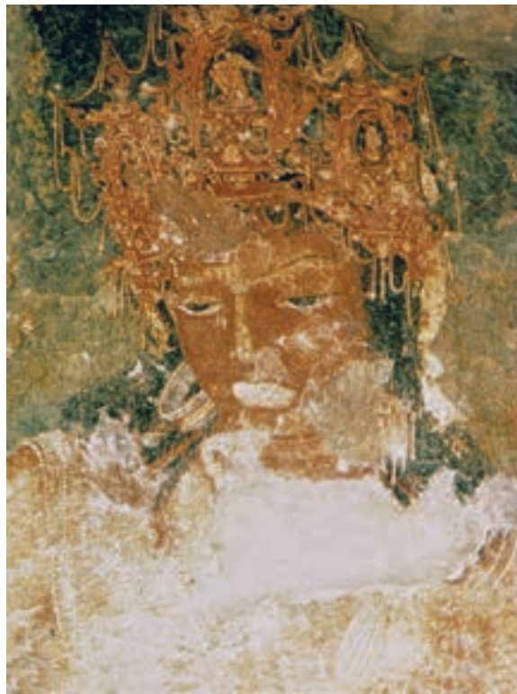
تصویر ۱۹-۳- بودای بزرگ، بخشی از دیوار نگاره‌های معابد غاری آجانتا، سده‌ی ۲ م

تصاویر در ترکیبی پیچیده، تمامی گستره‌ی داخلی معابد را فرا می‌گیرند. رنگ‌های سرخ، سبز و آبی و ارغوانی در نقاشی‌ها بارزترند. قلم‌گیری و تأکید بر خطوط پیرامونی در اغلب قسمت‌ها به چشم می‌خورد و این درحالی است که از حجم‌نمایی نیز چشم‌پوشی نشده است. کاربرد خط، سطح و حجم روابطی خوشایند را پدید می‌آورد که به پیوستگی عناصر تصویر در گستره‌ی سطوح دیوارها و سقف مدد می‌رساند (تصویر ۲۰-۳).