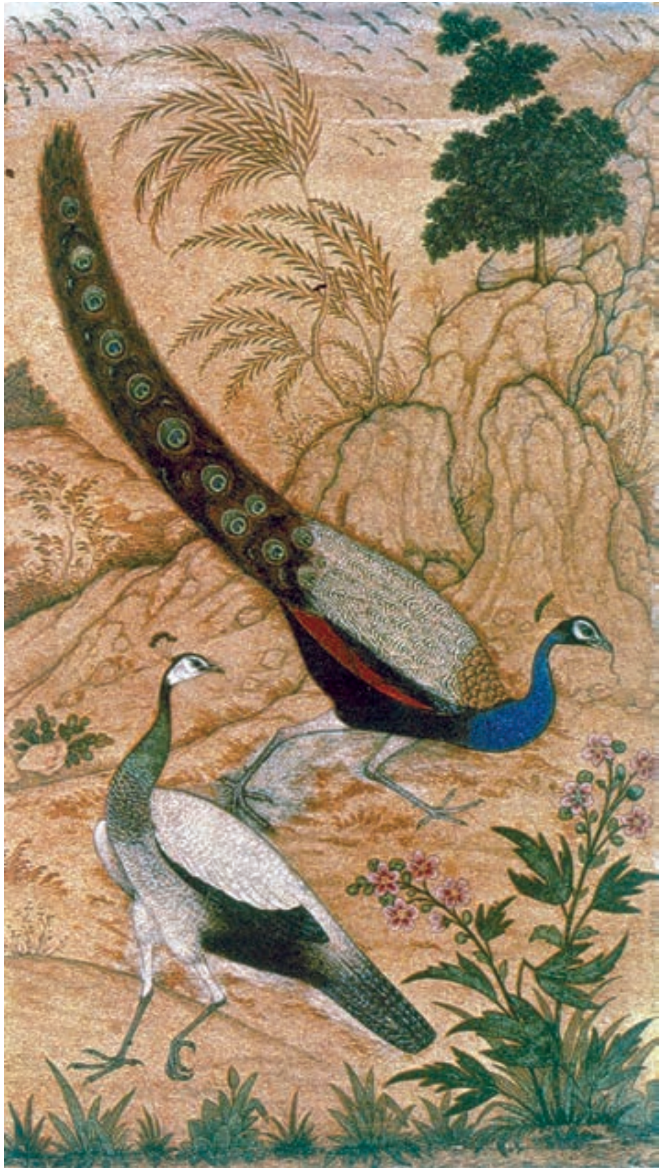
تصویر ۲۴-۳- طاوس‌ها، اثر منصور، رقعدهی مصور، آبرنگ روی کاغذ، سده‌ی ۱۷ م (۱۱ هـ.ق)