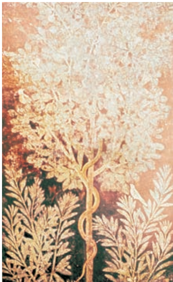
تصویر ۱۳-۴- نقاشی دیواری، نمایی از یک باغ سده‌ی نخست میلادی

۳- شیوه‌ی تزئینی: در این شیوه دورنما اهمیت خود را از دست داد و با استفاده از حلقه‌های گل و پیچک تزئینات بیش‌تر مورد توجه قرار گرفت. سطوح دیوار با شبه ستون‌های باریک جدا می‌شد و داخل هر قاب یک صحنه را جداگانه به تصویر می‌کشیدند (۲۰ ق.م ۶۰م). (تصاویر ۱۲-۴ و ۱۳-۴).