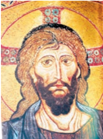
تصویر ۲۷-۴- دیوارنگاری به شیوهی موزائیک، حضرت مسیح. بخشی از اثر سدهی دوازدهم م.