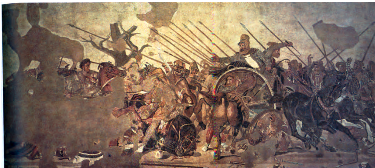
تصویر ۱۹-۴- دیوارنگاره به شیوهی موزاییک نبرد اسکندر و داریوش قرن سوم تا دوم ق.م (کپی رومی از اصل یونانی)