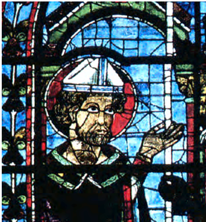
تصویر ۳۲-۴- شیشه نگاره، کلیسای شارتر فرانسه، قرن دوازدهم میلادی (بخشی از اثر)

۲- نقاشی روی پانل: در این شیوه پس از آماده‌سازی تخته‌های چوب بر روی آن‌ها نقاشی اجرا می‌شود. این پانل‌ها که برای تزین محراب کلیساها به کار می‌رفت، غالباً در چند حالت آماده می‌شد.