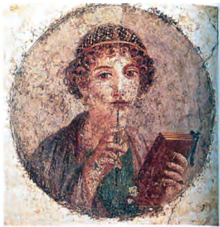
تصویر ۸-۴- چهره‌ی دختر جوان، نقاشی دیواری به دست آمده از پمپئی، سده‌ی نخست میلادی موزه‌ی ملی ناپل

رومی‌ها پس از به قدرت رسیدن امپراتوری روم، برای بازسازی نقاشی و پیکره‌های کلاسیک شدیداً تمایل داشتند از فرهنگ و هنر یونانی تقلید کنند. آن‌ها از دستاوردهای هنر یونان جهت ساخت پیکره و نقاشی و آرایش منازل خود استفاده کردند. امروزه با مطالعه‌ی نقاشی‌های دیواری دو شهر پمپئی و هرکولانوم به شیوه‌ی نقاشی یونان باستان و استفاده از آن روش‌ها در تزیین شهرهای رومی می‌توان پی برد. هرچند به صراحت می‌توان گفت که نقاشی‌های رومی کپی‌برداری از هنر یونانی است ولی با دقت در امضای تعدادی از نقاشی‌ها می‌توان فهمید که نقاشان یونانی در رم و سایر شهرهای ایتالیا کار می‌کردند (تصویر ۸-۴).