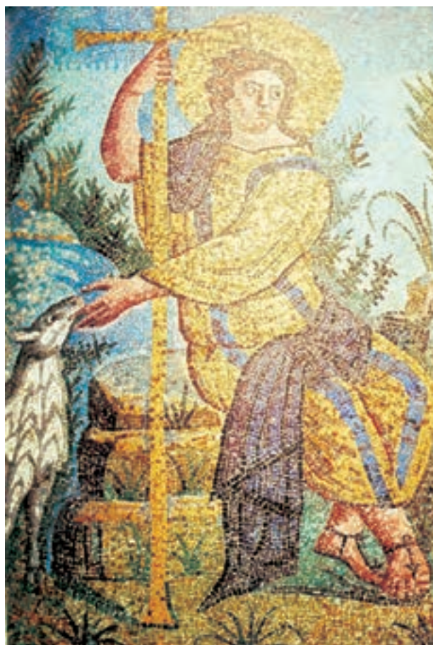
تصویر ۲۳-۴ دیوارنگاری به شیوه‌ی موزائیک حضرت مسیح در هیئت چوپان نیکوکار، راونا حدود ۴۲۵-۴۵۰ م