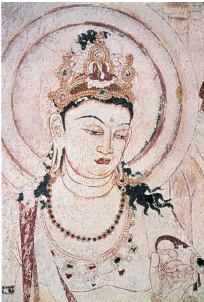
تصویر ۱۴-۳- نقاشی دیواری از معبد هوریوجی، سده‌ی هفتم میلادی، ژاپن در این تصویر تأثیرات نقاشی هندی، به‌ویژه دیوار نگاره‌های غار آجانتا، کاملاً مشهود است.

ژاپن مجمع الجزایری، سر برآورده از آب‌های اقیانوس آرام، در شرق سرزمین چین است. میراث و سنت‌های مشرق‌زمین، به‌خصوص چین، به نحو بارزی در تاریخ و فرهنگ ژاپنی بازتاب یافته است. هنر ژاپنی تقریباً در تمامی مراحل تحول خود از هنر چینی مایه گرفت. هم مواد و هم روش‌های مورد استفاده‌ی هنرمندان ژاپنی غالباً چینی بود و حتی مضمون‌های هنرشان نیز عمدتاً ریشه‌ی چینی داشت. هرچند هنرمندان ژاپنی، گه‌گاه موضوعاتی را از تاریخ یا اساطیر خود و از مذهب شینتو ۱ برمی‌گزیدند. هم‌چنین آیین بودایی، که از سده‌ی شش میلادی وارد ژاپن شد، عامل نیرومندی در تحول مذهب و هنر ژاپنی بود (تصویر ۱۴-۳).