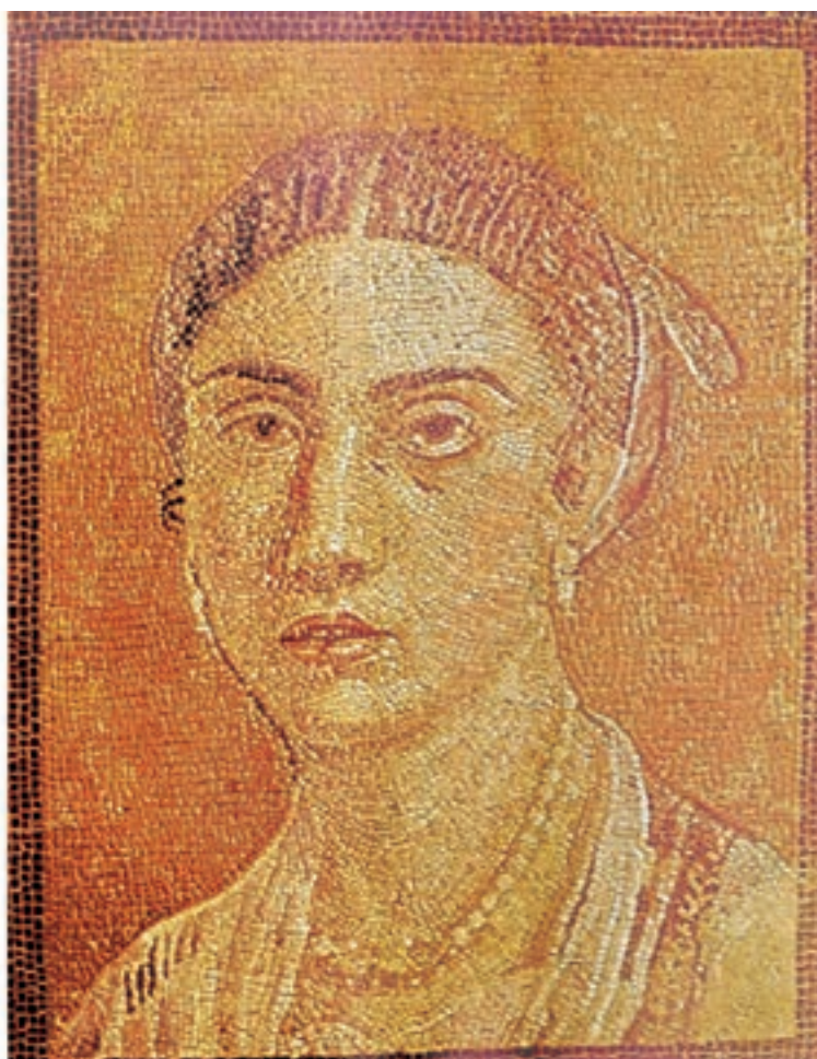
تصویر ۲۰-۴- دیوارنگاره به شیوهی موزاییک، چهره‌ی یک زن رومی