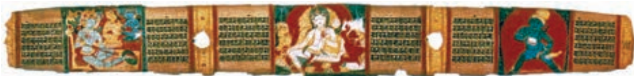
تصویر ۲۲-۳- خلاصه‌ی یک متن کهن، نقاشی بر روی برگ نخل، سده‌ی ۱۱ م

ب) کتاب آرای: در هند سابقه‌ی هنر کتاب‌آرایی کم‌تر از دیوارنگاری است. قدیمی‌ترین کتاب‌های مصور هندی که به حدود سده‌های دهم و یازدهم میلادی مربوط می‌شوند نوعی از کتاب بود که با برگ نخل ساخته می‌شد و در جعبه‌های جلد مانند نگه‌داری می‌شد. هم صفحات و هم جلد را گاهی با نقاشی می‌آراستند. این کتاب‌ها عمدتاً حاوی مضامینی آیینی و مذهبی بود که برخی ویژگی‌های آن یادآور دیوار نگاره‌های پیشین بود (تصویر ۲۲-۳).