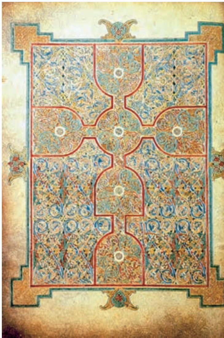
تصویر ۲۹-۴- انجیل لیندیس فارن، سده‌ی هشتم میلادی