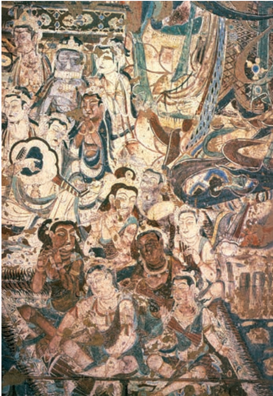
تصویر ۲۰-۳- نوازندگان بودایی، دیوارنگاره، آجاتا، سده ۷ م

اندازه‌ی مختلف پیکرها نشانگر نوعی پرسپکتیو مقامی ۱ است. اندام‌ها در حالتی پرتحرک و سرزنده، که بازتابی از رقص و نمایش مذهبی در هند است، به تصویر درآمده‌اند. اگرچه موضوع و محتوای این تصاویر با جهان ملکوتی مربوط است اما در عین حال توصیفی از دنیای نفسانی نیز هست. اصولاً یکی از ویژگی‌های هنر هند، از جمله در نقاشی‌های پرستشگاه‌ها و در تصاویر کتاب‌ها، آن است که مفاهیم دینی و معنوی را به صورتی دنیوی و زمینی نشان می‌دهد. به عبارت دیگر صحنه‌ها و پیکرها به وضوح عواطف نفسانی و خواست‌های جسمانی را می‌نمایانند. درحالی که این‌ها فقط بازتابی نمادین از اندیشه‌های عارفانه است (تصویر ۲۱-۳).