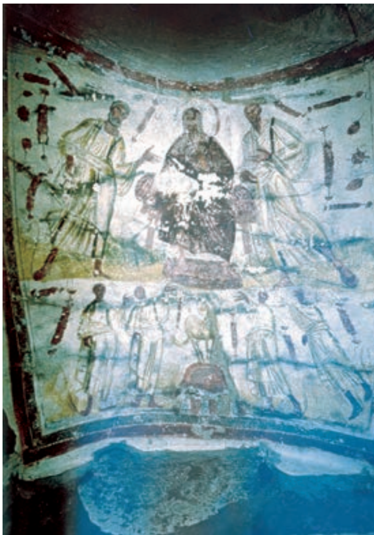
تصویر ۲۱-۴- نقاشی بر سقف یک کاتاکومب، رُم