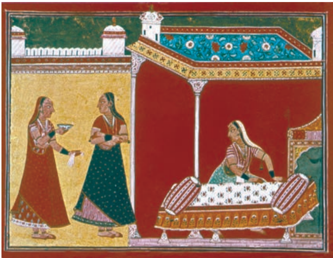
تصویر ۲۳-۳- آماده‌سازی اتاق برای کریشنا، آبرنگ روی کاغذ، سده‌ی ۱۸ م