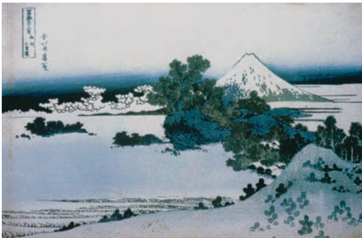
تصویر ۱۸-۳- چشم انداز کوه فوجی، باسمه، سده‌ی نوزدهم. اثر کاتسوشیگا هوکوسای هوکوسای با تسلط بر فرم و تحولی، که در منظره نگاری خاور دور به وجود آورد، بر نقاشی سده‌ی نوزدهم اروپا بسیار اثر گذاشت