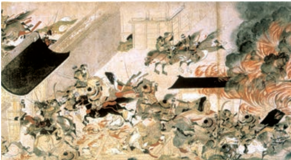
تصویر ۱۵-۳- سوزاندن کاخ سانجو، سده‌ی ۱۳ میلادی، بخشی از یک طومار افقی به طول ۶۸۵ سانتی‌متر. این طومار بزرگ بیانگر یک قیام اجتماعی است.

قطع رابطه با چین در اواخر سده‌ی نهم میلادی زمینه‌ای برای رشد نقاشی بومی فراهم ساخت. ژاپنی‌ها در نقاشی روی دیوارها یا بر سطح پرده‌های چند لته (پاراوان)، که برای آرایش کاخ‌های سلطنتی و کوشک‌های اشراف تهیه می‌شد، مناظری از سرزمین خویش را به تصویر می‌کشیدند. علاوه بر این، طی سده‌های ۱۱ و ۱۲ میلادی هم‌گام با رشد ادبیات ملی، آنان داستان‌های عامیانه و ادبی، مضمون‌های تاریخی و زندگی‌نامه‌ها را بر روی طومارهای افقی تصویرسازی می‌کردند. اگر چینیان نقاشی طوماری را عمدتاً برای منظره‌نگاری به کار می‌بردند، ژاپنی‌ها آن را به خدمت تجسم رویدادهای زندگی گرفتند، ترکیب‌بندی این طومارها برحسب جریان وقایع به چند بخش تقسیم می‌شود. قلم‌گیری نازک و سریع، رنگ‌های غالباً درخشان، و تجسم فضا از زاویه‌ی دید بالا از ویژگی‌های این طومارهای ژاپنی به‌شمار می‌رود. در این گونه نقاشی‌ها جلوه‌های طبیعت‌گرایانه و تزئین با هم آمیخته شده‌اند. (تصویر ۱۵-۳).