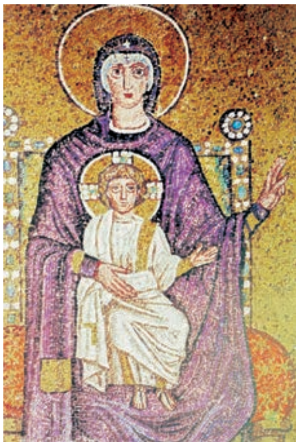
تصویر ۲۴-۴ دیوارنگاری به شیوه‌ی موزائیک، بیزانس، مادونا (حضرت مریم و مسیح کودک) حدود سده‌ی ششم م.

هنر بیزانس تا سده‌ی ششم م، مراحل تکوین خود را پیمود و در هنر موزاییک تبلور یافت. بهترین آثار موزاییک بیزانس را در شهر راونا و در کلیسای سان‌ویتاله ۱ می‌توان یافت. (تصاویر ۲۳-۴ الی ۲۷-۴)