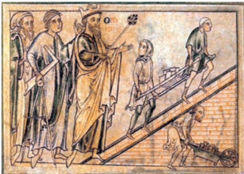
تصویر ۳۰-۴- طراحی ماتیو، پاریس در وقایع نام‌های صومعه‌ی رومن، پادشاه به همراه معمار خود از محل ساختمان یک کلیسای جامع دیدن می‌کند. قرن سیزده میلادی