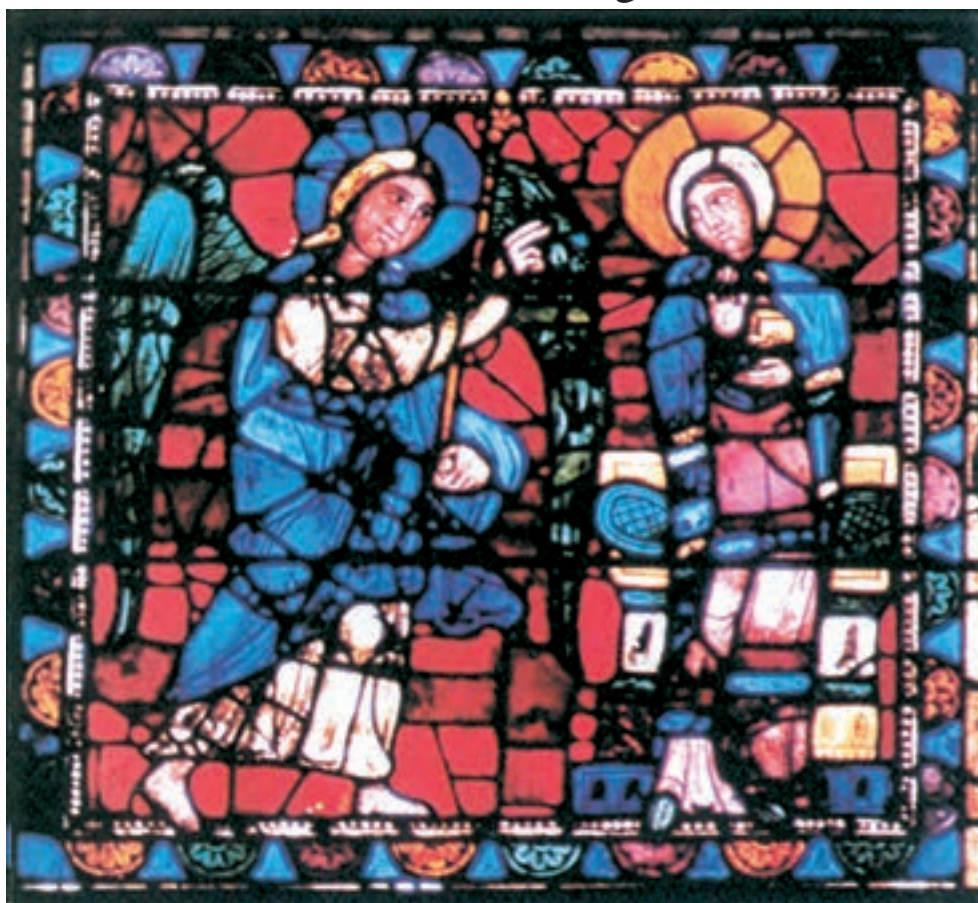
تصویر ۳۱-۴- شیشه‌نگاره، عید بشارت، کلیسای شارتر سده‌ی سیزدهم میلادی

۱- شیشه‌نگاره ۲ : در این تکنیک طرح مورد نظر را بر روی سطح صاف می‌کشیدند و با تکه‌های شیشه‌ی رنگی و منقوش آن را پر می‌کردند. سپس بین شیشه‌های منقوش را با نوارهای سربی پُر می‌کردند. نوارهای سربی در نگه‌داری طرح اهمیت به‌سزایی داشت. هنر شیشه‌نگاره عمدتاً در تزئین پنجره‌های کلیسا به‌کار می‌رفت. کلیسای شارتر در فرانسه نمونه‌ی برجسته‌ی این نوع تزئین است.