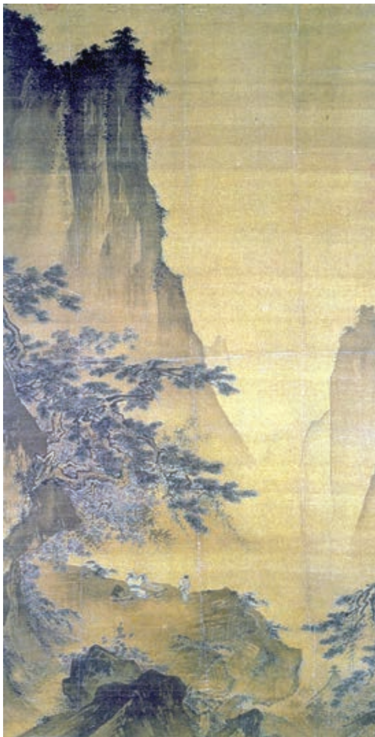
تصویر ۱۲-۳- منظره‌ی زیر نور ماه، مرکب روی ابریشم، سده‌ی ۱۳ م، تومار عمودی

در کنار نقاشی‌های چینی غالباً نوشته‌هایی نیز دیده می‌شود که ممکن است یک قطعه شعر، اظهار نظر خود هنرمند و یا کلماتی ستایش‌آمیز از جانب یک دوست یا یک مجموعه‌دار باشد. علاوه بر این امضای نقاش را نیز در پای اثر می‌توان ملاحظه کرد که نشانه‌ای از اعتبار اجتماعی اوست (تصویر ۱۲-۳).