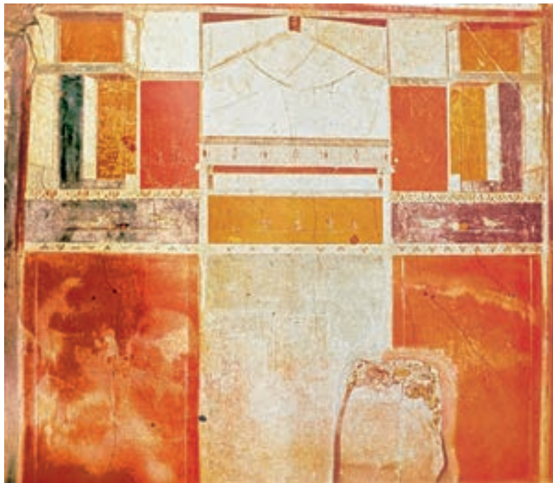
تصویر ۹-۴- شیوه‌ی ساده، قرن دوم ق.م

۱- شیوه‌ی ساده یا مرمرین: در این سبک هیچ عنصری از واقعیت وجود ندارد و فقط نقاش نمای سنگ مرمر را به روی دیوار در قاب‌های مشخص نقاشی می‌کرد (۲۰۰ ق.م، ۶۰ ق.م) (تصویر ۹-۴).