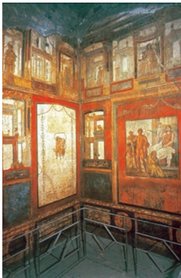
تصویر ۱۲-۴- نقاشی دیواری، خانه‌ی وتی؛ سده‌ی نخست میلادی

۴- شیوه‌ی پیچیده: این شیوه، تلفیقی از سه روش قبل است. بدین معنا که نمای مرمرین در حاشیه‌ی دیوار قاب‌بندی و تزئینات و دورنما توأمأً به کار گرفته می‌شد. در این شیوه نقاشی تصاویر طبیعت بی‌جان و موضوعات روزمره در کنار هم به نمایش درمی‌آمد (۶۰ م ۷۹م). (تصاویر ۱۴-۴ الی ۱۶-۴).