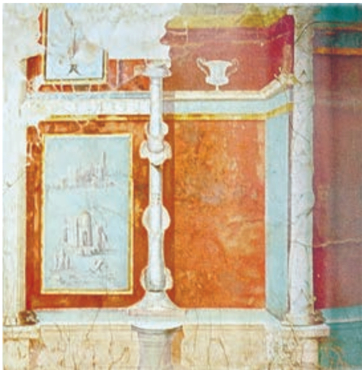
تصویر ۱۰-۴- نقاشی دیواری سدهی اول ق.م

۲- شیوهی معماری گونه: در این شیوه هنرمند تصویر ستون و قاب پنجره را چنان نقاشی می‌کند تا بیننده توهم عمق و فضا نماید. در واقع ناظر با نگاه خود از فضای داخل به فضای بیرون هدایت می‌شود (۶۰ ق.م، ۲۰ ق.م) (تصاویر ۱۰-۴ و ۱۱-۴).