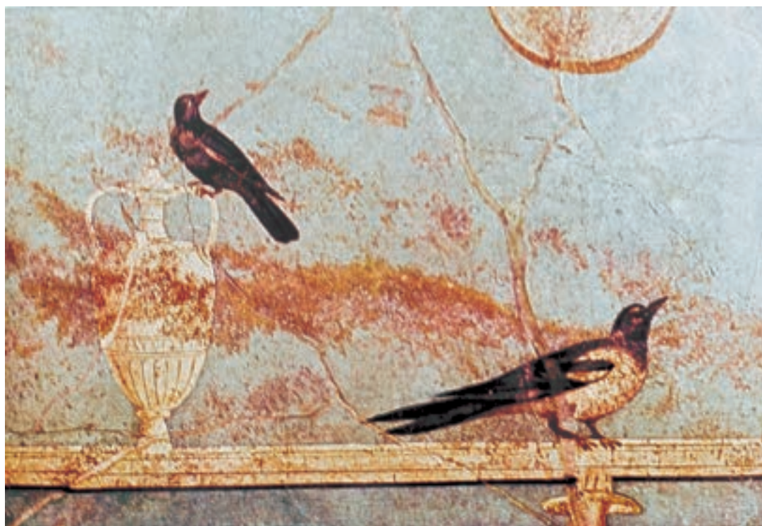
تصویر ۱۵-۴- دیوارنگاری به شیوهی فرسک