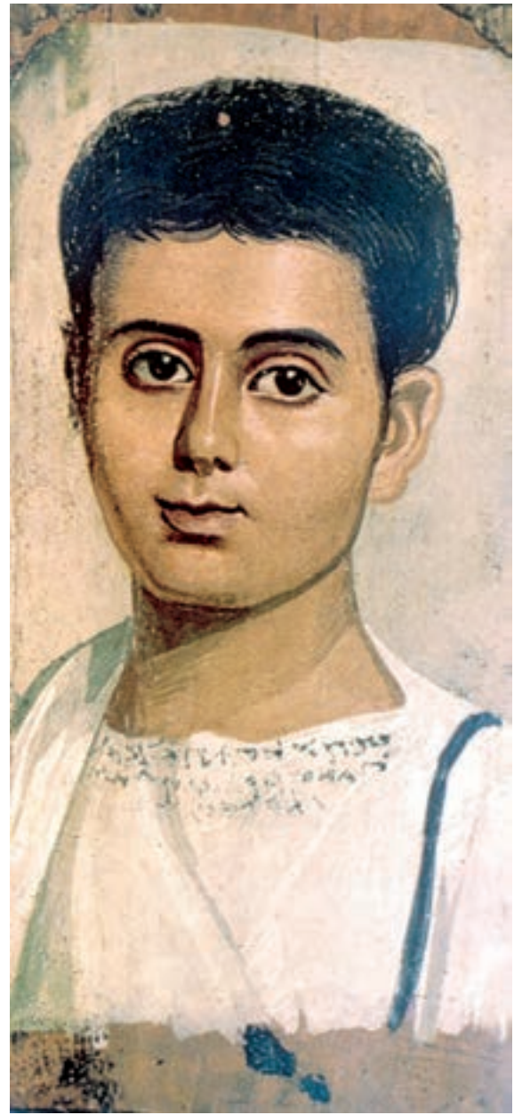
تصویر ۱۷-۴- چهره پسر از اهالی فیوم ۱ . مصر قرن دوم ب. م

یکی دیگر از هنرهایی که رومی‌ها به آن علاقه نشان می‌دادند. هنر موزائیک ۲ کاری بود. آن‌ها جهت تزئین منازل و پوشش کف بناها و دیوار ساختمان‌ها از این شیوه استفاده می‌کردند و جهت هم‌گامی با شیوه‌های نقاشی سعی می‌کردند اسلوب‌های عمق‌نمایی ۳ و برجسته‌نمایی و سایه‌روشن کاری را با استفاده از خرده‌سنگ و خرده‌شیشه‌های بسیار ریز رعایت کنند.