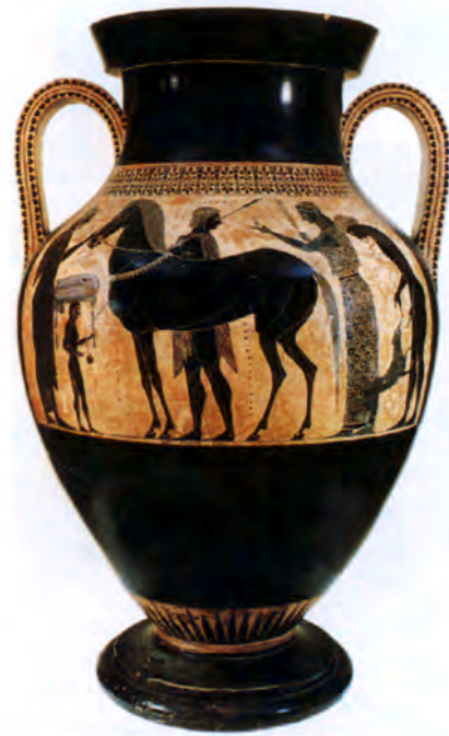
تصویر ۴-۳- گلدان با نقش سیاه (سیاه گون)، محل نگهداری موزه واتیکان

۳- دوره‌ی کلاسیک یا عصر طلایی ۲ : در این دوره مجسمه‌سازی و کنده‌کاری روی سنگ‌های قیمتی و سکه‌سازی رواج پیدا کرد. نقاشان نیز سعی نمودند با نمایش دقیق اجزای بدن و توجه به حرکت‌های زیبا و موزون و تغییر اندازه‌ی اجزا با تکیه بر مشاهدات عینی خود با سایر هنرمندان همگام باشند (تصویر ۴-۵).