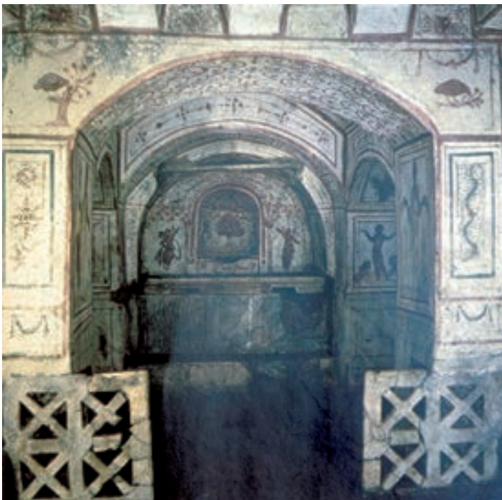
تصویر ۲۲-۴- نقاشی دیواری درون دهلیزهای یک کاتاکومب، رُم، سده‌ی چهارم میلادی