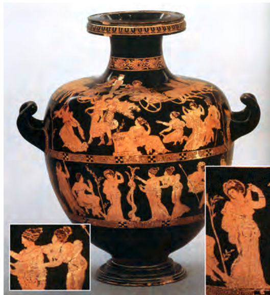
تصویر ۴-۵- گلدان با نقش سرخ (سرخ گون) حدوداً ۴۰۰ ق.م، محل نگهداری بریتیش موزه‌ی لندن

۳- دوره‌ی کلاسیک یا عصر طلایی ۲ : در این دوره مجسمه‌سازی و کنده‌کاری روی سنگ‌های قیمتی و سکه‌سازی رواج پیدا کرد. نقاشان نیز سعی نمودند با نمایش دقیق اجزای بدن و توجه به حرکت‌های زیبا و موزون و تغییر اندازه‌ی اجزا با تکیه بر مشاهدات عینی خود با سایر هنرمندان همگام باشند (تصویر ۴-۵).