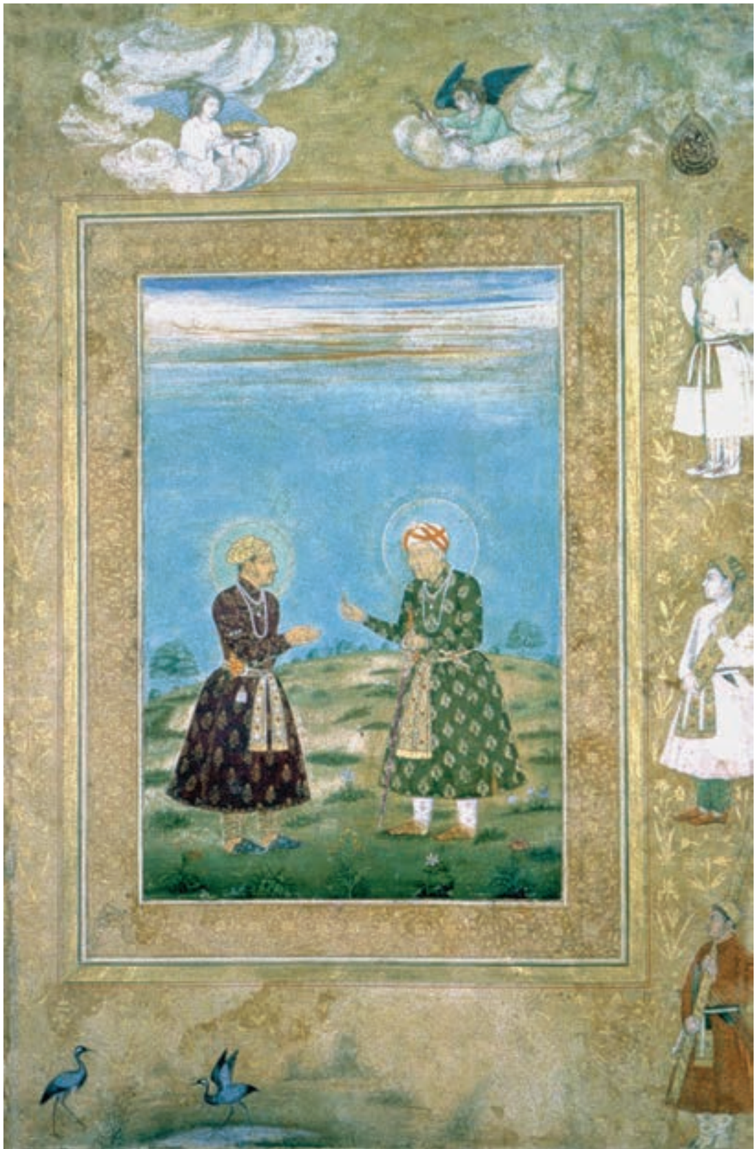
تصویر ۲۵-۳- اکبر انگشتی را به جهانگیر می‌دهد، برگي از شاهجهان نامه، آبرنگ روی کاغذ، سده‌ی ۱۷ م (۱۱ هـ. ق)