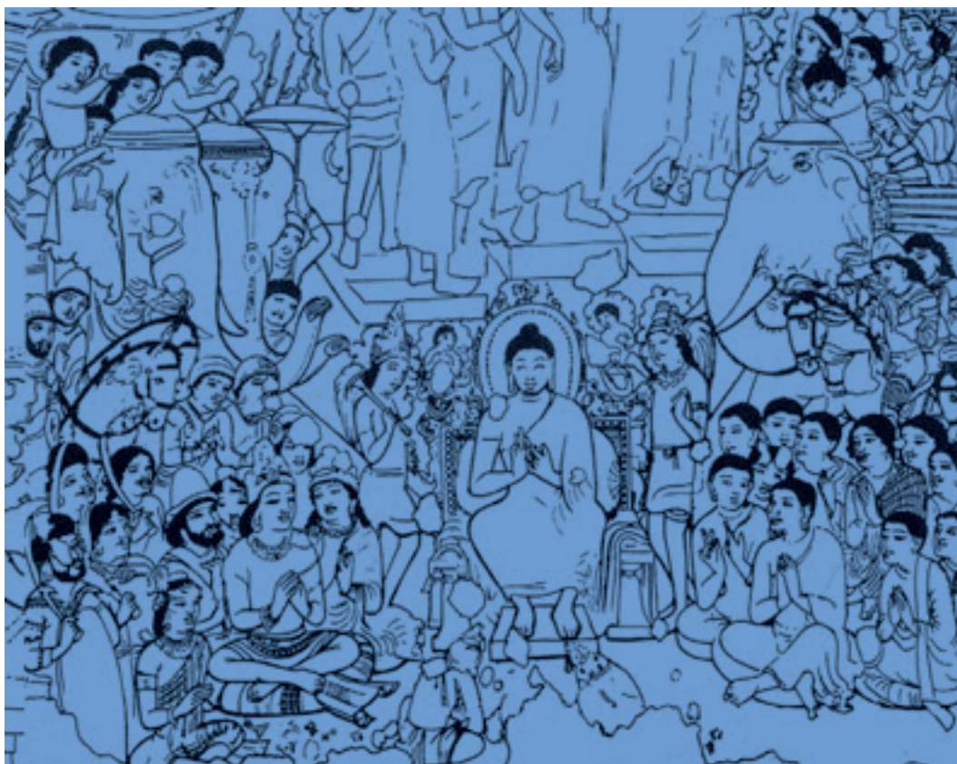
تصویر ۲۱-۳- بودا در میان دوستداران، دیوار نگاره، آجانتا سده‌ی ۶ م

ب) کتاب آرای: در هند سابقه‌ی هنر کتاب‌آرایی کم‌تر از دیوارنگاری است. قدیمی‌ترین کتاب‌های مصور هندی که به حدود سده‌های دهم و یازدهم میلادی مربوط می‌شوند نوعی از کتاب بود که با برگ نخل ساخته می‌شد و در جعبه‌های جلد مانند نگه‌داری می‌شد. هم صفحات و هم جلد را گاهی با نقاشی می‌آراستند. این کتاب‌ها عمدتاً حاوی مضامینی آیینی و مذهبی بود که برخی ویژگی‌های آن یادآور دیوار نگاره‌های پیشین بود (تصویر ۲۲-۳).