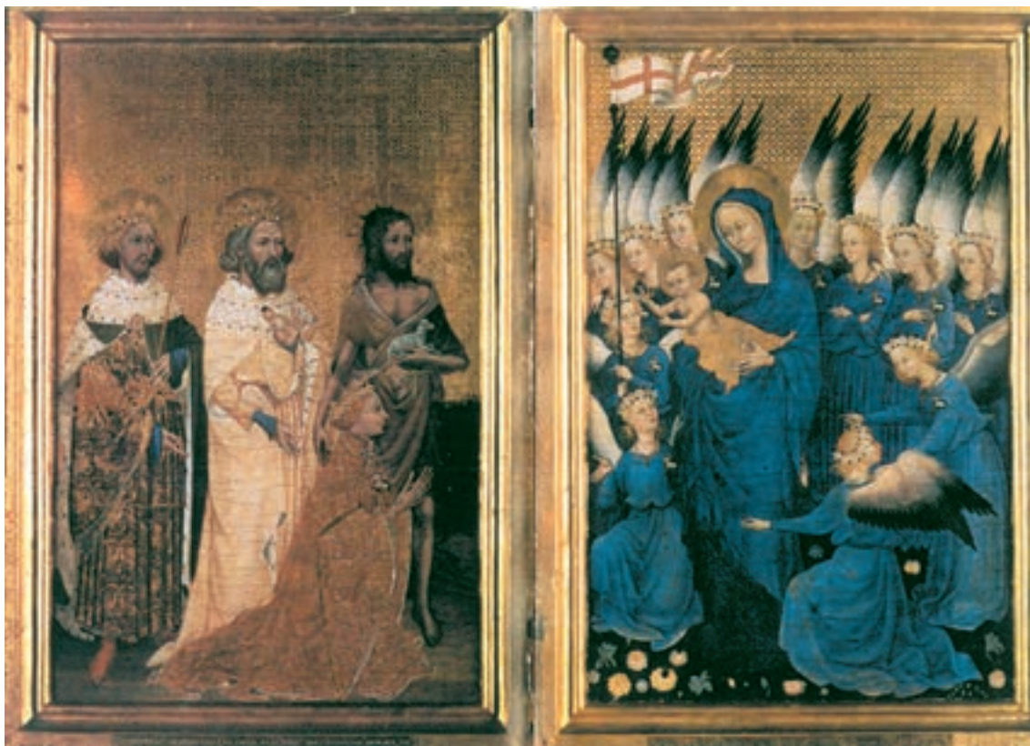
تصویر ۳۳-۴- بحیای تعمید دهنده و قدسیان: ریچارد دوم را در برابر حضرت مسیح و حضرت مریم مقدس شفاعت می‌کند. دو لت جویی، سده‌ی چهاردهم میلادی

۲- نقاشی روی پانل: در این شیوه پس از آماده‌سازی تخته‌های چوب بر روی آن‌ها نقاشی اجرا می‌شود. این پانل‌ها که برای تزین محراب کلیساها به کار می‌رفت، غالباً در چند حالت آماده می‌شد.