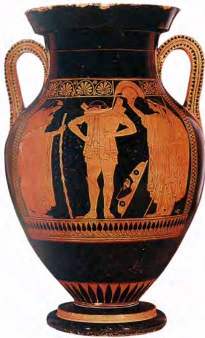
تصویر ۴-۴- گلدان با نقش سرخ (سرخ گون) محل نگهداری موزه واتیکان (سده‌ی پنجم ق.م)

۲- دوره‌ی کهن ۱ : در این دوره ظروف سرخ گون و سیاه گون رواج می‌یابند (تصاویر ۳-۴ و ۴-۴).