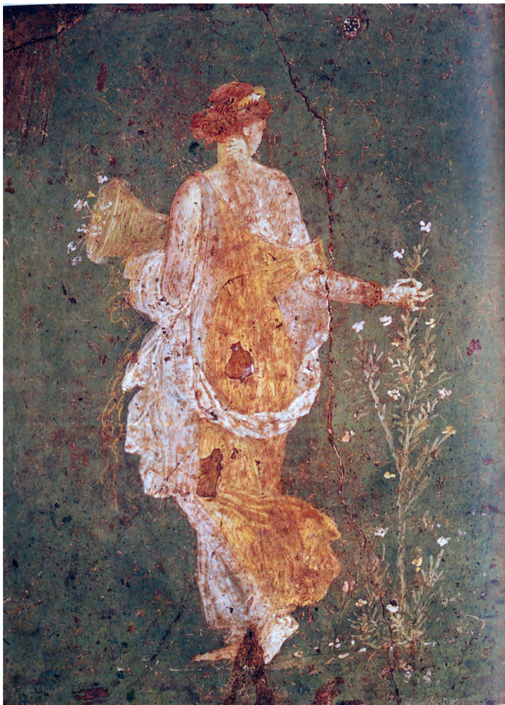
تصویر ۱۶-۴- دوشیزه در حال چیدن گل، قرن اول میلادی، جزئی از یک نقاشی دیواری، موزه ملی باستان‌شناسی، ناپل

در قرن دوم بعد از میلاد مسیح شاهد ظهور شیوه‌ی تکنیکی تازه‌ای در نقاشی رومی می‌باشیم که به تک چهره‌سازی رومی - مصری مشهور است. در این شیوه با استفاده از تکنیک «رنگ موم» ۱ شبیه‌سازی با توجه به ضوابط سایه‌پردازی و برجسته‌نمایی دقیق اجرا شده است (تصاویر ۱۷-۴ و ۱۸-۴).