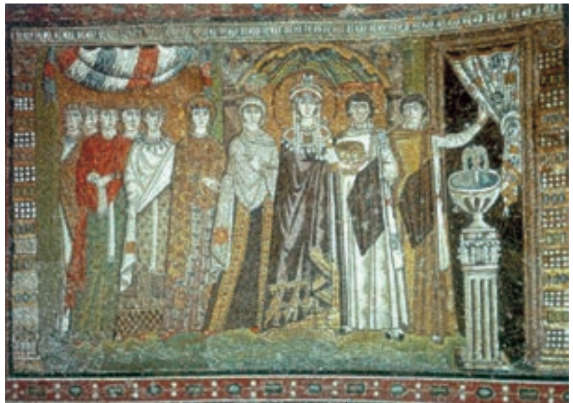
تصویر ۲۶-۴- دیوارنگاری به شیوهی موزائیک، بیزانس، ملکه ثئودورا و ملازمان راونا حدود ۵۴۷ م.

موزاییک‌های راونا از میراث سنت‌های هنری یونانی - رومی و سنن هنری خاور زمین برخوردار بودند. محتوای این هنر آمیختگی دو جنبه‌ی مذهبی و درباری را منعکس می‌کند. به عبارت دیگر، در این موزاییک‌ها وحدتی بین شکوه و جلال دنیوی و اخروی ایجاد شده، که بازتاب انطباق قدرت سیاسی و مذهبی در وجود یک فرد واحد یعنی امپراتور است. شیوهی آن به تجرید گرایش داشت و طرح‌های خطی و رنگ‌های تخت و عناصر تزئینی برای نمایش زیبایی‌های روحانی و آرمانی به کار می‌رفت؛ بدین ترتیب هنر مسیحی از قالب بی‌پیرایه‌ی نقاشی‌های به اصطلاح دخمه‌ای، به قالب پرشکوه موزاییک‌کاری «راونا» زیر نفوذ امپراتوران مسیحی، متحول گردید.