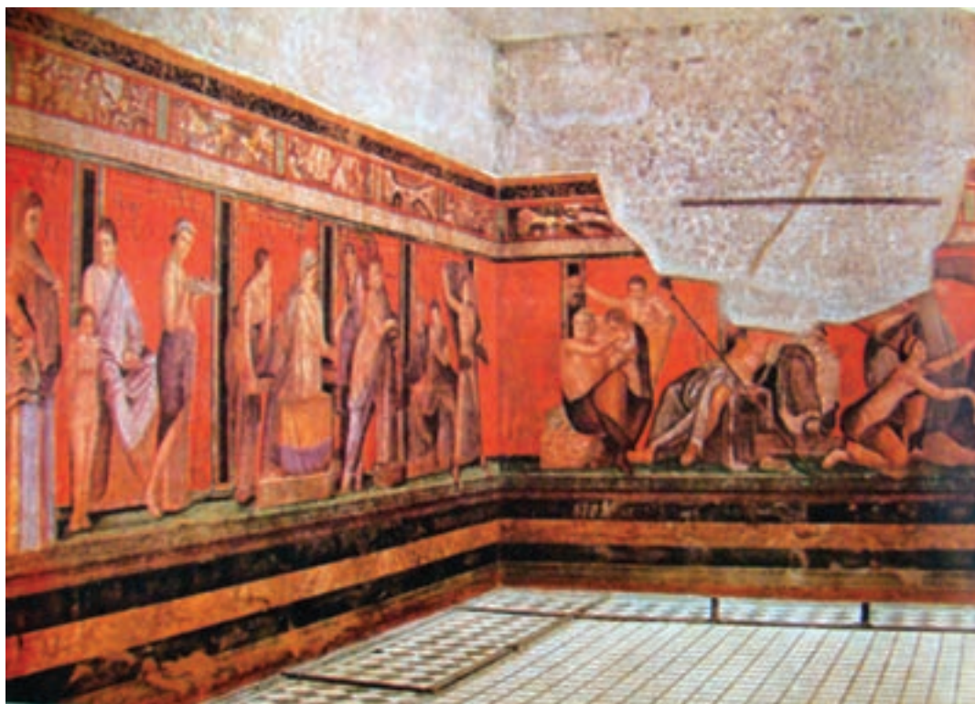
تصویر ۱۱-۴- نقاشی دیواری صحنه‌های آئین سری حدود ۵۰ ق.م، ویلای اسرار - پمپئی