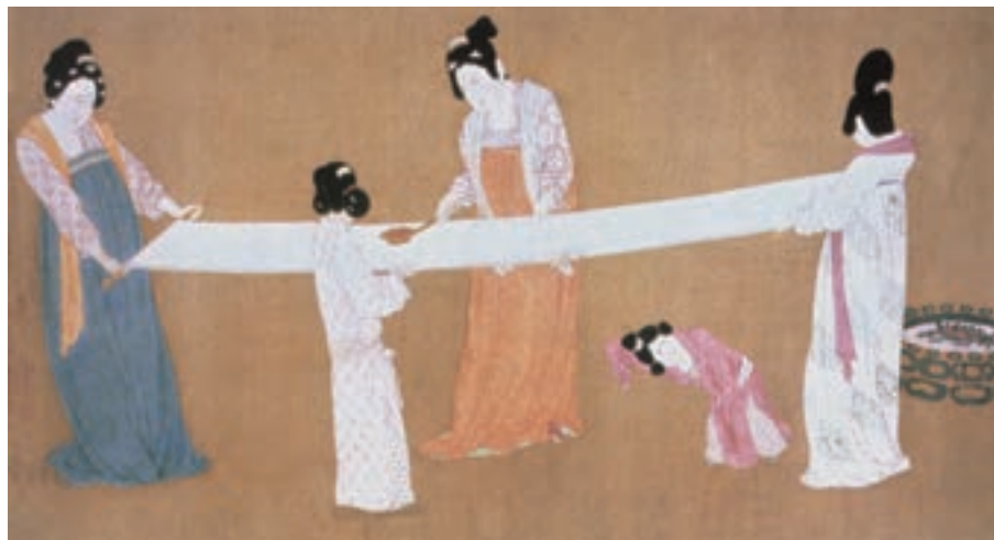
تصویر ۱۱-۳- تافتن ابریشم، آبرنگ روی کاغذ، سده ی ۱۲ م. تومار افقی.

هم‌گام با نقاشی، هنر خوش‌نویسی نیز در چین پیوسته حضور داشت و ارتباط خط با نقاشی چنان بود که می‌توان گفت هنری واحد به‌شمار می‌رفتند، هم‌چنان که مواد و مصالح هر دو (قلم‌مو، مرکب، ابریشم یا کاغذ) یکی بود و اجرای هر دو نیز به چیره‌دستی و مهارت فنی نیاز داشت. خوش‌نویسی چینی از کیفیت انتزاعی و تصویری خاص که احساس و اندیشه‌ی هنرمند را بیان می‌کند، برخوردار است. از این رو با نقاشی قرابت دارد. نقاشی سنتی چین به لحاظ سرزندگی، ریتم، ارزش خط و محدودیت رنگ تأثیر زیادی از خوش‌نویسی گرفته است. چینی‌ها پرده‌های خوش‌نویسی را نیز از دیوار می‌آویختند و آن را با ویژگی‌هایی هم‌چون یک نقاشی مورد ارزش‌یابی و تحلیل قرار می‌دادند. (تصویر ۱۱-۳)