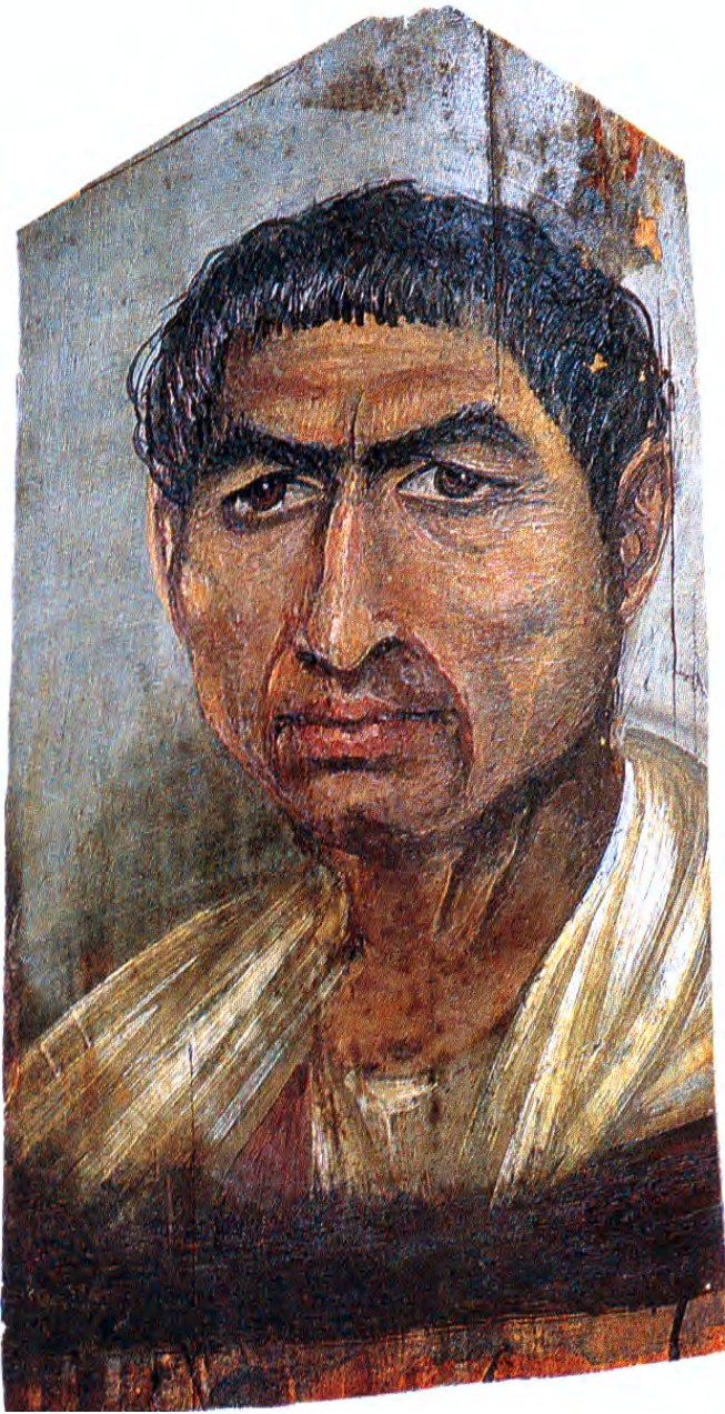
تصویر ۱۸-۴- چهره یک مرد از اهالی فیوم. قرن دوم ب. م