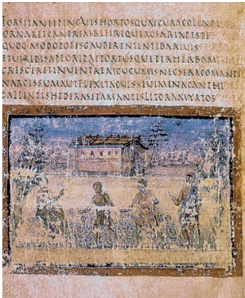
تصویر ۲۸-۴- برگه‌ی از انجیل واتیکان، سده‌ی پنجم میلادی، رُم

کتاب «انجیل لیندیس فارن» از برجسته‌ترین آثار دیرهای مذکور است: جنس صفحات این کتاب، مانند سایر کتب آن زمان، از پوست گوساله بود، که آن را با نقوش درهم‌بافته‌شده و نقش‌مایه‌های پرندگان و جانوران غرب آراسته بودند.