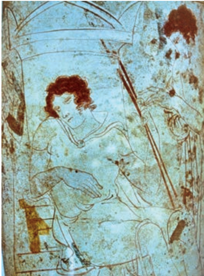
تصویر ۴-۶- بخشی از نقاشی روی گلدان سفالین بازمینه‌ی سفید، حدود اواخر سده‌ی پنجم ق.م

۴- دوره‌ی هلنی یا یونانی مآبی ۱ : با تسلط امپراتوری یونان بر مصر و ایران نوعی یونانی‌گرایی در هنر را ترویج می‌کردند. با مطالعه‌ی آثار به‌جامانده از تمدن یونان باستان، می‌توان گفت که آثار نقاشی یونان از فرم‌های هندسی و انتزاعی شروع شد و با تأثیر گرفتن از تمدن مصر و خاور نزدیک به پختگی رسید و در ادامه با طبیعت‌گرایی اصول کلاسیک را بی‌ریزی نموده است (تصویر ۴-۶).