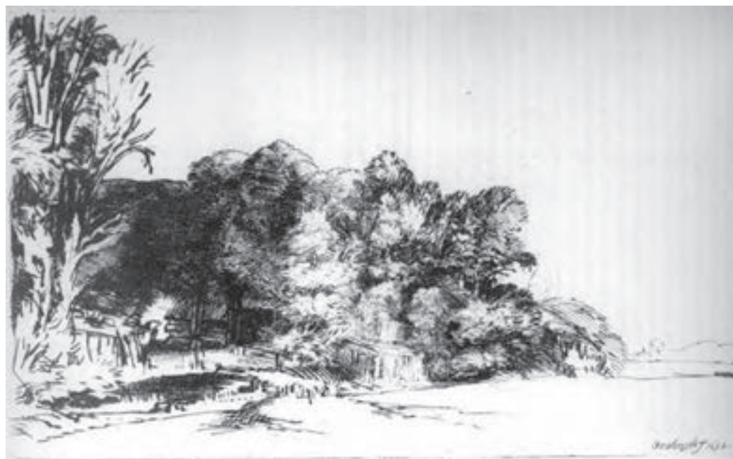
تصویر ۱۰- رامبراند- حکاکی روی فلز (شیوه درای پوینت)- ۲۱×۱۲/۵ سانتی متر- ۱۶۵۲ م.