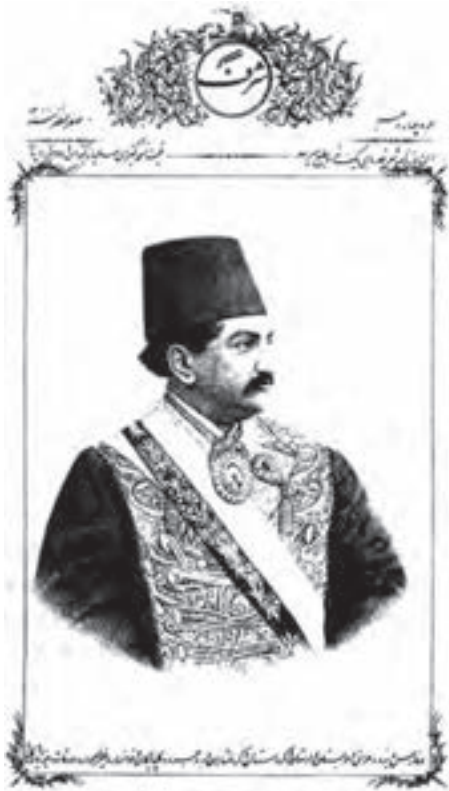
تصویر ۲۷- چهره ابوتراب غفاری - صفحه اول روزنامه شرف - لیتوگرافی - ۱۳۰۱ هجری. به خط نستعلیق با استفاده از حاشیه‌های تزئینی.

در حدود هفده سال بعد (در سال ۱۲۵۰ قمری) با ورود دستگاه‌های چاپ سنگی (لیتوگرافی ۱ )، برای مدت نزدیک به ربع قرن این شیوه چاپی مورد استفاده قرار گرفت. نخستین چاپخانه مجهز به دستگاه‌های لیتوگرافی نیز نخستین بار در تبریز دایر شد و نخستین کتابی که چاپ کرد، قرآن بود. همچنین در این دوره نخستین مطبوعات ایرانی به روش لیتوگرافی چاپ و منتشر شدند.