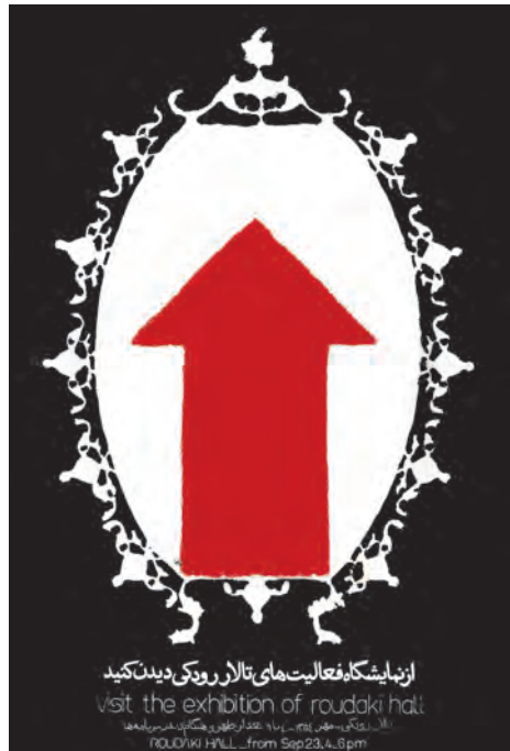
تصویر ۲۸- صادق بریرانی - سیلک اسکرین - دهه ۴۰ شمسی.