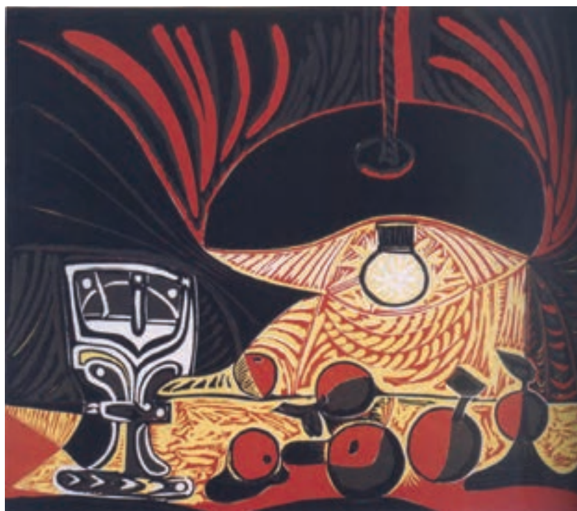
تصویر ۲۲- پابلو پیکاسو- حکاکی روی لینولوم - ۶۲×۷۵/۳ سانتی‌متر- ۱۸۵۷ م.