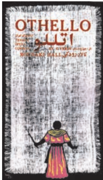
تصویر ۲۹- بهزاد حاتم - سیلک اسکرین - ۱۳۵۴ شمسی.

در کنار چاپ ماشینی، چاپ دستی همواره راه خود را پیموده است، که از این میان باید به ورود چاپ سیلک اسکرین (سری‌گرافی) در دهه چهل اشاره کرد. هنرمندان در شاخه گرافیک از این روش در خلق پوسترهای خود به‌ویژه در موضوعات فرهنگی بهره بسیاری بردند (تصویر ۲۸ و ۲۹).