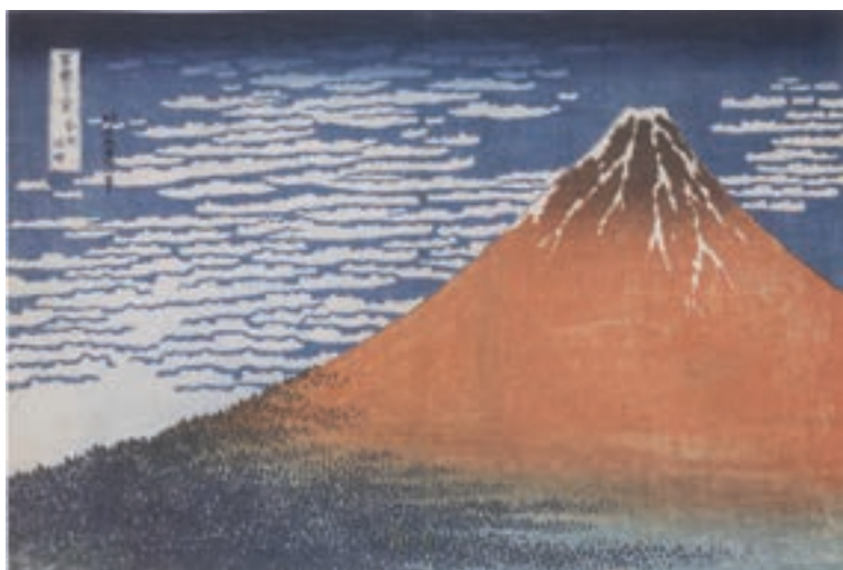
تصویر ۱۷- کاتسوشیکا هوکوسای - از مجموعه ۳۶ منظره از کوه فوجی - ۲۸×۲۵ سانتی متر - بین ۱۸۲۰ تا ۱۸۳۰ م.