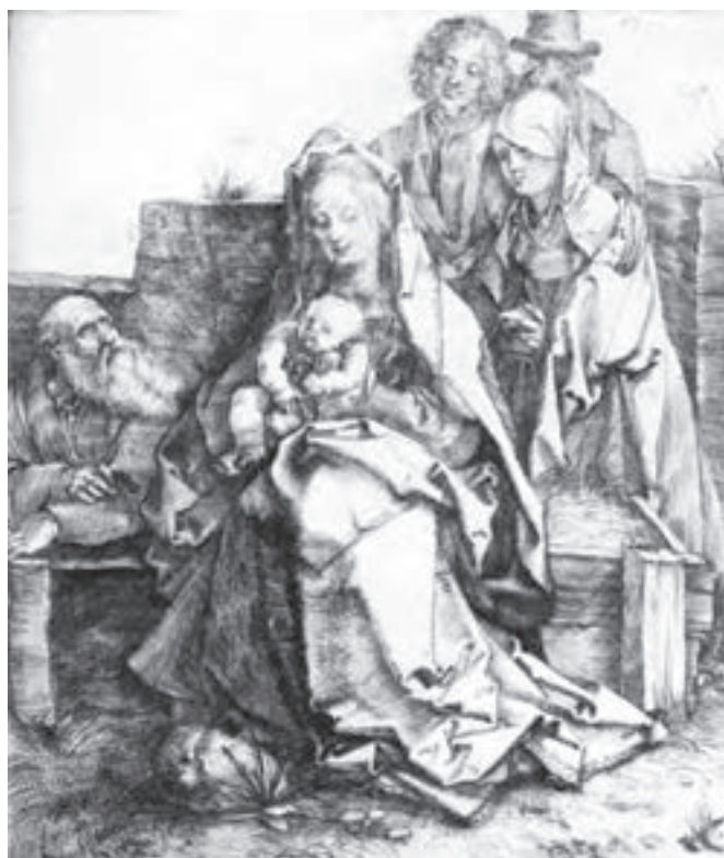
تصویر ۸- آلبرشت دورر- حکاکی روی فلز (شیوه درای پوینت)