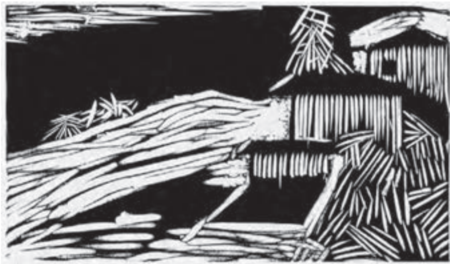
تصویر ۳۵- مینا نوری - حکاکی روی لینولئوم - ۱۳/۵ \times ۲۳/۵ سانتی متر - ۱۳۵۲ شمسی .