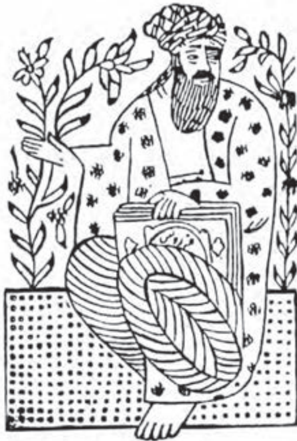
تصویر ۲۳ - نقش فردوسی - حاشیه کتاب چاپ شده با قالب قلمکار - دوره تیموری.

وجود نقش‌های چاپ‌شده بر حاشیه بعضی از کتاب‌های دوره تیموری نیز، نشان از استفاده از قالب‌های چوبی در سده دهم هجری دارد (تصویر ۲۳).