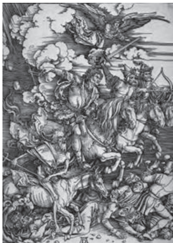
تصویر ۹- آلبرشت دورر- چهار سوار سرنوشت (از کتاب مکاشفات یوحنا)- حکاکی روی چوب- ۱۶۹۸ م.