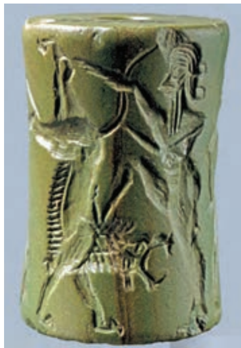
تصویر ۲- مهر استوانه‌ای و اثر نقش آن بر لوحه گلی. بین‌النهرین، ۲۳۵۰ تا ۲۱۵۰ پیش از میلاد.