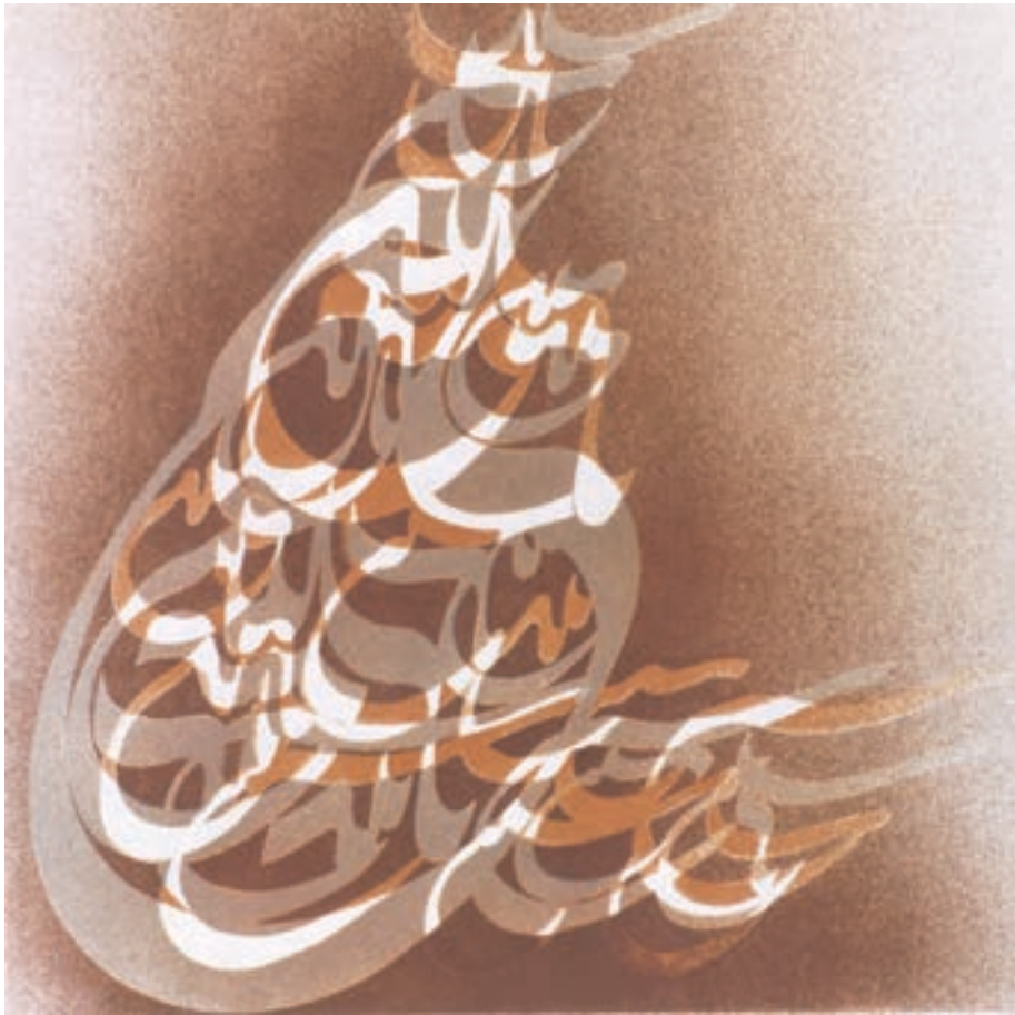
تصویر ۳۶- فرامرز پیلارام - لیتوگرافی - ۱۹۷۲ م.