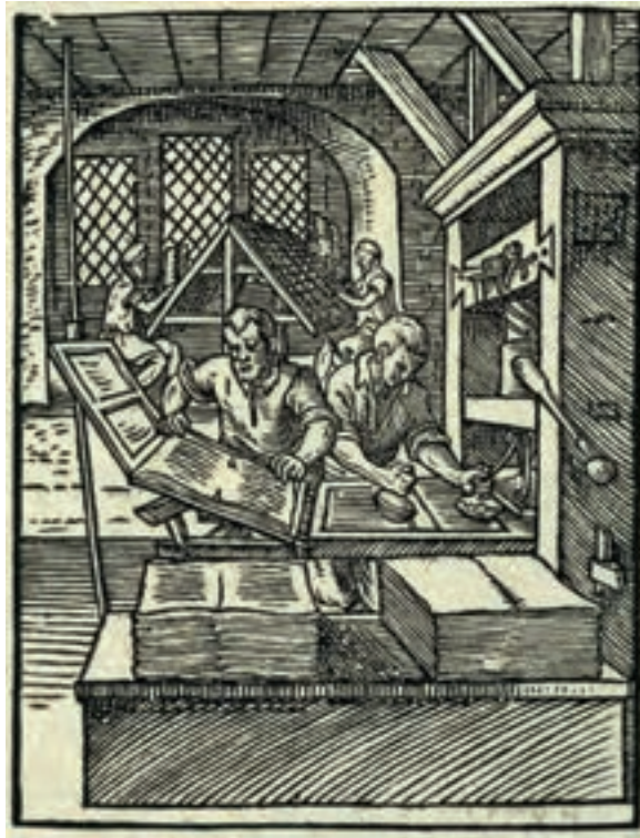
تصویر ۷- صفحه‌ای از یک کتاب کلیشه‌ای - چاپ شده با کلیشه‌ی چوبی حکاکی شده.

اختراع چاپ با حروف متحرک فلزی در قرن پانزدهم میلادی به وسیله یوهان گوتنبرگ ۱ آلمانی نقطه عطفی در تاریخ چاپ شد که با طی کردن قرن‌ها به صنعت رسانه‌ای قدرتمندی تبدیل گشت. در فاصله سده‌های پانزدهم تا نوزدهم میلادی استفاده از لوحه‌های فلزی خیلی زود جای خود را در مصور کردن کتاب‌های چاپی باز کرد و تقریباً جای قالب‌های چوبی را گرفت. آبرشت دورر نقاش آلمانی در سال‌های پایانی سده پانزدهم و ابتدای سده شانزدهم میلادی آثار ماندگاری در هر دو زمینه خلق کرده است (تصویر ۸ و ۹). «رامبراند» ۲ (سده هفدهم) و «فرانسیسکو گویا» ۳ (اواخر سده هیجدهم و اوایل سده نوزدهم) و همچنین نقاشان قرن نوزدهم و بیستم چون، (ادوارد مانه) ۴ (کته کولویتس) ۵ ، (واسیلی کاندینسکی) ۶ ، (هنری ماتیس) ۷ ، «پابلو پیکاسو» ۸ و دیگران آثار با ارزشی با تکنیک حکاکی روی فلز از خود به یادگار گذاشته‌اند (تصاویر ۱۰ و ۱۱ و ۱۲ و ۱۳).