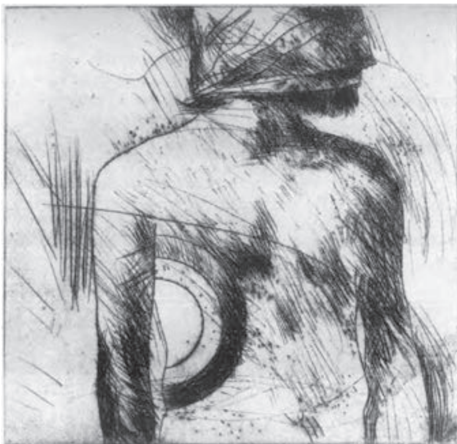
تصویر ۳۲- نیکزاد نجومی - حکاکی روی فلز- ۲۲/۳×۲۲/۳ سانتی متر- ۱۹۷۶ م. (برگرفته از کتاب چاپ دستی تکنیک کالکوگرافی)