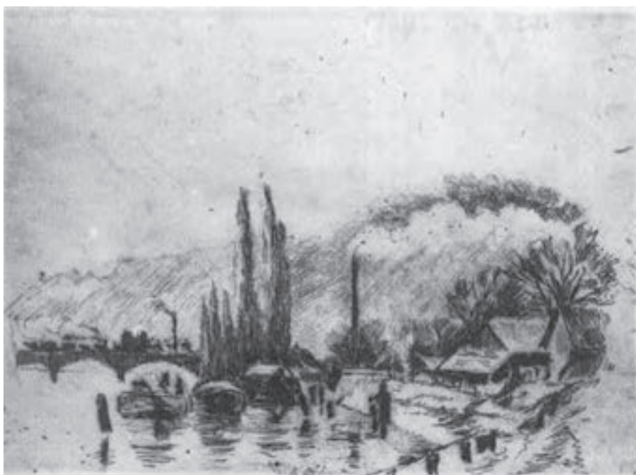
تصویر ۱۳- کامیل پیسارو - حکاکی روی فلز (شیوهٔ اچینگ و درای پوینت) - ۱۲/۸×۱۷/۵ سانتی‌متر - ۱۸۸۵ م.