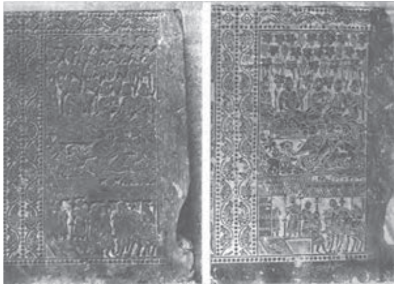
تصویر ۳- نقش برجسته چینی و نقش چاپی آن - سلسله تانگ - ۶۱۸ تا ۹۰۷ م.