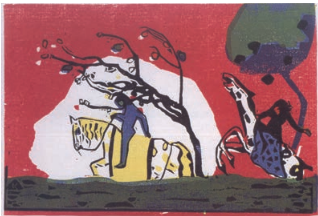
تصویر ۱۸- واسیلی کاندینسکی - حکاکی روی چوب - ۲۸/۵×۲۸/۴ سانتی متر - ۱۹۱۳ م.