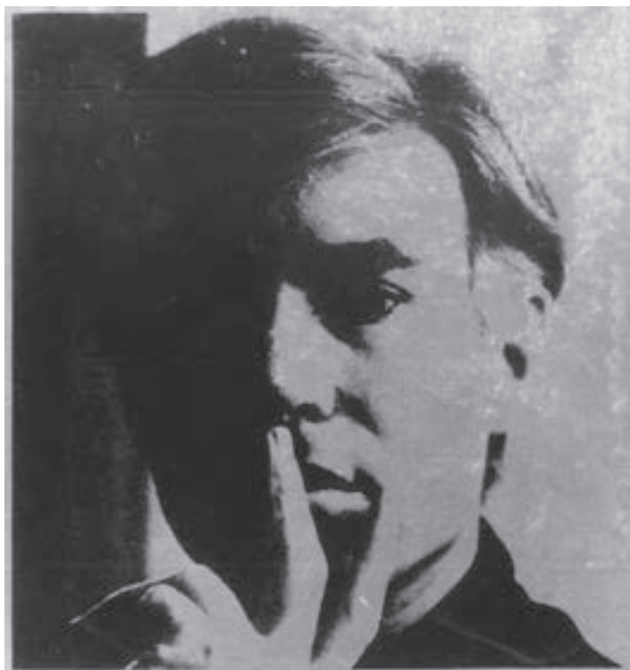
تصویر ۲۰- اندی وار هول - سیلک اسکرین روی کاغذ نقره‌ای - ۵۸/۷×۵۸/۵ سانتی‌متر- ۱۹۶۷ م.