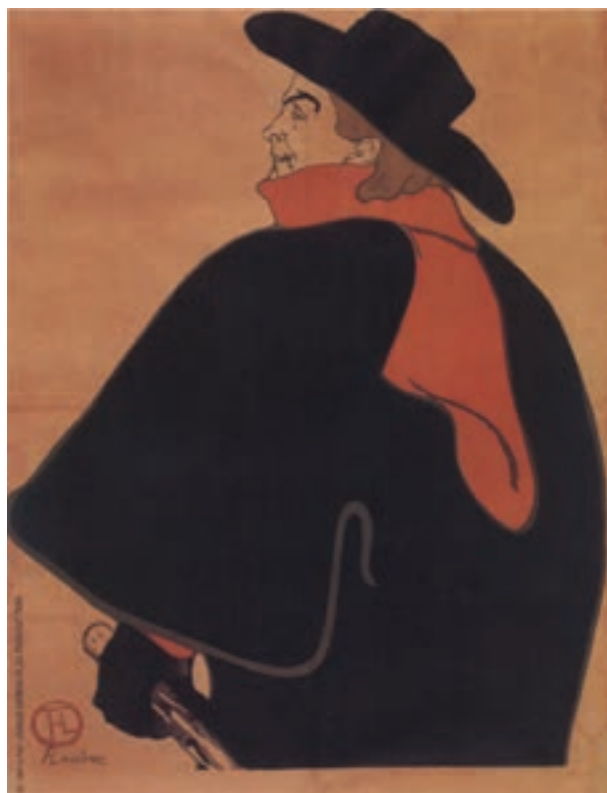
تصویر ۱۵- تولوز لوترک - لیتوگرافی - ۱۲۷/۳×۹۵ سانتی‌متر - ۱۸۹۳ م.

روش «لیتوگرافی» در قرن هیجدهم میلادی توسط «آلوئیس زنفلدر» ۱ به وجود آمد که بعدها به فراگیرترین شکل چاپ در سده‌های نوزدهم و بیستم تبدیل شد و پس از طی مراحل در شکل صنعتی شده خود به نام «چاپ افست» ۲ معروف گردید. در سده نوزدهم و بیستم روش لیتوگرافی بسیار مورد توجه هنرمندان بود و «فرانسیسکو گویا» ۳ «تولوز لوترک» ۴ «ماتیس» ۵ «پیکاسو» و دیگران آثار ارزشمندی را در این زمینه به وجود آورده‌اند (تصویر ۱۴ و ۱۵).