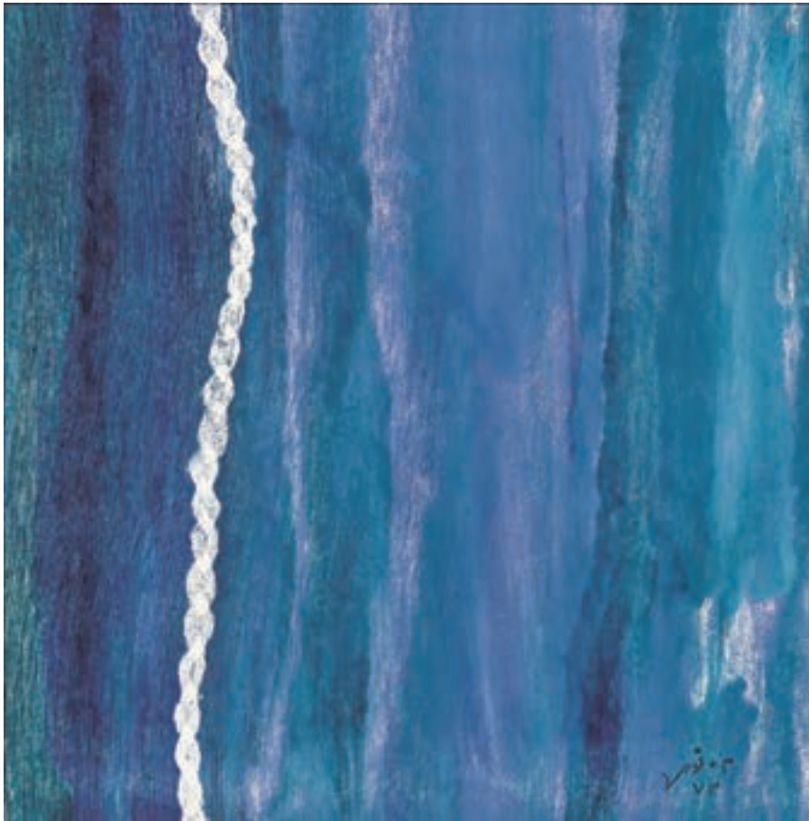
تصویر ۳۴- مینا نوری - مونوپرینت - ۱۹/۵ \times ۱۹/۵ سانتی متر - ۱۳۷۳ شمسی .