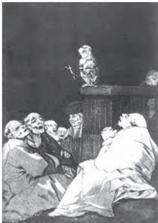
تصویر ۱۱- فرانسیسکو گویا - حکاکی روی فلز - ۱۳/۶×۱۹ سانتی‌متر - ۱۷۹۹ م.