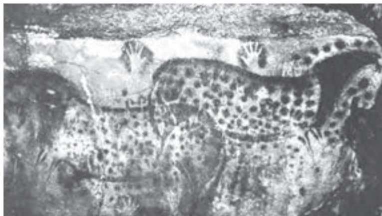
تصویر ۱- اسب‌های خالدار و نقش منفی دست. بش‌مرل، حدود ۱۰ تا ۱۵ هزار سال پیش از میلاد، ۳۴۰ سانتی‌متر طول، ولایت لوت، فرانسه.

دوران غارنشینی: در آثار بر جای مانده از دوران غارنشینی، دو گونه تصویر چاپ مانند به دست آمده است که در یکی از آنها اثر دست به صورت مثبت و در دیگری به صورت منفی بر دیوارهٔ غار نقش بسته است. در اولی با آغشته کردن دست به مادهٔ رنگین و انتقال آن به سطح دیوار و در دومی با قرار دادن دست بر دیواره و پاشیدن رنگ به اطراف آن نقش دست بر جای مانده است (تصویر ۱).