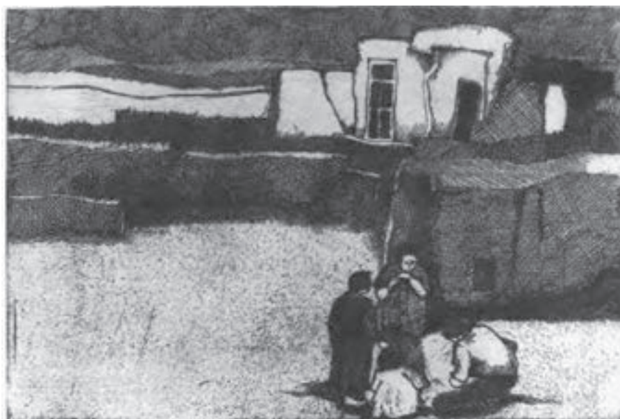
تصویر ۳۳- ناهید حقیقت - حکاکی روی فلز- ۱۵/۱×۲۲/۷ سانتی متر- ۱۹۷۳ م. (برگرفته از کتاب چاپ دستی تکنیک کالکوگرافی)