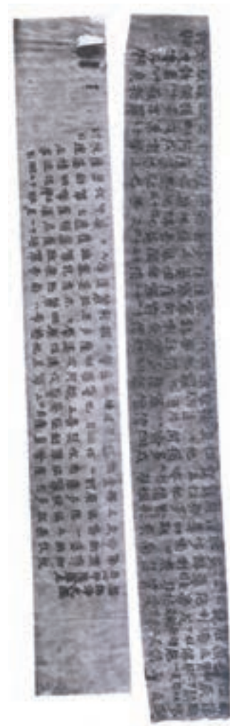
تصویر ۵- طلسم ها و سرودهای بودایی - ژاپن - ۷۷۰ م.

نخستین بول کاغذی نیز در سده نهم میلادی در چین طراحی و چاپ شد. همچنین در سده های نهم و دهم، کتاب های طوماری جای خود را به کتاب های آکاردئونی (دارای ورق های تاخورده) داد و در سده دهم و یازدهم کتاب های دوخته شده پدید آمد. چاپ کارت های بازی نیز شکل دیگری از طراحی گرافیک و چاپ اولیه بود که در چین رواج پیدا کرد. حروف متحرک اولیه در قرن یازدهم ابتدا در چین و سپس در کره به وجود آمد. چاپ در دنیای غرب: قدیمی ترین نمونه چاپ، پارچه ای است مربوط به سده ششم میلادی و به سبک شرقی، که با استفاده از قالب های چوبی اجرا شده و از داخل یک گور در اروپای شمالی به دست آمده است. در شرایطی که در سرزمین چین (و کشورهای مجاور) قرن ها از پیدایش و رواج چاپ می گذشت، روش استفاده از قالب چوبی بر روی کاغذ، در قرن سیزدهم از چین به اروپا منتقل شد. این آثار چاپی با متون مذهبی و تصاویر قدیسان همراه بود که به تدریج به چاپ کتاب های کلیشه ای انجامید (تصویر ۷). قبل از این دوره کتاب ها با دست نوشته می شد و نقاشان و تذهیب کاران آنها را مصور و مزین می ساختند.