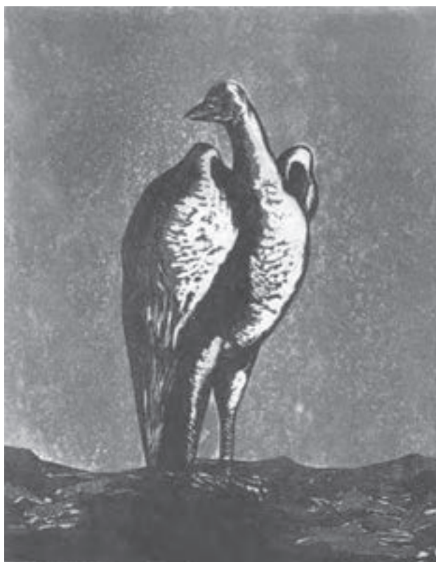
تصویر ۳۱- بهمن محمص - حکاکی روی فلز - ۳۰×۲۴ سانتی‌متر - ۱۹۷۰ م.