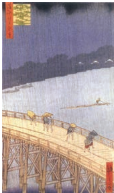
تصویر ۱۶- آندو توکیتارو هیروشیچ (هیروشیگه) - رگبار روی پل اوهایسی - حکاکی روی چوب - ۱۸۵۷ م.