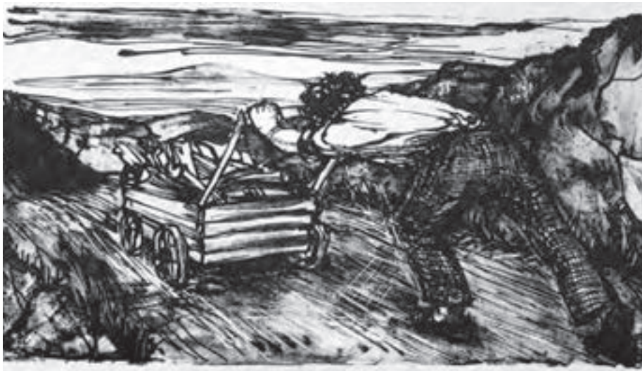
تصویر ۳۷- نیلا امیر ابراهیمی - لیتوگرافی - ۲۷×۱۴/۵ سانتی متر - ۱۳۵۶ شمسی.