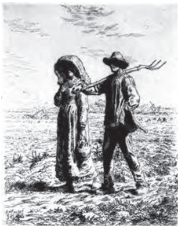
تصویر ۱۲- فرانسوا میله - حکاکی روی فلز (شیوهٔ اچینگ) - ۳۸/۶×۳۰/۵ سانتی‌متر - ۱۸۶۳ م.