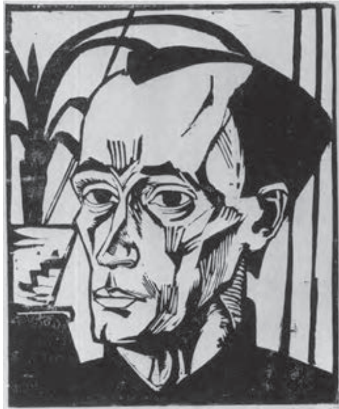
تصویر ۱۹- اریک هکل - حکاکی روی چوب - ۳۶/۵×۲۹/۸ سانتی‌متر - ۱۹۱۷ م.

ثبت اختراع چاپ «سیلک اسکرین» در قرن بیستم میلادی به نام «ساموئل سیمون» ۱ انگلیسی باعث شد عمل چاپ که تا ابتدای سده بیستم بیشتر روی صفحات کاغذی تخت (یا پارچه) انجام می‌گرفت، روی انواع سطوح با جنسیت‌های مختلف و شکل‌های گوناگون ممکن شود.