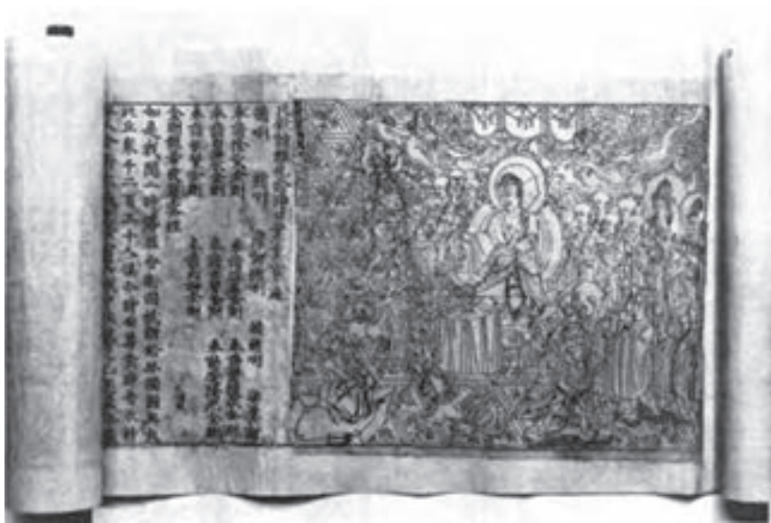
تصویر ۶- دیاموند ساترا- اثر چاپی از باسمة چوبی حکاکی شده - چین - ۸۶۸ میلادی.