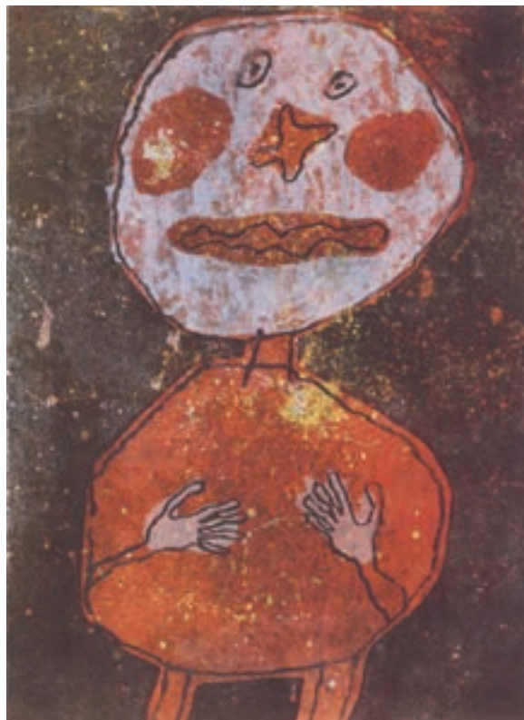
تصویر ۱۴- زان دو بوفه - لیتوگرافی - ۵۲×۳۷/۹ سانتی‌متر - ۱۹۶۲ م.

از سوی دیگر چاپ به وسیلهٔ باسمه‌های چوبی، در طول سده‌های هفده تا نوزده میلادی در ژاپن به اوج خود رسیده بود و هنرمندان بسیاری از جمله «هوکوسای» ۶ و در سده نوزدهم آثار ماندگاری در این زمینه به وجود آورده است. به دنبال آشنایی هنرمندان اروپایی با حکاکی‌های چوبی ژاپنی در نیمهٔ دوم سده نوزدهم حکاکی روی چوب نیز دوباره رونق گرفت و هنرمندانی چون «پل گوگن» ۷ ، «ادوارد مونش» ۸ ، «موریس اشتر» ۹ و دیگران آثاری را در این زمینه ایجاد کردند (تصاویر ۱۶ و ۱۷ و ۱۸ و ۱۹).