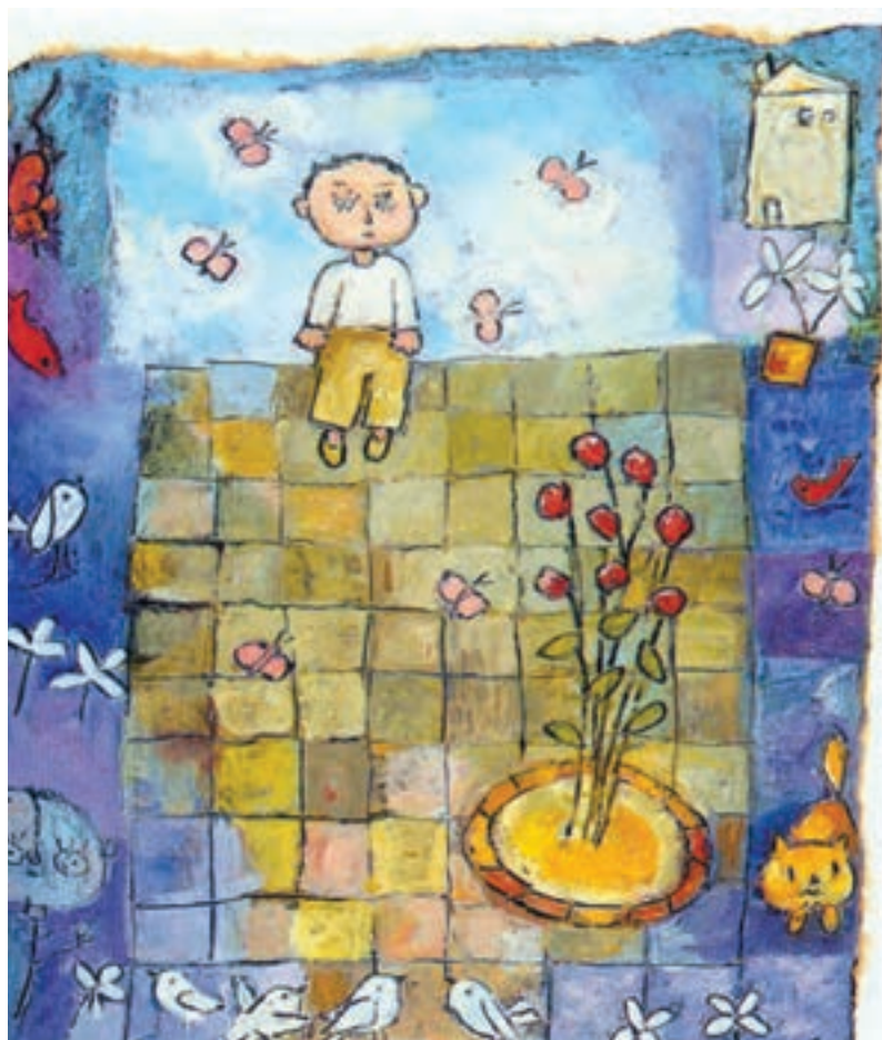
▲ تصویر ۱۲