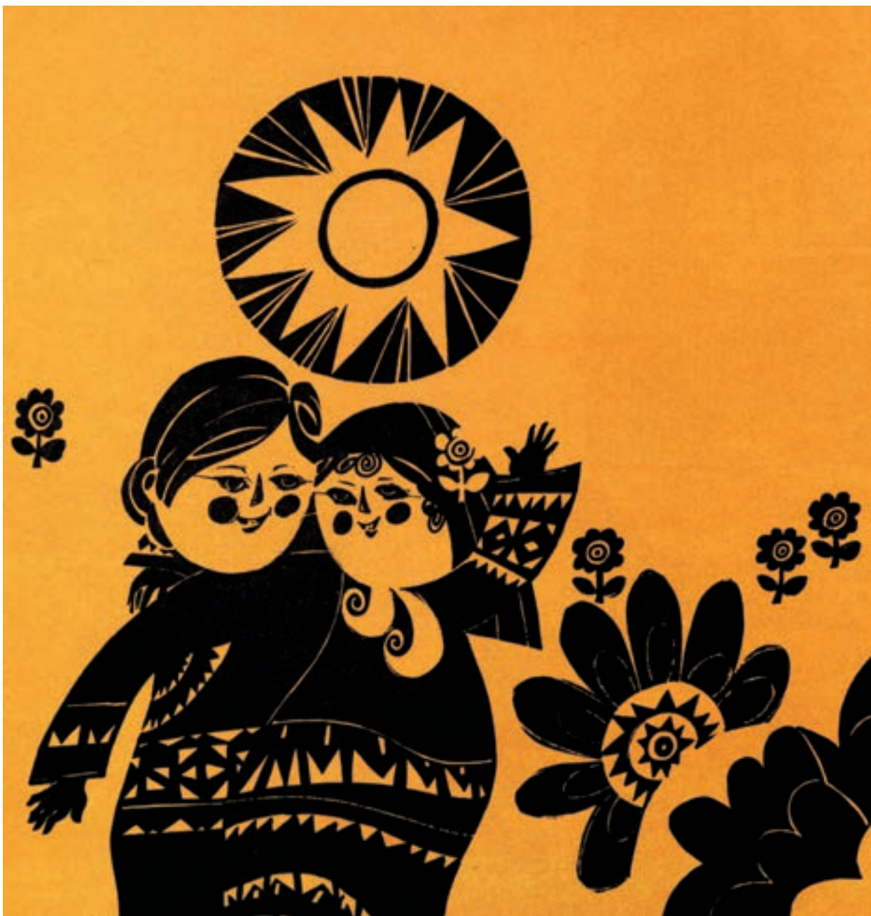
▲ تصویر ۶