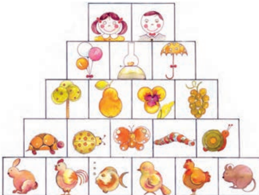
▲ تصویر ۱۹ - تصویرسازی با شکل‌های اصلی - اکولین - اثر اعظم کریمی

به روش‌های ساده‌سازی طبیعت در تصویر شماره ۱۹ دقت نمایید.