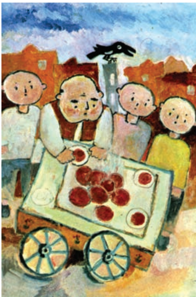
تصویر ۲۰ ◀

دقت کنید، هنرمند جوان در این مجموعه آثار به واسطه کاربرد فرم‌های ساده هندسی توانسته است هر شکلی را که اراده کند به تصویر بکشد و تکمیل نماید. شما نیز همواره تلاش کنید که تمامی اشکالی را که در یک تصویر می‌خواهید طراحی کنید، توسط این اشکال به دست آورید. مطمئن باشید بعد از مدتی نه چندان زیاد، برای خود صاحب شیوه و روش جدیدی در طراحی تصویرسازی خواهید شد، و آثار شما از سایر آثار هنرمندان قابل تشخیص خواهد بود. در اینجا نیز چند نمونه از شخصیت‌سازی‌های