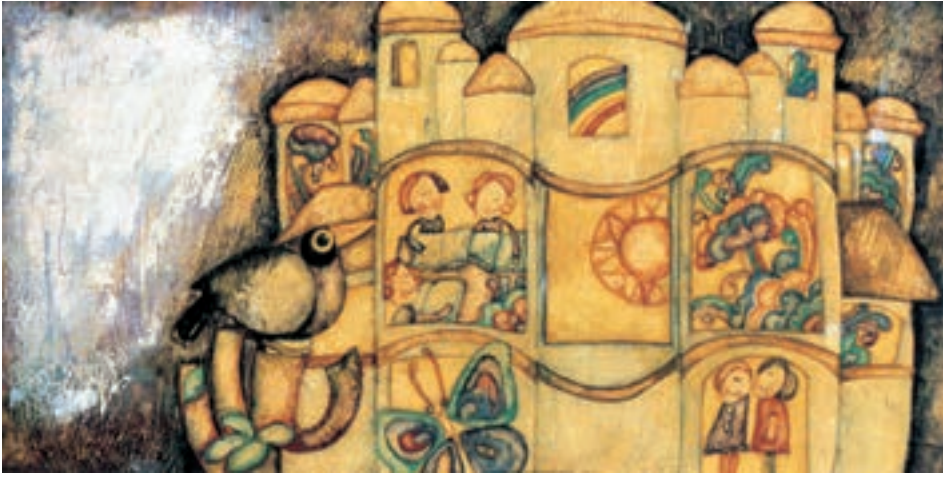
▲ تصویر ۷