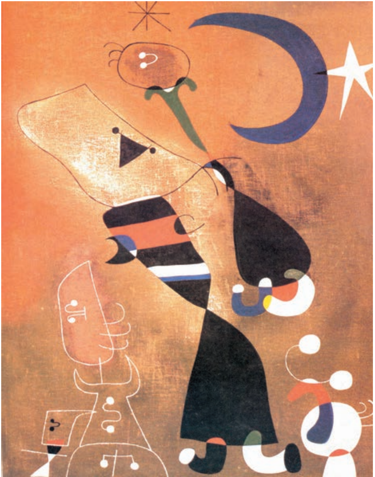
▲ تصویر ۱۷- زن، پرنده و مهتاب - ۱۹۴۹ - رنگ روغن - اثر خوان میرو