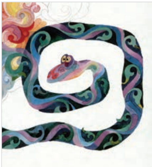
▲ تصویر ۳-ب — اثر نورالدین زرین کلک، کتاب آ، اول الفباست، هنرمند در این اثر با استفاده از رنگ های سرد و گرم ترکیب بندی رنگی مناسبی به وجود آورده است.

اهمیت رنگ و به کارگیری آن در خلق تصویر نزد تمامی تصویرگران از ویژگی خاصی برخوردار است. اولویت بخشیدن به رنگ در تصاویر کتاب کودکان به این معنی نیست که رنگ را