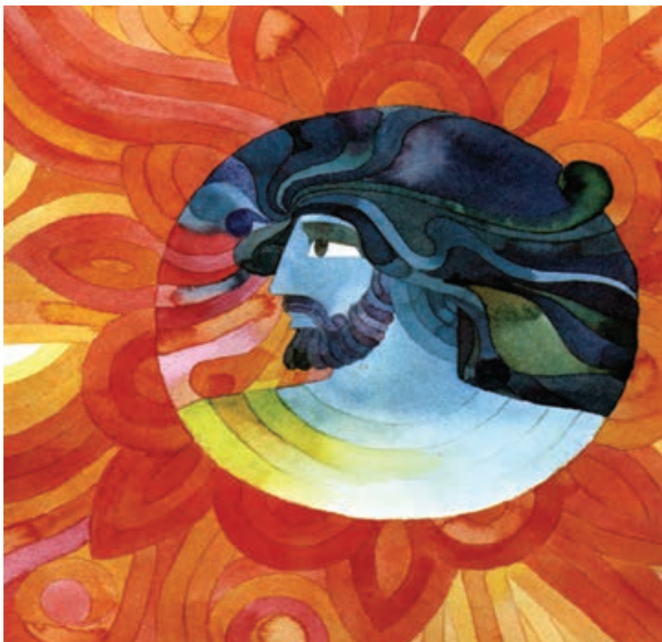
◀ تصویر ۲۲