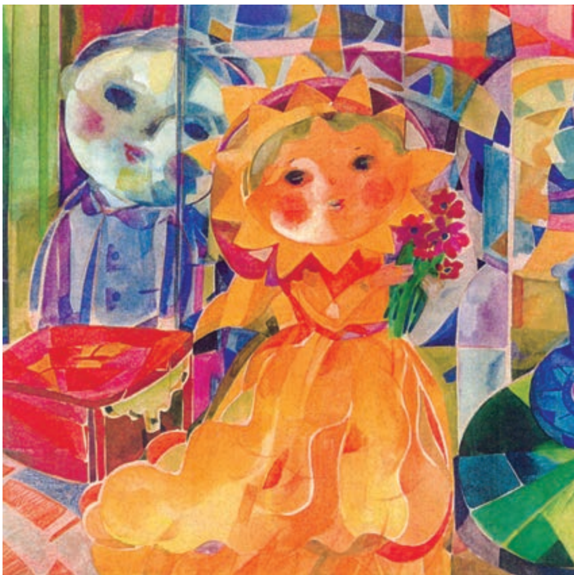
▲ تصویر ۲- اثر محمدعلی بنی اسدی، نمونه‌ای از کاربرد رنگ در تصویرسازی - هنرمند در این اثر از رنگ‌های درخشان به خوبی استفاده کرده است و توانسته با مخاطبین خردسال ارتباط برقرار کند.

آنچه مسلم است یک هنرمند جدای توانایی‌های خود و شناخت زیبایی‌شناسی رنگ باید از چگونگی نگرش مخاطب خود و میزان تجسم و شرایط درک سنی، نسبت به رنگ‌ها و اهمیت آن آگاه باشد. چرا که برای قشری کار می‌کند که اگر نتواند با آنها ارتباط برقرار کند، در کارهای خویش موفق نخواهد بود.