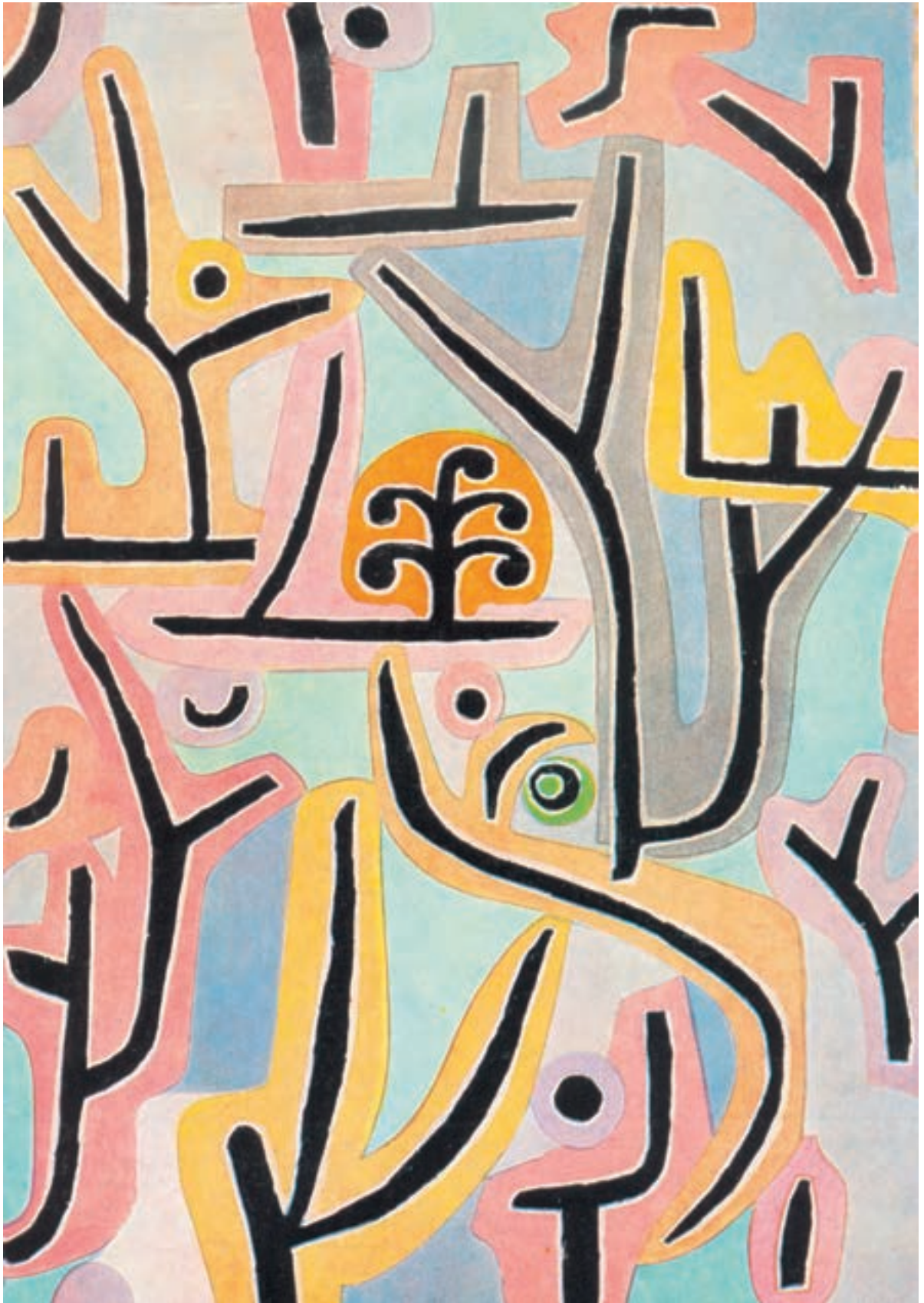
▲ تصویر ۱۶- باغ نزدیک لوسرن - ۱۹۳۸ - رنگ روغن - اثر پل کلی