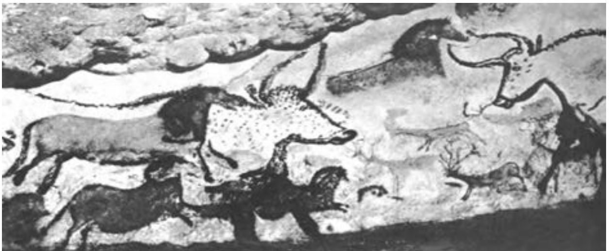
▲ تصویر ۱۵- ب- نقاشی‌های درون غار لاسکو- فرانسه- حدود ۱۰۰۰۰ تا ۱۵۰۰۰ سال قبل از میلاد