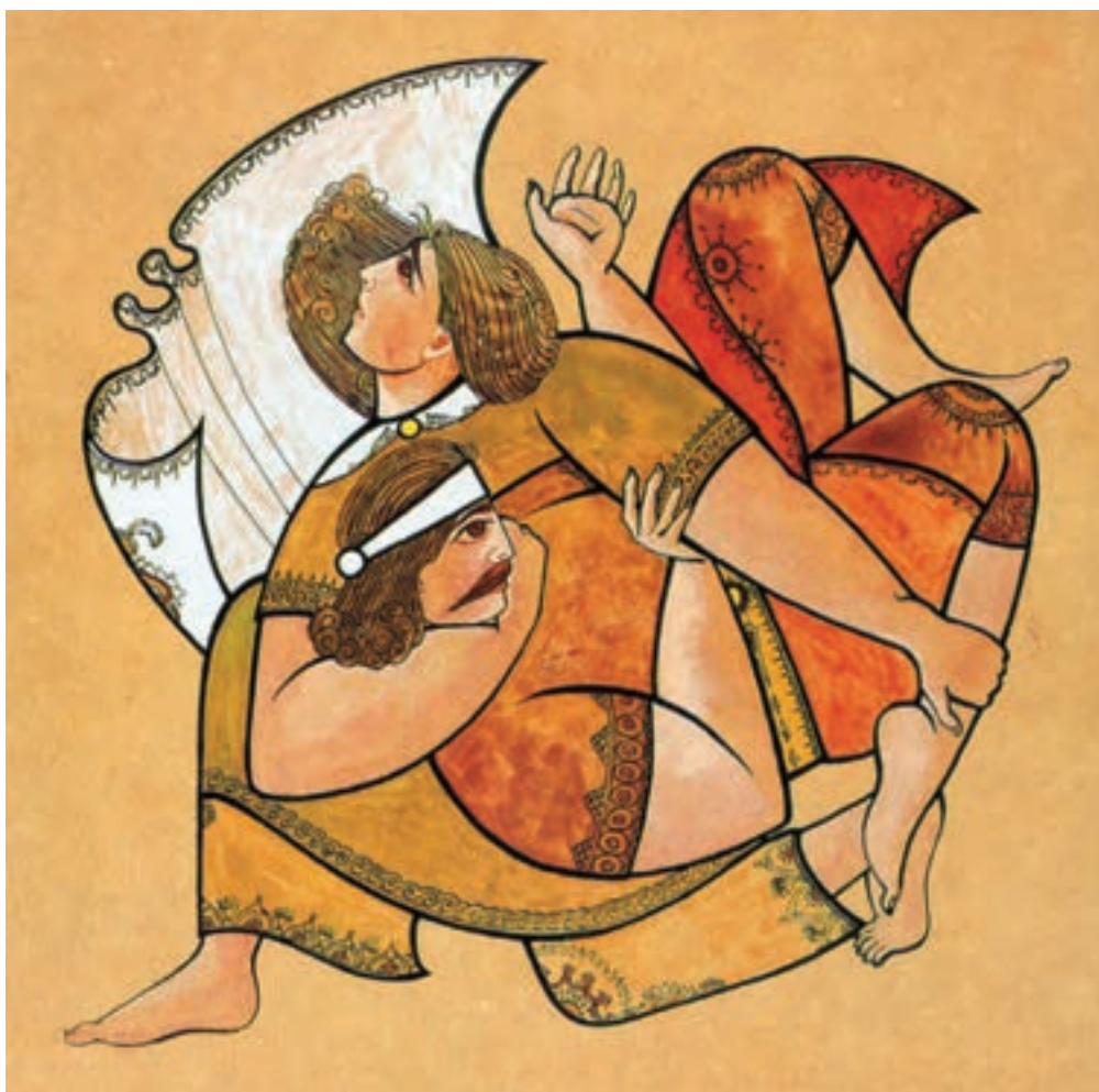
▲ تصویر ۲۳