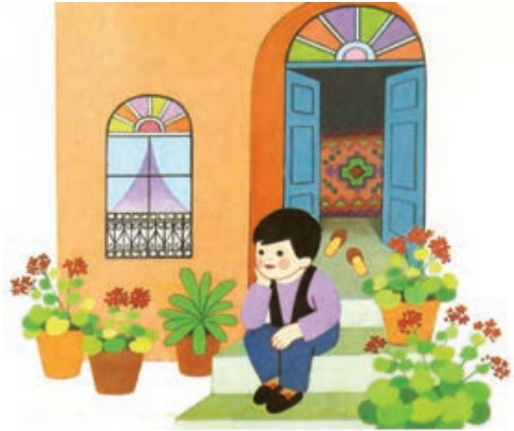
▲ تصویر ۱۳