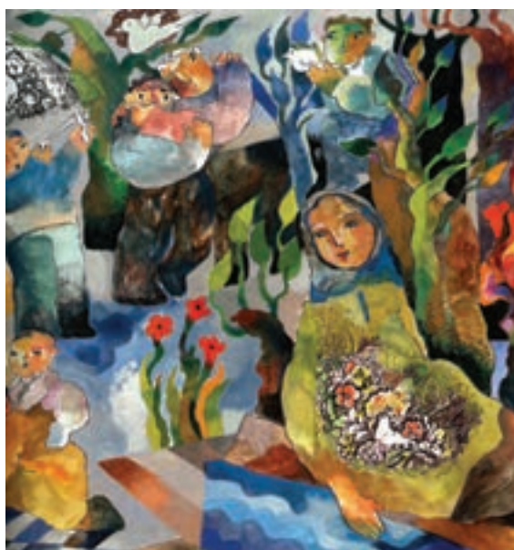
▲ تصویر ۳-د — اثر محمد علی بنی اسدی، هنرمند با استفاده از رنگ های تیره و ترکیبی به شیوه ای فردی در تصویر سازی دست یافته است.