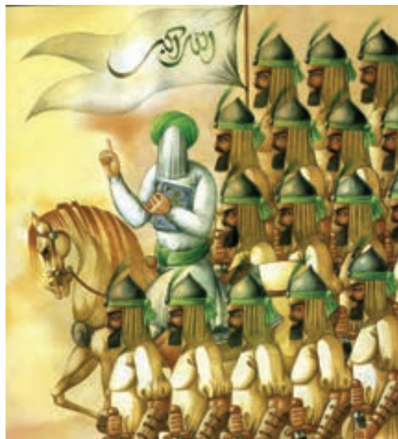
▲ تصویر ۳-الف — اثر علی اکبر صادقی، کتاب پیروزی، هنرمند با استفاده از رنگ های گرم و با الهام از نقاشی قهوه خانه ای به شیوه ای نو و جدید دست یافته است.