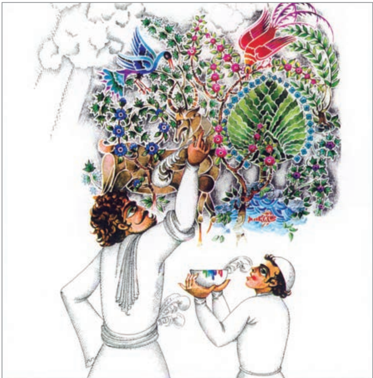
▲ تصویر ۱- اثر علی اکبر صادقی، قصه آب- آفتاب و کاشی، نمونه‌ای از تأثیر پذیری هنرمند با توجه به فرهنگ بومی اسلامی- ایرانی

تصویرسازی کودکان و نوجوانان همواره این سؤال مطرح است که «رنگ مناسب» برای کودکان و نوجوانان کدام دسته از رنگ‌ها مناسب می‌باشند؟ این مسأله بیشتر بستگی به نظر شخصی هنرمند دارد و اوست که دریافت واحدی نسبت به داستان دارد و رنگ‌ها و تعبیری که برای بیان فکر و احساساتش به کار می‌گیرد، کار او را از دیگران متمایز می‌سازد. بعضی از هنرمندان از رنگ‌های درخشان و شاد استفاده می‌کنند (تصویر ۲).