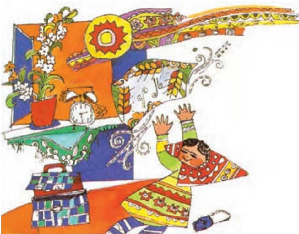
◀ تصویر ۲۱