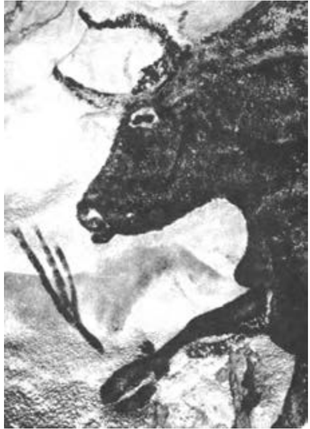
▶ تصویر ۱۵- الف- گاو نر سیاه، جزئی از نقاشی درون غار لاسکو- فرانسه- حدود ۱۰۰۰۰ تا ۱۵۰۰۰ سال قبل از میلاد

انسان‌های غارنشین با استفاده از خط و سطوح هندسی ساده به نحو بسیار ساده و هنرمندانه‌ای توانسته‌اند به قالب‌های ساده و بدیع جهت برقراری ارتباط با یکدیگر و القای مفاهیم و آیین‌های مذهبی دست یابند. و این آرزو همواره هنرمندان