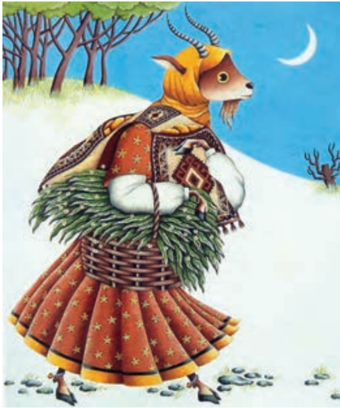
▲ تصویر ۹