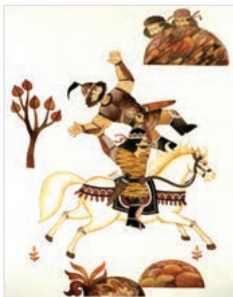
▲ تصویر ۳-ج — اثر محسن حسن پور، هنرمند در این اثر با استفاده از رنگ های هم خانواده توانسته است فضای اسطوره ای را تداعی کند.