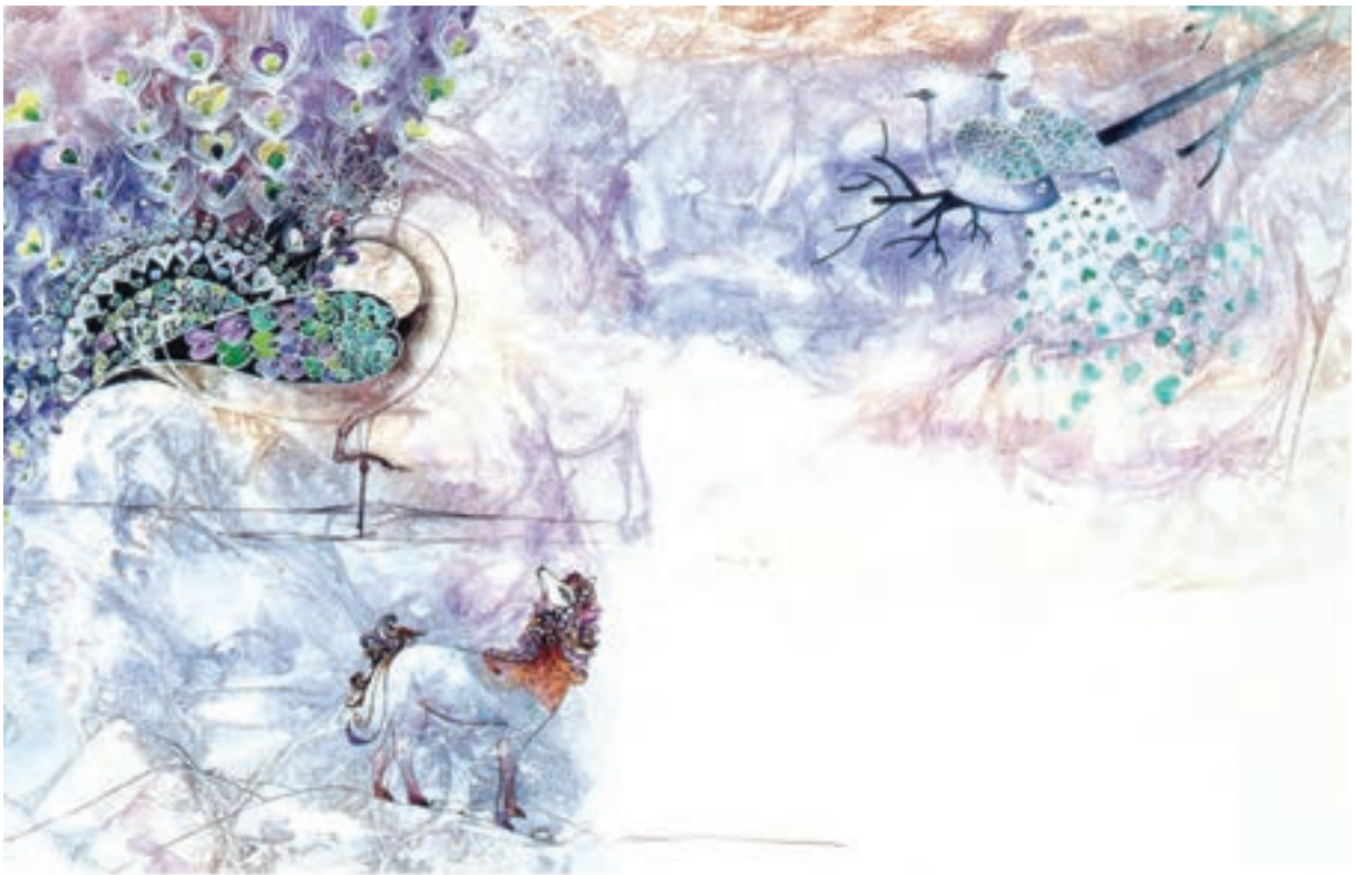
▲ تصویر ۱۰