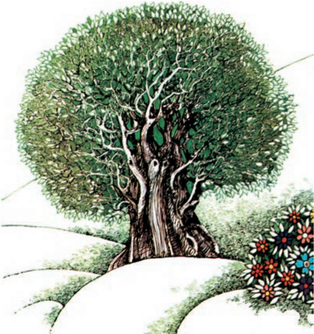
▲ تصویر ۸