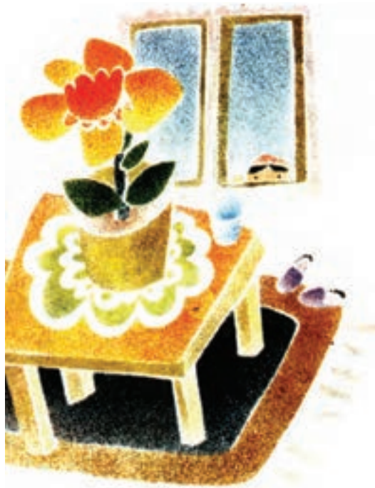
▲ تصویر ۱۱