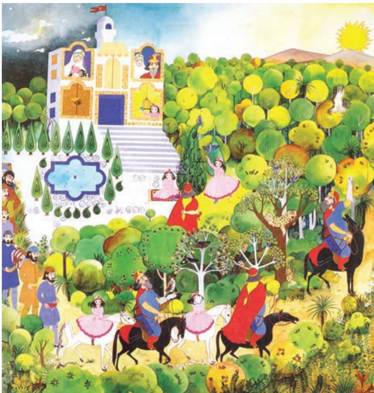
▲ تصویر ۵