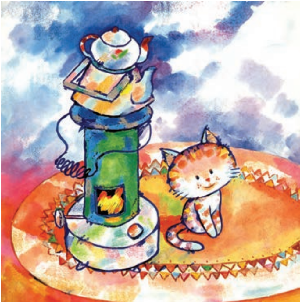
▲ تصویر ۱۴