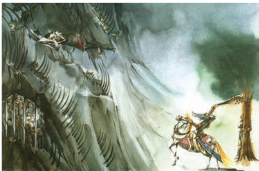
▲ تصویر ۲۴