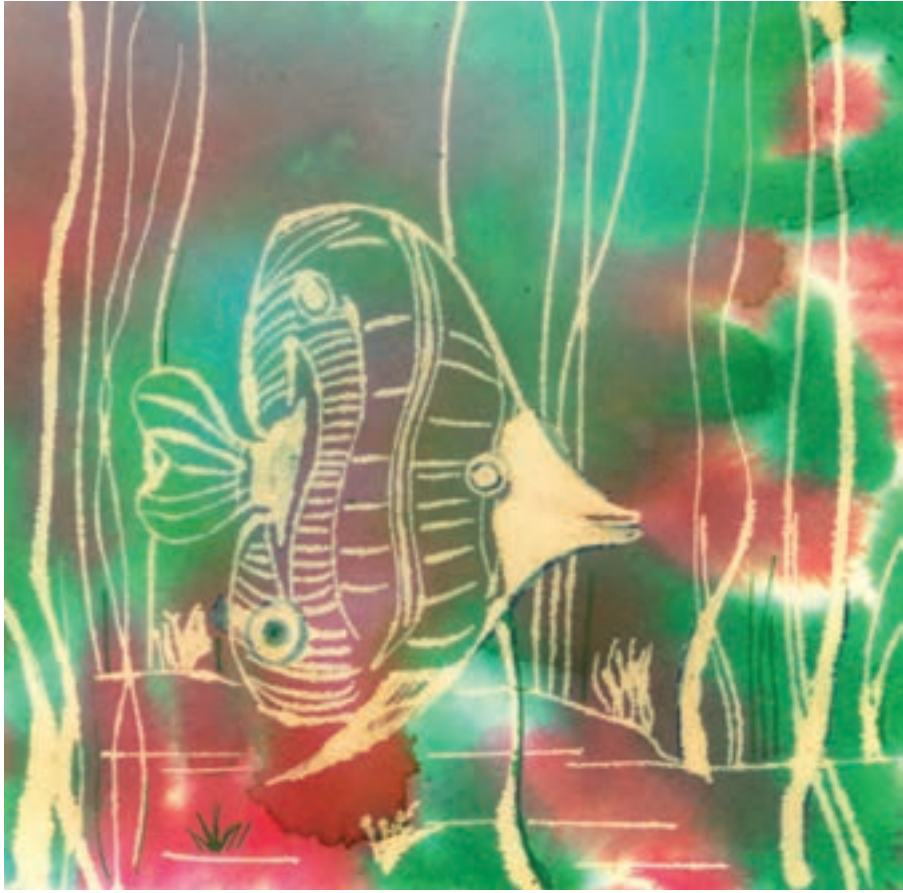
▲ تصویر ۵۷-ج - اثر دانشجو مهناز سیداختیاری