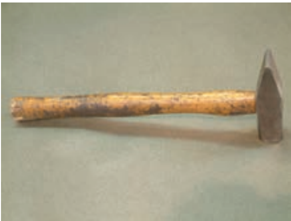
شکل ۹-۱- چکش فلزی

از چکش های پلاستیکی، بیش تر در جمع کردن قطعات موتور یا کوبیدن سیم پیچ های استاتور استفاده می شود؛ به عبارت دیگر می توان گفت در ضربه های ظریف از چکش های پلاستیکی استفاده می شود (شکل ۸-۱).