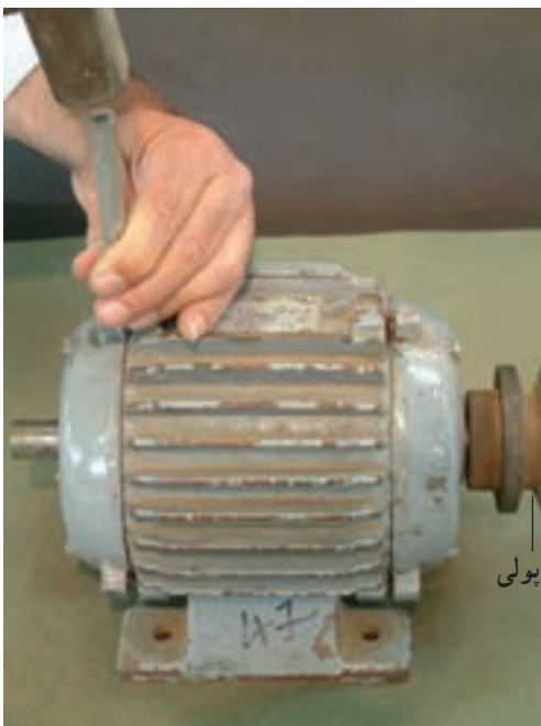
شکل ۱۰-۱- استفاده از چکش فلزی برای علامت گذاری در باز کردن قطعات موتور

در بریدن سیم های استاتور از قلم و برای درآوردن درپوش ها از چکش های فلزی استفاده می شود (شکل های ۹-۱ و ۱۰-۱)