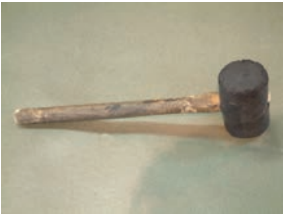
شکل ۸-۱- چکش پلاستیکی

۲-۲-۱- چکش: در سیم پیچی الکتروموتورها از دو نوع چکش استفاده می شود. بدنه ی موتورهای الکتریکی اغلب از آلومینیوم یا از آلیاژهای آن ساخته می شود، لذا این بدنه ها تحمل ضربات چکش های سنگین فلزی را ندارند؛ بدین علت از چکش های پلاستیکی یا چکش های فلزی کوچک در سیم پیچی موتورها استفاده می شود.