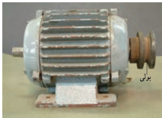
شکل ۱-۱ - موتور سه فاز کامل

۱-۱- آشنایی با قطعات اصلی الکتروموتورها موتورهای جریان متناوب به صورت موتورهای تک فاز و سه فاز ساخته می‌شوند. موتورهای تک فاز اغلب مصارف خانگی دارند و معمولاً در توان‌های کم‌تر از یک اسب بخار ساخته می‌شوند، ولی موتورهای سه فاز بیش‌تر کاربرد صنعتی دارند و در توان‌های کم تا چند صد کیلووات ساخته می‌شوند (شکل ۱-۱). ساختمان داخلی موتورهای تک فاز و سه فاز تقریباً یکسان است. با این تفاوت که در موتورهای تک فاز گاهی از کلید گریز از مرکز استفاده می‌شود که در موتورهای سه فاز کاربرد ندارد.