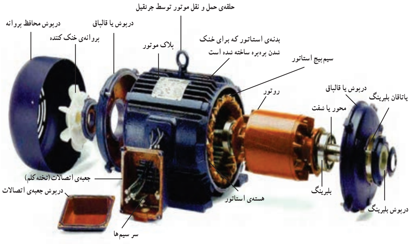
شکل ۱-۳- اجزای اصلی موتور سه فاز

موتورهای تک فاز به سبب داشتن تجهیزات اضافی از موتورهای سه فاز حجیم تر و گران تر می باشند و مقدار توان آنها در مقایسه با موتورهای سه فاز مشابه کم تر است و ضریب توان کم تر از موتورهای سه فاز دارند، به دلایل فوق، در صنعت از موتورهای تک فاز خیلی کم استفاده می شود. یک الکتروموتور سه فاز از قسمت های مختلفی تشکیل شده است. این قسمت ها در شکل ۱-۳ نشان داده شده اند.