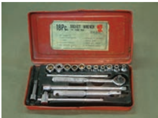
شکل ۱-۷- آچار بوکس

در بعضی مواقع، پیچ و مهره‌ها در عمق زیادتری قطعات داخلی را به هم دیگر ارتباط می‌دهند لذا آچارهای تخت و رینگ قادر به باز و بسته کردن پیچ و مهره‌ها نخواهند بود که در این صورت از آچار بوکس استفاده می‌شود (شکل ۱-۷).