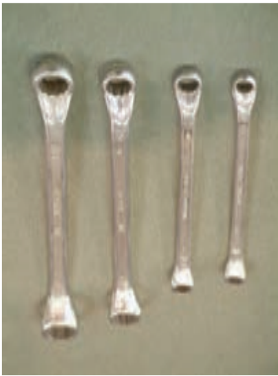
شکل ۱-۶- آچار رینگ

در مواقعی که پیچ یا مهره در سطح کار دستگام نباشد و نسبت به سطح، عمق کمی داشته باشد به گونه‌ای که فک‌های آچارهای تخت نتوانند پیچ یا مهره را بگیرند از آچارهای رینگ استفاده می‌شود. آچارهای رینگ، نظیر آچارهای تخت، به فضای کافی جهت گردش دسته‌ی خود نیاز دارند (شکل ۱-۶).