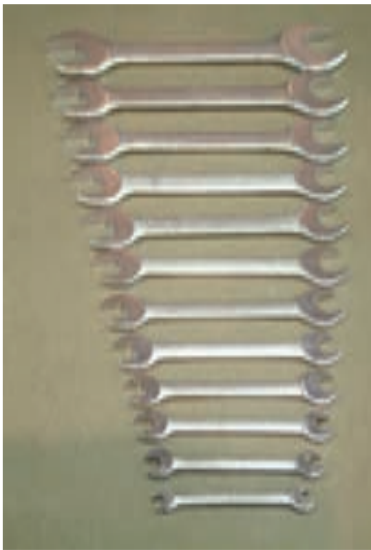
شکل ۱-۵- آچارهای تخت

۱-۲-۱- انواع آچار: برای باز کردن و سوار کردن اجزای موتورهای الکتریکی اغلب از آچارهای تخت، آچار بوکس و آچار رینگ استفاده می‌شود. از آچارهای تخت برای باز و بسته کردن پیچ و مهره‌هایی که در سطح کار قرار دارند و فضای کافی برای گردش دسته آچار موجود باشد استفاده می‌شود (شکل ۱-۵).