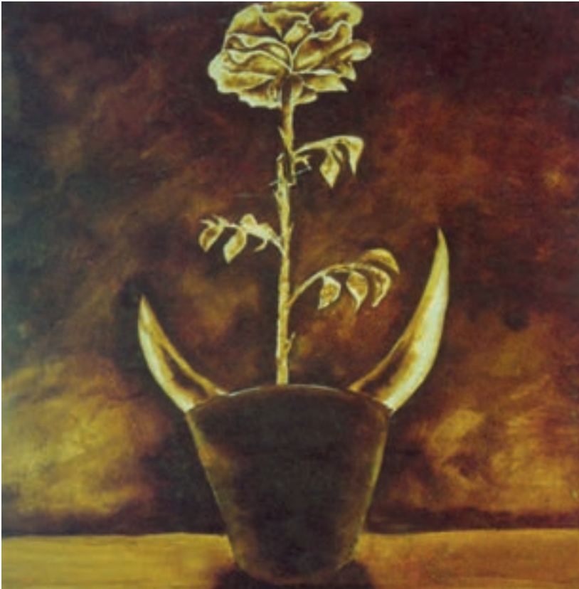
آثار محمد حنظل