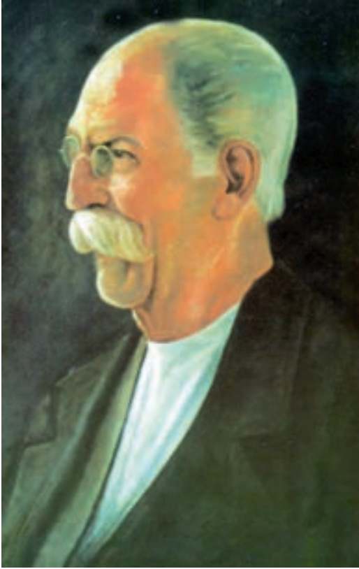
امیر کمال الملک

کمال الملک — ملول از روزگارم. رضاخان — استاد، این چه سماجیه که اهل هنر دارند در نبوسیدن دست قدرت؟ تکبر نیست؟ کمال الملک — عوالم آنها جد است.