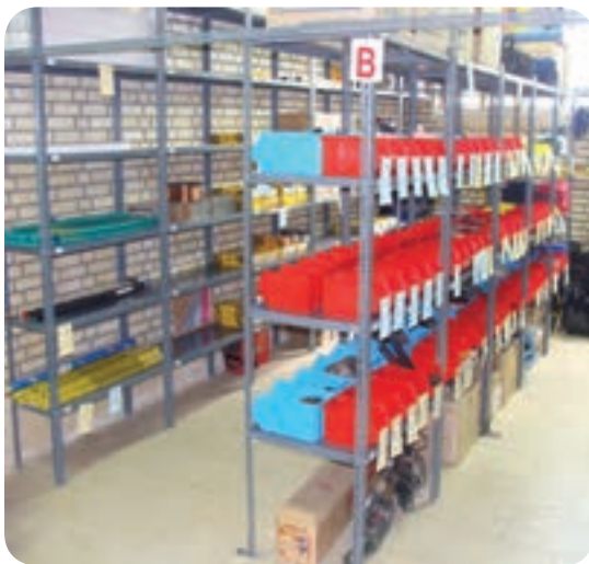
انبار مواد مصرفی جوشکاری