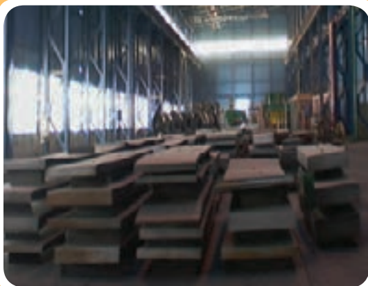
ج) انبار نگه‌داری انواع ورق فولادی