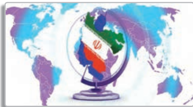
تصویر ۱-۲- جمهوری اسلامی ایران در بین کشورهای منطقه از امنیت ملی بالایی برخوردار است