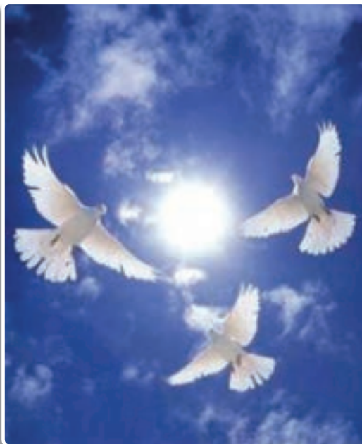
تصویر ۴-۱- پیام دین اسلام به جهانیان، صلح و دوستی است

واژه صلح به معنای آشتی، دوستی، سازش و ... به کار می‌رود. صلح از قدیمی‌ترین آرمان‌ها و آرزوهای بشر بوده است. به دلیل این‌که زندگی انسان‌ها از ناحیه جنگ و درگیری همواره در معرض تهدید و خطر بوده است، در طول تاریخ افراد زیادی تلاش کرده‌اند تا از جنگ و خونریزی جلوگیری کنند و بین انسان‌ها صلح و دوستی برقرار نمایند.