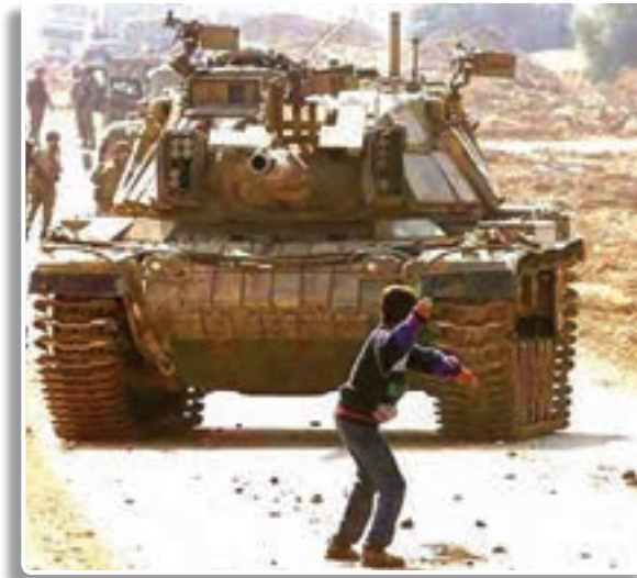
تصویر ۱-۱- تهاجم تانک‌های رژیم اشغالگر سرزمین فلسطین به مردم در غزه