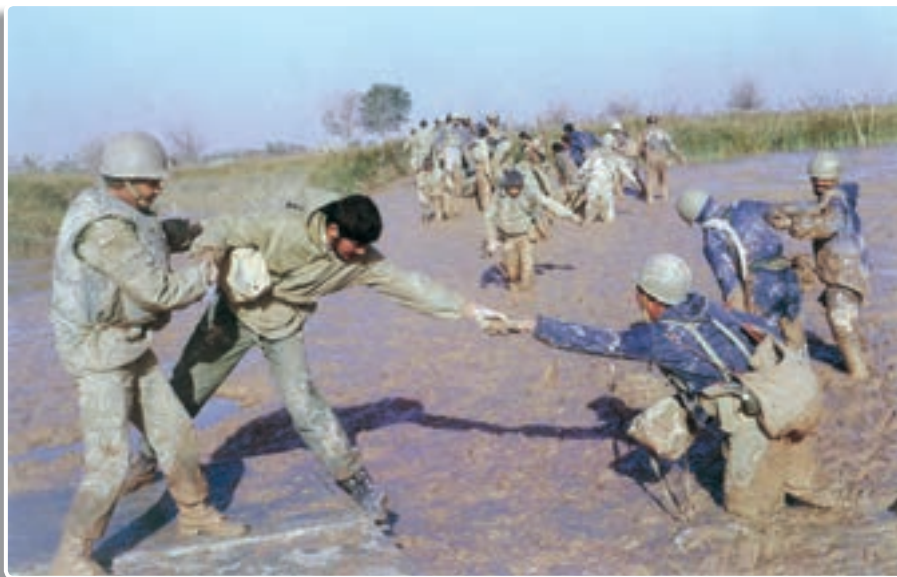
تصویر ۳-۳- رزمندگان میهن در منطقه عملیاتی والفجر ۸

موج عظیم مردمی در قالب «بسیج» برای دفاع از حقانیت اسلام و ایران به دفاع مقدس طعم غیرت و شرف دادند. سربازان ما در جبهه‌های نبرد حق علیه باطل به سرباز بودن خود می‌بالیدند. نیروهای مسلح شامل نیروی زمینی، هوایی، دریایی، ارتش جمهوری اسلامی ایران، سپاه پاسداران انقلاب اسلامی، نیروی انتظامی، هوانپروز و نیروهای جان بر کف جهاد سازندگی با انگیزه‌های الهی، شانه به شانه بسیج که پشتوانه مردمی و بازوی توانایشان بود، با وجود کمبود سلاح و مهمات و مشکلات اولیه، جانانه و قهرمانانه می‌جنگیدند. عشایر غیور ایران زمین و اقوام مختلف شامل آذری، لر، عرب، کرد، ترکمن، بلوچ و سایر قومیت‌ها و همچنین پیروان کلیه ادیان الهی در میهن ما متحد و منسجم تحت لوای پرچم مقدس جمهوری اسلامی و با هدایت و رهبری امام خمینی، سلحشوری و ایثارگری را معنا بخشیدند.