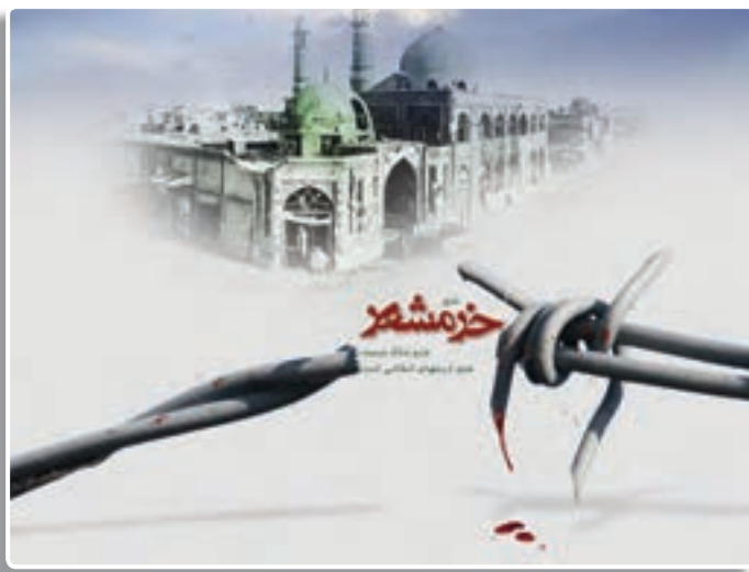
تصویر ۳-۴- خرمشهر را خدا آزاد کرد. «امام خمینی»

برخی معتقد بودند که با عقب راندن صدام در بسیاری از نقاط مرزی کشور، دیگر نیاز به ادامه جنگ نیست، اما مسئولان سیاسی و نظامی کشور و عموم مردم معتقد بودند که در چنین شرایطی نمی‌توان به صداقت دشمن و اراده سازمان‌های بین‌المللی اطمینان کرد و آتش‌بس را پذیرفت.