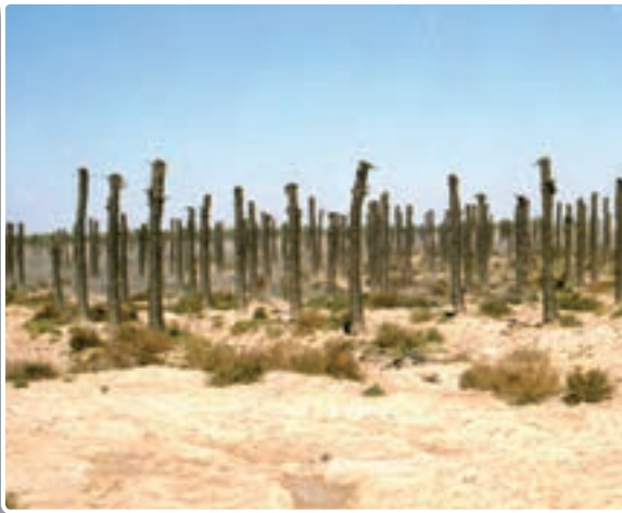
تصویر ۱-۳- نخل‌های سوخته