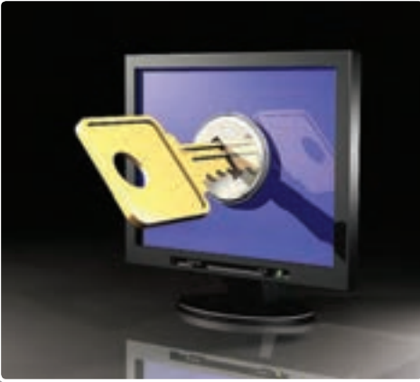
تصویر ۳-۱- پیشگیری و مقابله با تهدید نرم