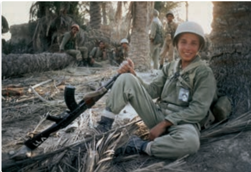
تصویر ۲-۳- رزمنده نوجوان بسیجی در مناطق عملیاتی جنوب

ایمان به خدا، رهبری حکیمانه امام خمینی (ره)، یکپارچگی و مشارکت مردم نه تنها موجب پیروزی انقلاب اسلامی ایران شد، بلکه بالاترین سلاح و مهمات ما در هشت سال دفاع مقدس بود. امام خمینی (ره) فرمودند: «جنگ، جنگ است و عزت و شرف ما در گرو همین مبارزه است». فرزندان غیور ملت شریف ایران با اعتقاد به خدای بزرگ و نصرت الهی در صفوف متحد به سوی جبهه‌ها روانه شدند و این نوای شیرین را سر می‌دادند: «هرکه دارد هوس کرب و بلا بسما...».