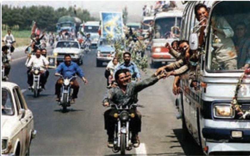
تصویر ۵-۳- بازگشت آزادگان به میهن اسلامی

تهاجم دشمن پس از پذیرش قطعنامه نشان داد که اگر ما قدرت و توان لازم برای دفاع از کشورمان را نداشته باشیم، نمی‌توانیم صرفاً با امید به قطعنامه‌های بین‌المللی به صلح برسیم. در تاریخ ۲۶ مرداد ۱۳۶۹ (حدود دو سال پس از پذیرش قطعنامه) سرانجام با شکست مجدد صدام، نیروهای دو کشور به مرزهای بین‌المللی برگشتند. بازسازی شهرها و روستاهای مناطق جنگی آغاز شد و آزادگان سرافراز میهن اسلامی پس از تحمل سال‌ها درد، رنج و شکنجه به آغوش وطن بازگشتند و موجی از شادمانی و سرور سراسر کشور را فراگرفت.