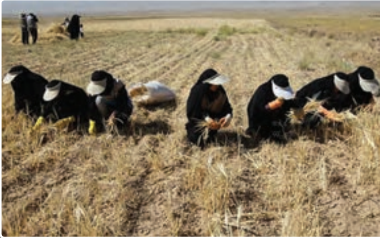
تصویر ۵-۲- حضور دانش‌آموزان بسیجی در عرصه سازندگی کشور