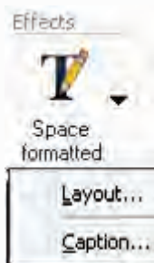
شکل ۳-۴ Text Capture

با توجه به اینکه در حالت Text Capture جلوه‌های متفاوتی در بخش Effects قرار می‌گیرد که مخصوص این بخش ایجاد شده است، در ادامه به بررسی این جلوه‌ها و کاربرد آنها در متون جدا شده از عکس می‌پردازیم. (شکل ۳-۴)