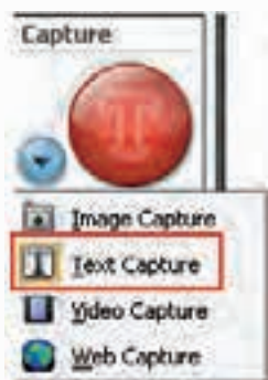
شکل ۳-۱ انتخاب حالت Capture

برای گرفتن Capture به صورت Text در قسمت Capture Mode روی گزینه‌ی Text Capture کلیک کنید. (شکل ۳-۱)