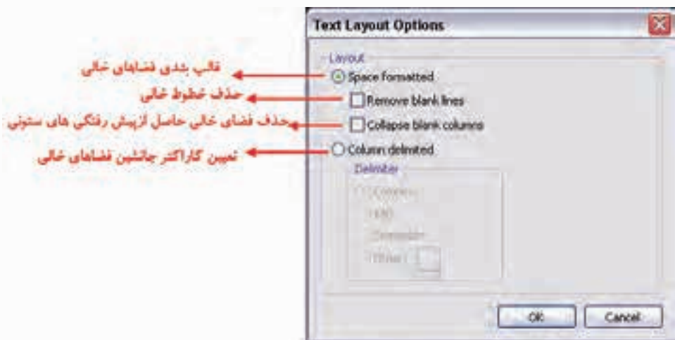
شکل ۳-۵ کادر محاوره تنظیمات جلوه Layout

از این گزینه برای تنظیم قالب بندی مربوط به فضاهای خالی و کاراکترهای جانشین قرار گرفته در این فضاها استفاده می‌شود با اجرای این گزینه، کادر محاوره‌ای مربوط به آن باز خواهد شد. (شکل ۳-۴)