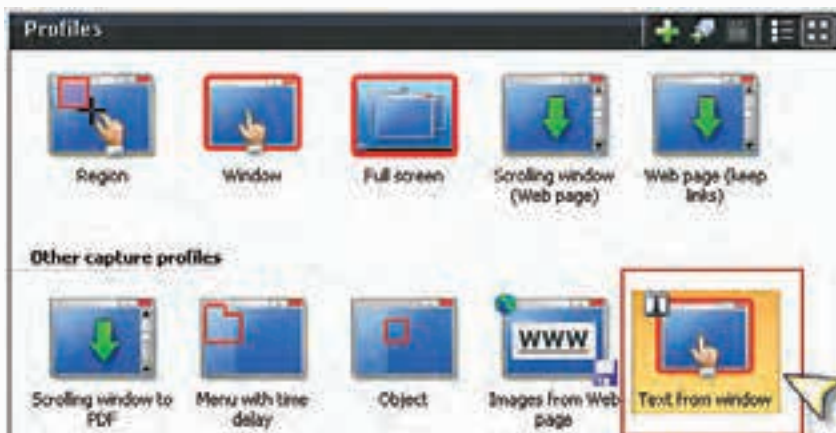
شکل ۳-۲ انتخاب نوع ورودی از بخش Profiles

پنجره‌های را که می‌خواهید متن موجود در آن را جدا کنید، باز کرده و سپس در نرم‌افزار SnagIt از پانل Profile گزینه‌ی Text from a window را انتخاب کنید. اکنون اگر دکمه Capture را که در قسمت پایین و سمت راست کادر محاوره قرار دارد، کلیک کنید یا از کلید میانبر تعریف شده (Print Screen) استفاده کنید، اشاره‌گر ماوس به شکل یک دست در می‌آید؛ در این حالت چنانچه روی پنجره مورد نظر کلیک کنید، عملیات Capture انجام خواهد شد. (شکل ۳-۲)