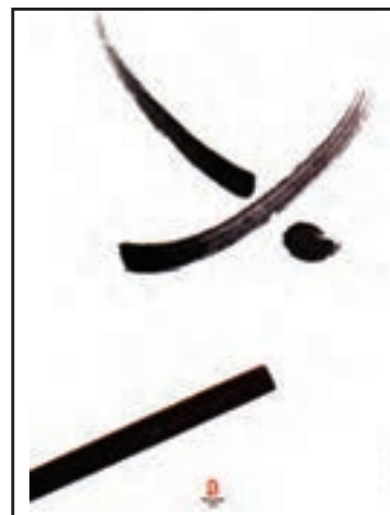
کان- تای کنونک - طراحی برای رشته‌های ورزشی المپیک