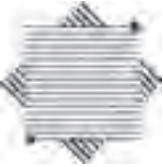
نشانه‌ی انجمن ویراستاران طراح: قباد شیوا

۲. به صورت خطوط باریک یا ضخیم یکنواخت باشند.