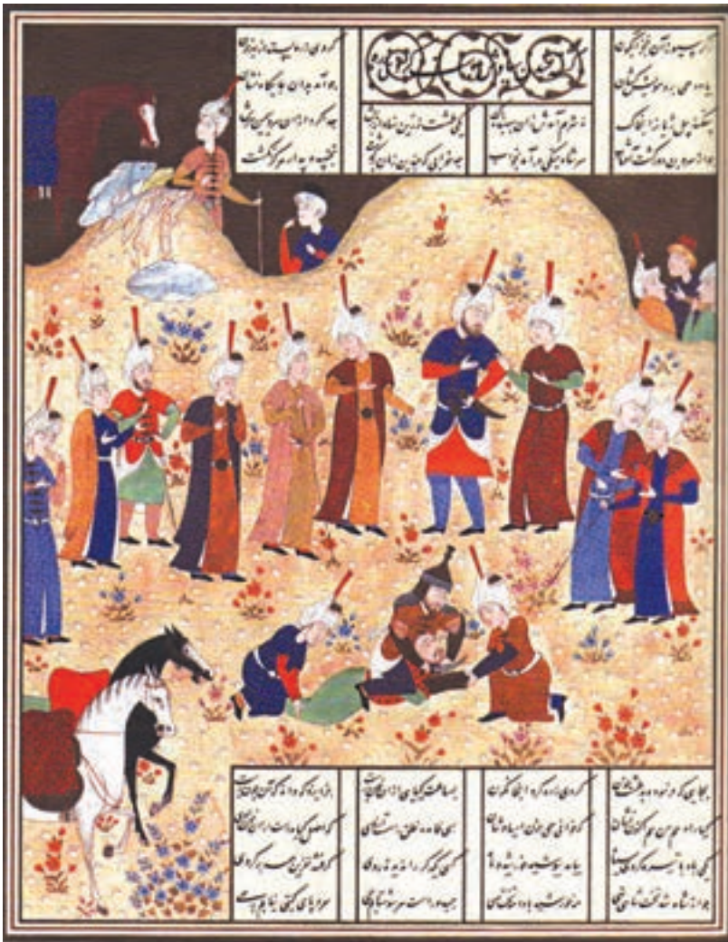
کشته شدن سیاوش، شاهنامه بایسنغری

۶. عامل مفروض: عنصر پر قدرتی که سایر عوامل موجود در کادر را در اطراف خودش سازماندهی می کند. برای آشنایی بیش تر با اصول نظام دهنده، به بررسی آن ها در اثر زیر می پردازیم: تصویر زیر صحنه ی کشته شدن سیاوش، از نگاره های شاهنامه ی بایسنغری است که اصول نظام دهنده ی آن عبارتند از: