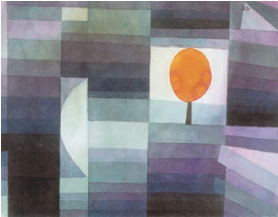
ترکیب غیر قرینه در تابلوی پیام آور پاییز اثر پل کله

در ترکیب غیر قرینه عناصر موجود در تصویر بر اساس ارزش‌های بصری خودشان مثل رنگ، تیرگی، روشنی، بافت و... در کادر قرار می‌گیرند نه بر اساس محورهای عمودی، افقی و مورب کادر.