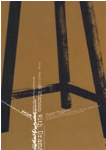
نمونه‌ی استفاده از ترکیب‌بندی مثلثی در یک پوستر (راس مثلث خارج از کادر واقع شده است.)

آثاری که دارای ترکیب‌بندی مثلثی هستند، عموماً از استحکامی استثنایی برخوردارند. هنرمندان رشته‌های مختلف هنری در بسیاری از موارد از استحکام و ساختار منسجم مثلث، برای ترکیب‌بندی سود برده و کیفیت آن‌را با نیاز تصویر مورد نظر خود منطبق کرده‌اند.