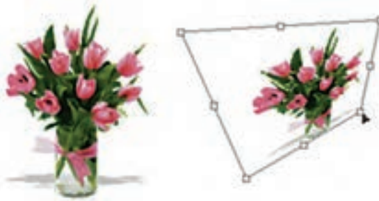
شکل ۱۸-۹ به هم ریختن تصویر

با استفاده از این دستور در Photoshop می‌توان عملی مشابه دستور Skew را انجام داد ضمن این که تا حدودی این دستور عمل تغییر مقیاس یا اندازه را نیز انجام می‌دهد. با این تفاوت که در این جا وقتی کادر مورد نظر در اطراف تصویر مورد نظر ایجاد می‌شود هنگامی که اقدام به کشیدن دستگیره‌های موجود می‌کنید این امکان به شما داده می‌شود که آن را به طرف گوشه مقابل نیز جابجا کنید. به طور کلی از این دستور برای به هم ریختن فرم اصلی یک تصویر و افقی کردن در جهات مختلف استفاده می‌شود. (شکل ۱۸-۹)