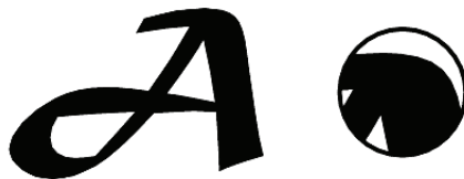
شکل ۲-۱۸ وضعیت پیکسل‌ها هنگام بزرگ کردن تصاویر برداری

شود هیچ گونه تأثیری بر کیفیت آن‌ها نخواهد داشت. (شکل ۲-۱۸) اما مهم‌ترین عیب این گونه نرم‌افزارهای گرافیکی آن است که برای ویرایش تصاویر با درجه رنگی پیوسته مناسب نمی‌باشند.