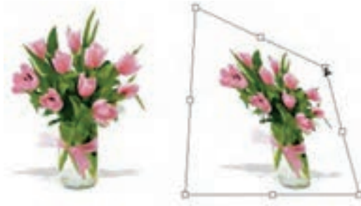
شکل ۱۸-۸ کج کردن تصویر (Skew)