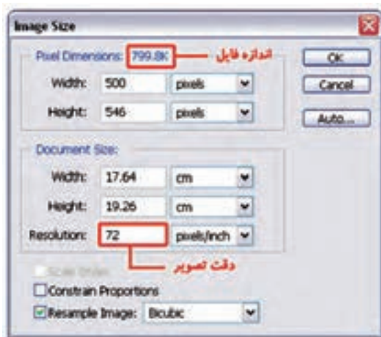
شکل ۳-۱۸ تغییر دقت تصویر و رابطه آن با حجم فایل

برای این که مشاهده کنید تفاوت Resolution تصویر که ما به آن دقت تصویر می‌گوییم چه تأثیری بر حجم فایل دارد به مثال زیر توجه کنید: (شکل ۳-۱۸)