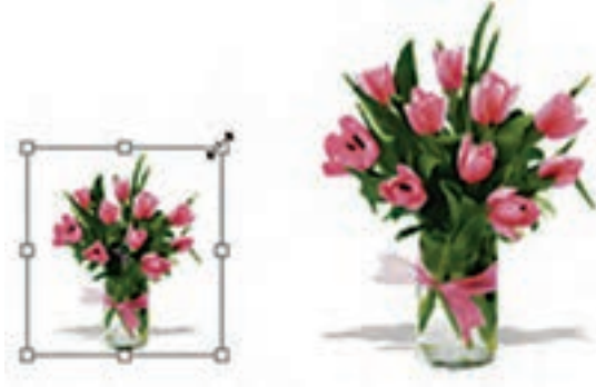
شکل ۶-۱۸ تغییر اندازه (Scale)

با اجرای دستور Scale در اطراف بخش انتخاب شده محدوده‌ای ایجاد می‌شود که دارای دستگیره‌های مختلفی برای تغییر اندازه در جهت‌های مختلف است و شما می‌توانید با پایین نگه داشتن کلید Shift و کشیدن یکی از گوشه‌های آن به‌طور متناسب بخش انتخاب شده را تغییر مقیاس دهید. برای اعمال تغییرات از کلید Enter یا دابل کلیک در داخل محدوده مورد نظر استفاده کنید. (شکل ۶-۱۸)