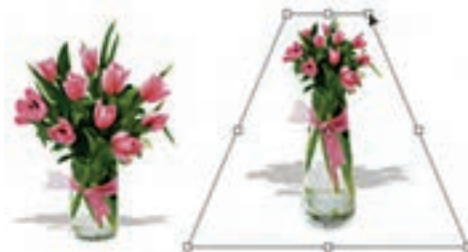
شکل ۱۸-۱۰ پرسپکتیو به تصویر

به کمک این دستور می‌توان بخش انتخاب شده یا کل یک تصویر را دارای عمق و زاویه دید مشخصی کرد. این گزینه یکی از مفیدترین و کاربردی‌ترین دستورهایی بخش Transform است، به طوری که با اجرای آن و با ایجاد کادر انتخاب مورد نظر در اطراف تصویر کاربر می‌تواند با استفاده از دستگیره‌های موجود در این کادر به تصویر خود عمق و زاویه خاص بدهد. ضمن این که در این دستور با تغییر دادن یک گوشه و جابه‌جا کردن آن، گوشه مقابل آن نیز متناسب با این گوشه تغییر خواهد کرد. این تفاوت اصلی‌ترین تفاوت این دستور با دستور Distort می‌باشد. (شکل ۱۸-۱۰)