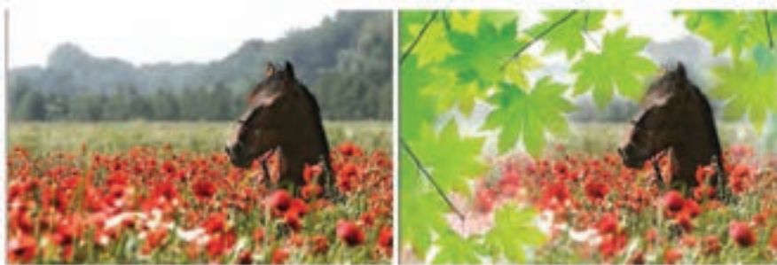
شکل ۵-۲۳ ترکیب دو تصویر با استفاده از Mask