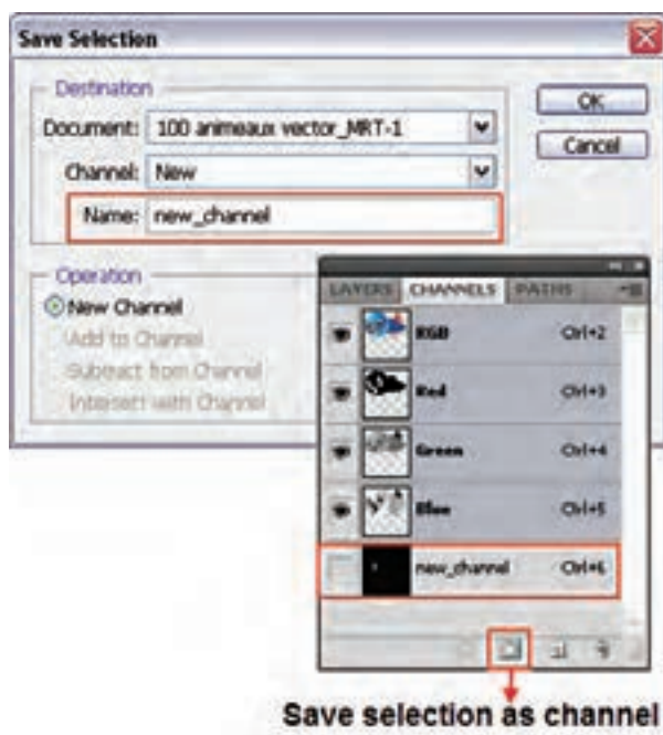
شکل ۲-۲۳ - نحوه‌ی ذخیره‌ی یک کانال

البته این عمل را می‌توان از دکمه Save selection as channel در پایین پالت کانال نیز انجام داد. توجه داشته باشید برای بارگذاری مجدد ناحیه انتخاب شده که در قالب کانال ذخیره شده است یا تمامی کانال‌های آلفا می‌توان از منوی select و دستور Load selection استفاده کرد. (شکل ۲-۲۲)