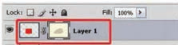
شکل ۶-۲۳-جابه‌جای ماسک لایه