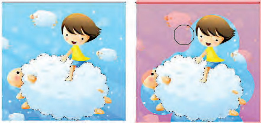
شکل ۴-۲۳ افزایش و کاهش ناحیه انتخاب با استفاده از Quick Mask

۶. گزینه Select | Deselect را برای خارج کردن ناحیه انتخاب شده از حالت انتخاب، کلیک کنید یا این‌که ناحیه انتخاب شده را ذخیره کنید.