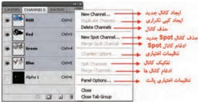
شکل ۳-۲۳ دستورهای منوی کانال

می‌توانید در یک تصویر با مد CMYK کانال‌های رنگی تصویر را از هم جدا کنید و سپس کانال‌ها را جدا از هم ذخیره کنید یا کانال‌های جدا شده را با هم ادغام کنید. در شکل ۳-۲۳ تصویری دیده می‌شود که کانال‌های رنگی آن از هم جدا شده‌اند. (شکل ۳-۲۳)