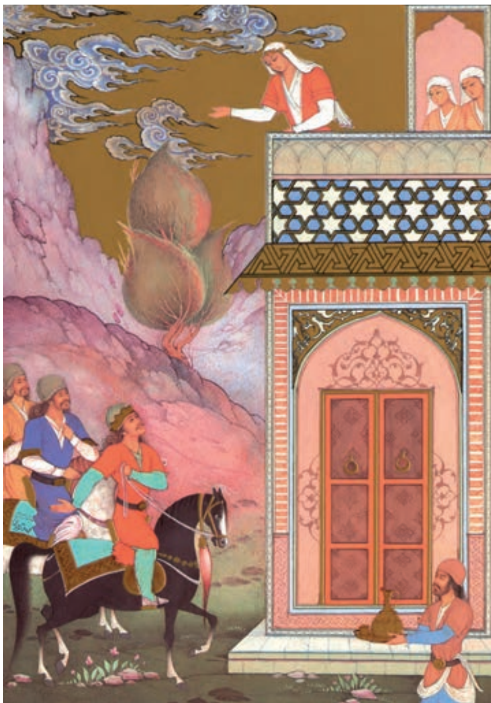
اثر محمدباقر آقامیری