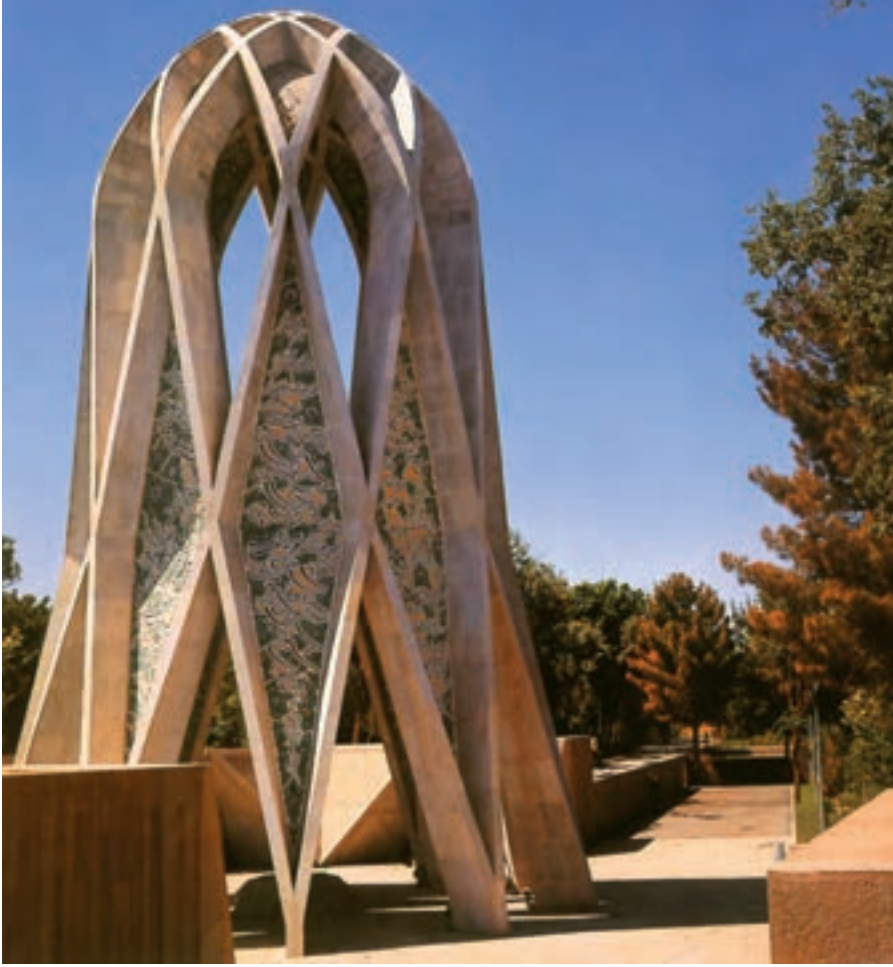
نیشابور، آرامگاه ختام