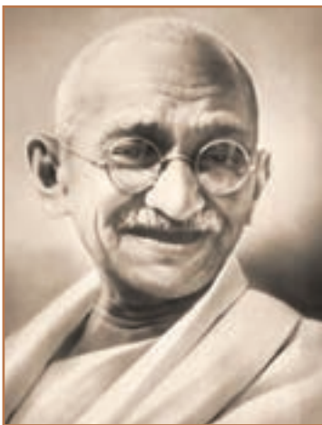
مهاتما گاندی رهبر جنبش ضد استعماری هندوستان

تأسیس کنگره ملی هند: در سال ۱۸۸۵ م. گروهی از روشنفکران هند با استفاده از آزادی محدودی که وجود داشت، به تأسیس کنگره ملی هند اقدام کردند. این کنگره می‌کوشید با استفاده از ظرفیت‌های قانونی و پرهیز از روش‌های خشونت‌آمیز، راه هند را به سوی استقلال هموار کند. درخواست‌های اولیهٔ بانیان کنگره عبارت بود از: رسمیت یافتن زبان هندی در کنار زبان انگلیسی و انتخابی شدن نیمی از اعضای مجلس مقننه و مجاز بودن به اظهار نظر در مورد بودجهٔ کشور. سرانجام ادامهٔ مبارزات منجر به استقلال هند شد. ۱ مهاتما گاندی رهبر هند، در این مبارزات نقش بسیاری داشت.