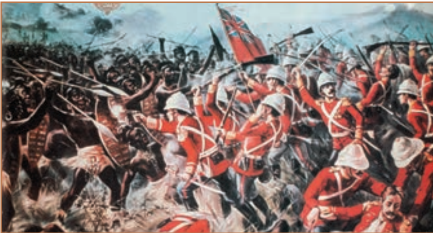
هجوم نظامی استعمارگران به کشورهای آفریقایی

به سرزمین‌هایی که جزء قلمرو کشور دیگری به شمار نمی‌آیند اما زیر چتر «حمایت» و به واقع «نفوذ» یک دولت قدرتمند قرار می‌گیرند و آن دولت در آن سرزمین، حق حاکمیت (گاهی محدود و مشروط) و قضاوت دارد «تحت‌الحمایه» گفته می‌شود. کشور تحت‌الحمایه در امور داخلی خودگردان اما در امور خارجی، تابع کشور حامی خود است.