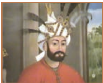
شاه تهماسب اول صفوی

شاه تهماسب به تدریج زمام قدرت را به دست گرفت و به خودسری سران قزلباش پایان داد. او همچنین از بکان را شکست داد و با اتخاذ تدابیر مناسب، مانع موفقیت سپاه عثمانی در هجوم‌های مکرر به قلمرو ایران شد. ۱ در نتیجه چنین تدابیری بود که امپراتور عثمانی دست از جنگ برداشت و با انعقاد قرارداد آماسیه، برای مدتی میان دو کشور صلح برقرار شد. بدین‌گونه شاه تهماسب توانست با اتخاذ تدابیر