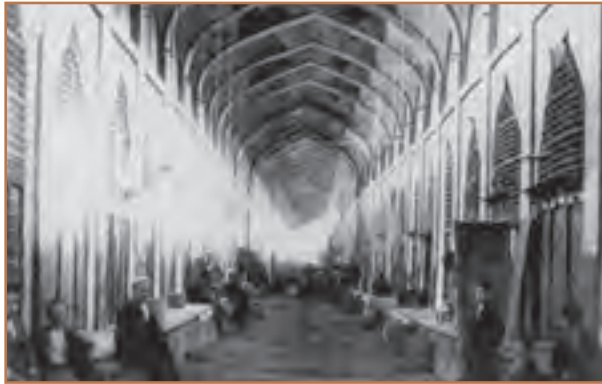
بازار وکیل — شیراز

بی‌مهری نادرشاه نسبت به عالمان شیعه و هنرمندان، باعث مهاجرت گسترده آنان به عتبات عالیات و هند، و در نتیجه رکود فعالیت‌های علمی و فرهنگی شد. مرگ نادر و ستیز افراد و گروه‌های مختلف برای رسیدن به قدرت، نیز اوضاع سیاسی و اجتماعی و اقتصادی ایران را آشفته‌تر کرد. آرامش، امنیت و ثبات نسبی که در دوران کریم‌خان زند بر بخش‌هایی از ایران حکمفرما گردید، موجب شد که اوضاع اجتماعی، اقتصادی و فرهنگی کمی بهتر شود. بر اثر حمایت و تشویق کریم‌خان، فعالیت‌های عمرانی، کشاورزی و بازرگانی تا حدودی رونق یافت. گروهی از عالمان و هنرمندان مهاجر، به ایران بازگشتند و شهرهای شیراز و اصفهان بار دیگر کانون علم و ادب و هنر شدند.