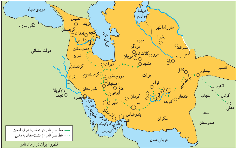
قلمرو افشاریان (نادرشاه)