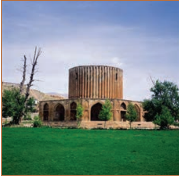
کاخ نادر در کلات مشهد