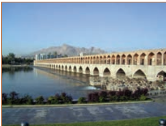
سی و سه پل اصفهان

صفویان وارث میراث غنی فکری و فرهنگی گذشته ایران بودند. وجود امنیت و ثبات سیاسی، بهبود اوضاع اقتصادی به‌ویژه در عصر شاه عباس اول، و نیز حمایت مادی و معنوی شاهان و حاکمان از عالمان، دانشمندان و هنرمندان، زمینه و شرایط لازم را برای شکوفایی علم و هنر در آن دوره فراهم آورد.