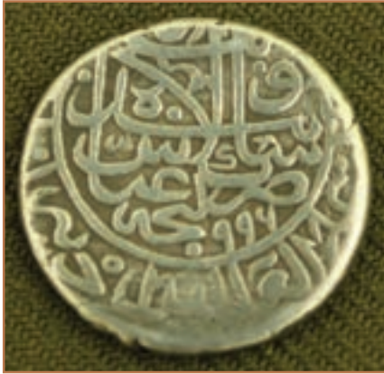
سکه دوره شاه عباس

۴- بهبود اوضاع اجتماعی، اقتصادی و فرهنگی از طریق ایجاد امنیت، آرامش و ثبات سیاسی؛ ۵- انتصاب افراد با کفایت و در عین حال گمنام به سمت‌های سیاسی، اداری و نظامی.