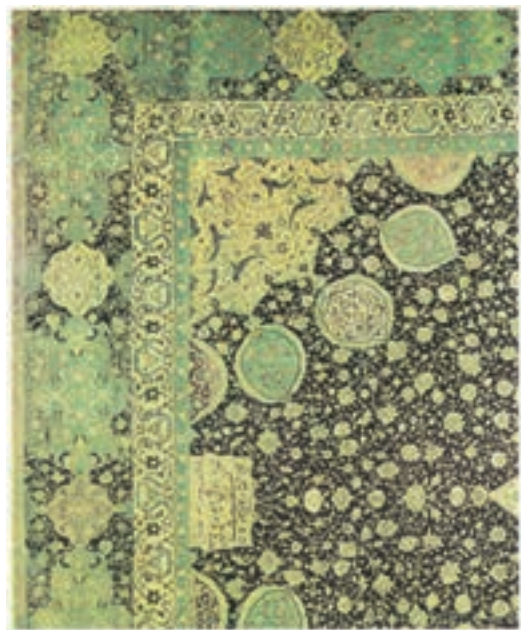
قالی اردبیل مربوط به دورهٔ صفوی