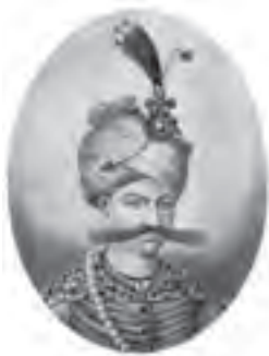
شاه عباس اول صفوی