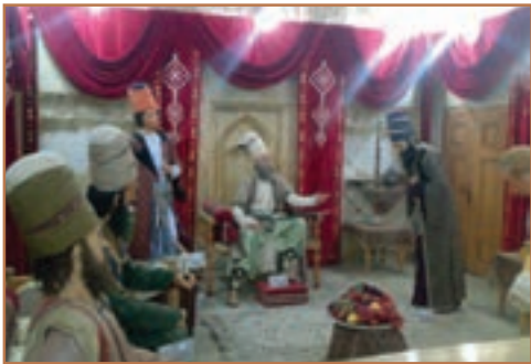
دربار کریم خان زند

کریم خان یکی از افراد ایل زند بود که بعد از یک دوره بیست ساله جنگ و گریز بر دیگر مدعیان