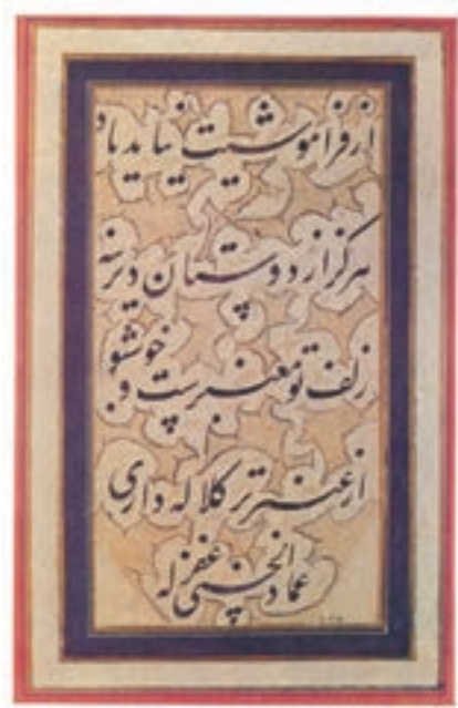
نمونه‌ای از خط میرعماد خوشنویس دورهٔ صفوی

در عصر صفوی، هنر ایرانی نیز رونق و شکوفایی یافت. معماری از جلوه‌های اصلی هنر آن دوره بود. ساخت کاخ‌ها، پل‌ها، کاروانسراها، مدارس، مساجد، مقبره‌ها، کلیساها و باغ‌ها تنها به عمران و آبادانی کشور کمک کرد، بلکه سبک و شیوهٔ جدیدی در هنر معماری پدید آورد. اوج شکوفایی معماری صفوی در اصفهان، پایتخت صفویان متجلی شد و خاطره و شکوه شهرهایی چون تخت جمشید، تیسفون و سمرقند را زنده کرد. هنر نقاشی نیز مورد حمایت جدی دربار صفوی بود. در آن دوره، هنرمندان برجسته‌ای نظیر کمال‌الدین بهزاد، رضا عباسی و میرعماد پرورش یافتند و آثار ارزنده‌ای در رشته‌های مختلف هنری خلق کردند. هنرهای کتاب‌سازی، جلدسازی، تذهیب، خطاطی، خوشنویسی، سفال‌سازی، فلزکاری، فرش‌بافی نیز از دیگر هنرهای بودند که در عصر صفوی رونق بسزایی داشتند.