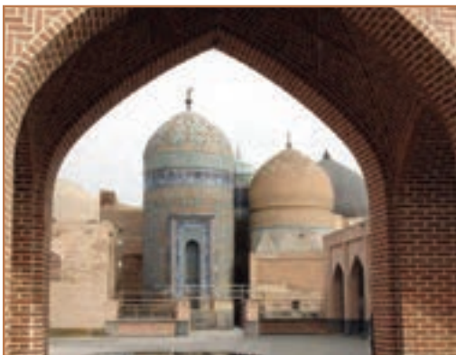
بقعه شیخ صفی‌الدین اردبیلی در شهر اردبیل

هجوم مغولان و تشکیل حکومت ایلخانان در ایران دو پیامد مذهبی و اجتماعی مهم را به همراه داشت که در درازمدت زمینه را برای تشکیل سلسله صفویه فراهم کرد: الف) هرج و مرج اجتماعی و نابسامانی اقتصادی زمینه گسترش دنیاگریزی و رونق جریان تصوف را فراهم آورد. ب) در نتیجه دگرگونی سیاسی و فرهنگی، شیعیان فرصت یافتند تا اندیشه‌های شیعه را در ایران تبلیغ و ترویج کنند.