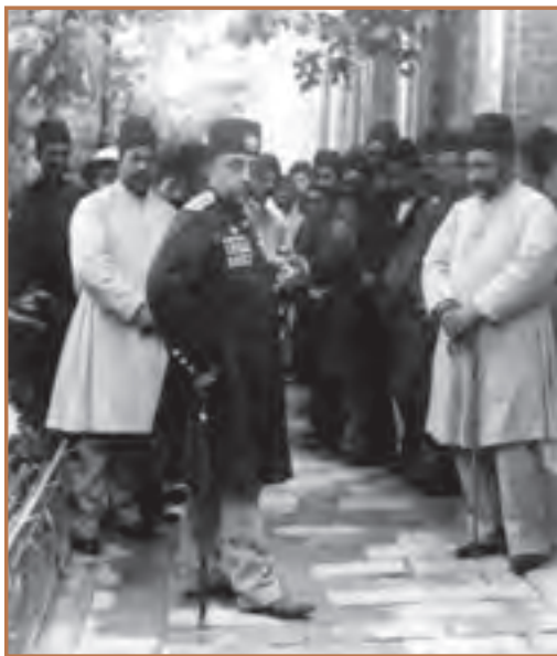
مظفرالدین شاه قاجار و جمعی از درباریان

ناصرالدین شاه در آستانه پنجاهمین سال سلطنت خود توسط میرزا رضا کرمانی مورد هدف قرار گرفت و کشته شد. با قتل وی، پسرش مظفرالدین میرزا به سلطنت رسید. در دوره سلطنت ناصرالدین شاه، زمینه‌های بیداری مردم به تدریج فراهم شد و در دوره سلطنت مظفرالدین شاه، ایران دچار یک تحول سیاسی شد.