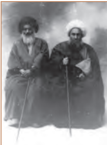
آیت‌الله شیخ فضل‌الله نوری (سمت راست) و آیت‌الله سیدعبدالله بهبهانی (سمت چپ)

اعتراضات مردم نسبت به اوضاع نابسامان کشور با رهبری علما که در رأس آنها آیت‌الله طباطبایی و آیت‌الله بهبهانی قرار داشتند، روز به روز گسترش می‌یافت. عین‌الدوله که خود از شاهزادگان قاجار بود و هرگونه عقب‌نشینی در برابر مردم را به زیان حکومت می‌دانست، کوشید مخالفان را سرکوب