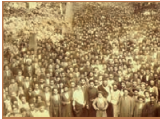
صحنه‌ای از اجتماعات مردم در جریان انقلاب مشروطیت

شهادت رسید. این حادثه خشم مردم را نسبت به حکومت برانگیخت ۱ . رهبران انقلاب تصمیم گرفتند این بار در اعتراض به اقدامات دولت، به نجف و کربلا مهاجرت کنند اما بعد از ترک تهران، در قم اقامت کردند. این مهاجرت که با حضور آیت الله طباطبایی، آیت الله شیخ فضل الله نوری و آیت الله بهبهانی حمایت می‌شد، هم از نظر گستردگی و هم از نظر مسافت، مهم‌تر از مهاجرت قبل بود و به همین علت، به «مهاجرت کبرا» معروف شد.