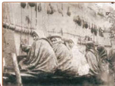
رونق صنعت قالی‌بافی در دوره قاجار