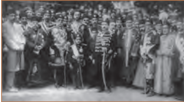
محمدعلی شاه و جمعی از رجال و درباریان هنگام استقرار در باغشاه

به نظر شما، موافقت اولیه محمدعلی شاه با مشروطیت و مخالفت وی با آن پس از رسیدن به سلطنت، چه دلایلی داشت؟