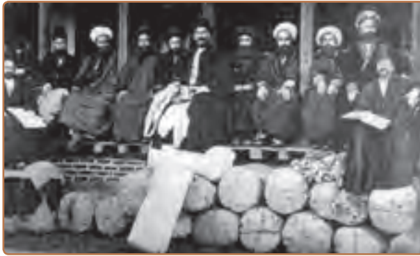
تصرف مرکز رژی در تهران توسط تعدادی از روحانیون و تجار

جنبش تنباکو نتایج سیاسی و اجتماعی مهمی داشت :