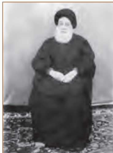
آیت‌الله سیدمحمد طباطبایی