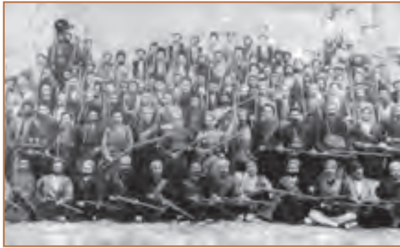
باقرخان در میان جمعی از مشروطه‌خواهان تبریز

دلیرانه شکست خوردند. مأموران شاه مجلس را به توپ بستند و تعدادی از نمایندگان مجلس از جمله آیت‌الله طباطبایی و آیت‌الله بهبهانی را به خارج از تهران تبعید کردند. شماری نیز به سفارت انگلستان پناهنده شدند. چند تن از مشروطه خواهان سرسخت از جمله میرزا جهانگیر خان صوراسرافیل، ملک‌المتکلمین و سید جمال‌الدین واعظ نیز به دستور محمدعلی‌شاه به قتل رسیدند. بدین ترتیب، بار دیگر استبداد به جای مشروطیت نشست و این دوره که یک‌سال و یک‌ماه طول کشید، دوره «استبداد صغیر» نامیده شد.