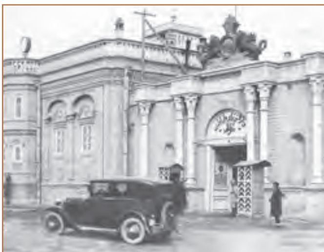
ساختمان مجلس شورای ملی (میدان بهارستان)