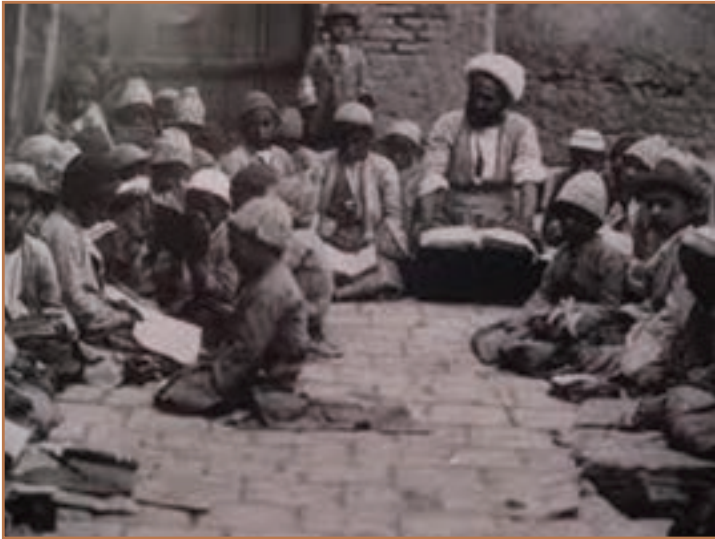
مکتب‌خانه دورهٔ قاجار

ب) مکتب‌خانه‌های خصوصی که در خدمت فرزندان افراد ثروتمند و صاحب مقام بود.