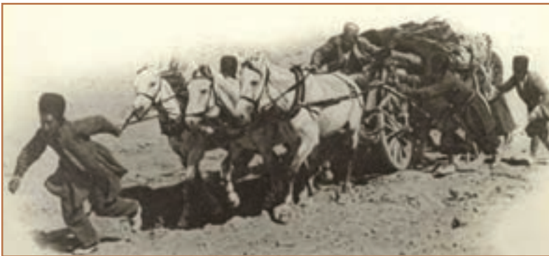
حمل و نقل در عصر قاجار