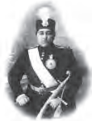
احمدشاه در جوانی

بعد از پناهنده شدن محمدعلی شاه به سفارت روسیه، فاتحان تهران و سران مشروطه در میدان بهارستان تهران اجتماع بزرگی تشکیل دادند و برای اداره موقت کشور، ۲۲ نفر را به عنوان «هیئت مدیره» برگزیدند. یکی از اقدامات فاتحان تهران، انتصاب احمد میرزا، فرزند خردسال محمدعلی شاه به سلطنت بود. چون احمدشاه در هنگام انتصاب به سلطنت هنوز به سن بلوغ نرسیده بود، عضدالملک رئیس ایل قاجار به نیابت سلطنت منصوب شد؛ بنابراین، احمدشاه در پنج سال اول سلطنت خود فقط اسم پادشاه را داشت و پس از آن هم به دلیل کم تجربه‌گی نتوانست بر اوضاع کشور مسلط شود.