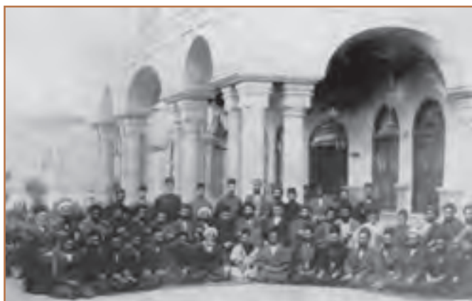
تعدادی از نمایندگان اولین دوره مجلس شورای ملی