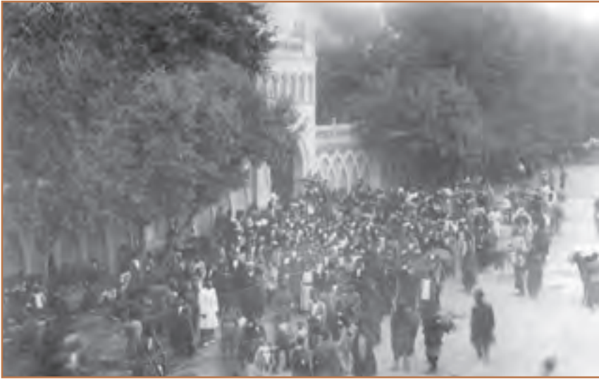
تجمع عده‌ای از مشروطه خواهان در مقابل سفارت انگلستان