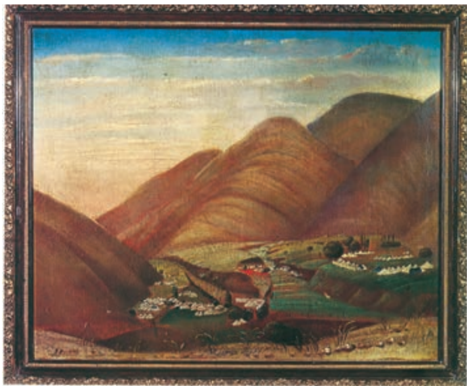
تابلوی رنگ روغن، اردوگاه، مبارک آباد تهران اثر محمد غفاری (کمال الملک)، سال ۱۲۹۱ ق.

داشت و به همین دلیل شاعران بزرگی در دورهٔ پادشاهی وی به شعر فارسی غنا بخشیدند. قائم مقام فراهانی وزیر محمدشاه نیز ادیب و نویسنده‌ای زبردست بود. تاریخ‌نویسی نیز در این دوره رونق داشت و مورّخان مشهوری مانند محمدتقی خان لسان‌الملک سپهر، رضا قلی خان هدایت و محمد حسن خان اعتمادالسلطنه آثار ارزشمندی به وجود آوردند. هنر نقاشی و معماری نیز با تأثیرپذیری از دوره‌های قبل و هنر اروپایی به حیات خود ادامه داد. میرزا محمد خان غفاری، ملقب به کمال الملک نقاش مشهور عصر ناصرالدین شاه و مظفرالدین شاه، هنر نقاشی ایران را به اوج کمال و شکوفایی رساند.