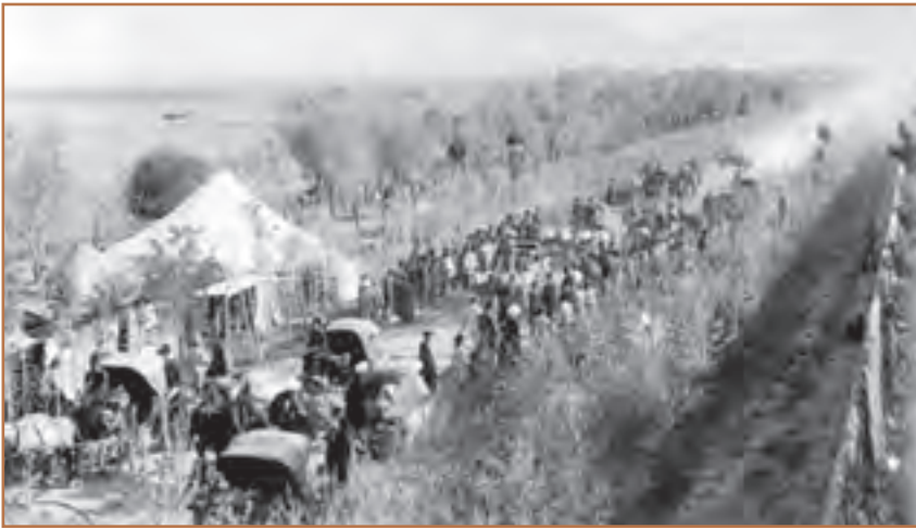
عده‌ای از مردم در انتظار بازگشت مهاجران از مهاجرت کبرا

او در اولین قدم، صدراعظم مستبد (عین‌الدوله) را از کار برکنار کرد، سپس در ۱۴ مرداد ۱۲۸۵ فرمانی صادر کرد که به فرمان مشروطیت مشهور است. پس از صدور این فرمان، ایران در شمار کشورهای مشروطه درآمد و کمی بعد، مجلس شورای ملی تشکیل و قانون اساسی تدوین شد.