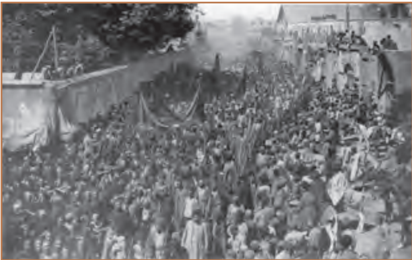
عزاداری مردم تهران در روز عاشورا در دوره قاجار