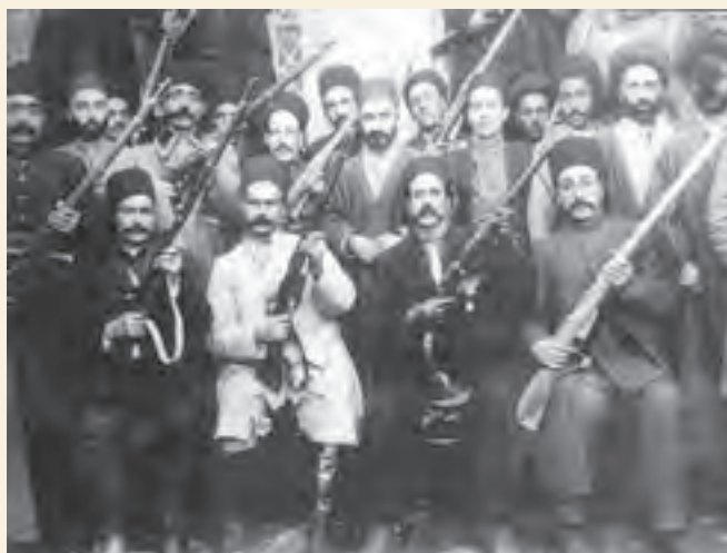
ستارخان و باقرخان به همراه جمعی از مجاهدان تبریز

با رسیدن اخبار مقاومت ستارخان و یارانش (که یکی از معروف‌ترین آنها باقرخان بود) به تهران، محمدعلی‌شاه سپاهی را به فرماندهی عین‌الدوله برای سرکوب آنها به تبریز فرستاد اما این سپاه نیز نتوانست کاری از پیش ببرد. با وجود این که قحطی در شهر تبریز بیداد می‌کرد، مبارزان توانستند نیروهای دولتی را وادار به عقب‌نشینی کنند.