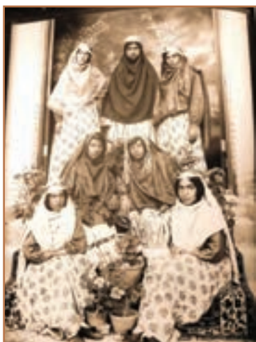
پوشش زنان عصر قاجاری

عبایی نیز بر روی این جلیقه پوشیده می‌شد که تا قوزک پا می‌رسید. کفش مردان عادی نوعی نعلین بود که از چرم ساخته می‌شد، ولی در باریان در زمستان از کفش ساخته شده از چرم اسب استفاده می‌کردند. پیراهن خانم‌ها نیز از کتان و یا ابریشم بود که با بندهای متعدد و یادکمه‌های زرین بسته می‌شد. در بیرون از خانه از چادر استفاده می‌شد و صورت نیز با روبندی که به پیشانی‌گره می‌خورد، پنهان می‌شد. البته این سبک حجاب مخصوص زنان شهری بود و زنان روستایی و عشایری و اقلیت‌های دینی بدون چادر و روبند رفت و آمد می‌کردند.