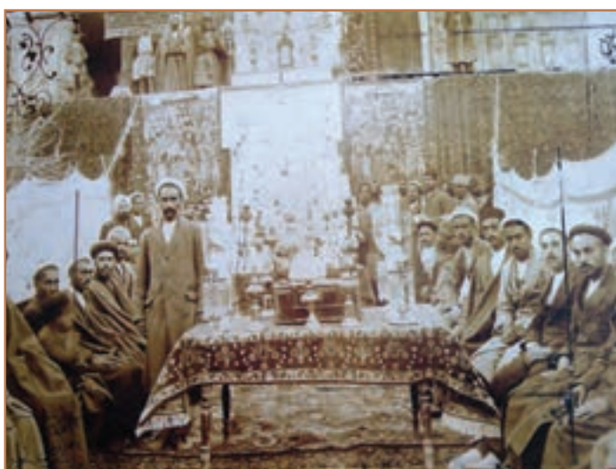
جشن نیمه شعبان مردم کرمان در دوره قاجار

۳- جلوه‌های شادی و غم: ایرانیان همواره به سنت‌های ملی و مذهبی خویش وفادار بوده‌اند. آنان علاوه بر گرامیداشت جشن نوروز و دیگر سنت‌های باستانی مانند شب یلدا که ریشه در گذشته باشکوهشان داشت، اعیاد مذهبی مانند عید فطر و عید قربان را نیز جشن می‌گرفتند. مجالس و مراسم عزا