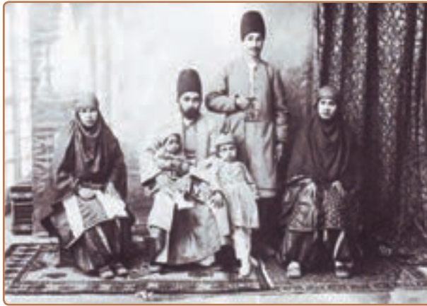
خانواده‌ای زرتشتی در دوره قاجار

در رأس نهاد روحانیت، مجتهدان قرار داشتند که قدرت معنوی و نفوذ اجتماعی آنان حتی از پادشاهان قاجار نیز برتر بود. آنان در مقابل ظلم و ستم مأموران حکومتی از مردم دفاع می‌کردند و منزلشان پناهگاه افراد مظلوم و بی‌پناه بود. از مجتهدان معروف این دوره می‌توان میرزا ابوالقاسم قمی، میرزا محمد علی بهبهانی و میرزا حسن آشتیانی را نام برد.