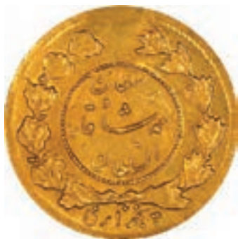
سکه عصر محمد شاه قاجار

در ابتدای عصر قاجار پول رایج در ایران سکه‌هایی از جنس طلا، نقره، مس و نیکل بود که بر پشت و روی آن تصویر و نام و القاب شاه وقت، حک می‌شد. امتیاز ضرب سکه طلا در اختیار شاه بود، اما سکه‌های نقره و مسی در شهرهایی مانند شیراز، اصفهان، تبریز و مشهد هم ضرب می‌گردید و هر کدام ارزش و اعتبار خاصی داشت. با این حال ارزش پول در طول