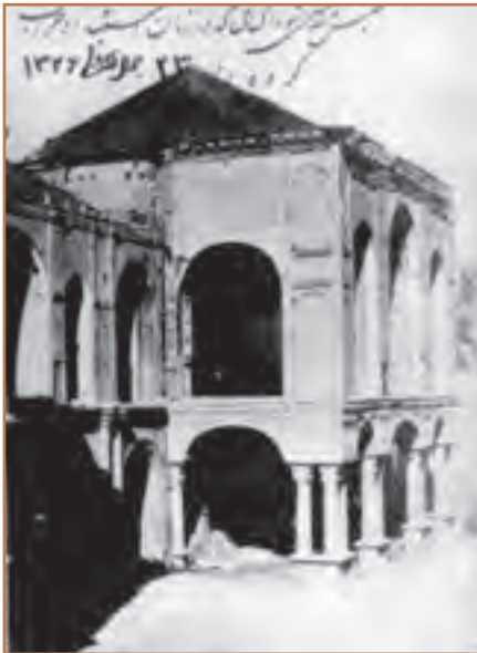
صحنه ای از ساختمان مجلس شورای ملی بعد از به توپ بسته شدن

در شرایطی که اختلاف محمدعلی شاه و مشروطه خواهان شدت گرفته بود، در یکی از خیابان های تهران نارنجکی به سمت کالسکه حامل شاه پرتاب شد. محمدعلی شاه این اقدام را به مشروطه خواهان منتسب کرد و آن را بهانه ای برای سرکوب مشروطه خواهان قرار داد. سرانجام، یعنی دو سال پس از استقرار مشروطیت ۱ ، محمدعلی شاه با همکاری مشاوران روسی خود برنامه ای بین بردن مجلسی را که مظهر مشروطیت بود، به اجرا درآورد. طرفداران مشروطیت برای مقابله با سربازان شاه و دفاع از مجلس آماده شدند اما چون اسلحه و سازماندهی لازم را نداشتند، با وجود مقاومت های