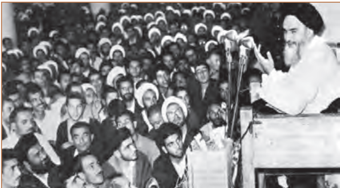
امام خمینی (ره) در حال سخنرانی در مدرسه فیضیه قم

امام خمینی نیز علی‌رغم محدودیت‌های عمال پهلوی برای ایشان، در عصر روز عاشورا در قم به منبر رفت و در نطق تاریخی خود مستقیماً شاه را مورد خطاب قرار داد و با شجاعت تمام به افشاگری علیه خاندان پهلوی و سیطره آمریکا و اسرائیل بر ایران پرداخت. این سخنان عاشورایی چنان محمدرضا شاه و عمالش را خشمگین کرد که دستور دستگیری امام و انتقال ایشان را به تهران صادر کرد.