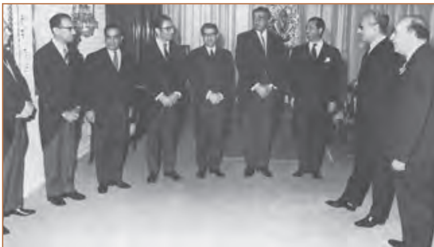
امیرعباس هویدا در حال معرفی اعضای کابینه به شاه

ب) مبارزه فرهنگی: مبارزه فرهنگی با اتکا بر آگاهی دادن به مردم و تبلیغ و ترویج باورهای دینی به همراه روشنگری علیه اقدامات رژیم پهلوی، صورت می گرفت. امام خمینی به عنوان مرجع دینی و رهبر مبارزات اسلامی، الگوی عینی همه مبارزانی بودند که برای سرنگونی حکومت مبارزه می کردند. روحانیون، معلمان، استادان دانشگاه، دانشجویان و دانش آموزان در عرصه مبارزه فرهنگی با رژیم مشارکت فعال داشتند. اینان در مراکزی مانند مساجد، حسینیه ها و مدارس و دانشگاه ها به تبلیغ و ترویج فرهنگ دینی می پرداختند.