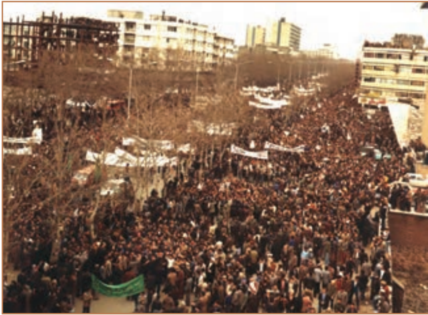
راهپیمایی میلیونی مردم تهران در تاسوعای ۱۳۵۷