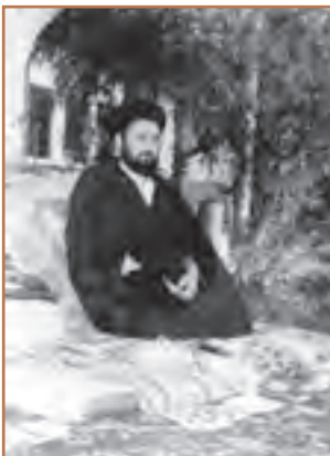
حاج آقا مصطفی خمینی

در خرداد ۱۳۵۶ دکتر علی شریعتی به طور ناگهانی و غیرمنتظره در لندن درگذشت. مرگ او بر اوضاع ایران در سال ۱۳۵۶ تأثیر گذاشت. دکتر شریعتی با انجام سخنرانی و نگارش کتاب‌های متعدد، نقش فراوانی در طرد افکار مارکسیستی و بیداری نسل جوان و گرایش آنان به سوی اسلام و ارزش‌های اسلامی داشت. مردم مرگ او را به عمل ساواک نسبت دادند و با گرامیداشت نام و یاد او، تنفر بیشتری به رژیم پهلوی پیدا کردند.