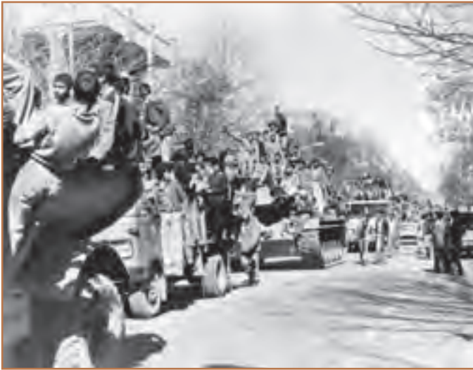
شادی مردم در روز پیروزی انقلاب

با حمله گارد شاهنشاهی به افراد نیروی هوایی که به انقلاب پیوسته بودند، تهران به یک شهر نظامی مبدل شد. رژیم پهلوی قصد داشت با برقراری حکومت نظامی در بعد از ظهر ۲۱ بهمن و شب ۲۲ بهمن به کمک نظامیان وابسته به خود و نظارت ژنرال هایزر آمریکایی با انجام یک کودتای نظامی رهبر انقلاب و اعضای شورای انقلاب را دستگیر و انقلاب را سرکوب کند. اما امام با توکل به الطاف خداوند بزرگ، حکومت نظامی را غیرقانونی اعلام کرد و مردم با کمک ارتشینی که به انقلاب پیوسته بودند، مراکز نظامی را در تهران و شهرهای بزرگ به تصرف خود درآوردند. رادیو و تلویزیون نیز در اختیار مردم انقلابی قرار گرفت و با اعلام صدای انقلاب و پیروزی انقلاب اسلامی در ۲۲ بهمن، زنگ سقوط نظام شاهنشاهی به صدا درآمد و مرحله جدیدی را در تاریخ این سرزمین و همه مستضعفان و مسلمانان جهان رقم زد.