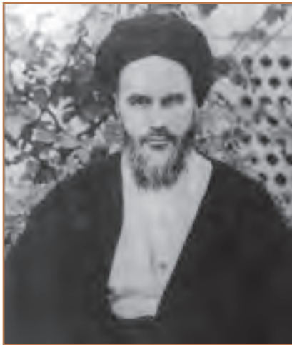
امام خمینی رهبر نهضت اسلامی ایران

۱- مخالفت با تصویب‌نامه انجمن‌های ایالتی و ولایتی: اولین فعالیت سیاسی