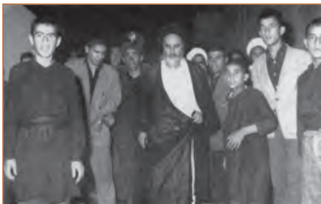
شرکت امام خمینی در هیئت‌های عزاداری قم (محرم ۱۳۸۳ ق. / ۱۳۴۲ ش.).

در آستانه ماه محرم ۱۳۴۲/۱۳۸۳ ش. امام خمینی (ره) در رهنمودهای خود به سخنرانان مذهبی سفارش کردند که خطر اسرائیل را به مردم تذکر دهید و در مراسم نوحه‌خوانی و سینه‌زنی از مصیبت‌های وارد شده به اسلام و مراکز دینی یاد کنید.