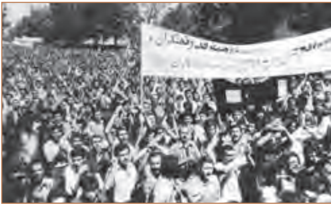
تظاهرات مردم تهران در شهریور ۱۳۵۷

حکومت پهلوی برای جلوگیری از ادامهٔ تظاهرات و اعتراض، در روز جمعه ۱۷ شهریور ۱۳۵۷ در تهران و یازده شهر دیگر حکومت نظامی برقرار کرد. اما مردم تهران بی‌اعتنا به اخطارها و هشدارهای رژیم در میدان شهدا (ژاله سابق) تجمع کردند و شعار الله اکبر - خمینی رهبر - مرگ بر شاه سر دادند. دژخیمان پهلوی نیز مردان و زنان مسلمان را از زمین و هوا به رگبار گلوله بستند و جمع زیادی از آنان را به شهادت رسانیدند.