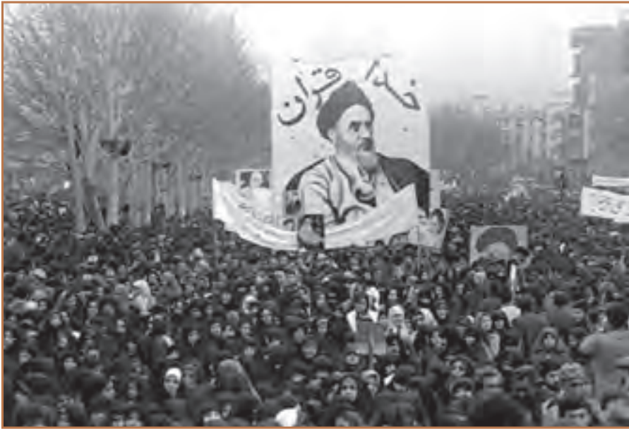
حضور گسترده زنان ایرانی در تظاهرات

لیکن امام خمینی با ارسال پیام و افشای نیرنگ تازه رژیم پهلوی، خواهان ادامه مبارزه تا سرنگونی نظام پادشاهی در ایران شد. به همین جهت تظاهرات مردمی در شهرهای ایران ادامه پیدا کرد؛ اوج این راهپیمایی‌ها در تهران بعد از برگزاری نماز عید فطر (۱۳ شهریور) و تکرار آن در سه روز بعد با حضور گسترده و یکپارچه زنان مسلمان بود.