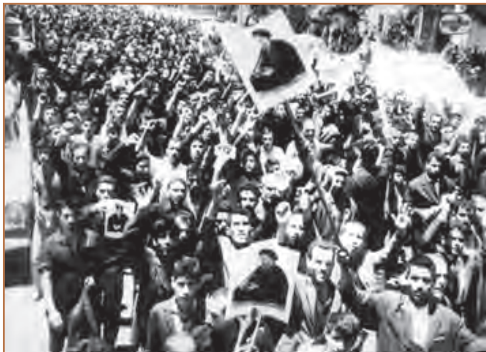
قیام مردم تهران در ۱۵ خرداد ۱۳۴۲

در تهران نیز مردم با شنیدن خبر دستگیری امام، آماده قیام و حرکت شدند و اقشار مختلف اجتماعی با فریاد «یا مرگ یا خمینی» و «مرگ بر شاه» اعتراض خود را نسبت به این موضوع ابراز داشتند. در اثر هجوم نیروهای نظامی و امنیتی رژیم به تظاهرکنندگان تعدادی از مردم انقلابی تهران به خاک و خون کشیده شدند. مردم مسلمان و رامن نیز با شنیدن خبر دستگیری امام کفن پوشیدند و به سوی تهران حرکت کردند اما با یورش مأموران حکومتی تعدادی از آنها شهید و مجروح شدند. در دیگر شهرها از جمله شیراز، اصفهان و مشهد نیز تظاهراتی در اعتراض به دستگیری امام برپا شد. در نتیجه قیام پانزده خرداد، علاوه بر آنکه جمع زیادی شهید و مجروح شدند، تعداد زیادی از مبارزان دستگیر و به اعدام، زندان و یا تبعید محکوم گردیدند.