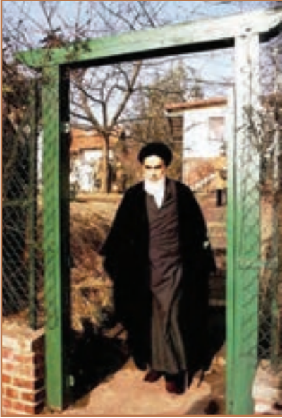
حضرت امام خمینی در نوفل‌لوشاتو

امام خمینی تحت فشار سیاسی و امنیتی سازمان امنیت عراق و ساواک، قصد عزیمت به کویت را داشت، اما دولت کویت حاضر به پذیرش ایشان نشد و امام به فرانسه رفت و در دهکده‌ای در حومه پاریس به نام نوفل لوشاتو ساکن شد (آبان ۱۳۵۷).