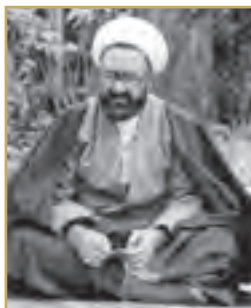
استاد شهید مرتضی مطهری