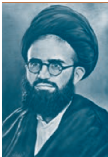
شهید آیت‌الله سعیدی

اقدامات سرکوبگرانه ساواک تنها محدود به گروه‌ها و افرادی که مبارزه مسلحانه می‌کردند، نبود. بلکه بسیاری از مبارزان دیگر نیز حبس و شکنجه شدند و تعدادی از آنها مانند آیت‌الله سعیدی و آیت‌الله غفاری در زندان و تحت شکنجه به شهادت رسیدند و بسیاری نیز تا پیروزی انقلاب اسلامی در زندان بودند.