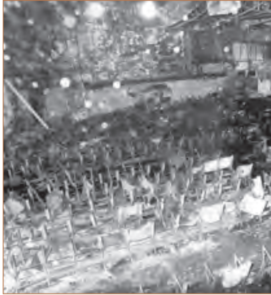
آثار بازمانده از جنایت سینما رکس