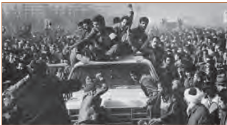
استقبال باشکوه از امام خمینی به هنگام ورود به میهن اسلامی

«من دولت تعیین می‌کنم من به پشتیبانی این ملت دولت تعیین می‌کنم من تو دهان این دولت می‌زنم.» سپس در ۱۵ بهمن ۱۳۵۷ به پیشنهاد شورای انقلاب، آقای مهندس مهدی بازرگان را به عنوان اولین نخست‌وزیر دولت موقت انقلاب معرفی کرد و از همه تقاضا کرد تا از وی حمایت کنند. مردم نیز با برپایی راهپیمایی، اقدام رهبر خویش را با جان و دل پذیرفتند ۱ .