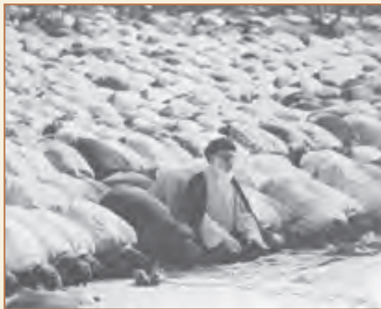
نخستین نماز جمعه تهران پس از پیروزی انقلاب اسلامی

آیت‌الله طالقانی در سال ۱۲۸۹ ش. در روستای گنیرد طالقان متولد شد. ابتدا او را به مکتب‌خانه روستا فرستادند. در سال ۱۲۹۸ ش. همراه پدر به تهران رفت. دو سال بعد برای ادامه تحصیل به قم رفت. در ۱۳۱۰ ش. به نجف اشرف رفت و پس از کسب علوم دینی از علمای بزرگ نجف از سوی آیت‌الله اصفهانی به عنوان مجتهد علوم دینی معرفی شد. سپس به ایران بازگشت. در قم از آیت‌الله شیخ عبدالکریم حائری درجه اجتهاد گرفت. در سال ۱۳۱۸ ش. به دلیل مبارزه علیه حکومت رضاشاه دستگیر شد و مدتی را در زندان گذراند. در ۱۳۲۷ ش. فعالیت‌های خود را در مسجد هدایت تهران آغاز کرد. خیلی زود مسجد هدایت کانون توجه جوانان مسلمان و مبارزان شد. در ۱۳۳۴ ش. به نهضت مقاومت ملی که از سوی جمعی از استادان دانشگاه برای مبارزه با رژیم پهلوی به وجود آمده بود، پیوست. در سال‌های پس از کودتا که فدائیان اسلام به شدت مورد تعقیب مأموران رژیم بودند، آیت‌الله طالقانی با وجود خطرات این کار به نواب صفوی و یارانش پناه داد و آنان را پنهان کرد تا به دست مأموران رژیم نیفتند. در ۱۳۳۸ ش. از طرف آیت‌الله بروجردی مرجع شیعین، برای شرکت در کنگره اسلامی عازم مصر شد. در آنجا با شیخ شلتوت رئیس دانشگاه الازهر و جمال عبدالناصر، رئیس جمهور مصر، ملاقات کرد. در بازگشت به منظور تبادل نظر و