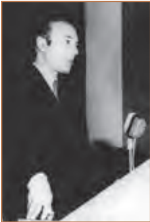
دکتر علی شریعتی

در خرداد ۱۳۵۶ دکتر علی شریعتی به طور ناگهانی و غیرمنتظره در لندن درگذشت. مرگ او بر اوضاع ایران در سال ۱۳۵۶ تأثیر گذاشت. دکتر شریعتی با انجام سخنرانی و نگارش کتاب‌های متعدد، نقش فراوانی در طرد افکار مارکسیستی و بیداری نسل جوان و گرایش آنان به سوی اسلام و ارزش‌های اسلامی داشت. مردم مرگ او را به عمل ساواک نسبت دادند و با گرامیداشت نام و یاد او، تنفر بیشتری به رژیم پهلوی پیدا کردند.