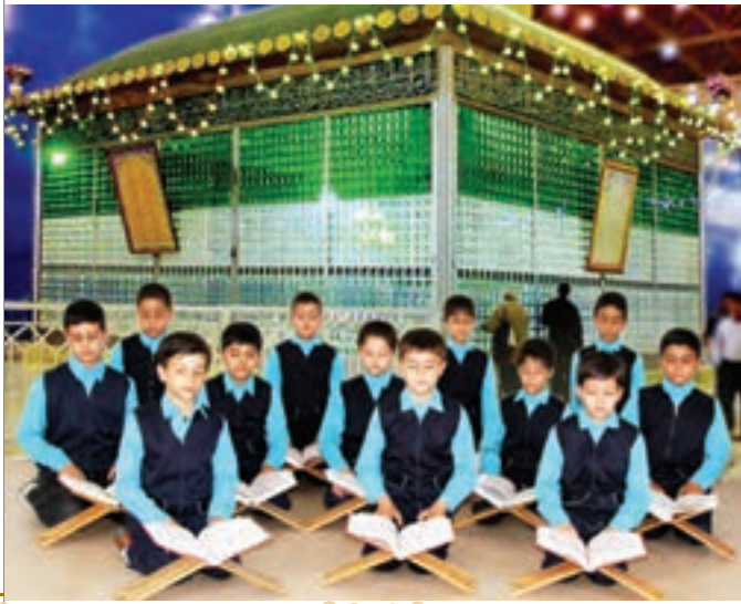
انس با قرآن کریم (استان تهران، شهرری، حرم امام خمینی)

از نمازخانه یا دفتر مدرسه به تعداد کافی، قرآن به کلاس بیاورید؛ هر میز حداقل یک قرآن داشته باشد. با راهنمایی آموزگار به صورت تصادفی قرآن را باز کنید. سپس دانش‌آموزان هر میز، آیات آن دو صفحه را برای یکدیگر می‌خوانند. آن گاه هر دانش‌آموز حدود یک سطر را با صدای بلند می‌خواند.