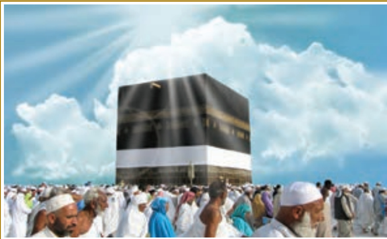
حج، نماد برادری و وحدت مسلمانان جهان