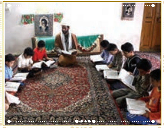
انس با قرآن کریم در استان فارس، شهرستان داراب

با راهنمایی آموزگار خود پس از آوردن قرآن کریم از دفتر مدرسه، آن را به صورت تصادفی باز کنید و از روی آن بخوانید.