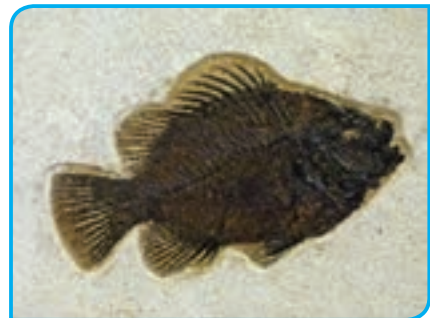
الف) فسیل ماهی