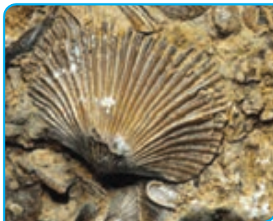
ب) فسیل صدف