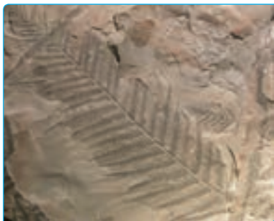
پ) فسیل گیاه

دانشمندان معتقدند وقتی جانداران می‌میرند، قسمت‌های نرم بدن آن‌ها با گذشت زمان از بین می‌روند اما، قسمت‌های سخت، مانند استخوان، دندان و صدف، در بین گل و لای باقی می‌مانند. به آثار و بقایای به جا مانده از گیاهان و جانوران پس از گذشت سال‌ها فسیل می‌گویند. در شکل زیر تصویر چند فسیل نشان داده شده است.