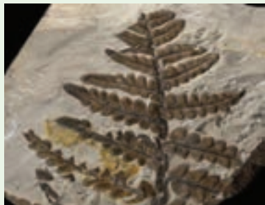
فسیل گیاه سرخس