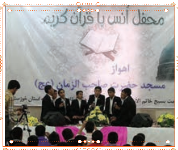
انس با قرآن کریم در استان خوزستان

با راهنمایی آموزگار خود پس از آوردن قرآن کریم از دفتر مدرسه، آن را به صورت تصادفی باز کنید و از روی آن بخوانید.