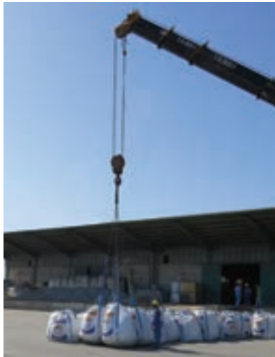
پ) جابه جایی اجسام سنگین