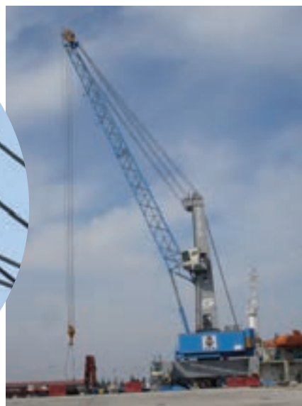
ث) بالا بردن اجسام سنگین