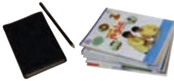
چند کتاب دفترچه یادداشت