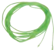
مقداری نخ کلفت