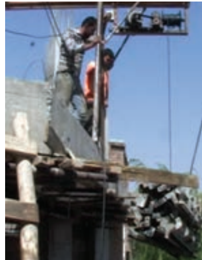
ب) بالا بردن مصالح ساختمانی