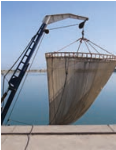
ت) بالا کشیدن تور ماهیگیری