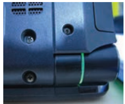
انواع پیچ و کاربردهای آن