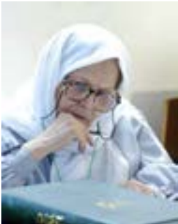
طاهره صفارزاده (مترجم قرآن به زبان فارسی و انگلیسی)