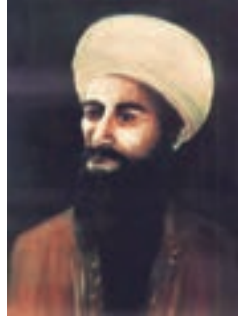
جابرین حیّان (پدر علم شیمی)