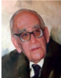
پرفسور سید محمود حسایی (پدر علم فیزیک ایران)