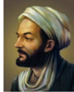
ابوعلی سینا (فیلسوف و پزشک بزرگ مشرق زمین)