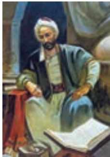
خواجه نصیرالدین طوسی (ریاضی دان، منجم، اندیشمند و سیاستمدار برجسته)