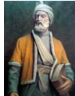
حکیم ابوالقاسم فردوسی (شاعر نامدار)

فعالیت: این پیام قرآنی را در قرآن کریم پیدا کنید و آن را یک بار دیگر بخوانید.