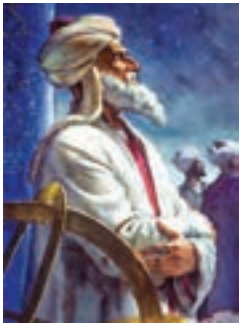
ابوریحان بیرونی (ریاضی دان و منجم)

به کمک تصویر با دوستان خود درباره ی این پیام قرآنی گفت و گو کنید.