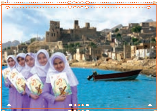
انس با قرآن کریم در استان بوشهر

با راهنمایی آموزگار خود پس از آوردن قرآن کریم از دفتر مدرسه، آن را به صورت تصادفی باز کنید و از روی آن بخوانید.