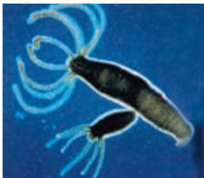
شکل ۴-۷- تولیدمثل غیرجنسی هیدر

تولیدمثل جنسی: در این نوع تولیدمثل برخلاف تولیدمثل غیرجنسی، دو والد شرکت دارند که هرکدام سلول‌های جنسی هاپلوئید تولید می‌کنند. سلول‌های جنسی با یکدیگر ادغام می‌شوند و فرزند را به وجود می‌آورند. از آنجا که هر دو والد ماده ژنتیک خود را به اشتراک می‌گذارند، فرزندان از هر دو والد صفت‌هایی دریافت خواهند داشت، بنابراین هیچ فرزندی دقیقاً مشابه یکی از دو والد نیست. تولیدمثل جنسی، از طریق تشکیل سلول‌های هاپلوئید، در یوکاریوت‌ها دیده می‌شود.